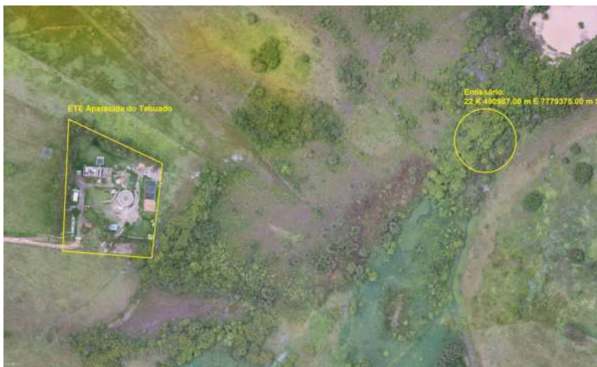
Figura 3: Vista aérea da ETE Aparecida do Taboado e entorno, Aparecida do Taboado, MS.

A ETE Aparecida do Taboado, de acordo com o Sistema Interativo de Suporte ao Licenciamento Ambiental (SISLA) de MS, não se sobrepõe a nenhuma Unidade de Conservação ou Zonas de Amortecimento, nem a Terras Indígenas, Áreas de Perambulação, Quilombolas e Assentamentos Rurais (Figura 4).