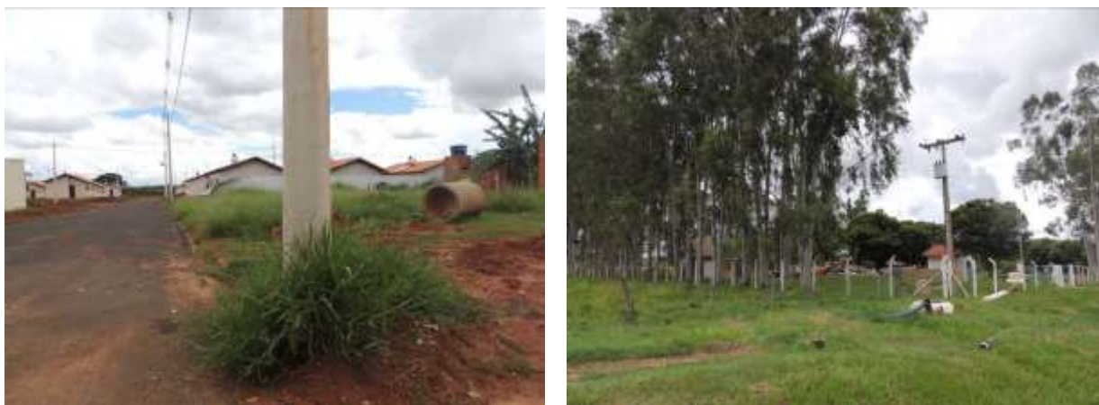
Figura 8: Área prevista para implantação da EEEB 003 Projetada, Aparecida do Taboado, MS.

A EEEB 003 Projetada será implantada na zona urbana de Aparecida do Taboado, na Rua Coxim com a Rua Amauri Ramos Firquim, coordenadas geográficas UTM (22 K) 488.188 E / 7.777.497 S (Figura 9).