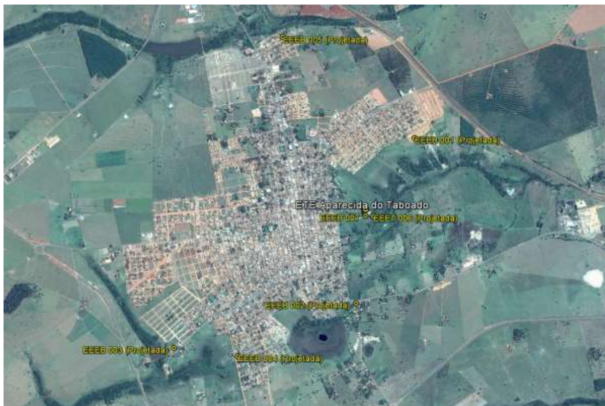
Figura 1: Localização das Unidades Operacionais existentes e projetadas na cidade de Aparecida do Taboado, MS.

A cidade de Aparecida do Taboado possui uma Estação de Tratamento de Esgotos (ETE) e uma Estação Elevatória de Esgoto Bruto (EEEB), ambas em operação. Possui, ainda, áreas selecionadas para a implantação de cinco Estações Elevatórias de Esgoto Bruto (EEEB) projetadas (Figura 1).