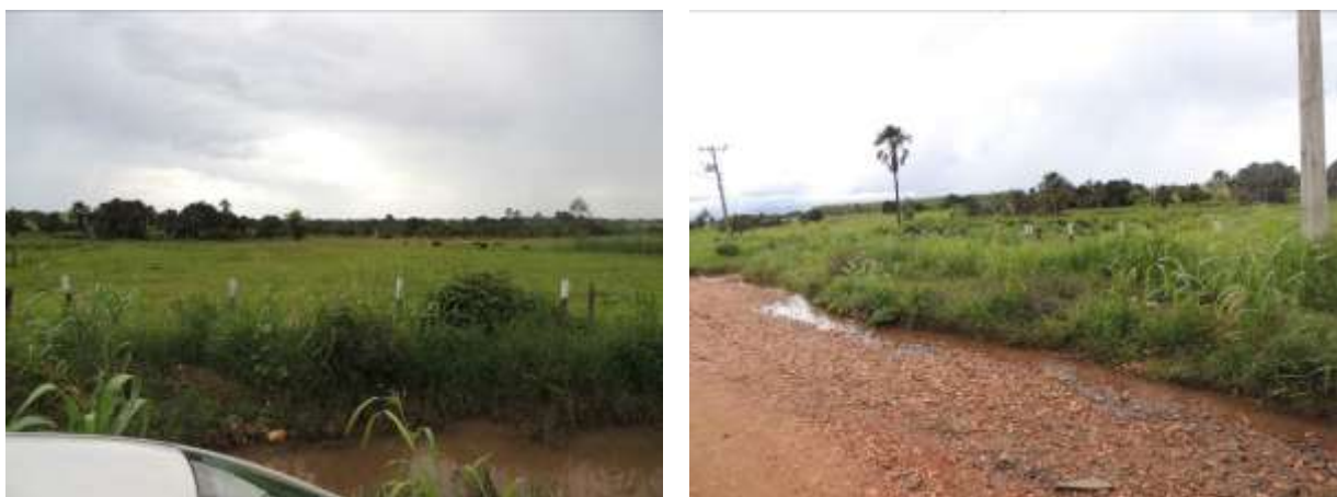
Figura 6: Área prevista para implantação da EEEB 001 Projetada, Aparecida do Taboado, MS.

A EEEB 001 Projetada será implantada na zona urbana de Aparecida do Taboado, na Alameda Orquídea, coordenadas geográficas UTM (22 K) 491.224 E / 7.780.170 S (Figura 7).