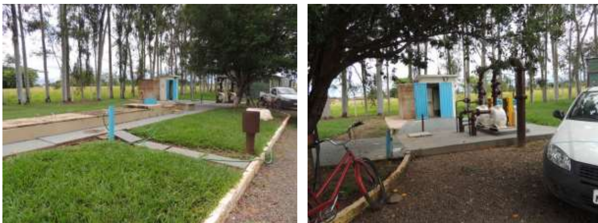
Figura 5: Vista geral da EEEB 007, Aparecida do Taboado, MS.

A EEEB 007, com função de recalque final para alimentação da ETE, localiza-se na zona urbana de Aparecida do Taboado, na Avenida João Pedro Pedrossian com Rua Sete de Setembro, dentro da área da ETE Aparecida do Taboado, coordenadas geográficas UTM (22 K) 490.600 E / 7.779.190 S. Encontra-se totalmente cercada com telas e portão com trancas para pedestres, com vegetação esparsa em seu interior e com cortina arbórea em parte do entorno (Figura 6).