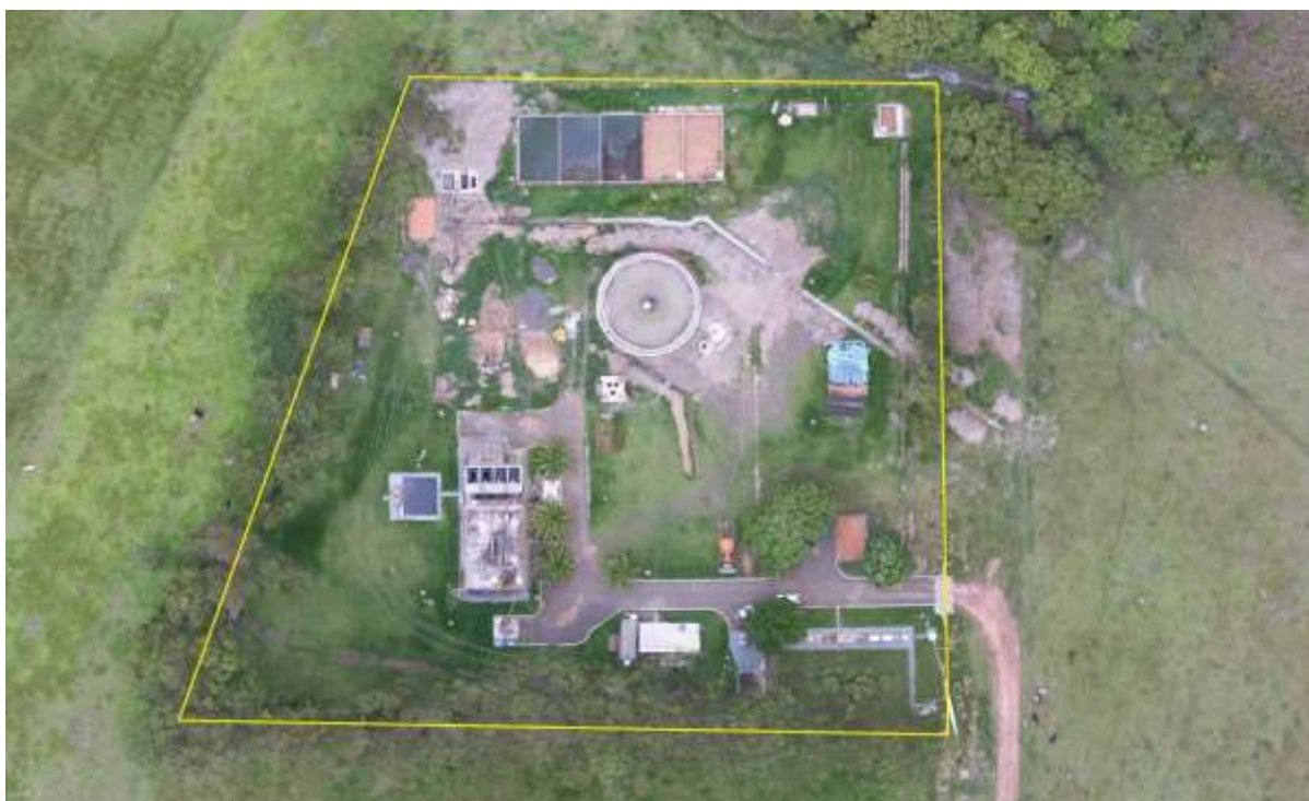
Figura 2: Vista aérea da ETE Aparecida do Taboado, Aparecida do Taboado, MS.