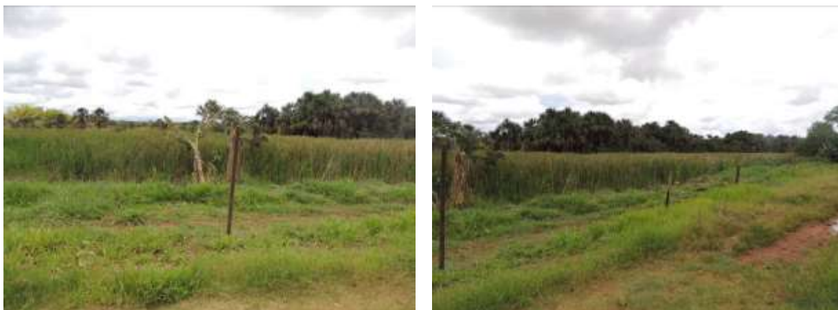
Figura 7: Área prevista para implantação da EEEB 002 Projetada, Aparecida do Taboado, MS.

A EEEB 002 Projetada será implantada na zona urbana de Aparecida do Taboado, na Avenida João Pedro Pedrossian, coordenadas geográficas UTM (22 K) 490.400 E / 7.778.164 S (Figura 8).