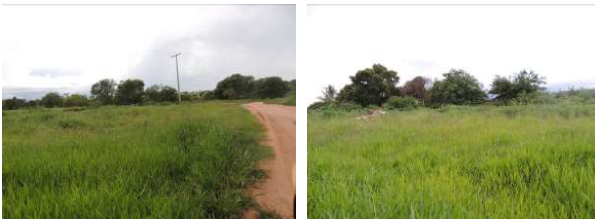
Figura 9: Área prevista para implantação da EEEB 004 Projetada, Aparecida do Taboado, MS.

A EEEB 004 Projetada, de acordo com o Sistema Interativo de Suporte ao Licenciamento Ambiental (SISLA) de MS, não se sobrepõe a nenhuma Unidade de Conservação ou Zonas de Amortecimento, nem a Terras Indígenas, Áreas de Perambulação, Quilombolas e Assentamentos Rurais.