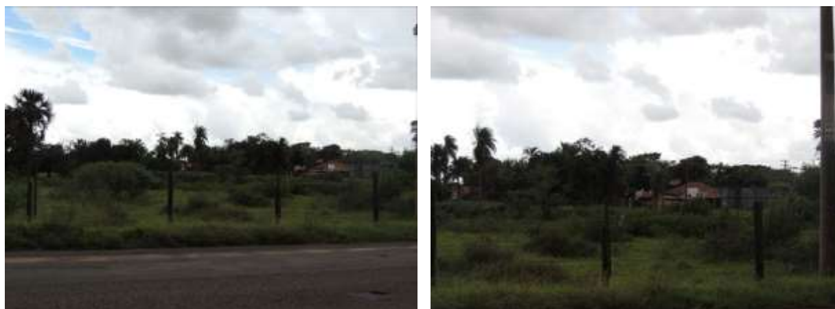
Figura 10: Área prevista para implantação da EEEB 005 Projetada, Aparecida do Taboado, MS.

A EEEB 005 Projetada, de acordo com o Sistema Interativo de Suporte ao Licenciamento Ambiental (SISLA) de MS, não se sobrepõe a nenhuma Unidade de Conservação ou Zonas de Amortecimento, nem a Terras Indígenas, Áreas de Perambulação, Quilombolas e Assentamentos Rurais.