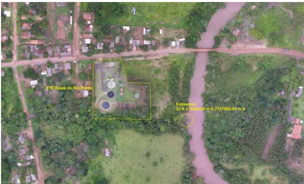
Figura 3: Vista aérea da ETE Ribas do Rio Pardo e entorno, Ribas do Rio Pardo, MS.

A ETE Ribas do Rio Pardo, de acordo com o Sistema Interativo de Suporte ao Licenciamento Ambiental (SISLA) de MS, não se sobrepõe a nenhuma Unidade de Conservação ou Zonas de Amortecimento, nem a Terras Indígenas, Áreas de Perambulação, Quilombolas e Assentamentos Rurais (Figura 4).