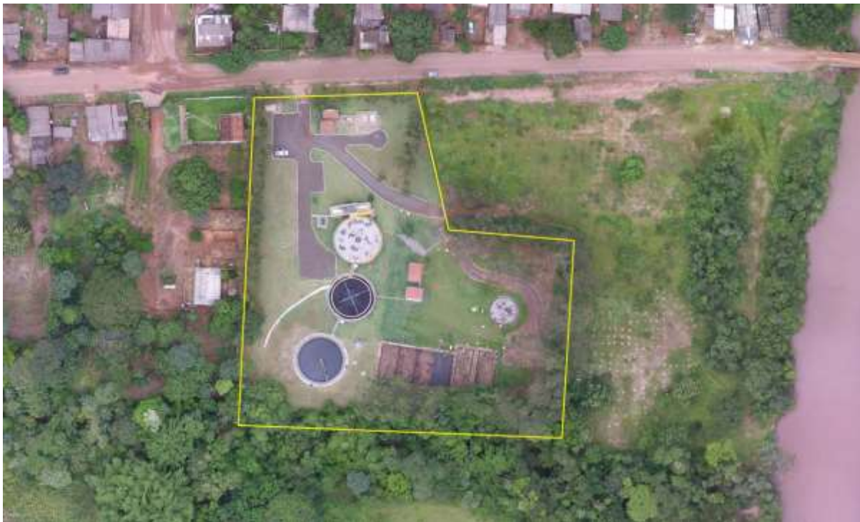
Figura 2: Vista aérea da ETE Ribas do Rio Pardo, Ribas do Rio Pardo, MS.