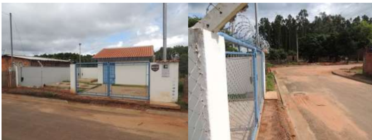
Figura 5: Vista geral da EEEB Santo André, Ribas do Rio Pardo, MS.

A EEEB Santo André, de acordo com o Sistema Interativo de Suporte ao Licenciamento Ambiental (SISLA) de MS, não se sobrepõe a nenhuma Unidade de Conservação ou suas Zonas de Amortecimento, nem a Terras Indígenas, Áreas de Perambulação, Quilombolas e Assentamentos Rurais.