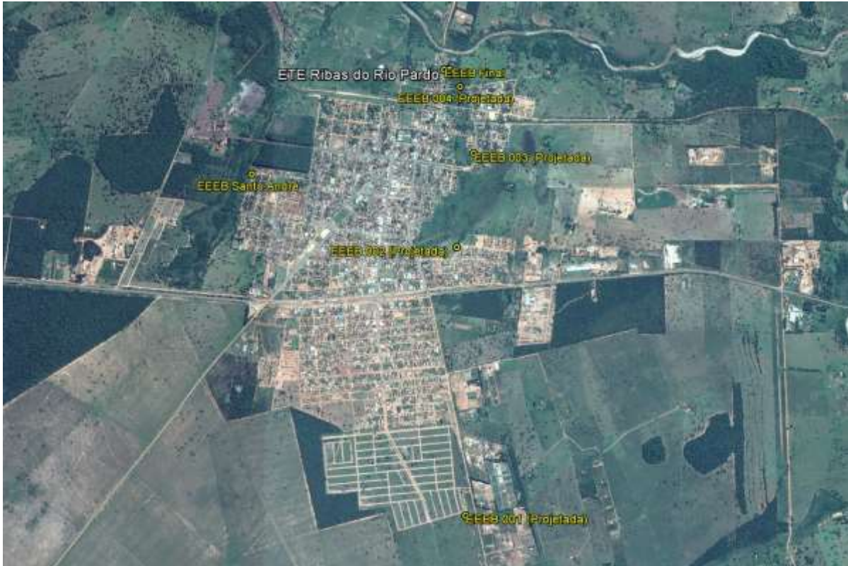
Figura 1: Localização das Unidades Operacionais existentes e projetadas na cidade de Ribas do Rio Pardo, MS.

A cidade de Ribas do Rio Pardo possui uma Estação de Tratamento de Esgotos (ETE) e duas Estações Elevatórias de Esgoto Bruto (EEEB) em operação. Possui, ainda, possui áreas selecionadas para implantação de quatro Estações Elevatórias de Esgoto Bruto projetadas (Figura 1).