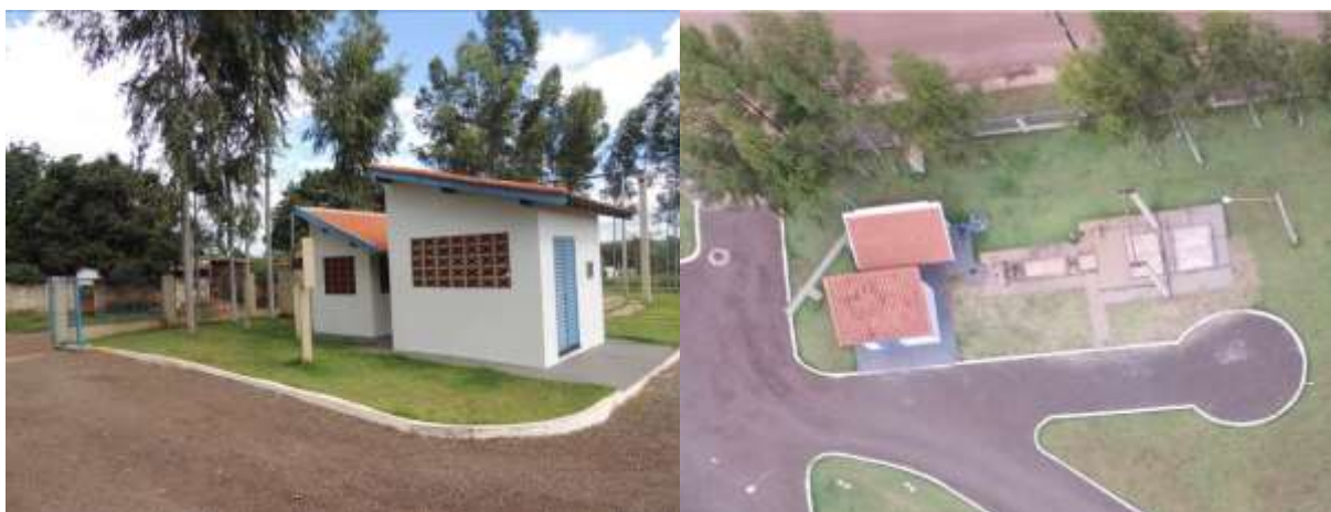
Figura 6: Vista geral da EEEB Final, Ribas do Rio Pardo, MS.

A EEEB Final está localizada na zona urbana de Ribas do Rio Pardo, próximo ao encontro da Rua Waldemar Francisco da Silva com a Rua João dos Santos, coordenadas geográficas UTM (22 K) 212.541 E / 7.737.540 S, completamente cercada por muro e portão com trancas para veículos, tendo como função recalcar o esgoto afluente para o tratamento preliminar da ETE (Figura 6). Não possui informação sobre extravasor.