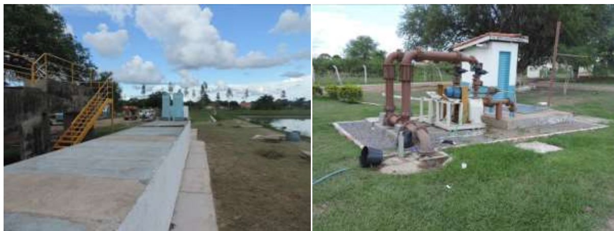
Figura 6: Vista geral da EEEB 001, Porto Murtinho, MS.

A EEEB 001 localiza-se na zona urbana de Porto Murtinho na Rua Cel. Alfredo Pinto, Bairro Jockey Club, dentro do pátio da ETE, coordenadas geográficas UTM (21 K) 409.265 E / 7.599.110 S, com função de recalcar todo o esgoto bruto coletado para a ETE Porto Murtinho. Encontra-se totalmente cercada, porém na porção oeste a cerca está caída (Figura 6). Não possui informação sobre extravasor.