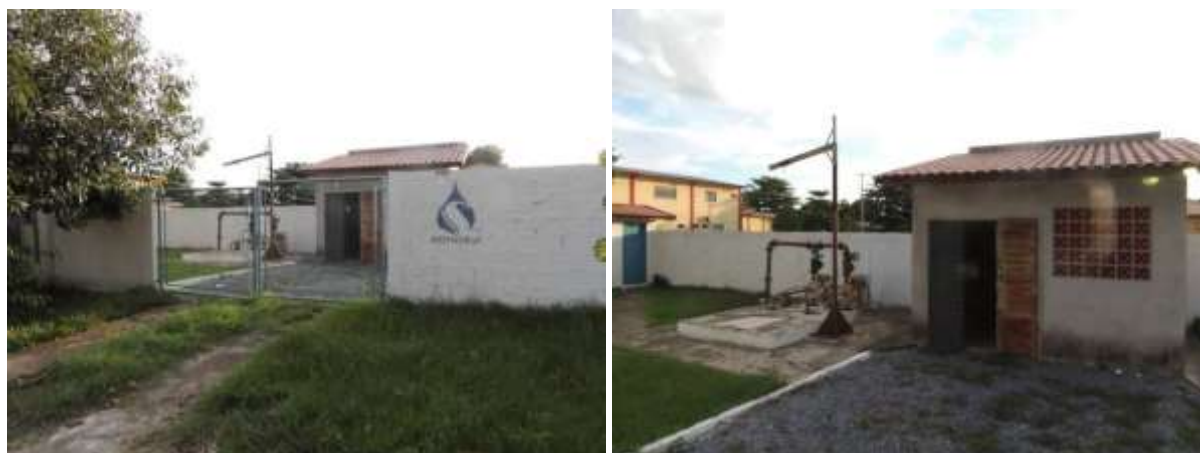
Figura 7: Vista geral da EEEB 002, Porto Murtinho, MS.

A EEEB 002 localiza-se na Rua João Pessoa esquina com Rua 13 de Maio, coordenadas geográficas UTM (21 K) 408.440 E / 7.600.146 S, com a função de bombear o esgoto bruto da região central para a EEEB 001. Encontra-se completamente cercada por muros, cercas e portão com trancas (Figura 7). Não possui informação sobre extravasor.