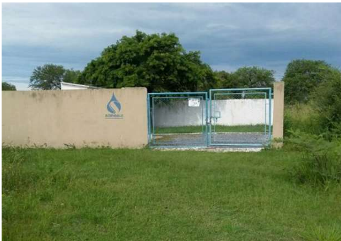
Figura 12: Vista geral da EEEB 007, Porto Murtinho, MS.

A EEEB 007 localiza-se no final da Rua Camalote, Bairro Novo Habitar, coordenadas geográficas UTM (21 K) 409.680 E / 7.599.787 S, com a função de bombear o esgoto bruto coletado no bairro Novo Habitar para a EEEB 001. Encontra-se completamente cercada por muros e grades com portão e trancas (Figura 12). Não possui informação sobre extravasor.