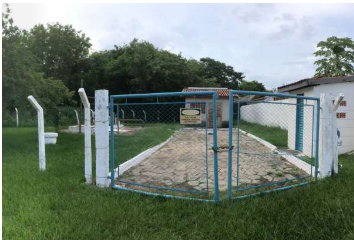
Figura 10: Vista geral da EEEB 005, Porto Murtinho, MS.

A EEEB 005 localiza-se na Rua Capitão Cantalice, Bairro Fundão, nas coordenadas geográficas UTM (21 K) 408.125 E / 7.599.452 S, com a função de bombear o esgoto bruto coletado no Bairro Fundão para a EEEB 001. Encontra-se completamente cercada por cercas e grades com portão e trancas (Figura 10). Não possui informação sobre extravasor.