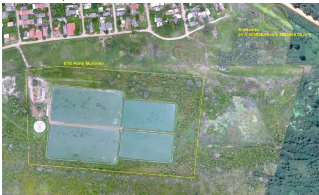
Figura 3: Vista aérea da ETE Porto Murinho e entorno, Porto Murinho, MS.

A ETE Porto Murinho de acordo com o Sistema Interativo de Suporte ao Licenciamento Ambiental (SISLA) de MS, não se sobrepõe a nenhuma Unidade de Conservação ou Zonas de Amortecimento, nem a Terras Indígenas, Áreas de Perambulação, Quilombolas e Assentamentos Rurais (Figura 4).