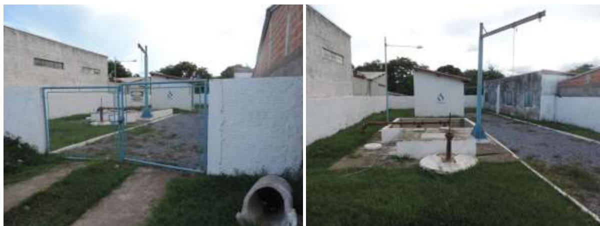
Figura 8: Vista geral da EEEB 003, Porto Murtinho, MS.

A EEEB 003 de acordo com o Sistema Interativo de Suporte ao Licenciamento Ambiental (SISLA) de MS, não se sobrepõe a nenhuma Unidade de Conservação ou Zonas de Amortecimento, nem a Terras Indígenas, Áreas de Perambulação, Quilombolas e Assentamentos Rurais.