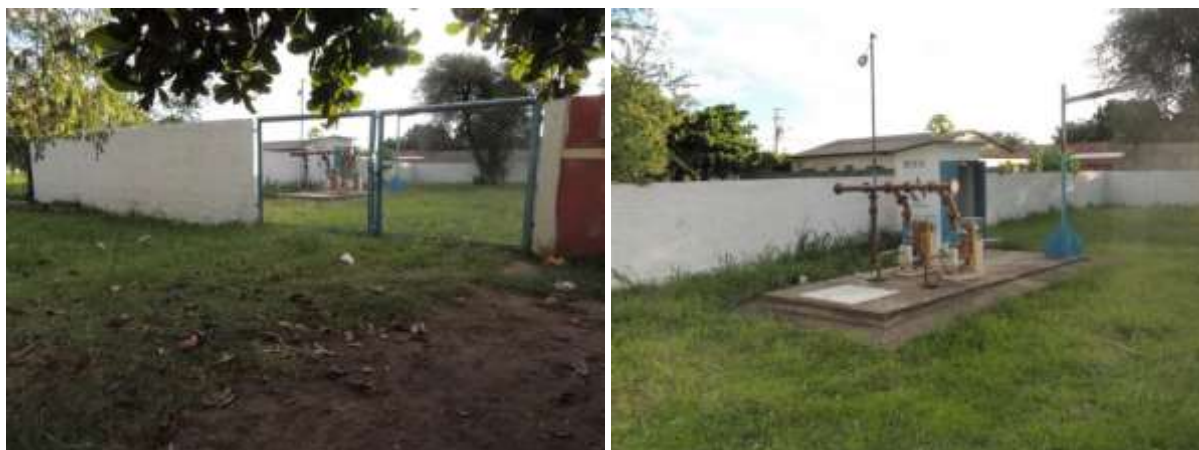
Figura 9: Vista geral da EEEB 004, Porto Murtinho, MS.

A EEEB 004 localiza-se na Rua Amadeo Santos, coordenadas geográficas UTM (21 K) 408.896 E / 7.600.465 S, com a função de bombear o esgoto bruto coletado no Bairro Florestal para a EEEB 001. Encontra-se completamente cercada por muros, cercas e grades com portão e trancas (Figura 9 Erro! Fonte de referência não encontrada. ). Não possui informação sobre extravasor.