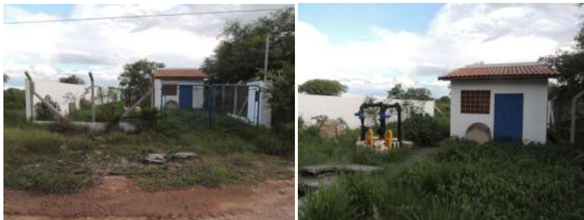
Figura 15: Vista geral da EEEB 010, Porto Murtinho, MS.

A EEEB 010 localiza-se na Rua Costa Marques, coordenadas geográficas UTM (21 K) 407.091 E / 7.599.006 S, com a função de bombear o esgoto bruto coletado no Loteamento Camalote para o subsistema 8. Encontra-se completamente cercada por muros, cercas e grades com portão e trancas (Figura 15). Encontra-se inoperante. Não possui informação sobre extravasor.