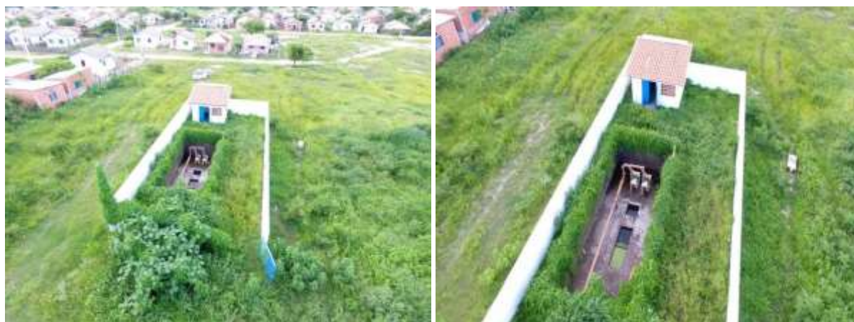
Figura 13: Vista geral da EEEB 008, Porto Murtinho, MS.

A EEEB 008 localiza-se na Rua 15 de Novembro esquina com a Rua Projetada 01, coordenadas geográficas UTM (21 K) 408.021 E / 7.598.741 S, com a função de bombear o esgoto bruto coletado no Bairro Dom Pepe para desarenador na ETE Porto Murtinho. Encontra-se completamente cercada por muros e grades com portão, que permanece aberto (Figura 13). Encontra-se inoperante. Não possui informação sobre extravasor.