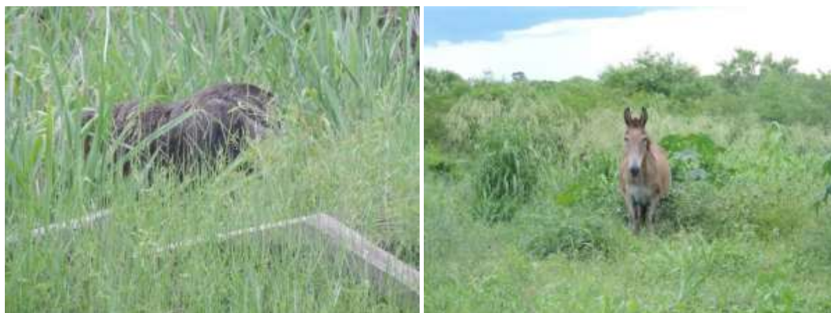
Figura 5: Registro de animais domésticos e de animais silvestres na área da ETE Porto Murtinho, Porto Murtinho, MS.