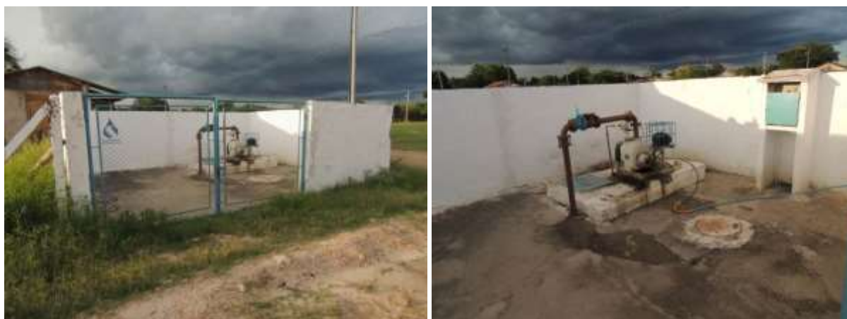
Figura 11: Vista geral da EEEB 006, Porto Murtinho, MS.

A EEEB 006 de acordo com o Sistema Interativo de Suporte ao Licenciamento Ambiental (SISLA) de MS, não se sobrepõe a nenhuma Unidade de Conservação ou Zonas de Amortecimento, nem a Terras Indígenas, Áreas de Perambulação, Quilombolas e Assentamentos Rurais.