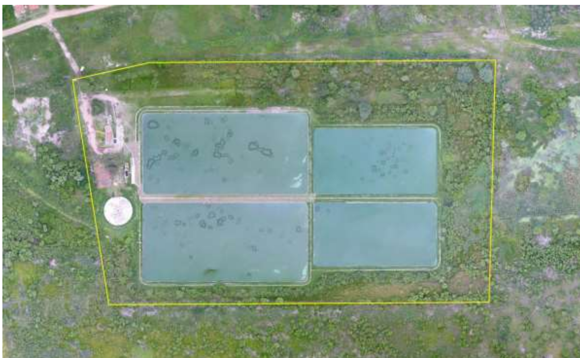
Figura 2: Vista aérea da ETE Porto Murinho, Porto Murinho, MS.