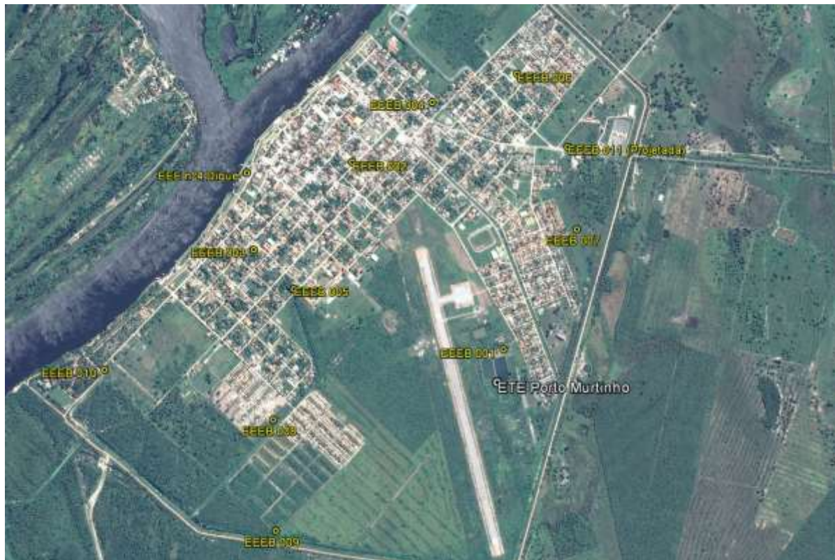
Figura 1: Localização das Unidades Operacionais existentes e projetadas na cidade de Porto Murtinho, MS.

A cidade de Porto Murtinho possui uma Estação de Tratamento de Esgotos (ETE) em operação e 10 Estações Elevatórias de Esgoto Bruto (EEEB), sendo três delas inoperantes. Possui, ainda, área selecionada para a implantação de uma Estação Elevatória de Esgoto Bruto (EEEB) projetada (Figura 1).