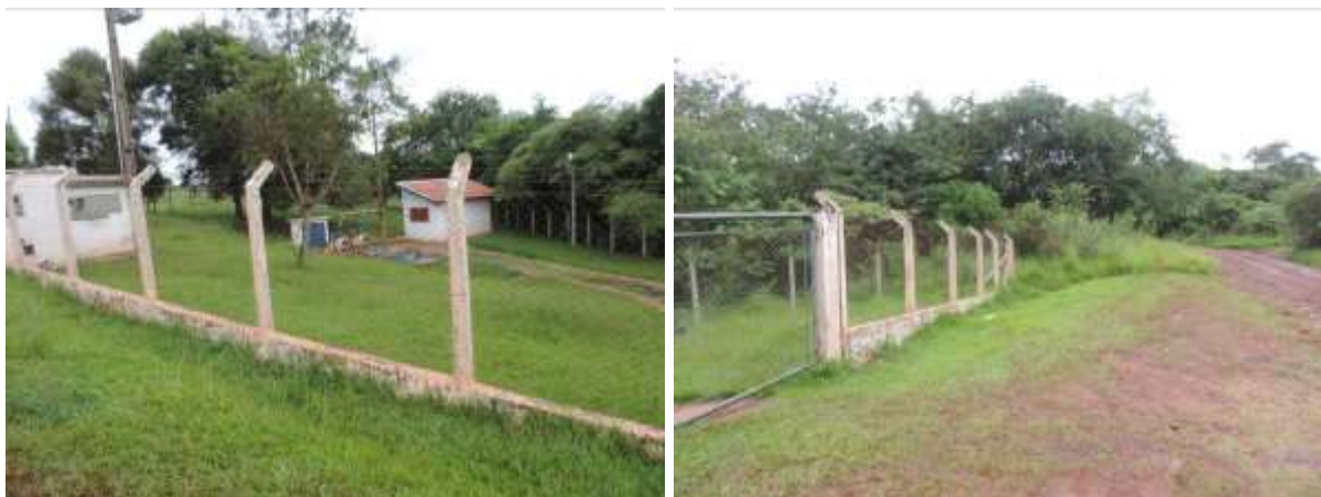
Figura 6: Vista geral da EEEB 4.1, Ponta Porã, MS.

A EEEB 4.1 localiza-se na Rua Uruguai, próximo ao Córrego São João, coordenadas geográficas UTM (21 K) 632.950 E / 7.510.419 S, tendo como função recalcar o esgoto afluyente para a ETE Estoril. Encontra-se completamente cercada por alambrado, com portão com trancas para veículos. Não apresenta cortina arbórea (Figura 6). Possui extravasor.