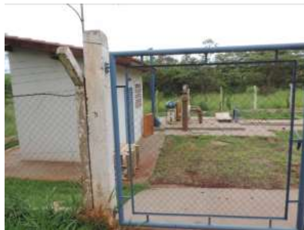
Figura 11: Vista geral da EEEB 008, Ponta Porã, MS.

A EEEB 008, de acordo com o Sistema Interativo de Suporte ao Licenciamento Ambiental (SISLA) de MS, não se sobrepõe a nenhuma Unidade de Conservação, Terras Indígenas, Áreas de Perambulação, Quilombolas e Assentamentos Rurais.