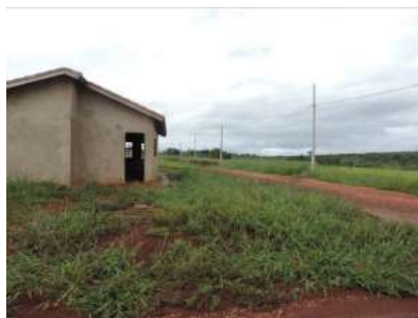
Figura 12: Vista geral da EEEB 07 ou Coimbra, Ponta Porã, MS.

A EEEB 4.2, de acordo com o Sistema Interativo de Suporte ao Licenciamento Ambiental (SISLA) de MS, não se sobrepõe a nenhuma Unidade de Conservação, Terras Indígenas, Áreas de Perambulação, Quilombolas e Assentamentos Rurais.