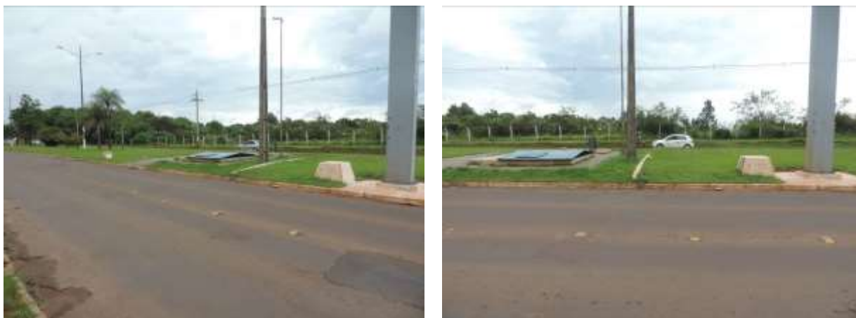
Figura 8: Vista geral da EEEB 006, Ponta Porã, MS.

A EEEB 006 localiza-se na Avenida Brasil, próximo ao cruzamento com a Rua Maracaju, coordenadas geográficas UTM (21 K) 631.551 E / 7.506.000 S, tendo como função recalcar o esgoto afluyente para a EEEB 4.1. Não possui cercamento, tendo sido implantada no canteiro central da avenida. Possui cobertura com tranca para acesso às estruturas (Figura 8). Possui extravasor.