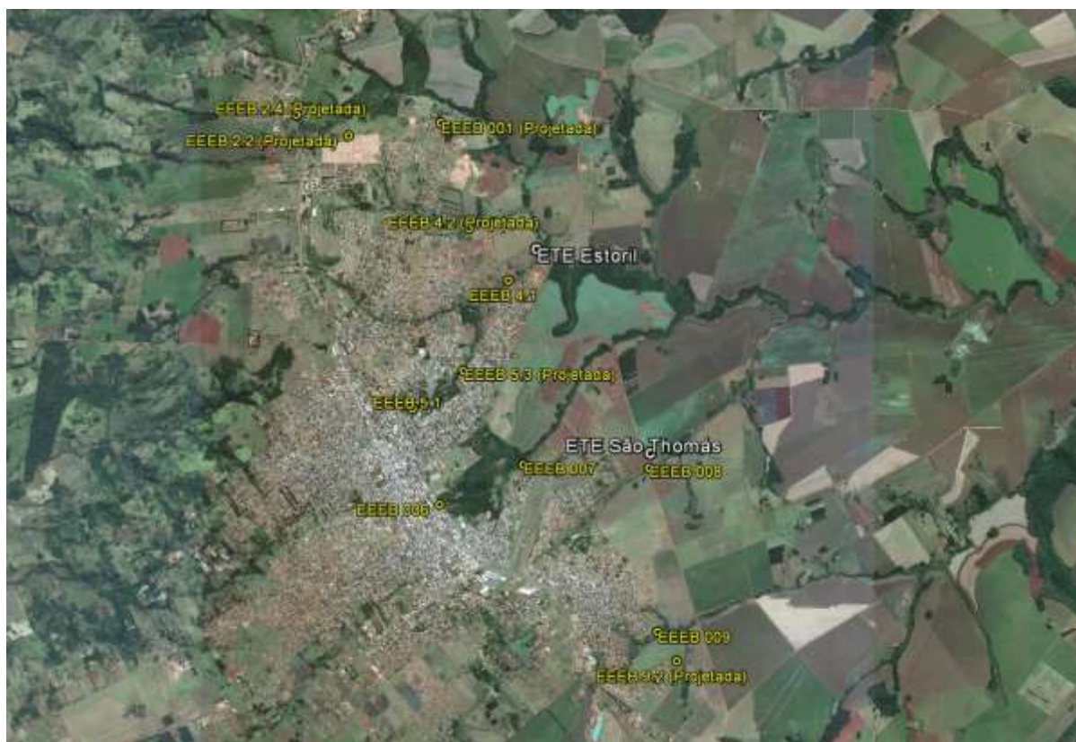
Figura 1: Localização das Unidades Operacionais existentes e projetadas na cidade de Ponta Porã, MS.

A cidade de Ponta Porã possui duas Estações de Tratamento de Esgoto (ETE) em operação, duas Estações Elevatórias de Recirculação de Lodo (EERL) em operação e sete Estações Elevatórias de Esgoto Bruto (EEEB), sendo seis em operação e uma em implantação. Possui, ainda, áreas selecionadas para a implantação de cinco Estações Elevatórias de Esgoto Bruto (EEEB) projetadas (Figura 1).