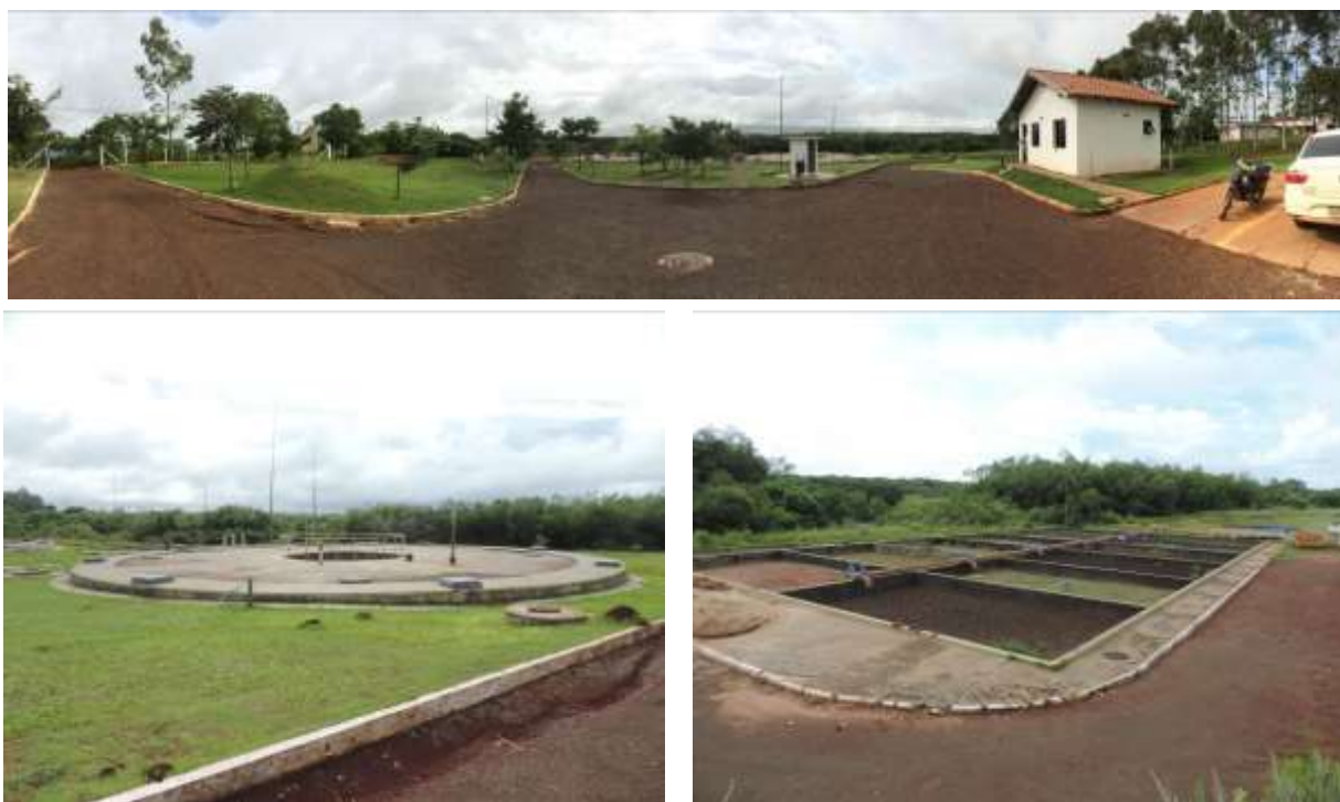
Figura 2: Vista da geral da ETE Estoril, Ponta Porã, MS.

A ETE Estoril, de acordo com o Sistema Interativo de Suporte ao Licenciamento Ambiental (SISLA) de MS, não se sobrepõe a nenhuma Unidade de Conservação, Terras Indígenas, Áreas de Perambulação, Quilombolas e Assentamentos Rurais (Figura 3).