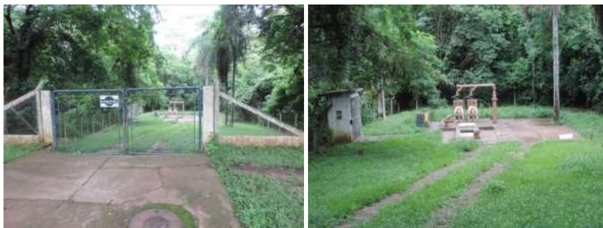
Figura 7: Vista geral da EEEB 5.1, Ponta Porã, MS.

A EEEB 5.1 localiza-se na Rua Calógeras entre a Rua Aral Moreira e a Rua Joaquim Teixeira, coordenadas geográficas UTM (21 K) 631.033 E / 7.507.896 S, tendo como função recalcar o esgoto afluyente para a EEEB 4.1. Encontra-se completamente cercada por alambrado, com portão com trancas para veículos. Possui cortina arbórea natural e árvores esparsas em seu interior (Figura 7). Possui extravasor.