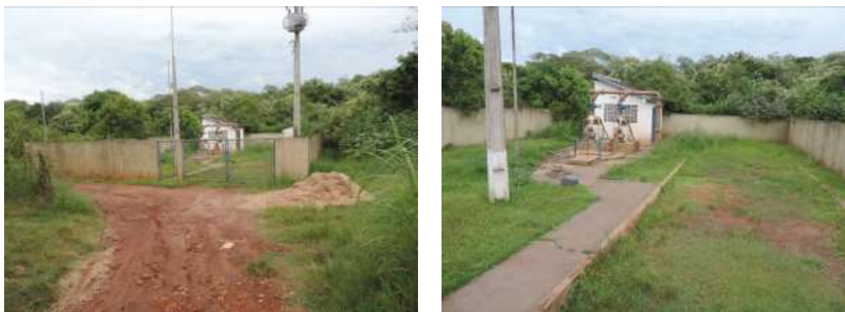
Figura 9: Vista geral da EEEB 007, Ponta Porã, MS.

A EEEB 007, de acordo com o Sistema Interativo de Suporte ao Licenciamento Ambiental (SISLA) de MS, não se sobrepõe a nenhuma Unidade de Conservação, Terras Indígenas, Áreas de Perambulação, Quilombolas e Assentamentos Rurais.