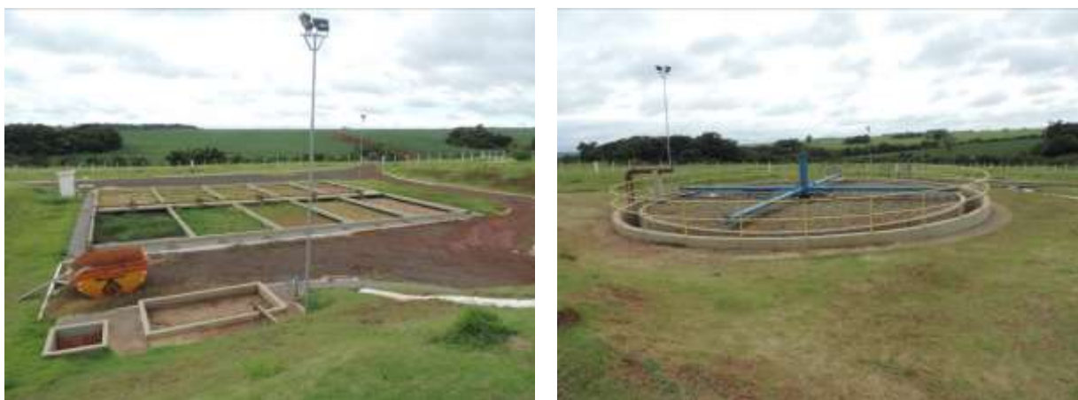
Figura 4: Vista geral da ETE São Thomaz, Ponta Porã, MS.

A ETE São Thomaz, de acordo com o Sistema Interativo de Suporte ao Licenciamento Ambiental (SISLA) de MS, não se sobrepõe a nenhuma Unidade de Conservação, Terras Indígenas, Áreas de Perambulação, Quilombolas e Assentamentos Rurais (Figura 5).