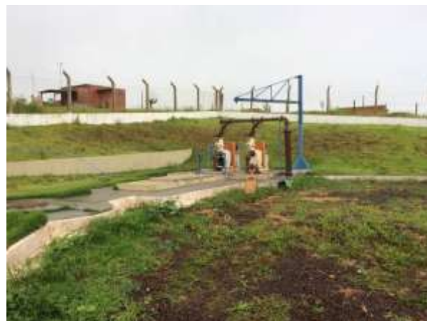
Figura 10: Vista geral da EEEB 9.1, Ponta Porã, MS.

A EEEB 9.1, de acordo com o Sistema Interativo de Suporte ao Licenciamento Ambiental (SISLA) de MS, não se sobrepõe a nenhuma Unidade de Conservação, Terras Indígenas, Áreas de Perambulação, Quilombolas e Assentamentos Rurais.