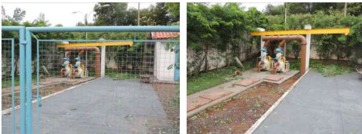
Figura 7: Vista geral da EEEB 03, Paranaíba, MS.

A EEEB 03 localiza-se na Avenida Carlos de Paiva Ferraz, coordenadas geográficas UTM (22 K) 482.137 E / 7.824.095 S, tem como função terminal para ETE. Encontra-se completamente cercada por muro, cerca com alambrado e cerca viva e portão com trancas para veículos (Figura 7). Possui extravasor.