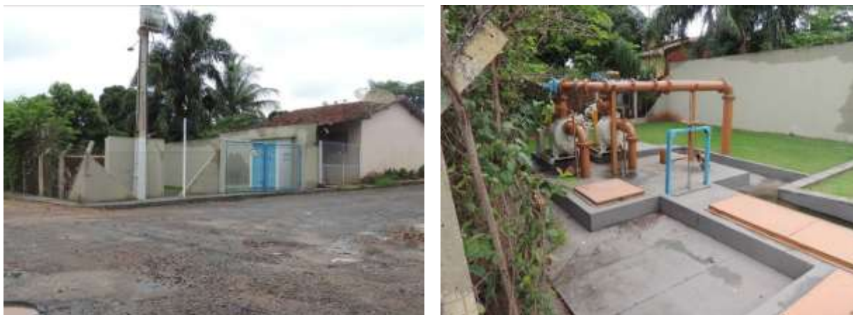
Figura 6: Vista geral da EEEB 002, Paranaíba, MS.

A EEEB 02 localiza-se na Rua Melo Taques esquina com a Avenida Copacabana, coordenadas geográficas UTM (22 K) 481.104 E / 7.823.808 S, tendo como função terminal para ETE. Encontra-se totalmente cercada por muros e alambrado, com portão de grade e tranca para veículos e pedestres (Figura 6). Possui extravasor.