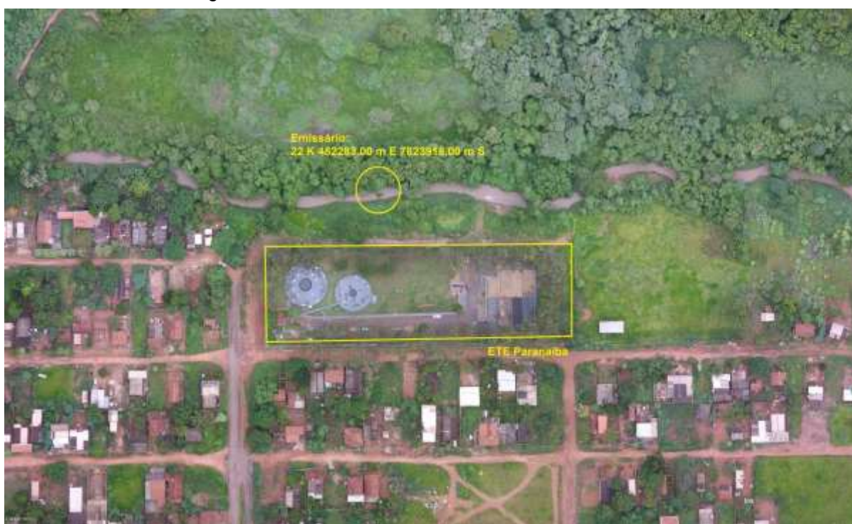
Figura 3: Vista aérea da ETE Paranaíba e entorno, Paranaíba, MS.

A ETE Paranaíba, de acordo com o Sistema Interativo de Suporte ao Licenciamento Ambiental (SISLA) de MS, não se sobrepõe a nenhuma Unidade de Conservação ou Zonas de Amortecimento, nem a Terras Indígenas, Áreas de Perambulação, Quilombolas e Assentamentos Rurais (Figura 4).