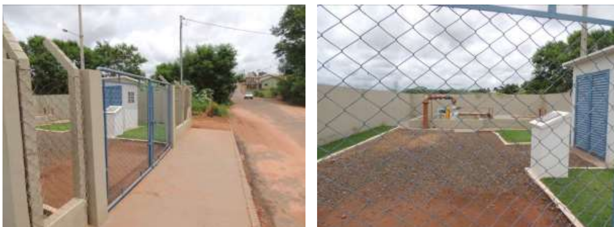
Figura 5: Vista geral da EEEB 01, Paranaíba, MS.

A EEEB 01, de acordo com o Sistema Interativo de Suporte ao Licenciamento Ambiental (SISLA) de MS, não se sobrepõe a nenhuma Unidade de Conservação ou Zonas de Amortecimento, nem a Terras Indígenas, Áreas de Perambulação, Quilombolas e Assentamentos Rurais.