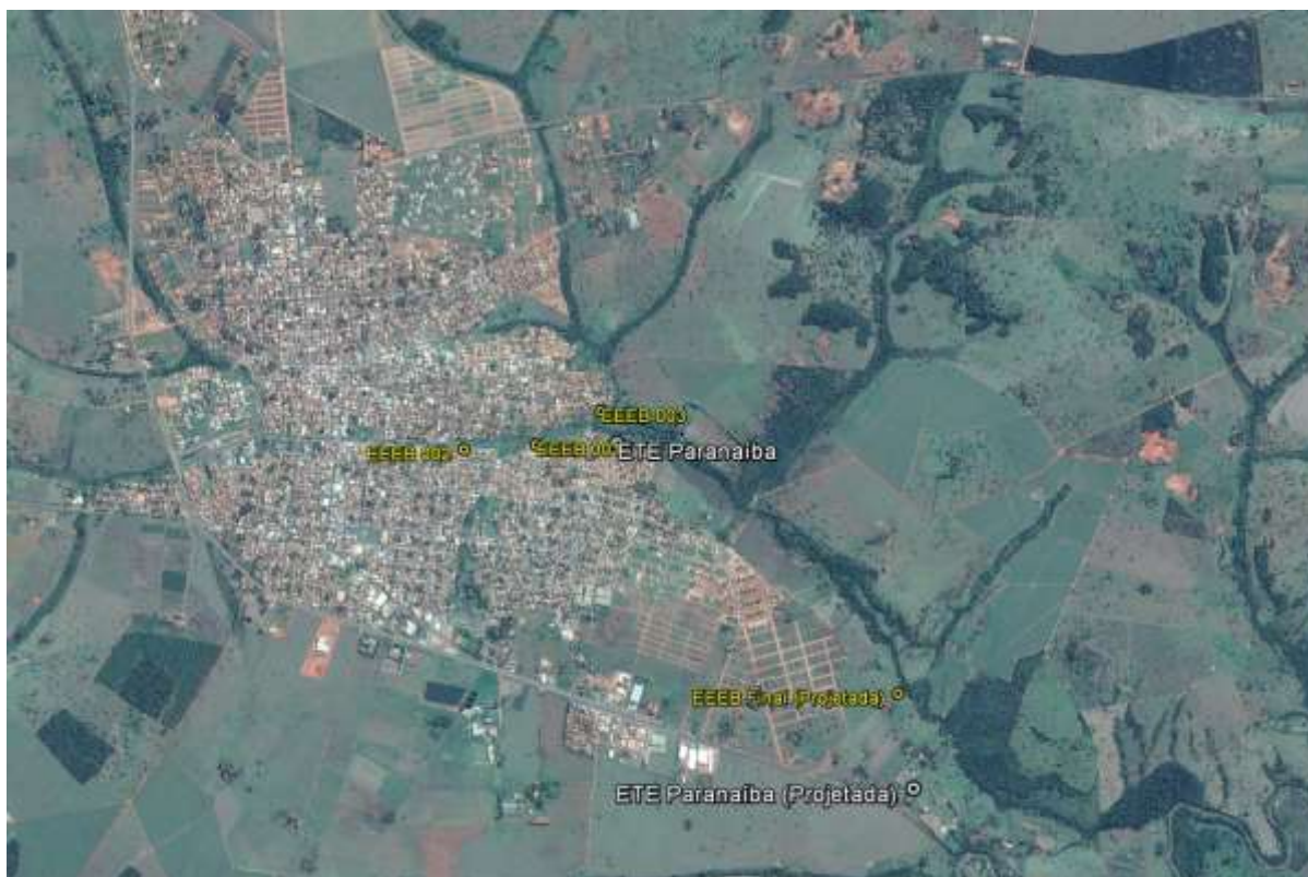
Figura 1: Localização das Unidades Operacionais existentes e projetadas na cidade de Paranaíba, MS.

A cidade de Paranaíba possui uma Estação de Tratamento de Esgotos (ETE) e três Estações Elevatórias de Esgoto Bruto (EEEB), em operação. Possui, ainda, uma área selecionada para a implantação de uma Estação de Tratamento de Esgotos (ETE) e duas Estações Elevatórias de Esgoto Bruto (EEEB) projetadas (Figura 1).