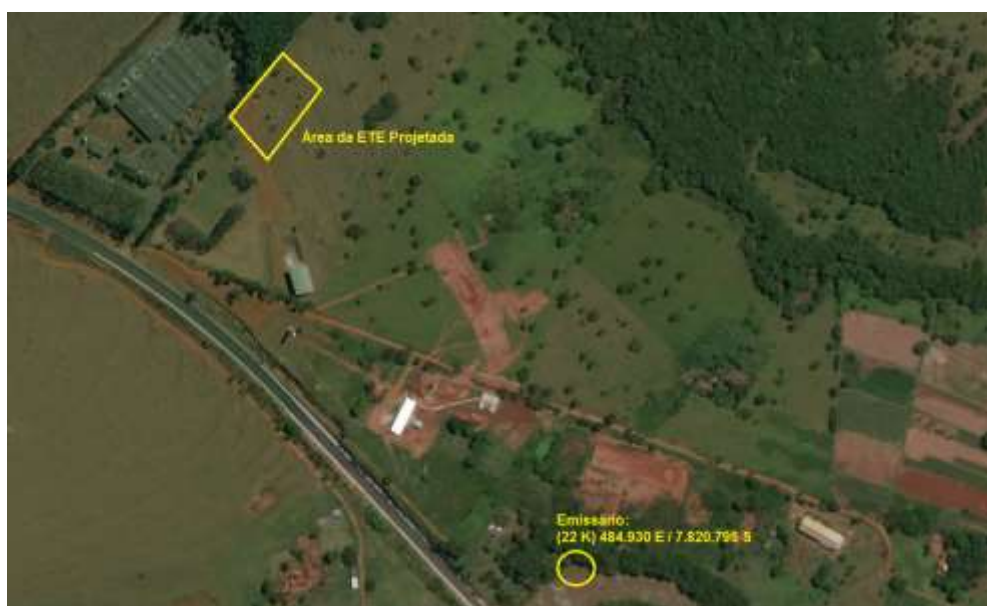
Figura 8: Vista da área pretendida da ETE Paranaíba Projetada, Paranaíba, MS.

A ETE Paranaíba Projetada está localizada nas coordenadas geográficas UTM (22 K) 484.503 E / 7.821.266 S, distante de 640 m do corpo receptor. A área é recoberta por gramíneas de pastagem (Figura 8).