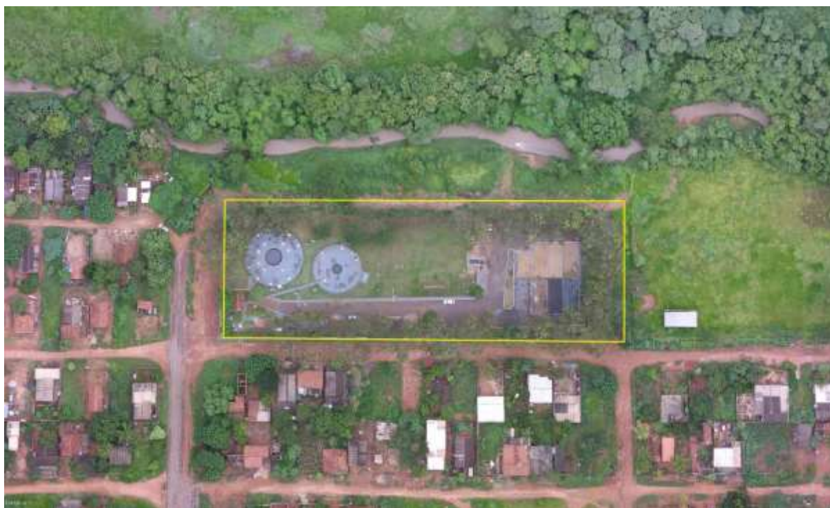
Figura 2: Vista aérea da ETE Paranaíba, Paranaíba, MS.