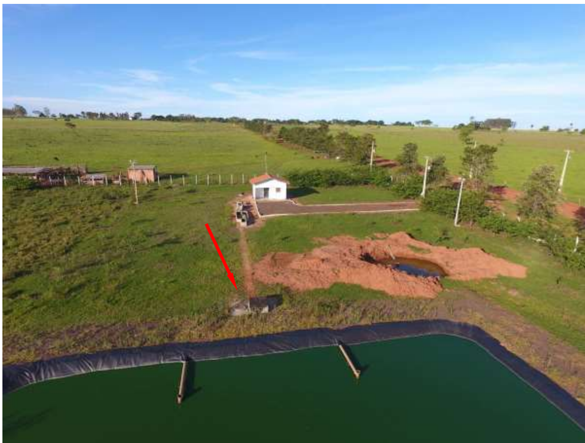
Figura 6: Vista aérea da EEEB 001, distrito de Nova Esperança, MS.

A EEEB 001 localiza-se dentro da ETE Nova Esperança, coordenadas geográficas UTM (22 K) 777.715 E / 7.501.980 S, com a função de retornar o efluente líquido da caixa de areia até o tratamento preliminar. Encontra-se completamente cercada por muro e cercas com arame alambrado e portão com trancas (Figura 6). Não possui informações sobre extravasor.