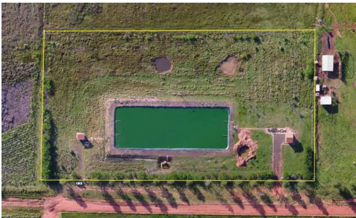
Figura 2: Vista aérea da ETE Nova Esperança, distrito de Nova Esperança, MS.