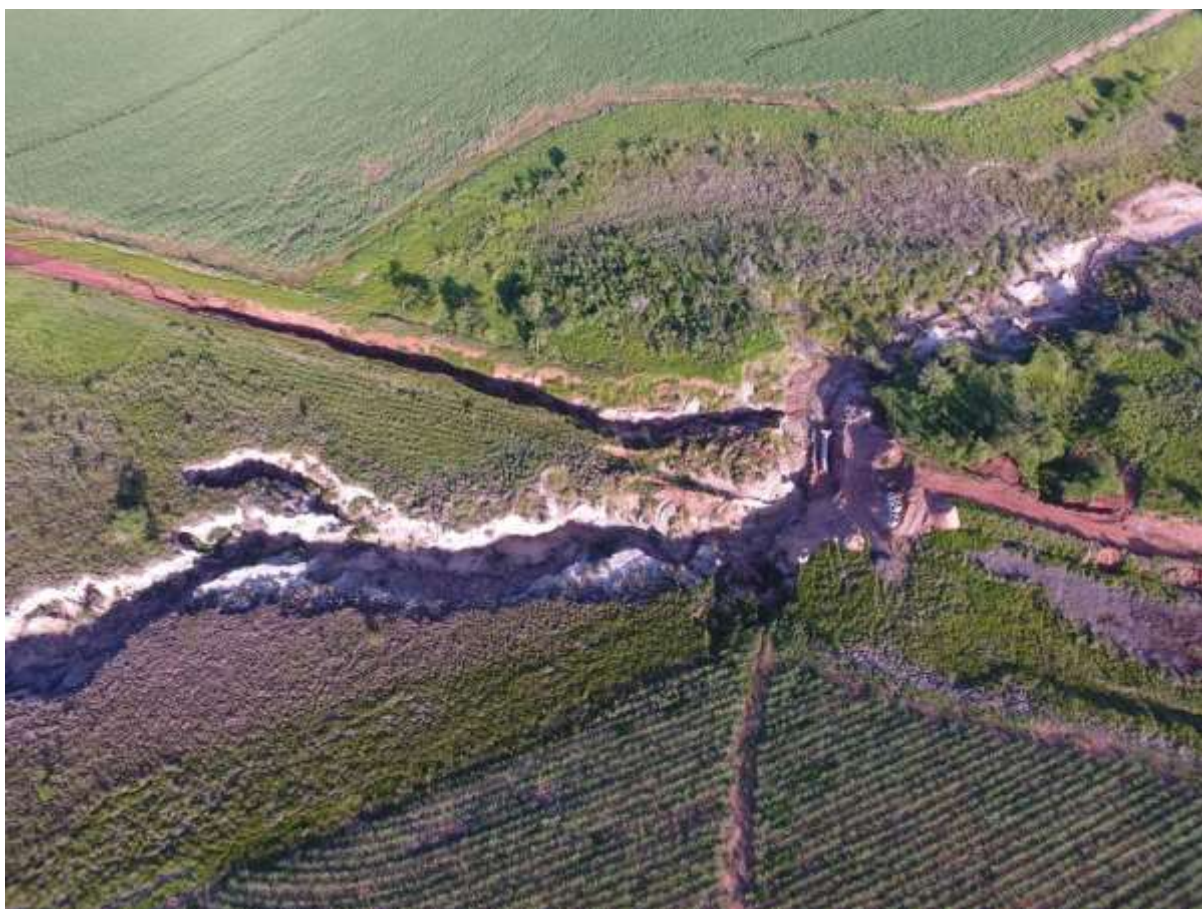
Figura 5: Vista aérea da voçoroca que danificou o emissário da ETE Nova Esperança, distrito de Nova Esperança, MS