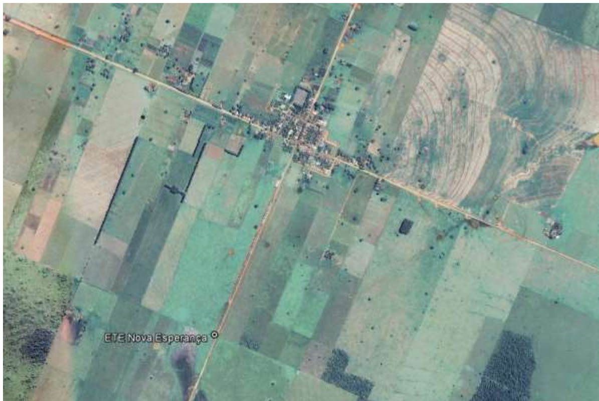
Figura 1: Localização das Unidades Operacionais existentes e projetadas no distrito de Nova Esperança (Jateí), MS.

O distrito de Nova Esperança possui uma Estação de Tratamento de Esgotos (ETE) em operação, uma Estação Elevatória de Esgoto Bruto (EEEB) e uma Estação Elevatória de Esgoto Tratado (EEET), ambas implantadas na área da ETE, mas não em operação (Figura 1). Não possui Unidades Operacionais projetadas.