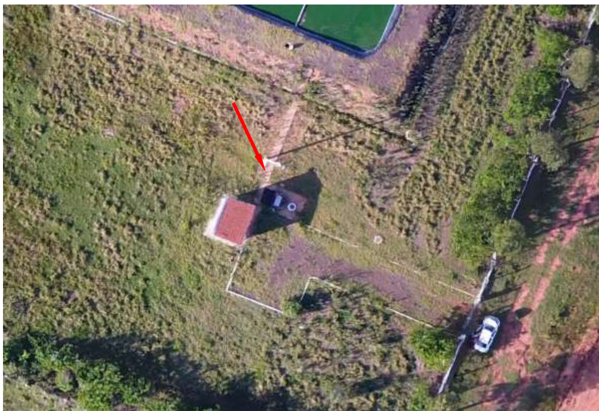
Figura 7: Vista aérea da EEET NEP-ETE, distrito de Nova Esperança, MS.

A EEET NEP-ETE, de acordo com o Sistema Interativo de Suporte ao Licenciamento Ambiental (SISLA) de MS, não se sobrepõe a nenhuma Unidade de Conservação ou Zonas de Amortecimento, nem a Terras Indígenas, Áreas de Perambulação, Quilombolas e Assentamentos Rurais.