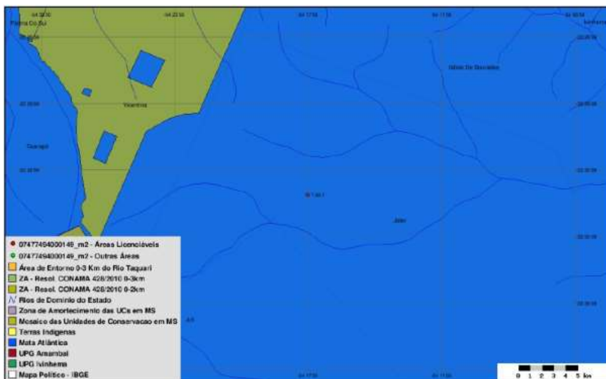
Figura 4: SISLA da ETE Nova Esperança (IMASUL, 2016)