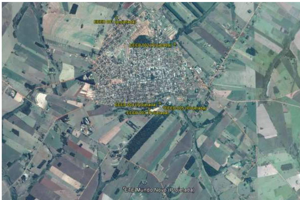
Figura 1: Localização das Unidades Operacionais existentes e projetadas na cidade de Mundo Novo, MS.

A cidade de Mundo Novo não possui Sistema de Esgotamento Sanitário, porém possui áreas selecionadas para a implantação de uma Estação de Tratamento de Esgotos (ETE) e cinco Estações Elevatórias de Esgoto Bruto (EEEB) projetadas (Figura 1).