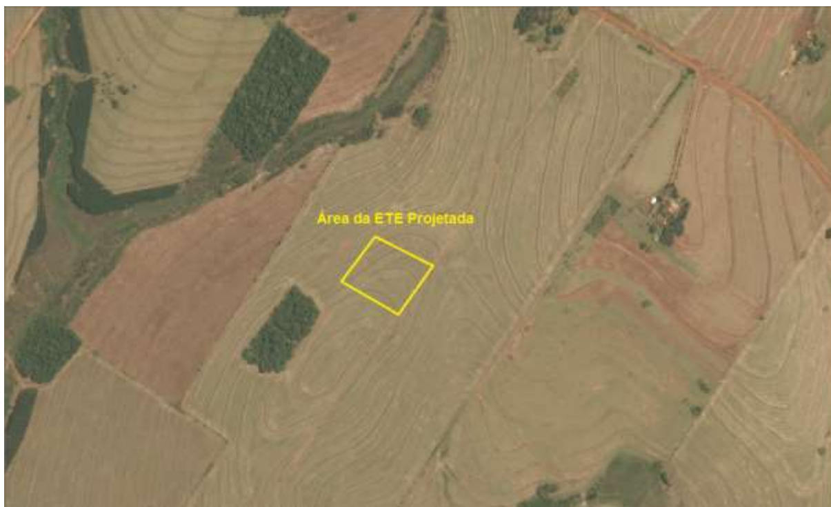
Figura 2: Vista aérea da área pretendida para ETE Mundo Novo Projetada, Mundo Novo, MS.