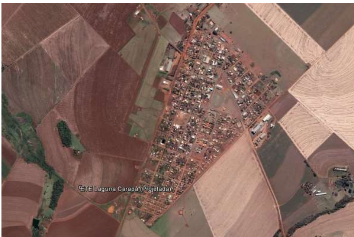
Figura 1: Localização das Unidades Operacionais na cidade de Laguna Carapã, MS.

A cidade de Laguna Carapã não possui Sistema de Esgotamento Sanitário (SES). Porém possui uma área selecionada para a implantação de uma Estação de Tratamento de Esgotos (ETE) projetada (Figura 1). Destaca-se que devido à topografia da cidade não é necessária à implantação de Estações Elevatórias de Esgoto Bruto (EEEB).