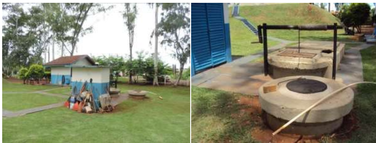
Figura 6: Vista geral da EEEB Pátio ETE, Itaporã, MS

A EEEB Pátio ETE localiza-se dentro da área da ETE Itaporã, coordenadas geográficas UTM (21 K) 727.612 E / 7.557.013 S, com a função de recalcar esgoto bruto até o tratamento preliminar (Figura 6). Não possui informação sobre extravasor.