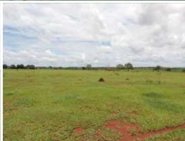
Figura 7: Vista da área e geral da área pretendida para a ETE Itaporã Projetada, Itaporã, MS.