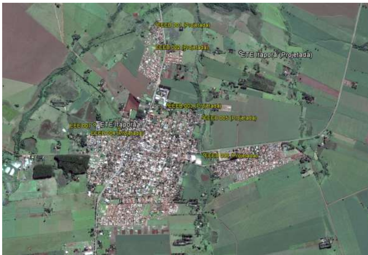
Figura 1: Localização das Unidades Operacionais existentes e projetadas na cidade de Itaporã, MS.

A cidade de Itaporã possui uma Estação de Tratamento de Esgotos (ETE) e duas Estações Elevatórias de Esgotos Bruto (EEEB) em operação. Possui ainda uma área selecionada para implantação de uma ETE Projetada (Figura 1).