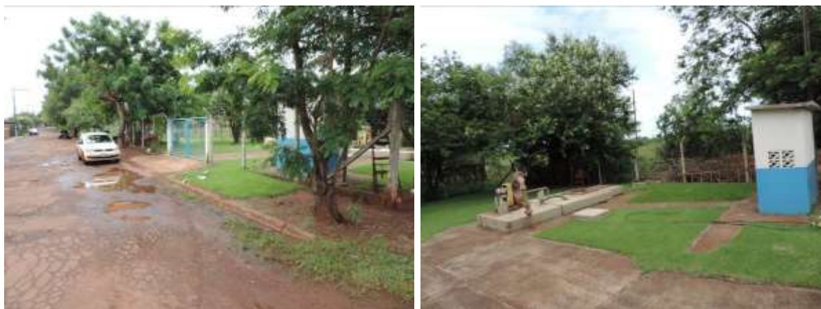
Figura 5: Vista geral da EEEB 007, Itaporã, MS.

A EEEB 007 localiza-se na zona urbana de Itaporã na Rua Frei Saturnino, coordenadas geográficas UTM (21 K) 727.211 E / 7.557.073 S, com a função de recalcar esgoto bruto até a ETE Itaporã. Encontra-se totalmente cercada por alambrado, com portão e trancas. A área esta recoberta por gramíneas e apresenta cortina arbórea cobrindo parcialmente o perímetro da estação (Figura 5). Não possui informação sobre extravasor.