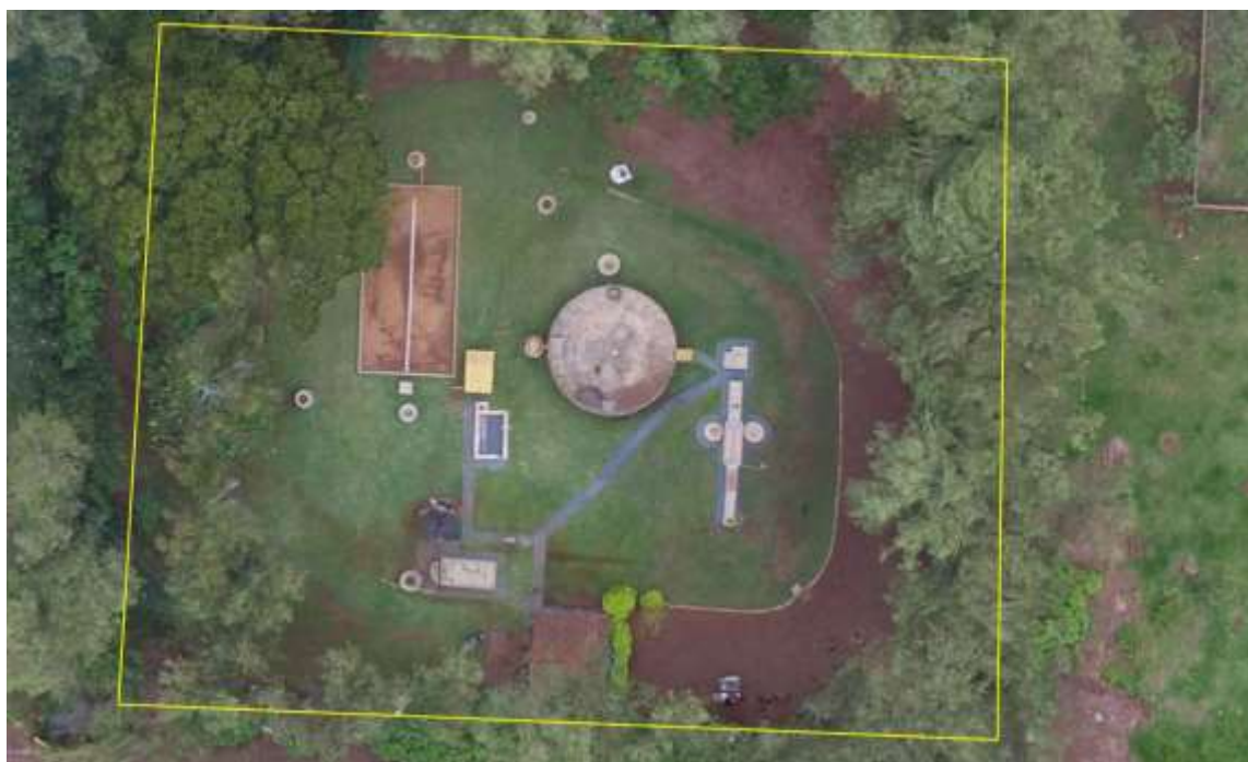
Figura 2: Vista aérea da ETE Itaporã, Itaporã, MS.

A ETE Itaporã está localizada na zona urbana de Itaporã, nas coordenadas geográficas UTM (21 K) 727.619 E / 7.557.024 S, distante 20 m do corpo receptor. Encontra-se totalmente cercada, com poucas árvores em seu interior e com cortina arbórea no entorno (Figuras 2 e 3).