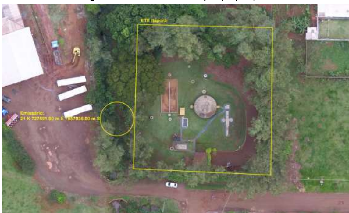
Figura 3: Vista aérea da ETE Itaporã e entorno, Itaporã, MS.