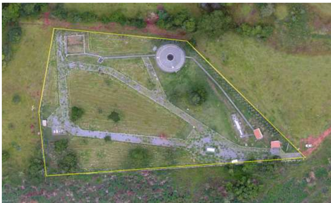
Figura 2: Vista aérea da ETE Guia Lopes da Laguna, Guia Lopes da Laguna, MS.

A ETE Guia Lopes da Laguna está localizada no Subsistema da Bacia 04, na extremidade sul da sede do município, coordenadas geográficas UTM (21K) 592.016 E / 7.625.699 S, distante 120 m do corpo receptor. Encontra-se totalmente cercada, com árvores esparsas em seu interior e com cortina arbórea parcial no entorno (Figuras 2 e 3). Não possui informação sobre extravasor.