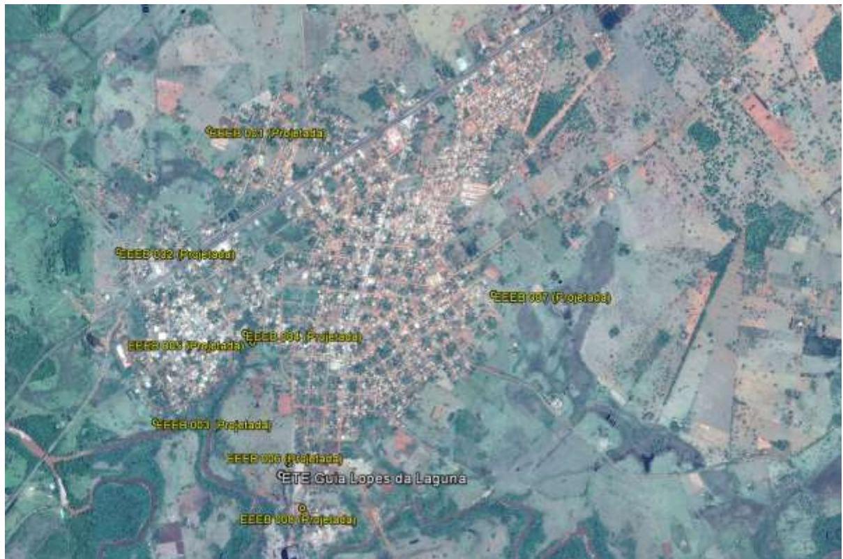
Figura 1: Localização das Unidades Operacionais existentes e projetadas na cidade de Guia Lopes da Laguna, MS.

A cidade de Guia Lopes da Laguna possui uma Estação de Tratamento de Esgotos (ETE) e uma Estação Elevatória de Esgoto Bruto (EEEB) implantadas, mas não em operação. Possui, ainda, áreas selecionadas para a implantação de oito Estações Elevatórias de Esgoto Bruto (EEEB) projetadas (Figura 1)