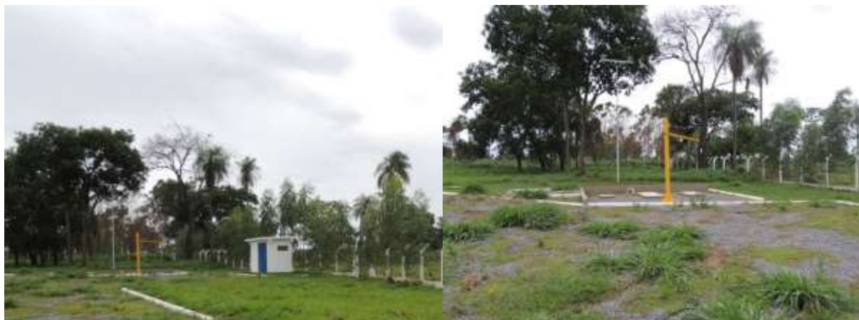
Figura 6: Vista geral da EEEB Final, Guia Lopes da Laguna, MS.

A EEEB Final localiza-se na área da ETE Guia Lopes da Laguna, no Subsistema da Bacia 04, na extremidade sul da sede do município (localizada dentro da área da ETE), coordenadas geográficas UTM (21 K) 592.008 E/ 7.625.608 S, que coleta o esgoto e o encaminha para a caixa de entrada. Encontra-se totalmente cercada, com poucas árvores em seu interior e com cortina arbórea parcialmente no entorno (Figura 6).