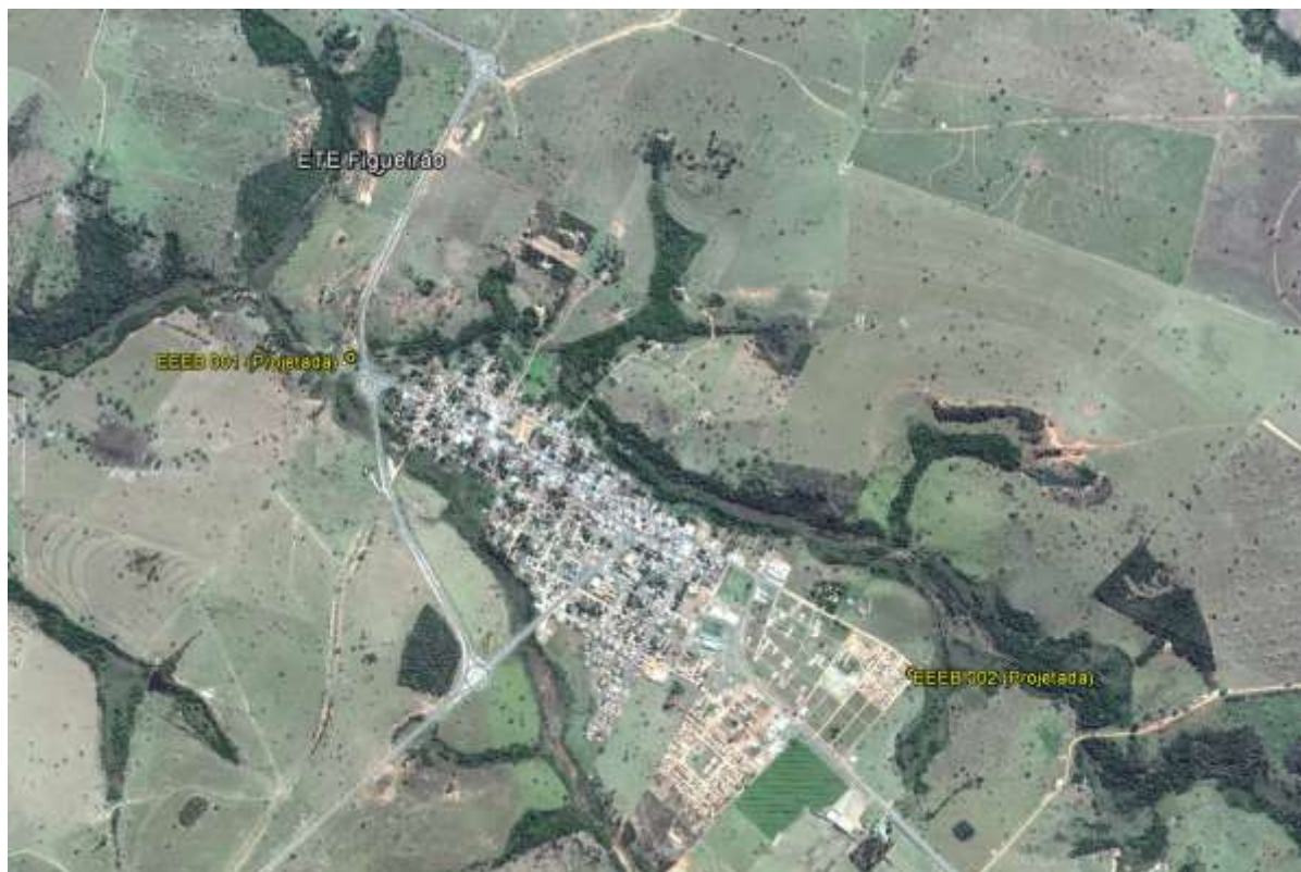
Figura 1: Localização das Unidades Operacionais existentes e projetadas na cidade de Figueirão, MS.

A cidade de Figueirão possui uma Estação de Tratamento de Esgotos (ETE) implantada, mas não em operação e uma Estação Elevatória de Esgoto Bruto (EEEB) implantada, mas abandonada. Possui, ainda, área selecionada para a implantação de uma Estação Elevatória de Esgoto Bruto (EEEB) projetada (Figura 1).