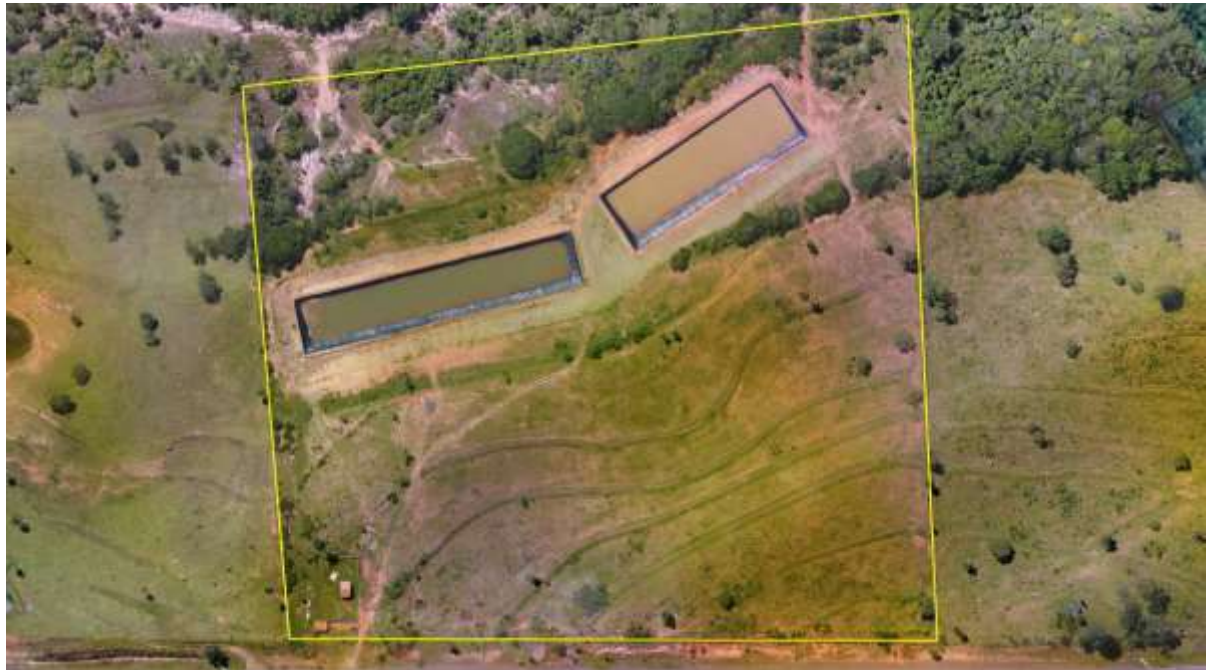
Figura 2: Vista aérea da ETE Figueirão, Figueirão, MS.