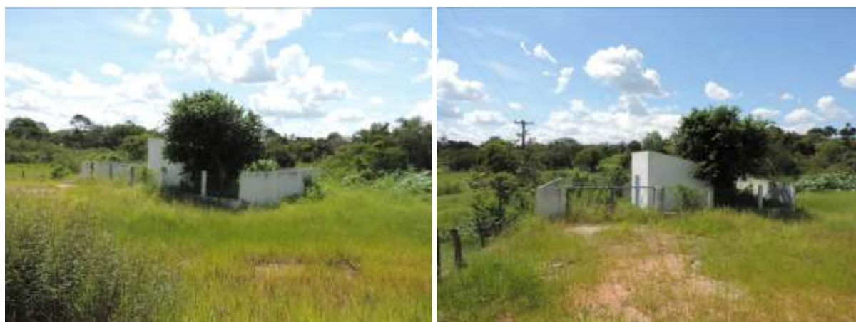
Figura 5: Vista geral da EEEB 001, Figueirão, MS.

Não possui informações sobre extravasor.