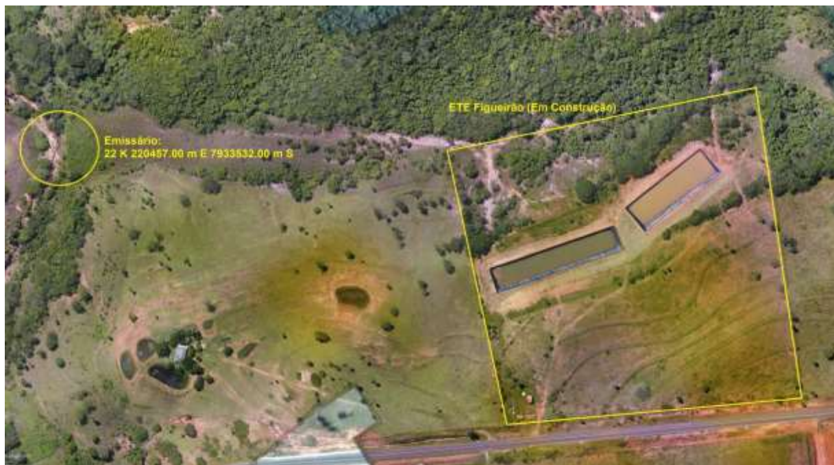
Figura 3: Vista aérea da ETE Figueirão e entorno.

A ETE Figueirão, de acordo com o Sistema Interativo de Suporte ao Licenciamento Ambiental (SISLA) de MS, não se sobrepõe a nenhuma Unidade de Conservação ou Zonas de Amortecimento, nem a Terras Indígenas, Áreas de Perambulação, Quilombolas e Assentamentos Rurais (Figura 4).