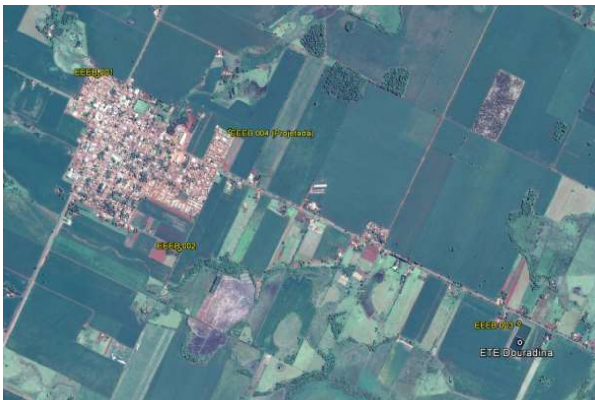
Figura 1: Localização das Unidades Operacionais existentes e projetadas na cidade de Douradina, MS.

A cidade de Douradina possui uma Estação de Tratamento de Esgotos (ETE) e três Estações Elevatórias de Esgoto Bruto (EEEB) implantadas, mas nenhuma em operação. Possui, ainda, uma área selecionada para a implantação de uma Estação Elevatória de Esgoto Bruto (EEEB) projetada (Figura 1).