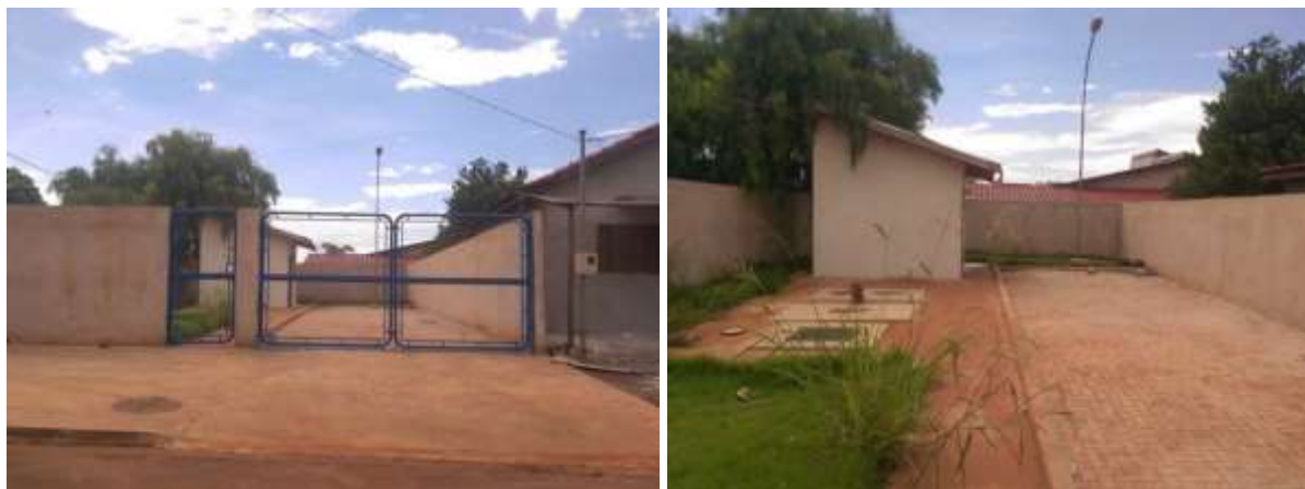
Figura 5: Vista geral da EEEB 001, Douradina, MS.

A EEEB 001, de acordo com o Sistema Interativo de Suporte ao Licenciamento Ambiental (SISLA) de MS, não se sobrepõe a nenhuma Unidade de Conservação ou Zonas de Amortecimento, nem a Terras Indígenas, Áreas de Perambulação, Quilombolas e Assentamentos Rurais.