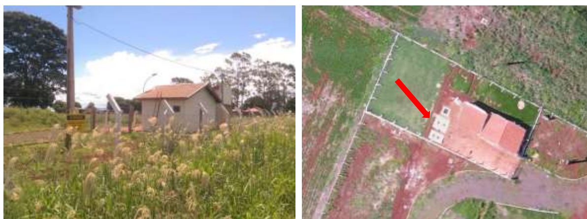
Figura 6: Vista geral e imagem aérea da EEEB 003, Douradina, MS.

A EEEB 003 localiza-se dentro da área da ETE Douradina, coordenadas geográficas UTM (21 K) 750.013 E / 7.559.311 S, com a função de bombear o efluente bruto coletado até o tratamento preliminar. Encontra-se totalmente cercada por alambrado, com portão e trancas (Figura 6). Não possui informação sobre extravasor.