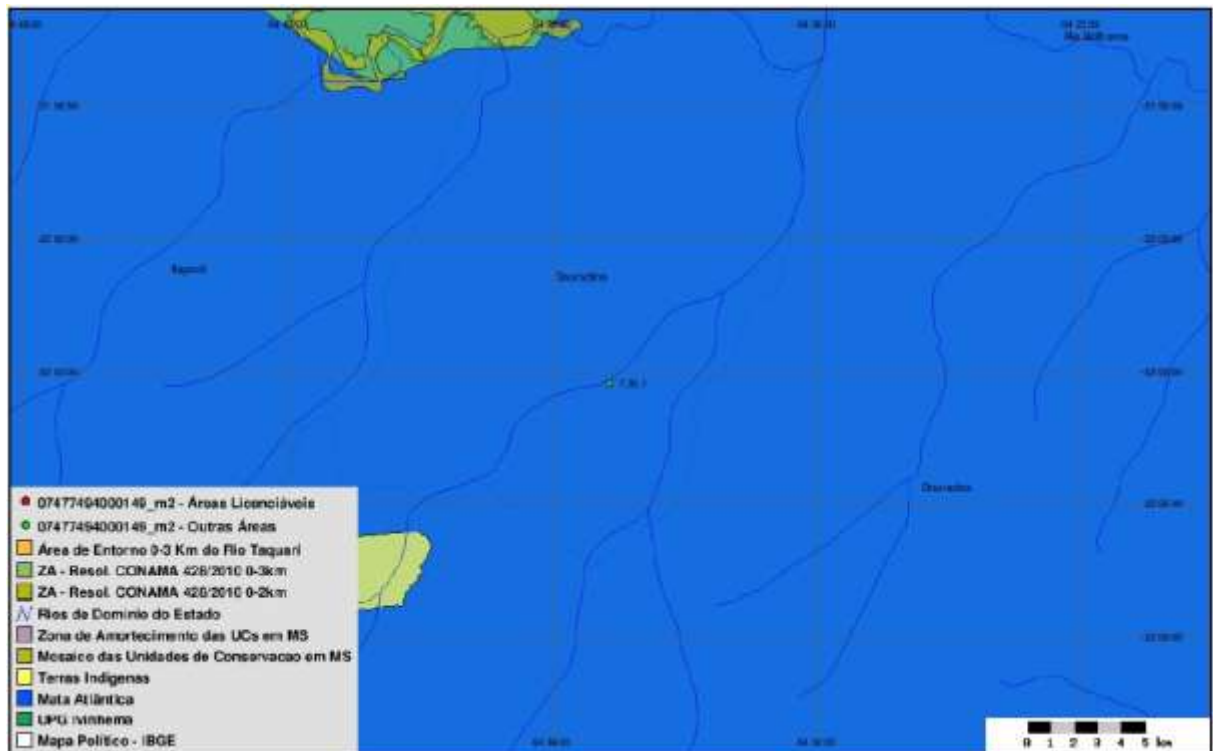
Figura 4: SISLA da ETE Douradina (IMASUL, 2017)

A área não é objeto de processos minerários.