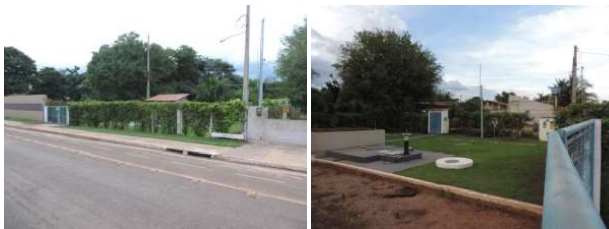
Figura 8: Vista geral da EEEB 012, Coxim, MS.

A EEEB 012, elevatória subterrânea com função de recalque do esgoto bruto para a ETE Coxim, localiza-se na zona urbana de Coxim na Av. Marcio Lima Arantes no Bairro Santa Maria, coordenadas geográficas UTM (21 K) 736.882 E / 7.953.309 S. Encontra-se cercada por muros e alambrados, com portão e trancas para veículos, (Figura 8). Possui extravasor.