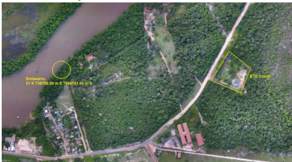
Figura 3a 3: Vista aérea da ETE Coxim e entorno, Coxim, MS.