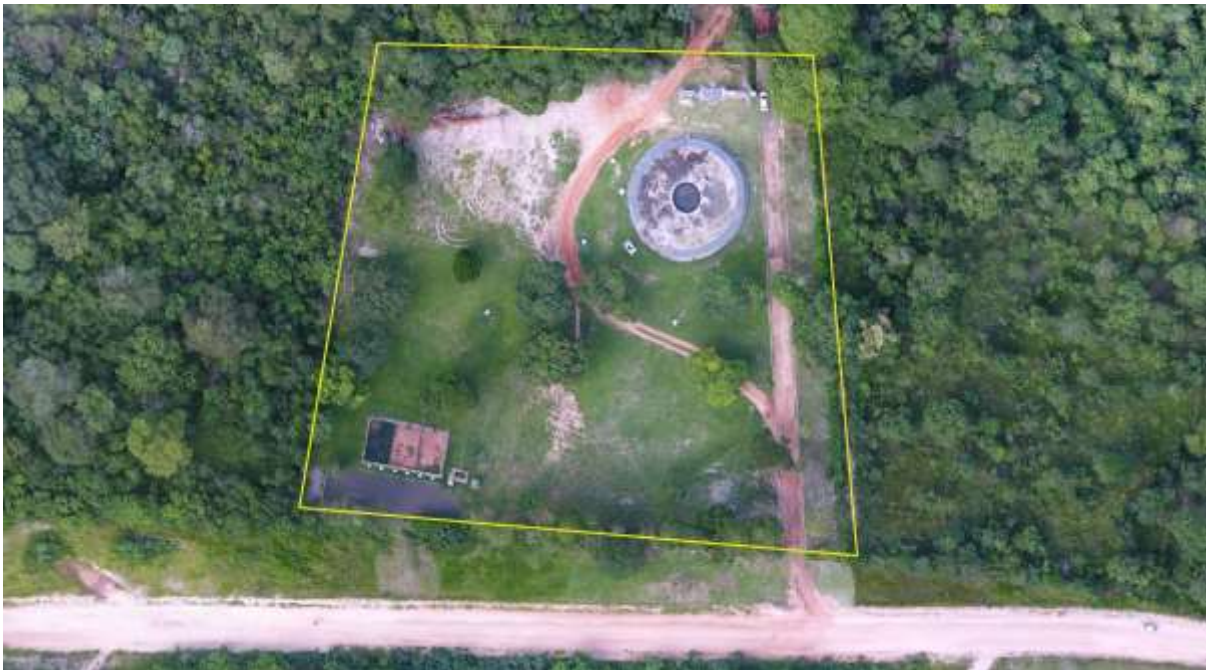
Figura 2: Vista aérea da ETE Coxim, Coxim, MS.

A ETE Coxim está localizada na zona urbana do município na Av. Márcio Lima Nantes, Bairro Vila da Barra, coordenadas geográficas UTM (21K) 736.803 E / 7.954.771 S, distante 370 m do corpo receptor. Encontra-se totalmente cercada, com algumas árvores em seu interior e com cortina arbórea constituída de eucaliptos (Figuras 2 e 3).