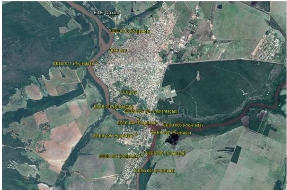
Figura 1: Localização das Unidades Operacionais existentes e projetadas na cidade de Coxim, MS.

A cidade de Coxim possui uma Estação de Tratamento de Esgoto (ETE) e duas Estações Elevatórias de Esgoto Bruto (EEEB) em operação, e uma Estação Elevatória de Esgoto Bruto (EEEB) em implantação. Possui, ainda, áreas selecionadas para a implantação de 10 Estações Elevatórias de Esgoto Bruto (EEEB) projetadas (Figura 1).