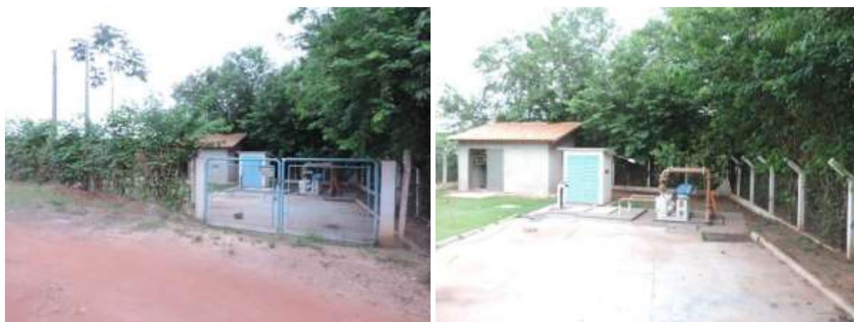
Figura 6: Vista geral da EEEB 009, Coxim, MS.

A EEEB 009 localiza-se na Rua 11 de Abril no Bairro Lagoa Dourada, com coordenadas geográficas UTM (21 K) 737.674 E / 7.951.423 S, completamente cercada por cercas e portão com trancas, tendo como função terminal para ETE Coxim (Figura 6). Não possui informação sobre extravasor.