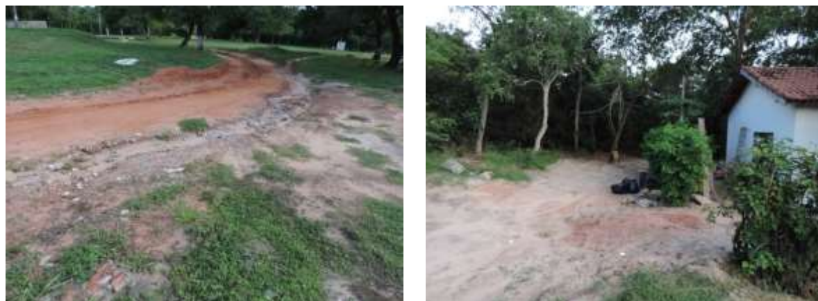
Figura 5: Vias internas degradadas e solo exposto na ETE Coxim, Coxim, MS.

A ETE Coxim apresenta início de processos erosivos devido à falta de manutenção de suas vias internas. Foram encontradas também grandes porções do terreno com solo exposto (Figura 5).