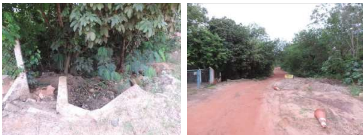
Figura 7: Processo erosivo no entorno da EEEB 009, Coxim, MS.

Não foram identificados passivos ambientais decorrentes de vazamento e de acondicionamento de resíduos sólidos na área da EEEB. Entretanto, foi identificado um processo erosivo no entorno da EEEB (Figura 7).