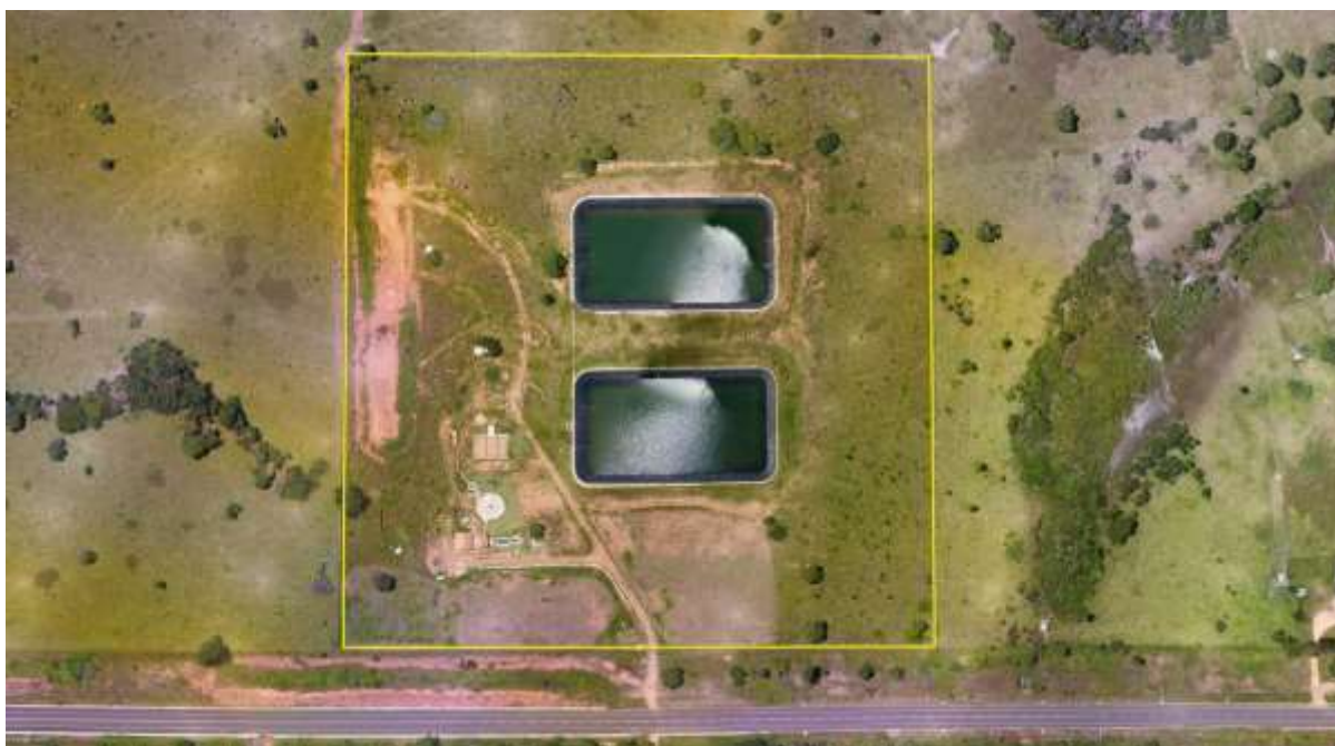
Figura 2: Acima: Vista aérea da ETE Alcínópolis em implantação, Alcínópolis, MS