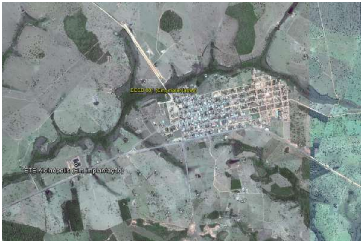
Figura 1: Localização das Unidades Operacionais existentes e projetadas na cidade de Alcinópolis, MS.

A cidade de Alcinópolis possui uma Estação de Tratamento de Esgotos (ETE) e uma Estação Elevatória de Esgoto Bruto (EEEB), ambas em implantação (Figura 1). Não possui nenhuma Unidade Operacional projetada.