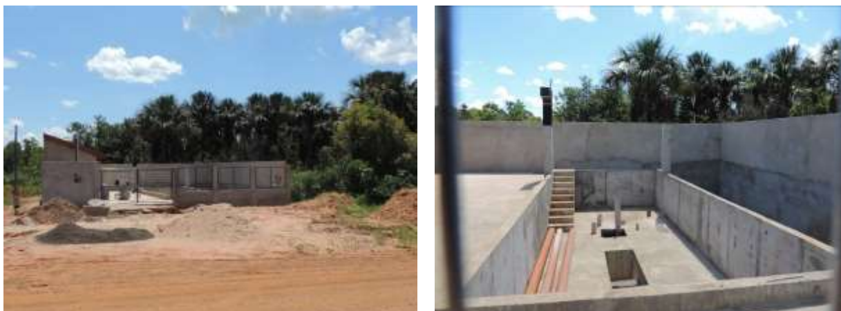
Figura 5: Vista geral da EEEB 001 em implantação, Alcinoópolis, MS.

A EEEB 001 em implantação, de acordo com o Sistema Interativo de Suporte ao Licenciamento Ambiental (SISLA) de MS, não se sobrepõe a nenhuma Unidade de Conservação ou Zonas de Amortecimento, nem a Terras Indígenas, Áreas de Perambulação, Quilombolas e Assentamentos Rurais.