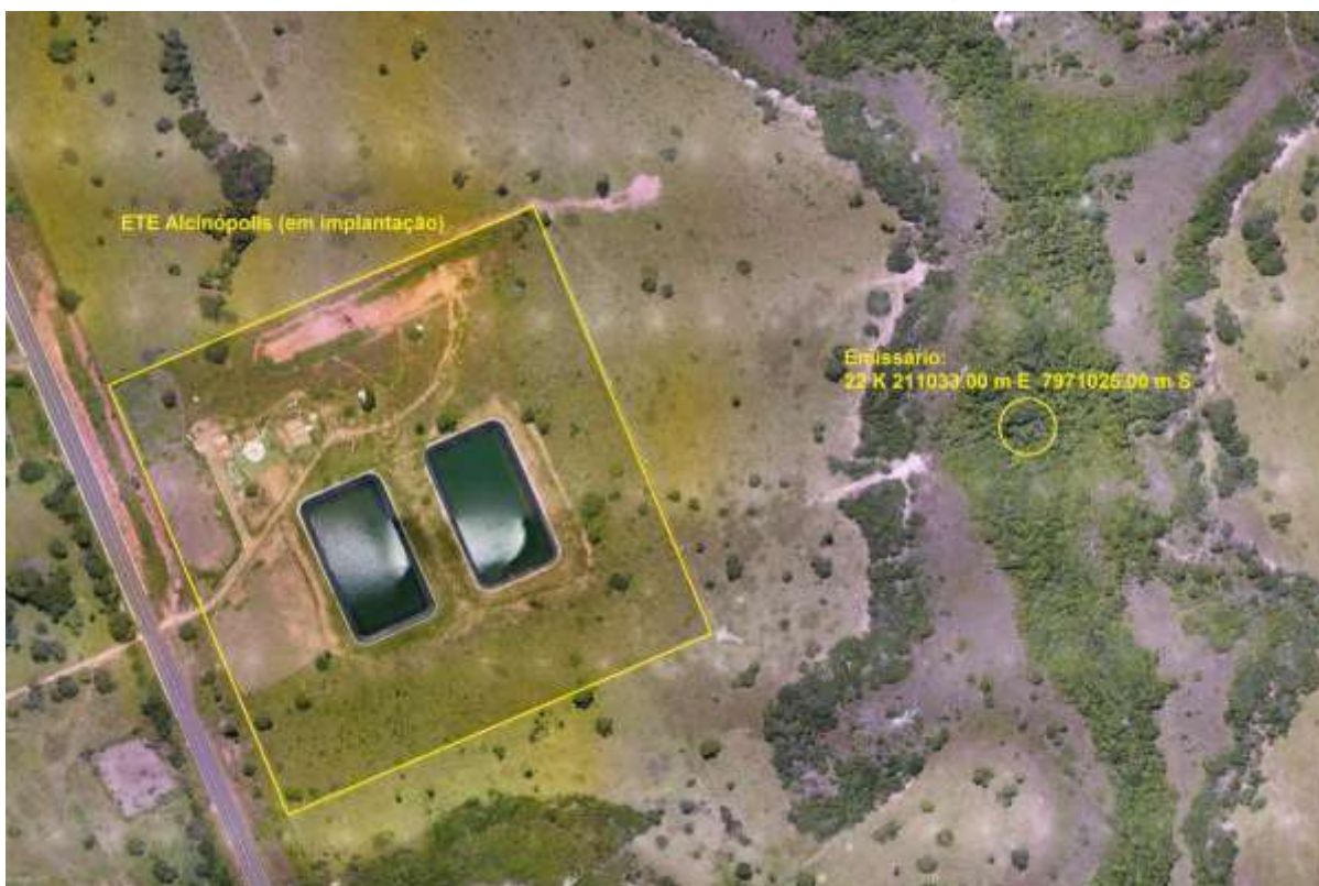
Figura 3: Vista aérea da ETE Alcínópolis em implantação e entorno, Alcínópolis, MS.

A ETE Alcínópolis em implantação, de acordo com o Sistema Interativo de Suporte ao Licenciamento Ambiental (SISLA) de MS, não se sobrepõe a nenhuma Unidade de Conservação ou Zonas de Amortecimento, nem a Terras Indígenas, Áreas de Perambulação, Quilombolas e Assentamentos Rurais (Figura 4).