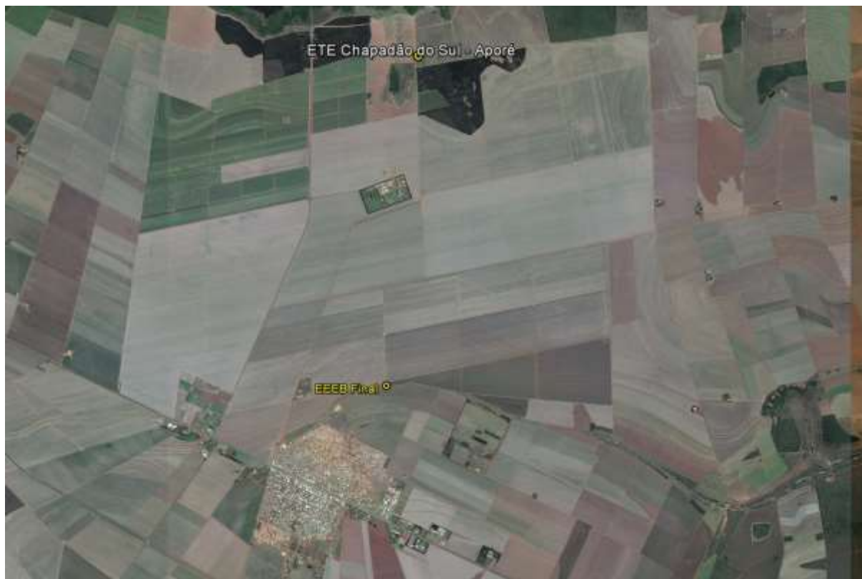
Figura 1: Localização das Unidades Operacionais existentes e projetadas na cidade de Chapadão do Sul, MS

A cidade de Chapadão do Sul possui uma Estação de Tratamento de Esgotos (ETE) e uma Estação Elevatória de Esgoto Bruto (EEEB), todas em operação (Figura 1). Não possui Unidades Operacionais projetadas.