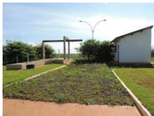
Figura 5: Vista geral da EEEB 001, Chapadão do Sul, MS