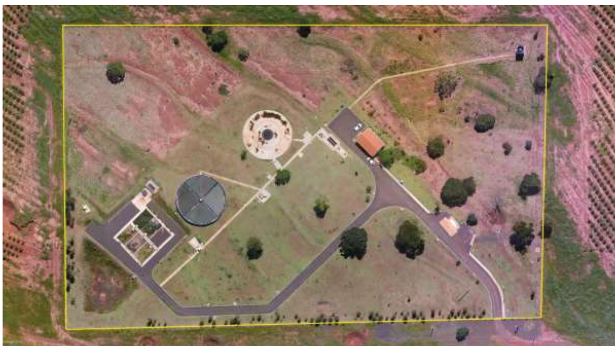
Figura 2: Vista aérea da ETE Aporé, Chapadão do Sul, MS