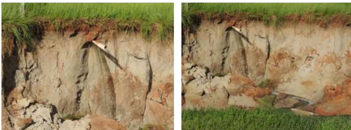
Figura 5: As imagens apresentam o emissário da ETE Brasilândia.

Outra constatação é o baixo volume de água do corpo receptor, que possivelmente não tem capacidade para receber o esgoto tratado e se auto depurar.