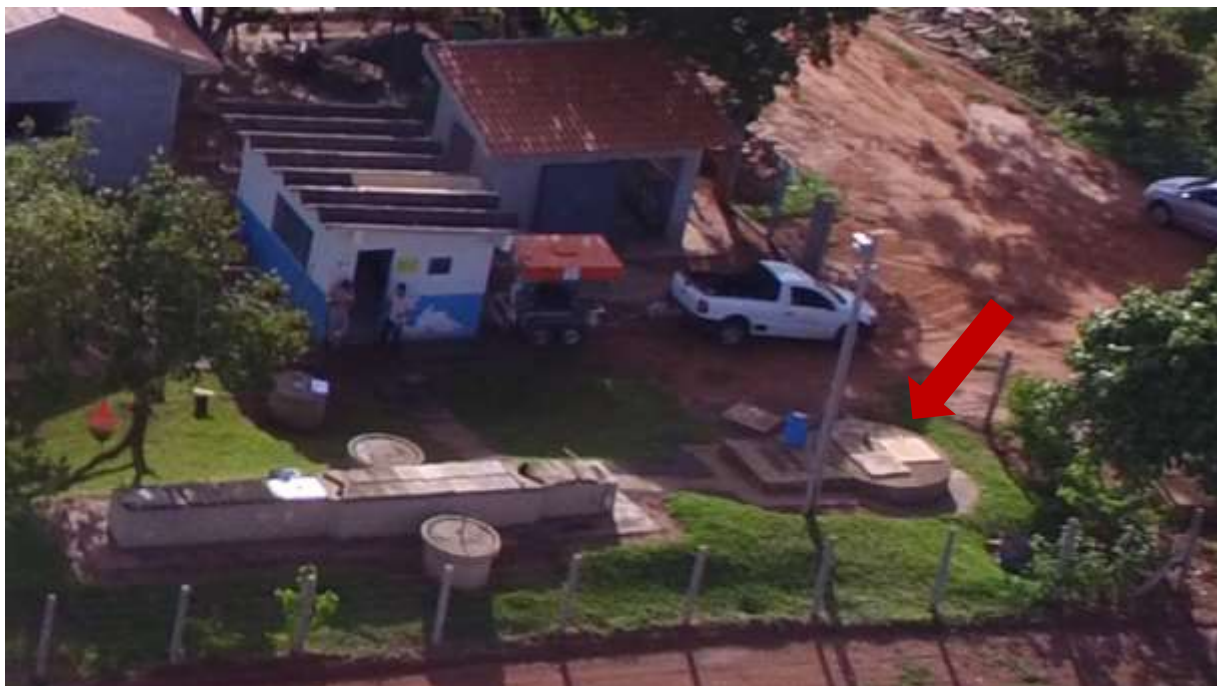
Figura 6: Localização da EEEB Final na área da ETE, Brasilândia, MS.

A EEEB Final, elevatória subterrânea, localiza-se na área rural de Brasilândia no interior da ETE, coordenadas geográficas UTM (22 K) 392.476 E / 7.648.310 S, que terá função de recalque do esgoto o esgoto afluente para o desarenador. Encontra-se parcialmente cercada, com portão de grade e tranca. (Figura 6). Não possui informações sobre extravasor.