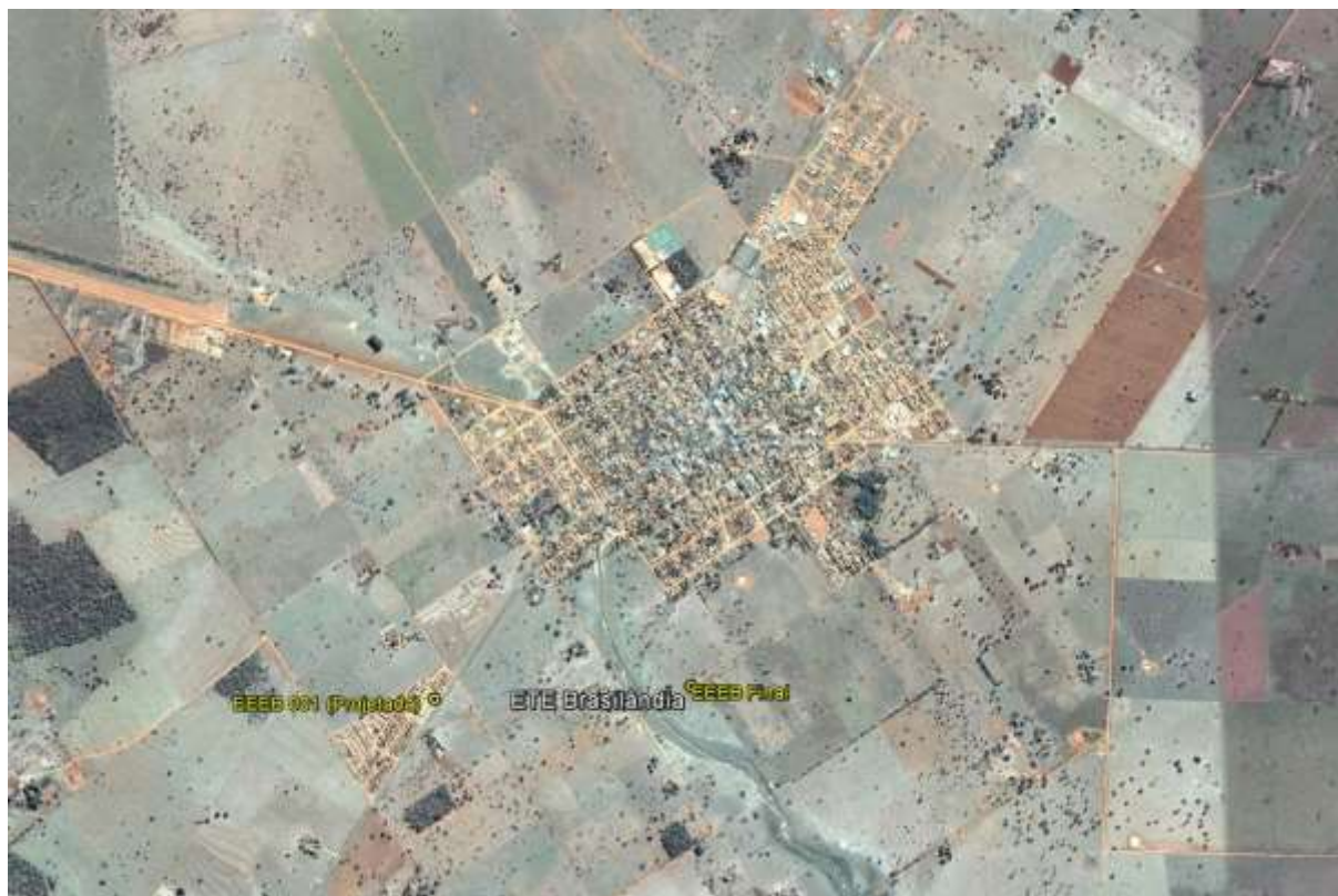
Figura 1: Localização das Unidades Operacionais existentes e projetadas na cidade de Brasilândia, MS.

A cidade de Brasilândia possui uma Estação de Tratamento de Esgotos (ETE) e uma Estação Elevatória de Esgoto Bruto (EEEB), ambas em operação. Possui, ainda, uma área selecionada para a implantação de uma Estação Elevatória de Esgoto Bruto (EEEB) projetada (Figura 1).