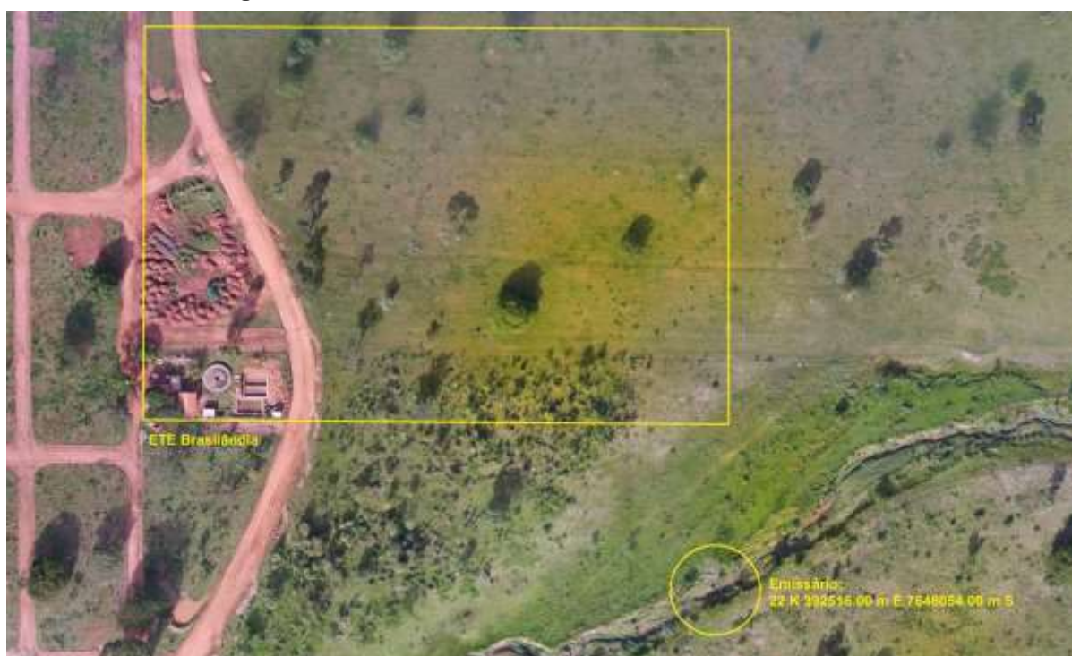
Figura 3: Vista aérea da ETE Brasilândia e entorno, Brasilândia, MS.

A ETE Brasilândia, de acordo com o Sistema Interativo de Suporte ao Licenciamento Ambiental (SISLA) de MS, não se sobrepõe a nenhuma Unidade de Conservação ou Zonas de Amortecimento, nem a Terras Indígenas, Áreas de Perambulação, Quilombolas e Assentamentos Rurais (Figura 4).