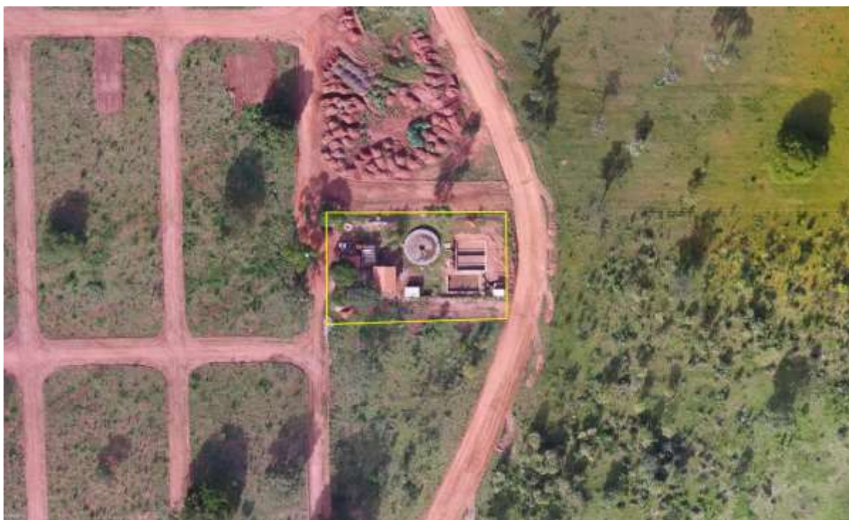
Figura 2: Vista aérea da ETE Brasilândia, Brasilândia, MS.