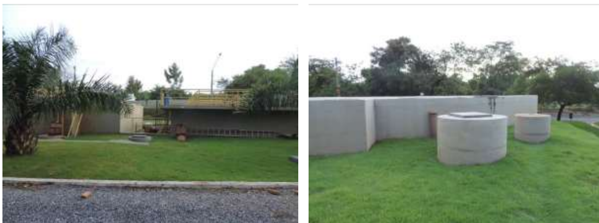
Figura 11: Vista geral da EERL da ETE Bonito, Bonito, MS.

A EERL da ETE Bonito localiza-se pátio da ETE Bonito, coordenadas geográficas UTM (21 K) 555.600 E / 7.663.886 S, com função de bombear o lodo descartado do RALF para os leitos de secagem. Encontra-se completamente cercada por muros, cercas e grades com portão e trancas (Figura 11). Não possui informação sobre extravasor.