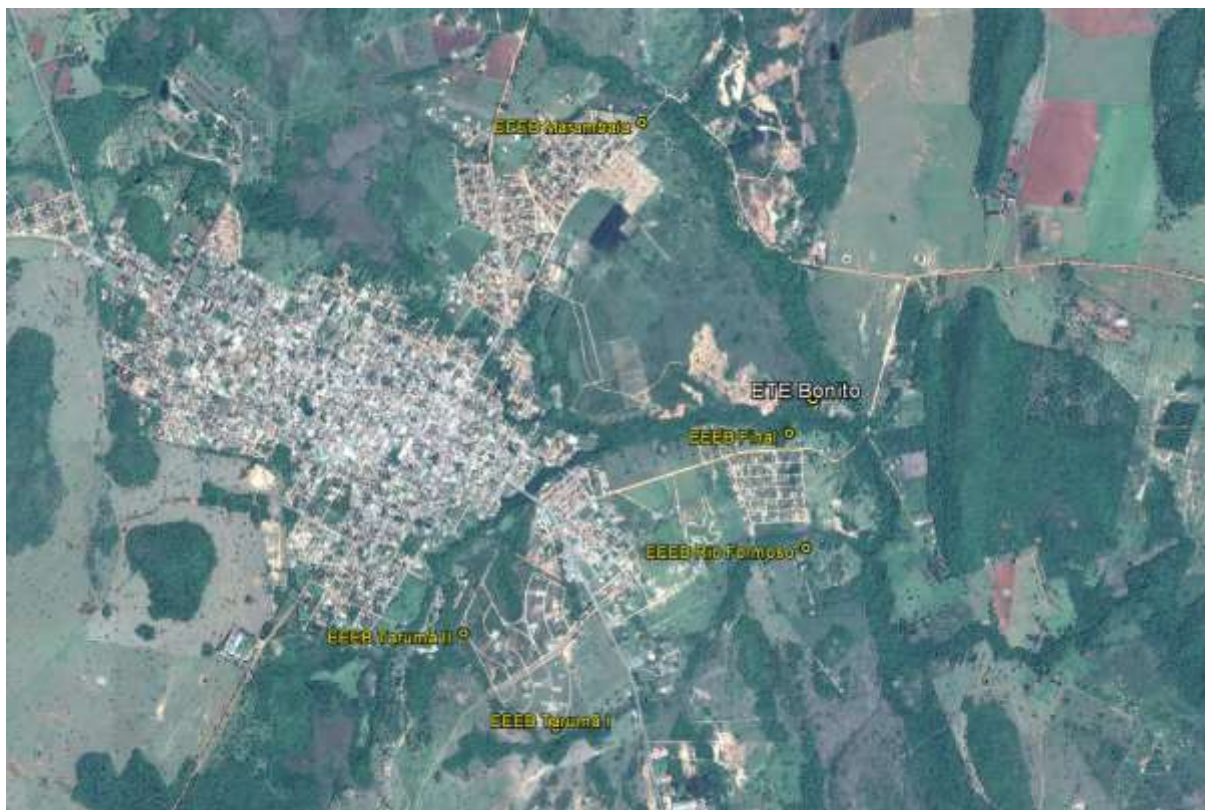
Figura 1: Localização das Unidades Operacionais existentes e projetadas na cidade de Bonito, MS.

A cidade de Bonito possui uma Estação de Tratamento de Esgotos (ETE) e cinco Estações Elevatórias de Esgoto Bruto (EEEB), todas em operação. Não possui Unidades Operacionais projetadas (Figura 1).