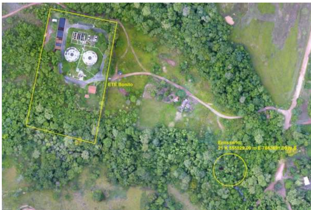
Figura 3: Vista aérea da ETE Bonito e entorno, Bonito, MS.

A ETE Bonito, de acordo com o Sistema Interativo de Suporte ao Licenciamento Ambiental (SISLA) de MS, não se sobrepõe a nenhuma Unidade de Conservação ou Zonas de Amortecimento, nem a Terras Indígenas, Áreas de Perambulação, Quilombolas e Assentamentos Rurais (Figura 4).