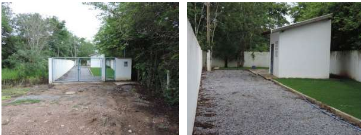
Figura 7: Vista geral da EEEB Portal do Rio Formoso, Bonito, MS.

A EEEB Portal do Rio Formoso localiza-se na Rua Nabileque, S/N, loteamento Portal do Rio Formoso, coordenadas geográficas UTM (21 K) 555.562 E / 7.662.984 S, com a função de bombear o esgoto bruto coletado no loteamento para a ETE. Encontra-se completamente cercada por muros e portão com trancas para veículos e pedestres (Figura 7). Não possui informação sobre extravasor.