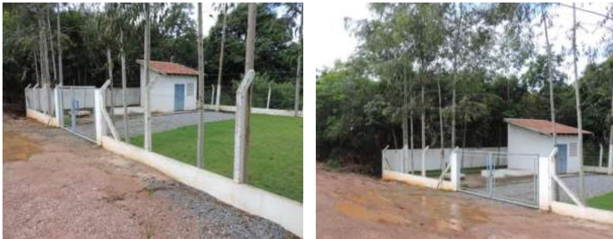
Figura 10: Vista geral da EEEB Tarumã II, Bonito, MS.

A EEEB Tarumã II, de acordo com o Sistema Interativo de Suporte ao Licenciamento Ambiental (SISLA) de MS, não se sobrepõe a nenhuma Unidade de Conservação ou Zonas de Amortecimento, nem a Terras Indígenas, Áreas de Perambulação, Quilombolas e Assentamentos Rurais.