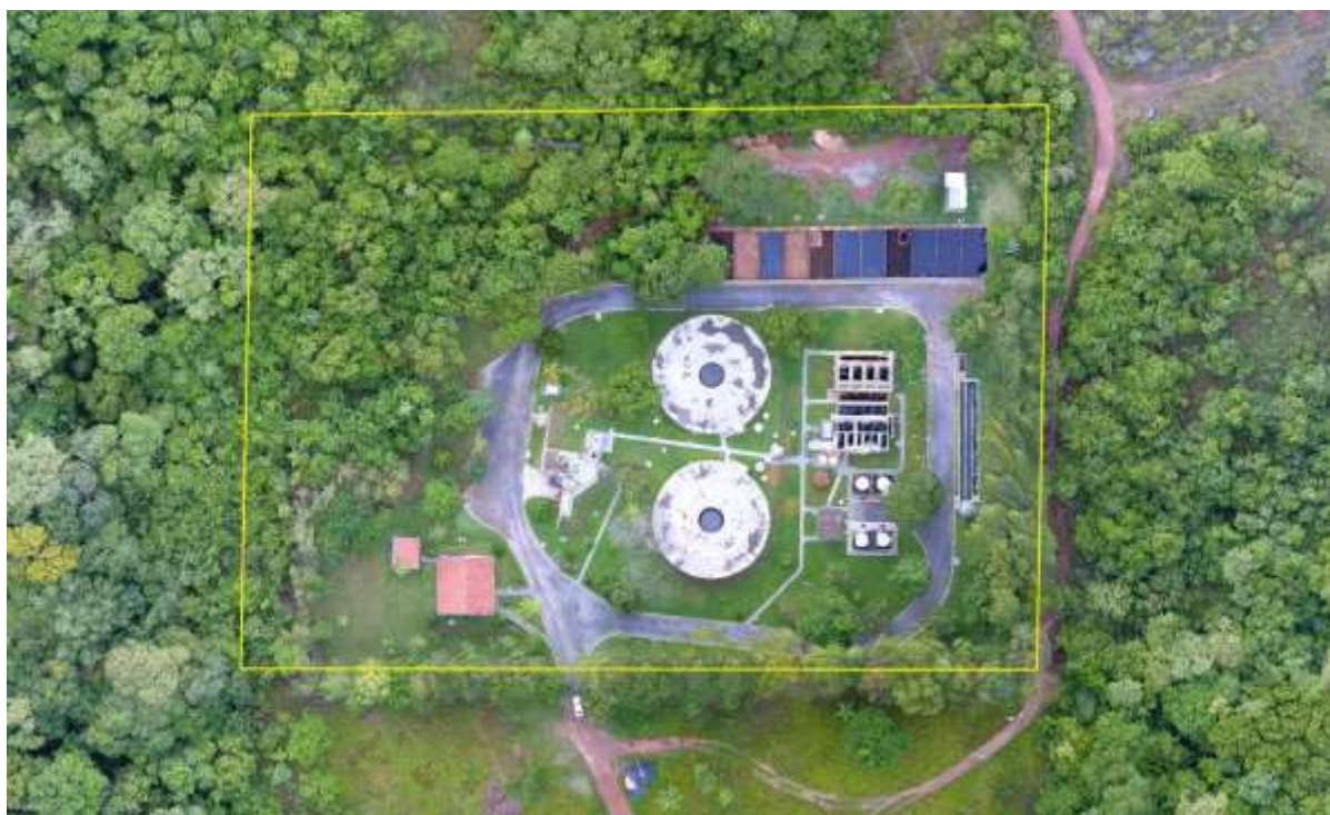
Figura 2: Vista aérea da ETE Bonito, Bonito, MS.