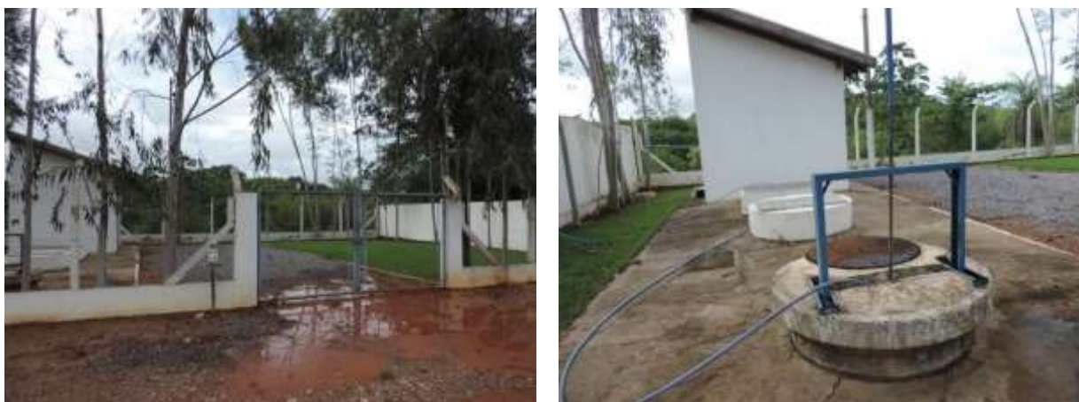
Figura 8: Vista geral da EEEB Tarumã I, Bonito, MS.

A EEEB Tarumã I, de acordo com o Sistema Interativo de Suporte ao Licenciamento Ambiental (SISLA) de MS, não se sobrepõe a nenhuma Unidade de Conservação ou Zonas de Amortecimento, nem a Terras Indígenas, Áreas de Perambulação, Quilombolas e Assentamentos Rurais.