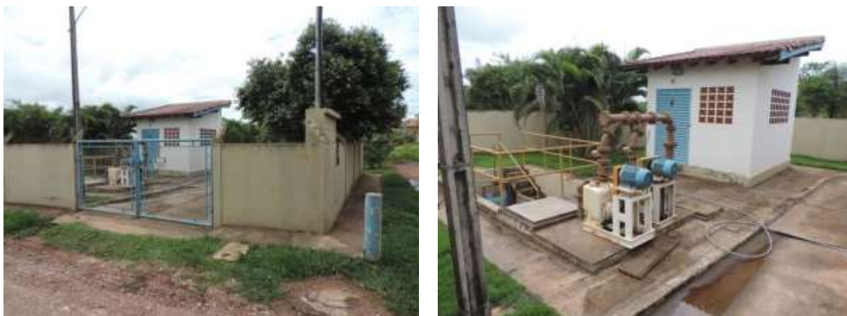
Figura 5: Vista geral da EEBB Marambaia, Bonito, MS.

A EEBB Marambaia, de acordo com o Sistema Interativo de Suporte ao Licenciamento Ambiental (SISLA) de MS, não se sobrepõe a nenhuma Unidade de Conservação ou Zonas de Amortecimento, nem a Terras Indígenas, Áreas de Perambulação, Quilombolas e Assentamentos Rurais.