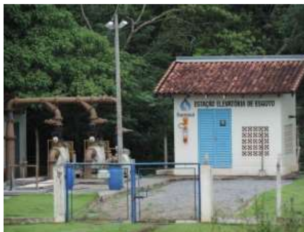
Figura 6: Vista geral da EEEB Final, Bonito, MS.

A EEEB Final, de acordo com o Sistema Interativo de Suporte ao Licenciamento Ambiental (SISLA) de MS, não se sobrepõe a nenhuma Unidade de Conservação ou Zonas de Amortecimento, nem a Terras Indígenas, Áreas de Perambulação, Quilombolas e Assentamentos Rurais.