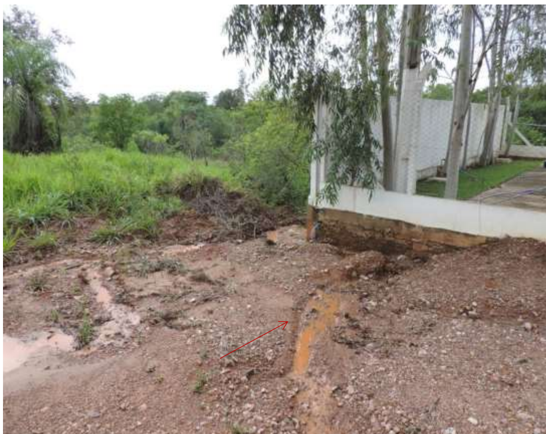
Figura 9: Processo erosivo instalado junto ao muro da EEEB Tarumã I, Bonito, MS.