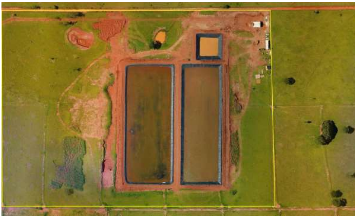
Figura 2: Vista aérea da ETE Batayporã em implantação, Batayporã, MS.

A ETE Batayporã em implantação está localizada na zona rural do município a oeste do perímetro urbano, no Sítio São Mateus, a cerca de 500 metros do corpo receptor, nas coordenadas geográficas UTM (22K) 264.207 E / 7.530.995 S (Figuras 2 e 3).