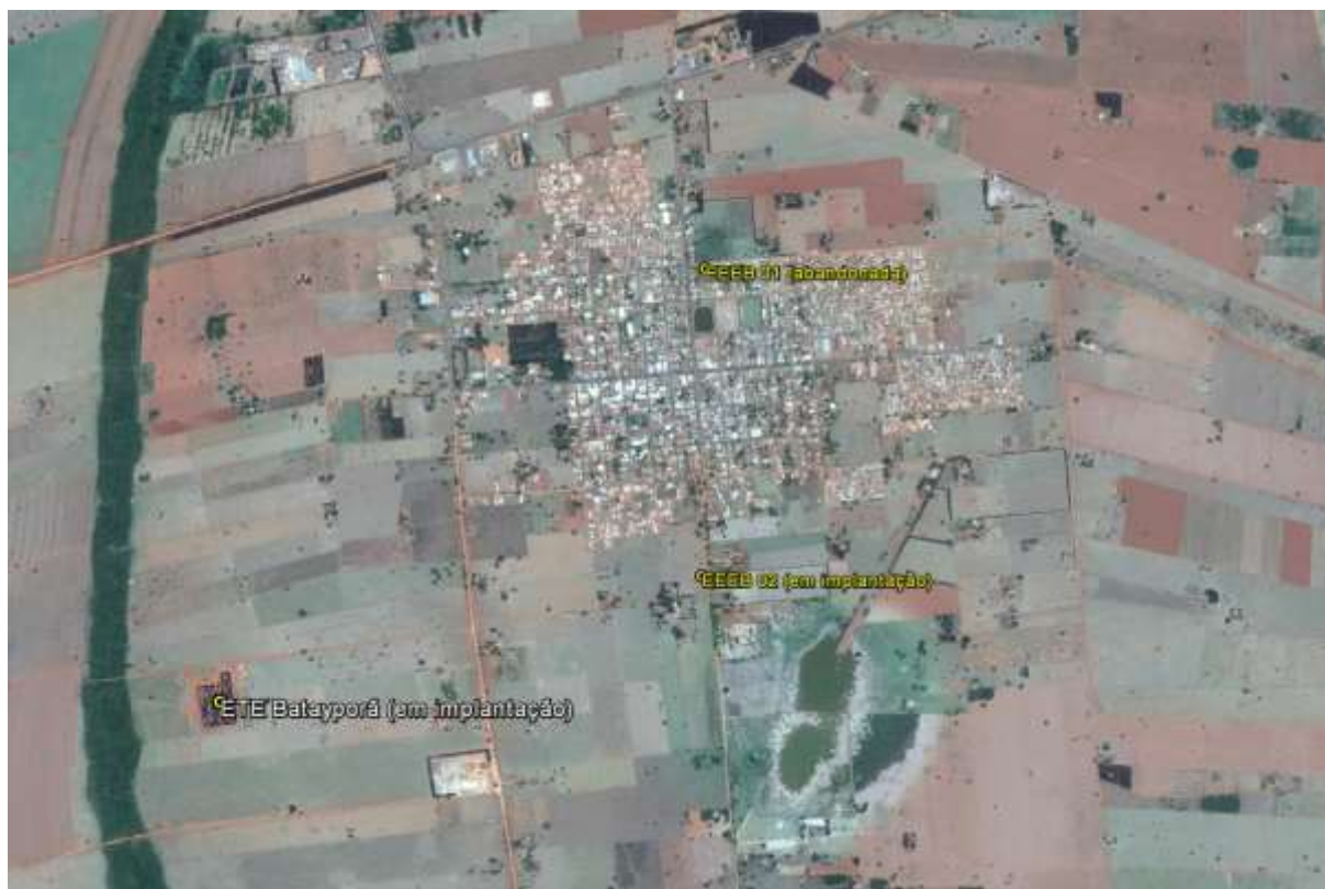
Figura 1: Localização das Unidades Operacionais existentes e projetadas na cidade de Batayporã, MS.

A cidade de Batayporã possui uma Estação de Tratamento de Esgoto (ETE) e uma Estação Elevatória de Esgoto Bruto (EEEB), ambas em implantação. Possui, ainda, uma Estação Elevatória de Esgoto Bruto (EEEB) implantada, mas não em operação (Figura 1). Não possui Unidades Operacionais projetadas.