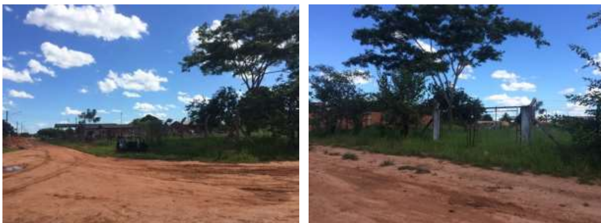
Figura 5: Vista geral da EEEB 001, Batayporã, MS.

A EEEB 001, de acordo com o Sistema Interativo de Suporte ao Licenciamento Ambiental (SISLA) de MS, não se sobrepõe a nenhuma Unidade de Conservação ou Zonas de Amortecimento, nem a Terras Indígenas, Áreas de Perambulação, Quilombolas e Assentamentos Rurais.