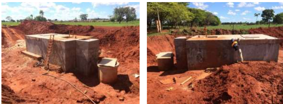
Figura 6: Vista geral da EEEB 002 em implantação, Batayporã, MS.

A EEEB 002 em implantação, de acordo com o Sistema Interativo de Suporte ao Licenciamento Ambiental (SISLA) de MS, não se sobrepõe a nenhuma Unidade de Conservação ou Zonas de Amortecimento, nem a Terras Indígenas, Áreas de Perambulação, Quilombolas e Assentamentos Rurais.