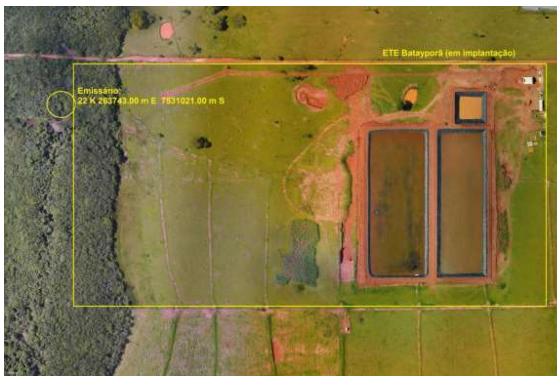
Figura 3: Vista aérea da ETE Batayporã em implantação e entorno, Batayporã, MS.

A ETE Batayporã em implantação, de acordo com o Sistema Interativo de Suporte ao Licenciamento Ambiental (SISLA) de MS, não se sobrepõe a nenhuma Unidade de Conservação ou Zonas de Amortecimento, nem a Terras Indígenas, Áreas de Perambulação, Quilombolas e Assentamentos Rurais (Figura 4).