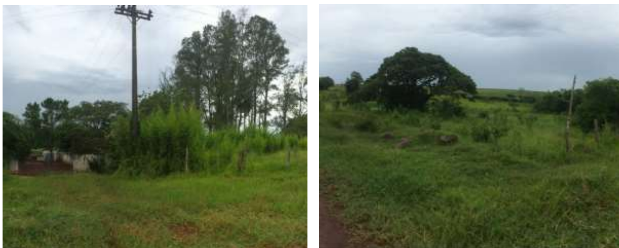
Figura 5: Área prevista para implantação da EEEB 002 Projetada, Aral Moreira, MS.

A EEEB 002 Projetada, elevatória com função de recalque do esgoto bruto para a ETE Aral Moreira, será implantada no prolongamento da Rua Treze de Maio, coordenadas geográficas UTM (21 K) 639.943 E / 7.461.910 S (Figura 5).