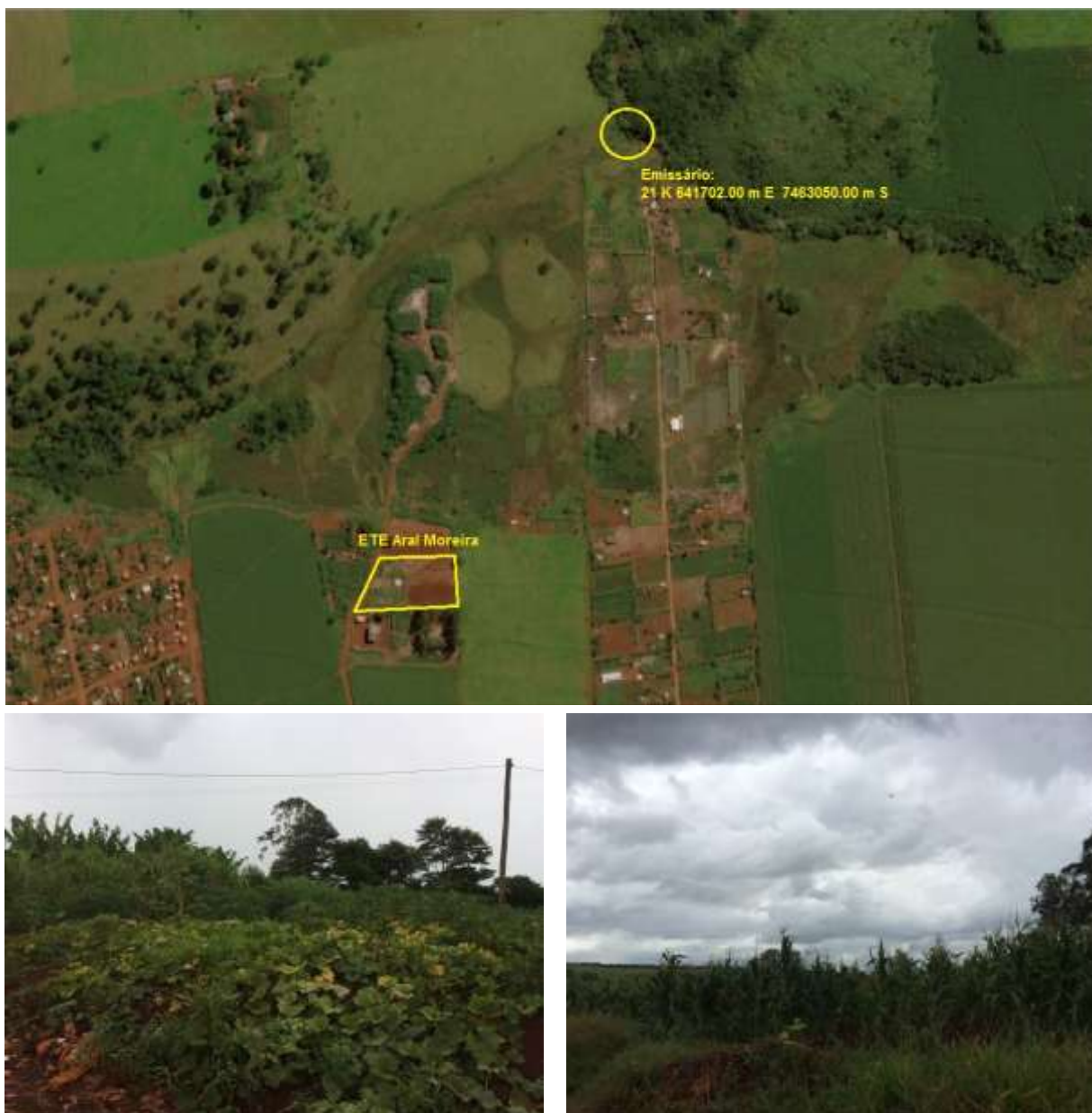
Figura 2: Vista da área da ETE Aral Moreira em implantação, Aral Moreira, MS.

A ETE Aral Moreira em implantação de acordo com o Sistema Interativo de Suporte ao Licenciamento Ambiental (SISLA) de MS, não se sobrepõe a nenhuma Unidade de Conservação, Terras Indígenas, Áreas de Perambulação, Quilombolas e Assentamentos Rurais (Figura 3).