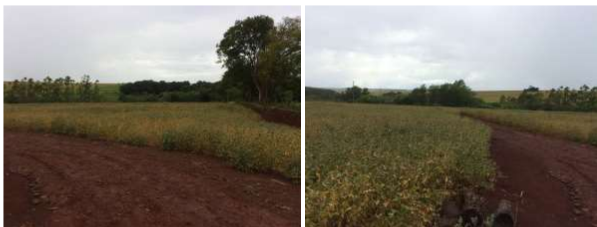
Figura 4: Área prevista para implantação da EEEB 001 Projetada, Aral Moreira, MS.

A EEEB 001 Projetada, elevatória com função de recalque do esgoto bruto para a ETE Aral Moreira, será implantada no prolongamento da Rua Manoel Alves de Oliveira, S/N, coordenadas geográficas UTM (21 K) 641.632 E / 7.460.539 S (Figura 4).