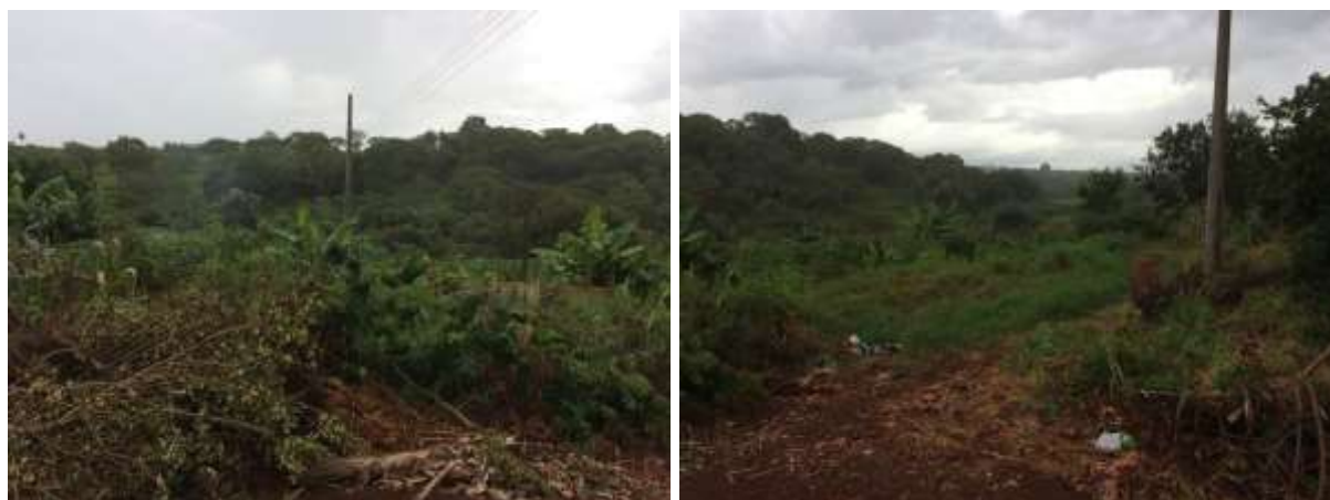
Figura 6: Área prevista para implantação da EEEB 003 Projetada, Aral Moreira, MS.

A EEEB 003 Projetada, de acordo com o Sistema Interativo de Suporte ao Licenciamento Ambiental (SISLA) de MS, não se sobrepõe a nenhuma Unidade de Conservação, Terras Indígenas, Áreas de Perambulação, Quilombolas e Assentamentos Rurais.