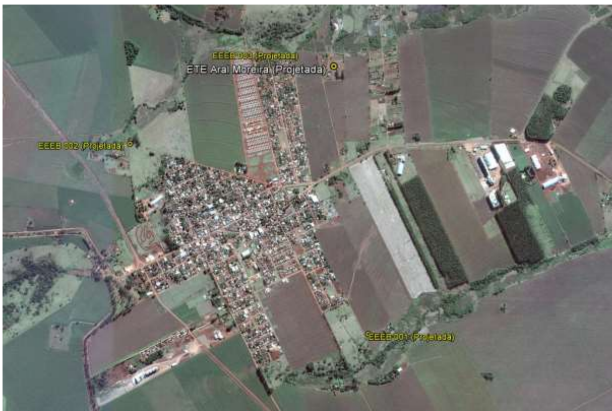
Figura 1: Localização das Unidades Operacionais existentes e projetadas na cidade de Aral Moreira, MS.

A cidade de Aral Moreira possui uma Estação de Tratamento de Esgotos (ETE) em implantação e três Estações Elevatórias de Esgoto Bruto (EEEB) projetadas.