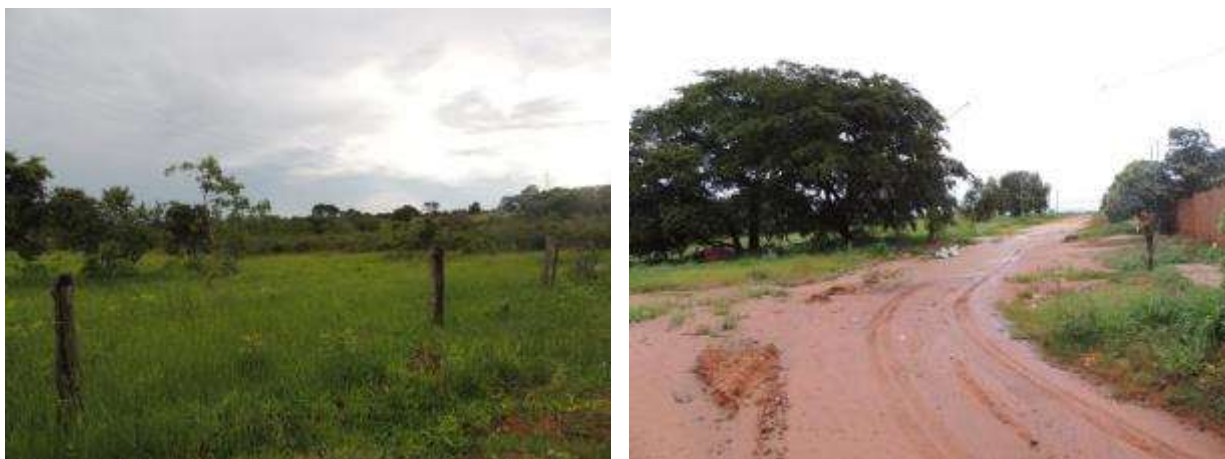
Figura 6: Área prevista para implantação da EEEB 003 Projetada, Água Clara, MS.

A EEEB 003 Projetada, elevatória com função de recalque do esgoto bruto para a EEEB 001 Projetada, será implantada na esquina da Rua Projetada 01 com a Rua A, coordenadas geográficas UTM (22 K) 302.403 E / 7.739.274 S (Figura 6).