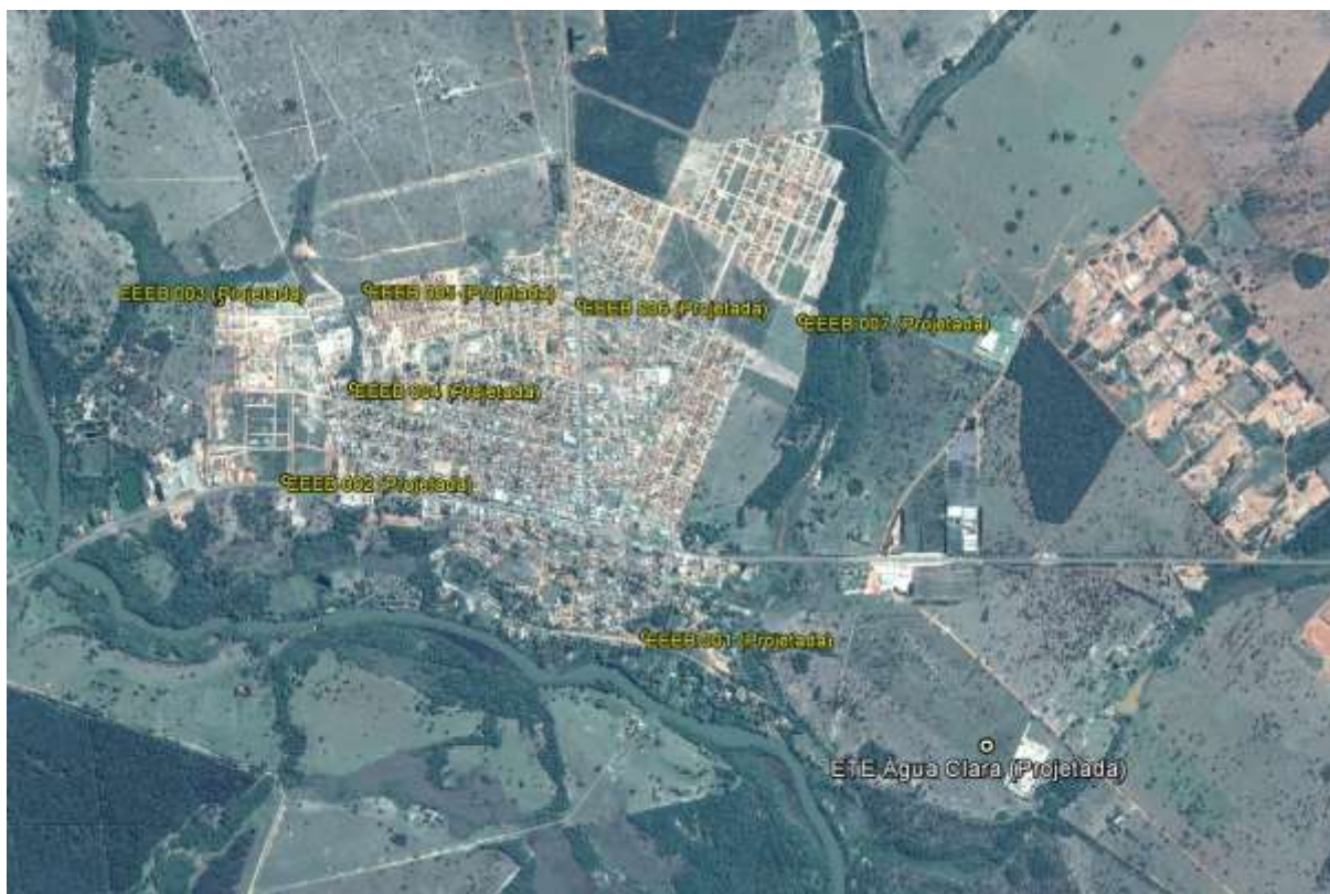
Figura 1: Localização das Unidades Operacionais existentes e projetadas na cidade de Água Clara, MS.

A cidade de Água Clara não possui Sistema de Esgotamento Sanitário (SES), porém possui locais selecionados para a implantação de uma Estação de Tratamento de Esgotos (ETE) e oito Estações Elevatórias de Esgoto Bruto (EEEB) projetadas (Figura 1).