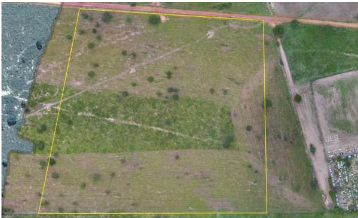
Figura 2: Vista da área pretendida para a ETE Água Clara Projetada, Água Clara, MS.

A ETE Água Clara Projetada será implantada nas coordenadas geográficas UTM (22 K) 305. 914 E / 7.737.235 S, distante 820 m do corpo receptor. A área é recoberta por gramíneas de pastagem e algumas árvores nativas esparsas (Figuras 2 e 3).