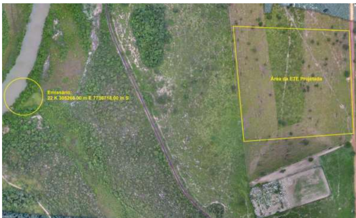
Figura 3: Vista da área pretendida para a ETE Água Clara Projetada e entorno, Água Clara, MS.

A ETE Água Clara Projetada, de acordo com o Sistema Interativo de Suporte ao Licenciamento Ambiental (SISLA) de MS, não se sobrepõe a nenhuma Unidade de Conservação, Terras Indígenas, Áreas de Perambulação, Quilombolas e Assentamentos Rurais (Figura 4).