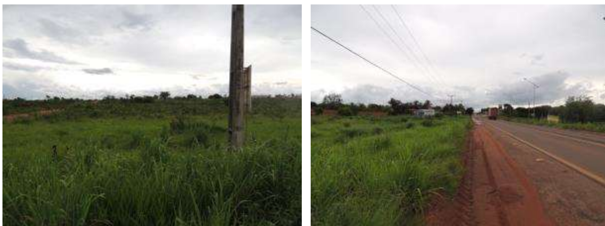
Figura 5: Área prevista para implantação da EEEB 002 Projetada, Água Clara, MS.

A EEEB 002 Projetada, elevatória com função de recalque do esgoto bruto para a EEEB 001 Projetada, será implantada na Avenida Júlio Maia s/n (Rodovia BR-262), coordenadas geográficas UTM (22 K) 302.709 E / 7.738.403 S (Figura 5).