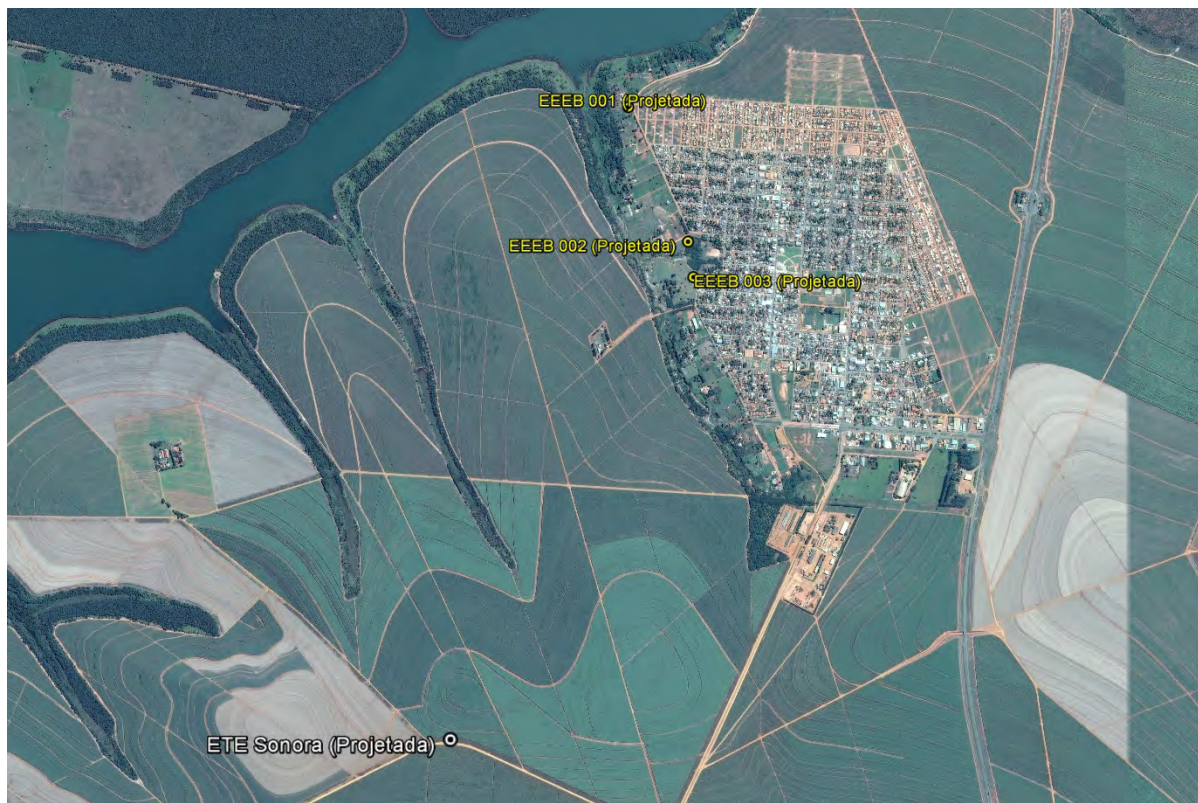
Figura 1: Localização das Unidades Operacionais existentes e projetadas na cidade de Sonora, MS.

A cidade de Sonora não possui Sistema de Esgotamentos Sanitário (SES), porém possui áreas selecionadas para a implantação de uma Estação de Tratamento de Esgoto (ETE) e três Estações Elevatórias de Esgoto Bruto (EEEB) projetadas (Figura 1).