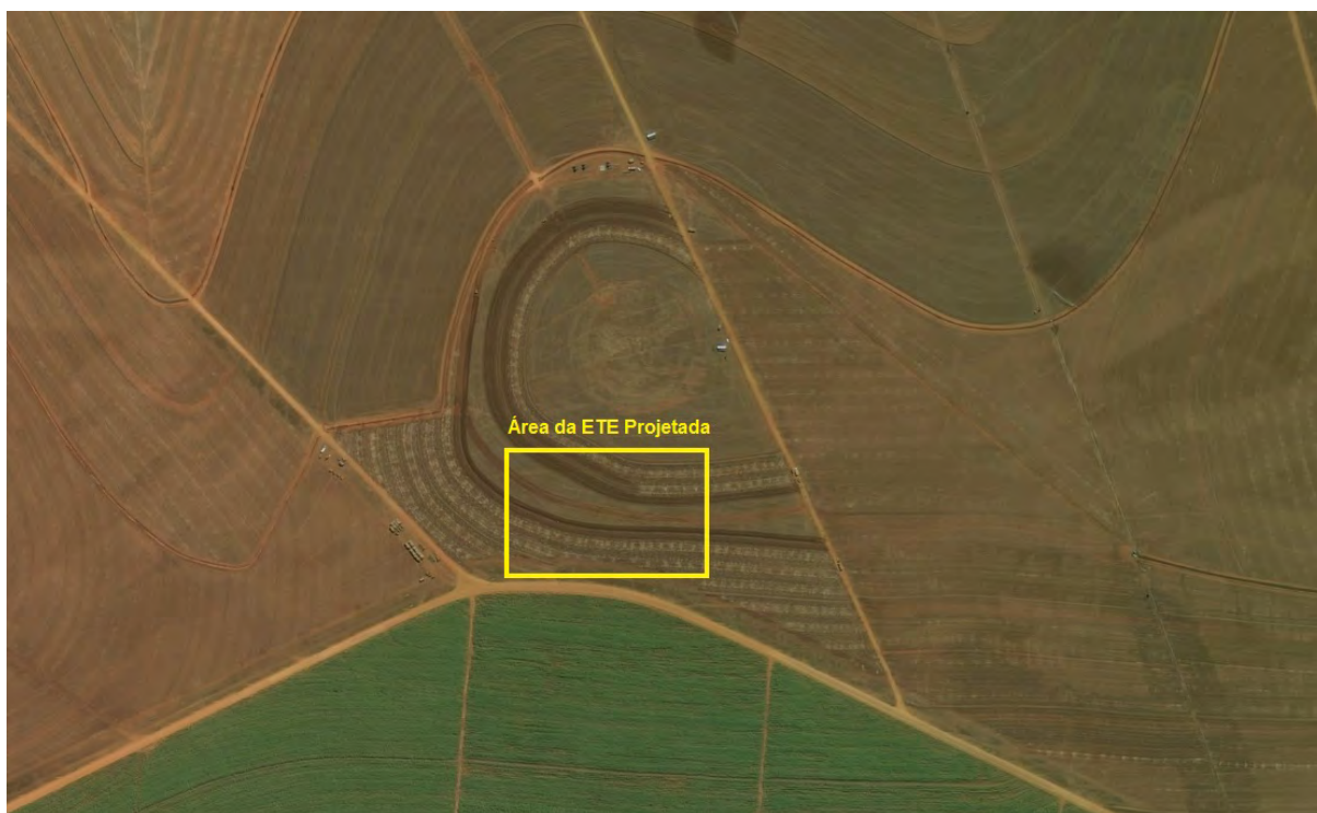
Figura 2: Vista aérea da área da ETE Projetada, Sonora, MS.

O ETE Sonora Projetada, de acordo com o Sistema Interativo de Suporte ao Licenciamento Ambiental (SISLA) de MS, não se sobrepõe a nenhuma Unidade de Conservação ou Zonas de Amortecimento, nem a Terras Indígenas, Áreas de Perambulação, Quilombolas e Assentamentos Rurais (Figura 3).