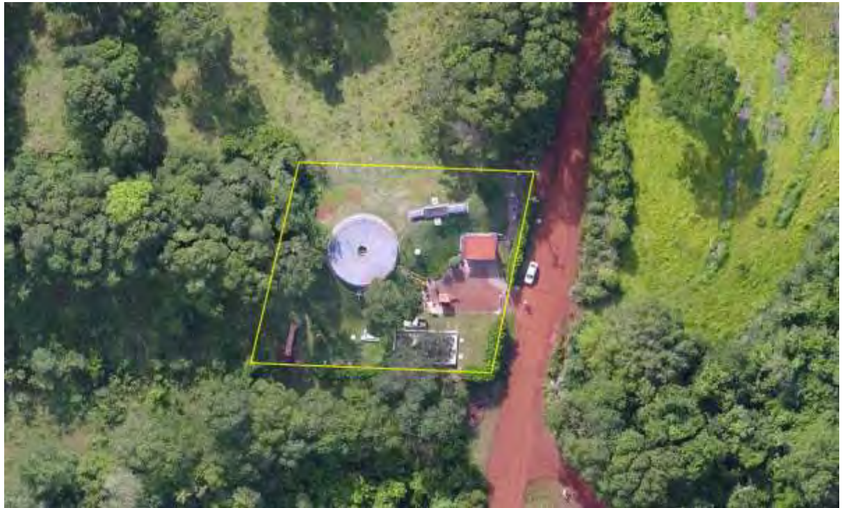
Figura 2: Vista aérea da ETE Rio Brilhante, Rio Brilhante, MS.