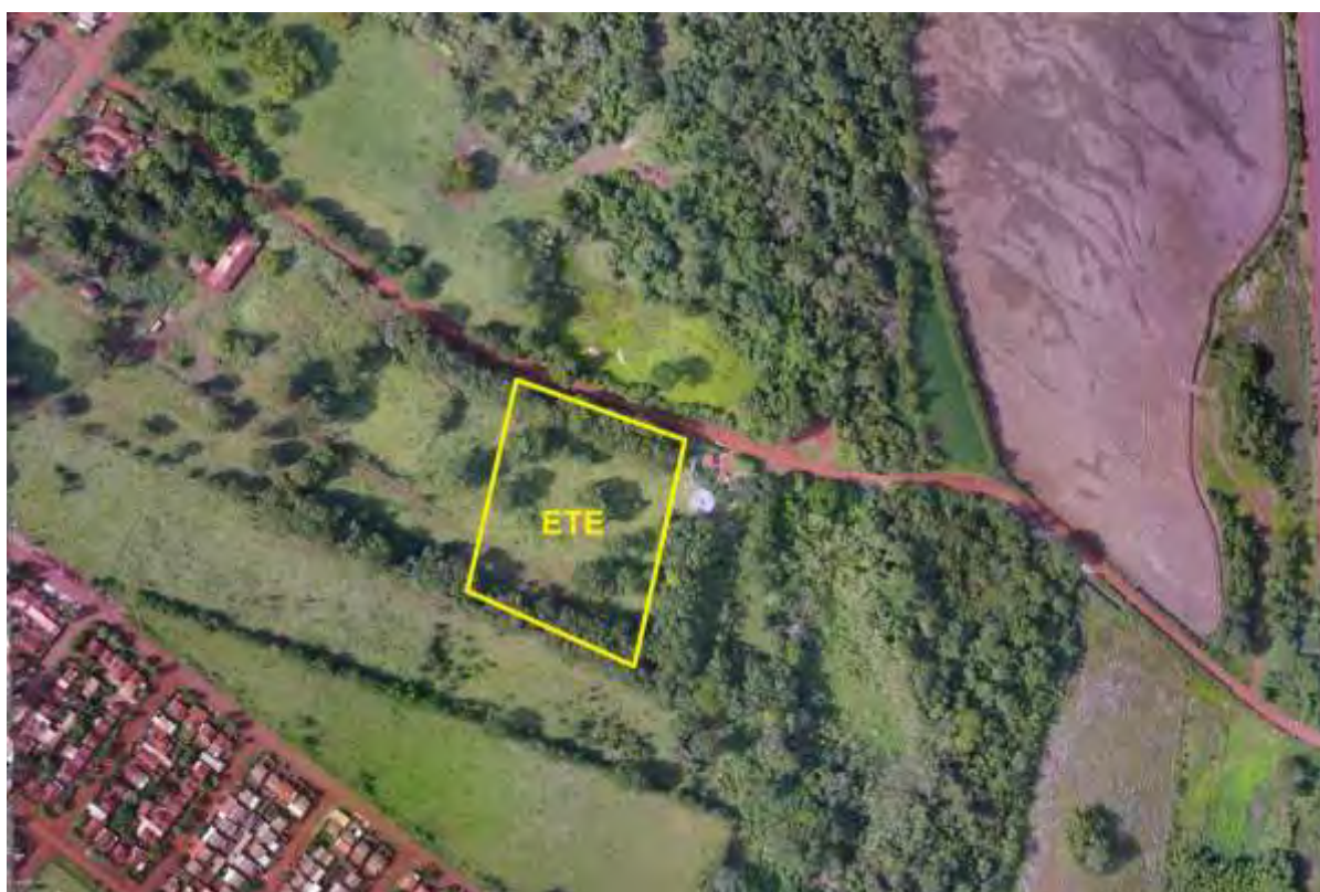
Figura 7: Vista aérea da ETE Rio Brillhante Projetada e entorno, Rio Brillhante, MS.

A ETE Rio Brillhante Projetada está localizada na zona urbana de Rio Brillhante, com acesso pela Rua Juviano Medeiros, coordenadas geográficas UTM (21 K) 755.528 E / 7.586.693 S, distante 90 m do corpo receptor. A área é recoberta por gramíneas de pastagens e vegetação arbórea remanescente (Figura 7).