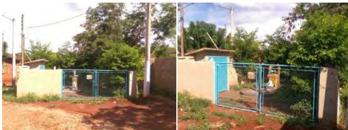
Figura 5: Vista geral da EEEB 002, Rio Brillhante, MS.

A EEEB 002, de acordo com o Sistema Interativo de Suporte ao Licenciamento Ambiental (SISLA) de MS, não se sobrepõe a nenhuma Unidade de Conservação ou Zonas de Amortecimento, nem a Terras Indígenas, Áreas de Perambulação, Quilombolas e Assentamentos Rurais.