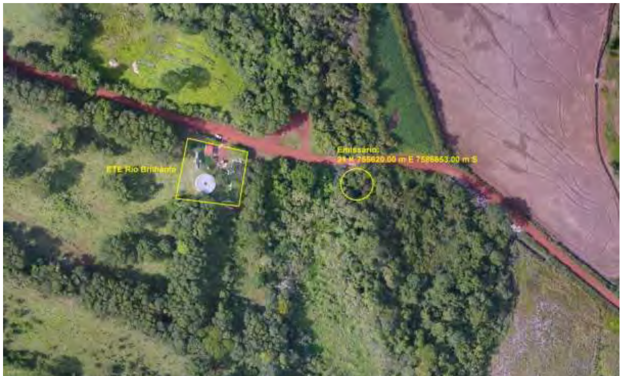
Figura 3: Vista aérea da ETE Rio Brilhante e entorno, Rio Brilhante, MS.

A ETE Rio Brilhante, de acordo com o Sistema Interativo de Suporte ao Licenciamento Ambiental (SISLA) de MS, não se sobrepõe a nenhuma Unidade de Conservação ou Zonas de Amortecimento, nem a Terras Indígenas, Áreas de Perambulação, Quilombolas e Assentamentos Rurais (Figura 4).