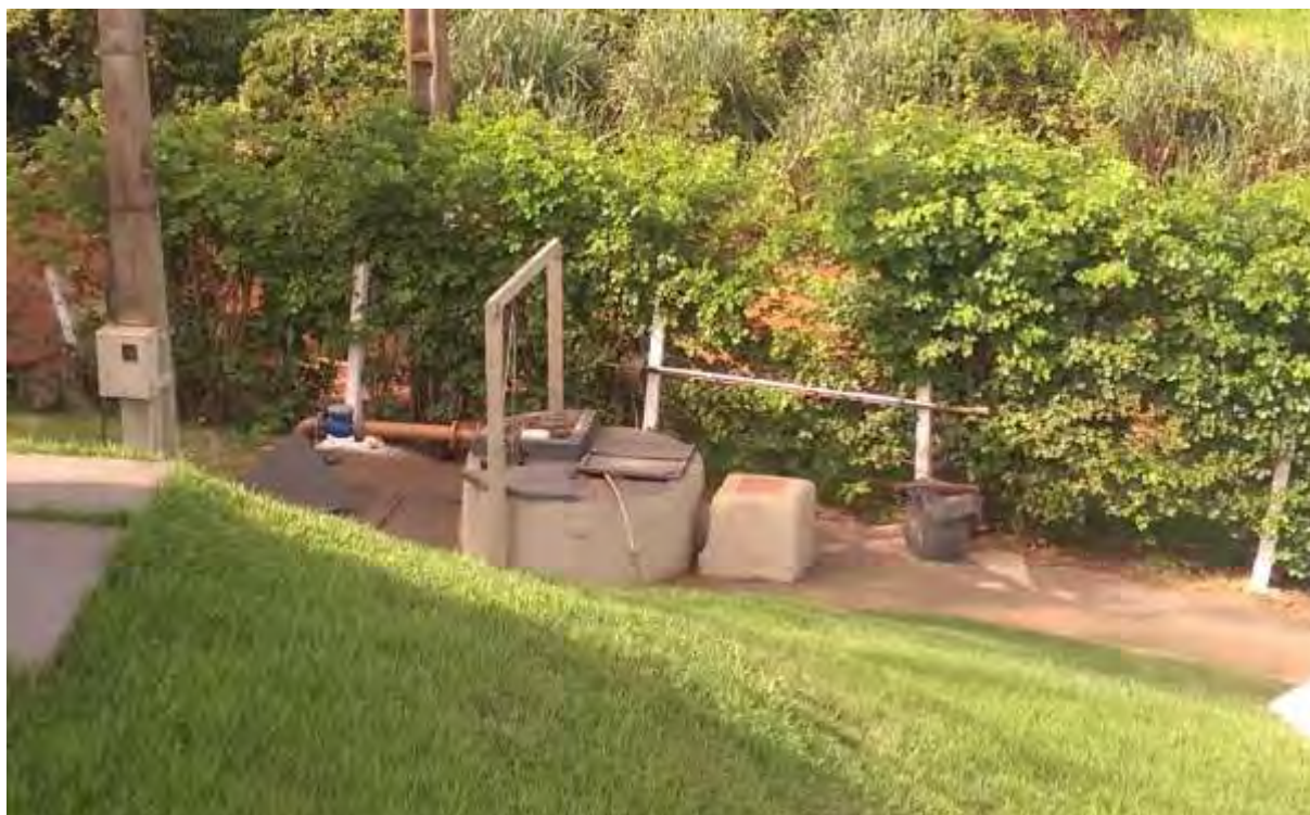
Figura 6: Vista geral da EEEB Final, Rio Brilhante, MS.

A EEEB Final ou 001 localiza-se na zona urbana de Rio Brilhante na área da ETE, coordenadas geográficas UTM (21 K) 755.528 E / 7.586.693 S, com função de recalcar o esgoto bruto para o tratamento preliminar da ETE Rio Brilhante. Encontra-se totalmente cercada com arame e portão com trancas para pedestres, com vegetação esparsa em seu interior e com cortina arbórea em parte do entorno (Figura 6). Não possui informação sobre extravasor.