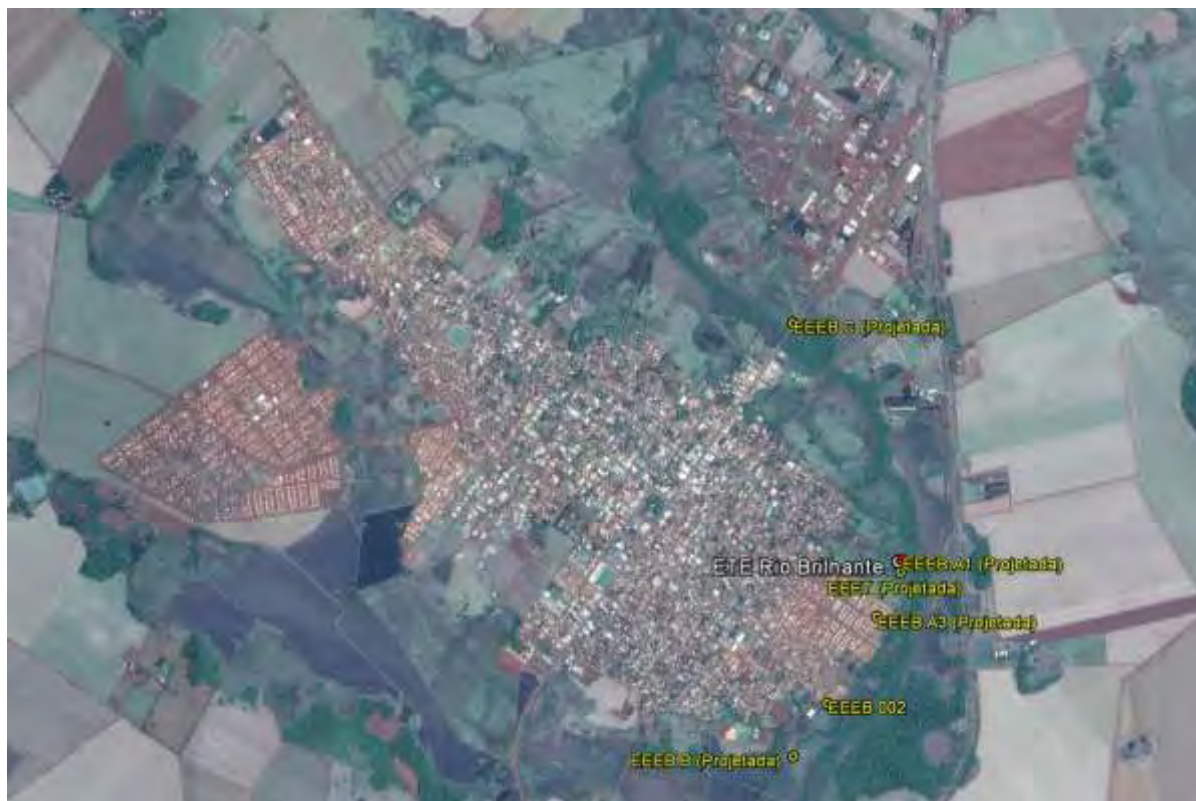
Figura 1: Localização das Unidades Operacionais existentes e projetadas na cidade de Rio Brillhante, MS.

A cidade de Rio Brillhante possui uma Estação de Tratamento de Esgotos (ETE) e duas Estações Elevatórias de Esgoto Bruto (EEEB) em operação. Possui, ainda, áreas selecionadas para a implantação de quatro Estações Elevatórias de Esgoto Bruto (EEEB) e uma Estação Elevatória de Esgoto Tratado (EEET) projetadas, além da implantação de uma Estação de Tratamento de Esgotos (ETE) projetada na mesma localidade da existente (Figura 1).