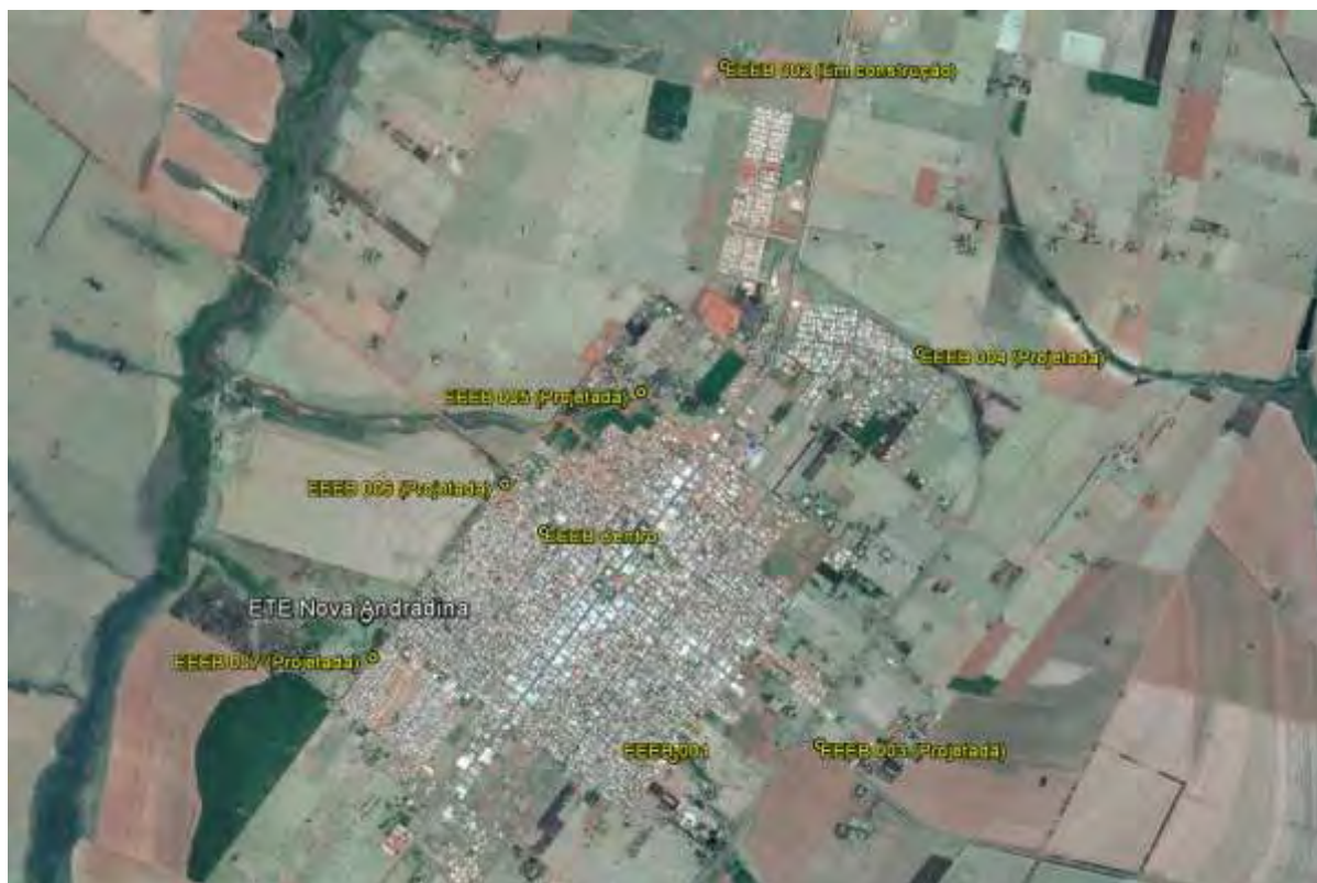
Figura 1: Localização das Unidades Operacionais existentes e projetadas na cidade de Nova Andradina, MS.

A cidade de Nova Andradina possui uma Estação de Tratamento de Esgotos (ETE) e duas Estações Elevatória de Esgoto Bruto (EEEB) em operação. Possui, ainda, áreas selecionadas para a implantação de cinco Estações Elevatória de Esgoto Bruto (EEEB) projetadas (Figura 1).