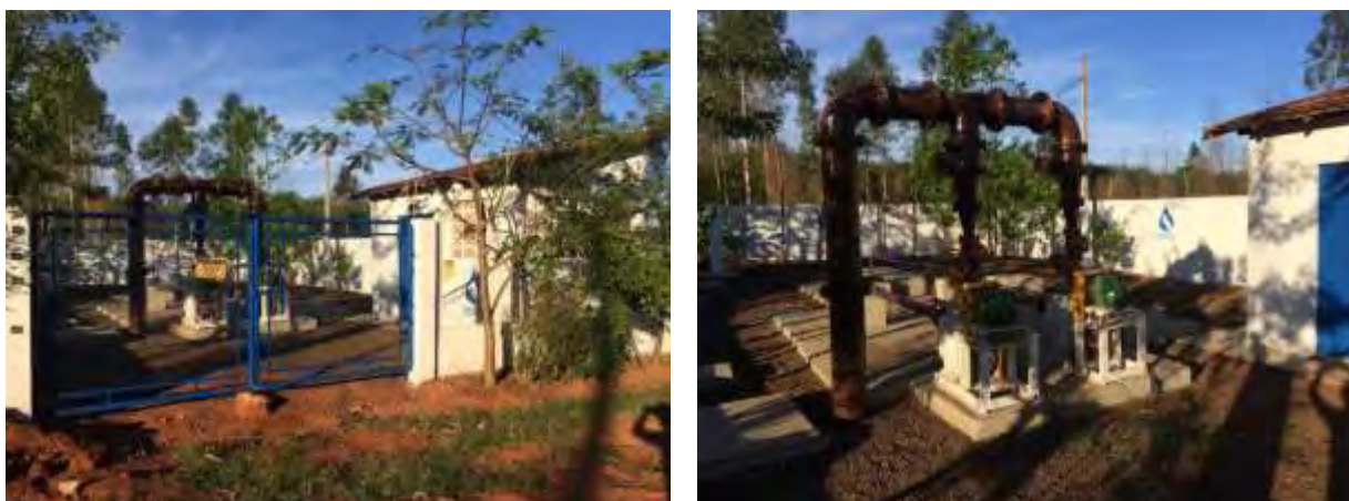
Figura 5: Vista geral da EEEB 001, Nova Andradina, MS.

A EEEB 001, de acordo com o Sistema Interativo de Suporte ao Licenciamento Ambiental (SISLA) de MS, não se sobrepõe a nenhuma Unidade de Conservação ou Zonas de Amortecimento, nem a Terras Indígenas, Áreas de Perambulação, Quilombolas e Assentamentos Rurais.