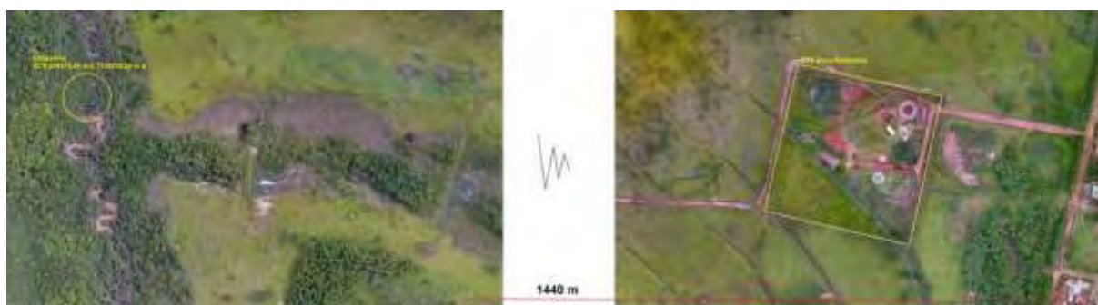
Figura 3: Vista aérea da ETE Nova Andradina e entorno, Nova Andradina, MS.

A ETE Nova Andradina, de acordo com o Sistema Interativo de Suporte ao Licenciamento Ambiental (SISLA) de MS, não se sobrepõe a nenhuma Unidade de Conservação ou Zonas de Amortecimento, nem a Terras Indígenas, Áreas de Perambulação, Quilombolas e Assentamentos Rurais (Figura 4).