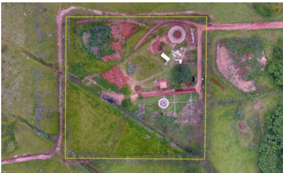
Figura 2: Vista aérea da ETE Nova Andradina, Nova Andradina, MS.