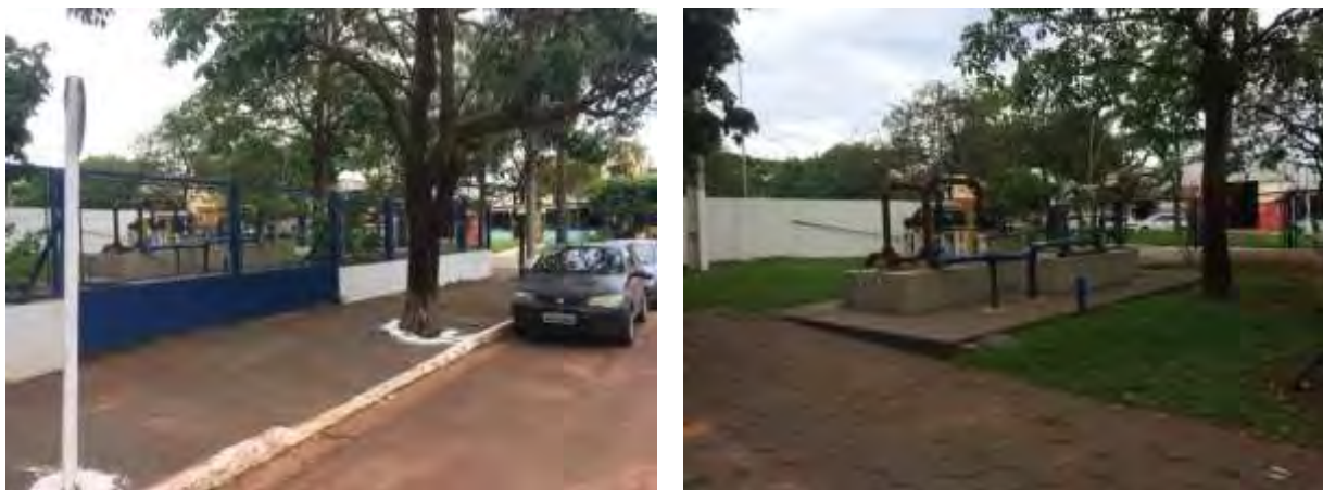
Figura 6: Vista geral da EEEB Centro, Nova Andradina, MS.

A EEEB Centro localiza-se na zona urbana de Nova Andradina, Avenida Eurico Soares Andrade, coordenadas geográficas UTM (22 K) 257.477 m E / 7.538.286 m S, tendo como função a transposição de sub-bacia. Encontra-se totalmente cercada, com árvores esparsas em seu interior e sem cortina arbórea em parte do entorno (Figura 6). Não possui extravasor.