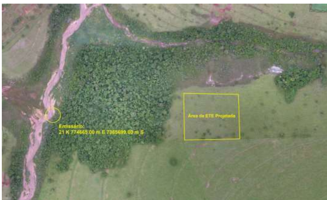
Figura 6: Vista da área pretendida para a ETE Carajá-Cuê Projetada, Eldorado, MS.

A ETE Carajá-Cuê Projetada está localizada na zona rural de Eldorado, coordenadas geográficas UTM (21 K) 774.998 E / 7.365.823 S, distante 330 m do corpo receptor. A área é recoberta por gramíneas de pastagem e contém algumas árvores esparsas (Figura 6).