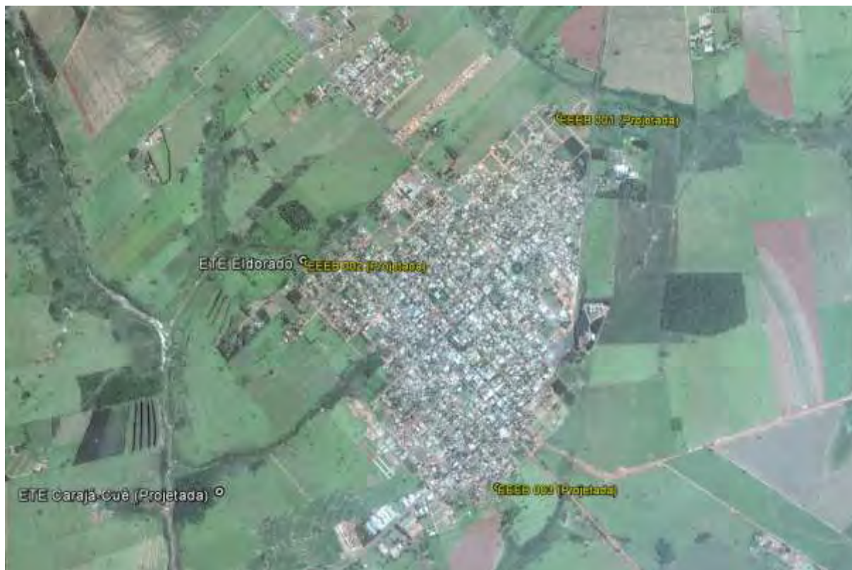
Figura 1: Localização das Unidades Operacionais existentes e projetadas na cidade de Eldorado, MS.

A cidade de Eldorado possui uma Estação de Tratamento de Esgoto (ETE) em operação. Possui, ainda, áreas selecionadas para a implantação de uma Estação de Tratamento de Esgoto (ETE) e três Estações Elevatórias de Esgoto Bruto (EEEB) projetadas (Figura 1).