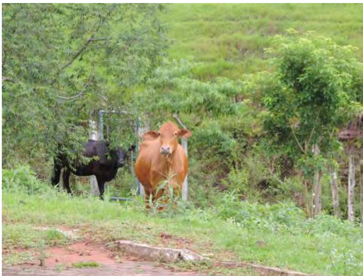
Figura 5: Presença de bovinos no interior da ETE Eldorado, Eldorado, MS.