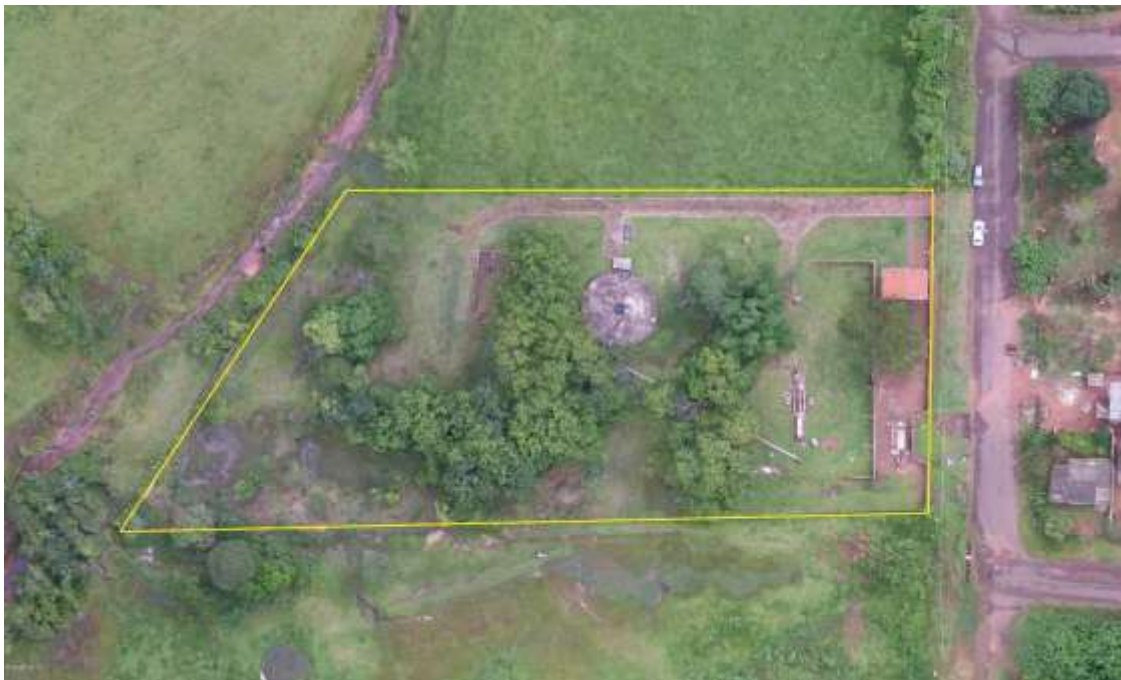
Figura 2: Vista aérea da ETE Eldorado, Eldorado, MS.

A ETE Eldorado está localizada na zona urbana de Eldorado na Rua Adolfo Amaral, coordenadas geográficas UTM (21K) 775.598 E / 7.367.382 S, distante 90 m do corpo receptor. Encontra-se totalmente cercada com alambrado e cercas com arame liso, com árvores em seu interior e sem cortina arbórea no entorno (Figuras 2 e 3).