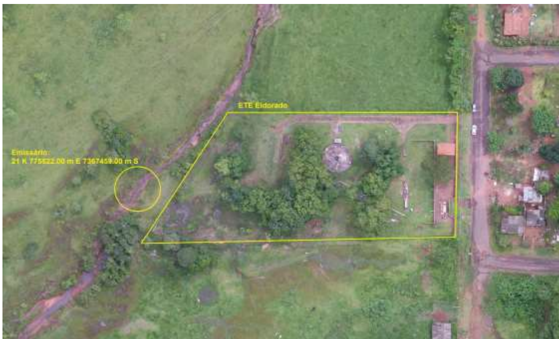
Figura 3: Vista aérea da ETE Eldorado e entorno, Eldorado, MS.