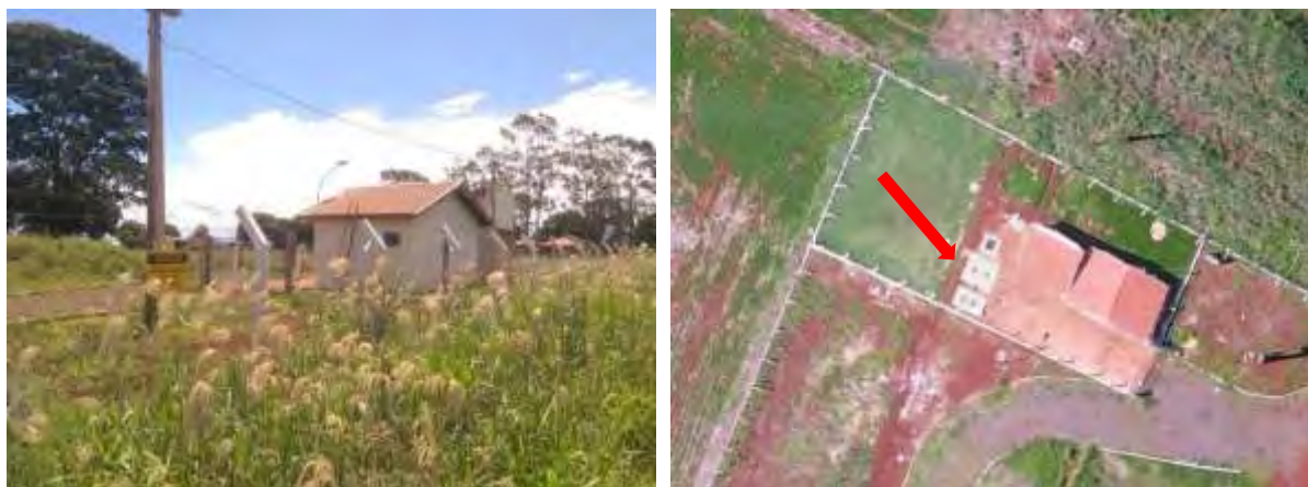
Figura 6: Vista geral e imagem aérea da EEEB 003, Douradina, MS.

A EEEB 003 localiza-se dentro da área da ETE Douradina, coordenadas geográficas UTM (21 K) 750.013 E / 7.559.311 S, com a função de bombear o efluente bruto coletado até o tratamento preliminar. Encontra-se totalmente cercada por alambrado, com portão e trancas (Figura 6). Não possui informação sobre extravasor.