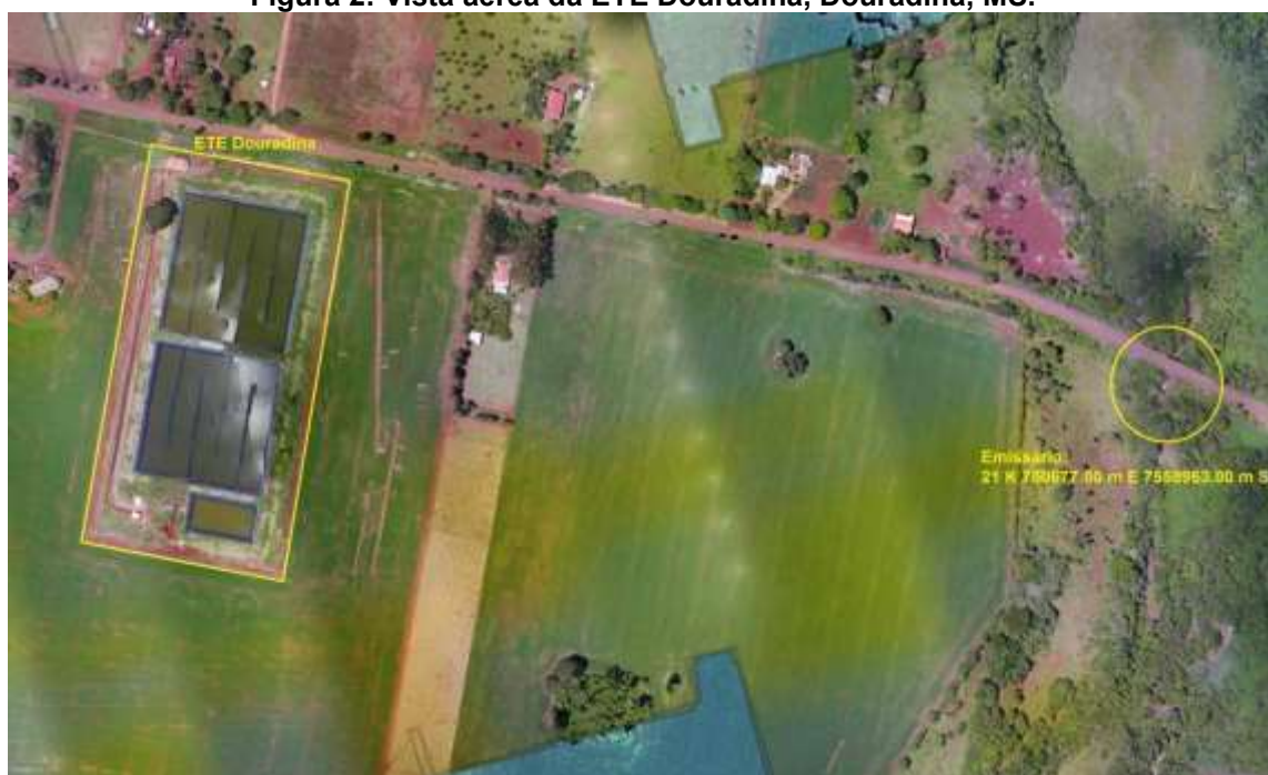
Figura 3: Vista aérea da ETE Douradina e entorno, Douradina, MS.