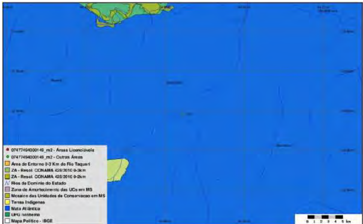
Figura 4: SISLA da ETE Douradina (IMASUL, 2017)

A área não é objeto de processos minerários.