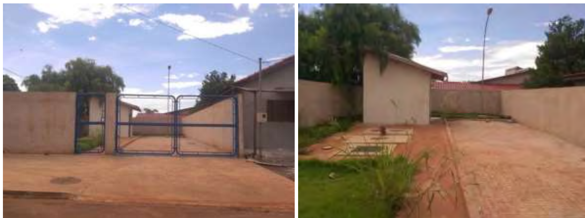
Figura 5: Vista geral da EEEB 001, Douradina, MS.

A EEEB 001, de acordo com o Sistema Interativo de Suporte ao Licenciamento Ambiental (SISLA) de MS, não se sobrepõe a nenhuma Unidade de Conservação ou Zonas de Amortecimento, nem a Terras Indígenas, Áreas de Perambulação, Quilombolas e Assentamentos Rurais.