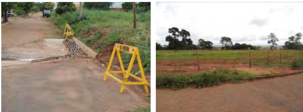
Figura 7: Vista geral da área prevista para a EEEB 005 Projetada, Bataguassu, MS.

A EEEB 005 Projetada, de acordo com o Sistema Interativo de Suporte ao Licenciamento Ambiental (SISLA) de MS, não se sobrepõe a nenhuma Unidade de Conservação ou suas Zonas de Amortecimento, nem a Terras Indígenas, Áreas de Perambulação, Quilombolas e Assentamentos Rurais.