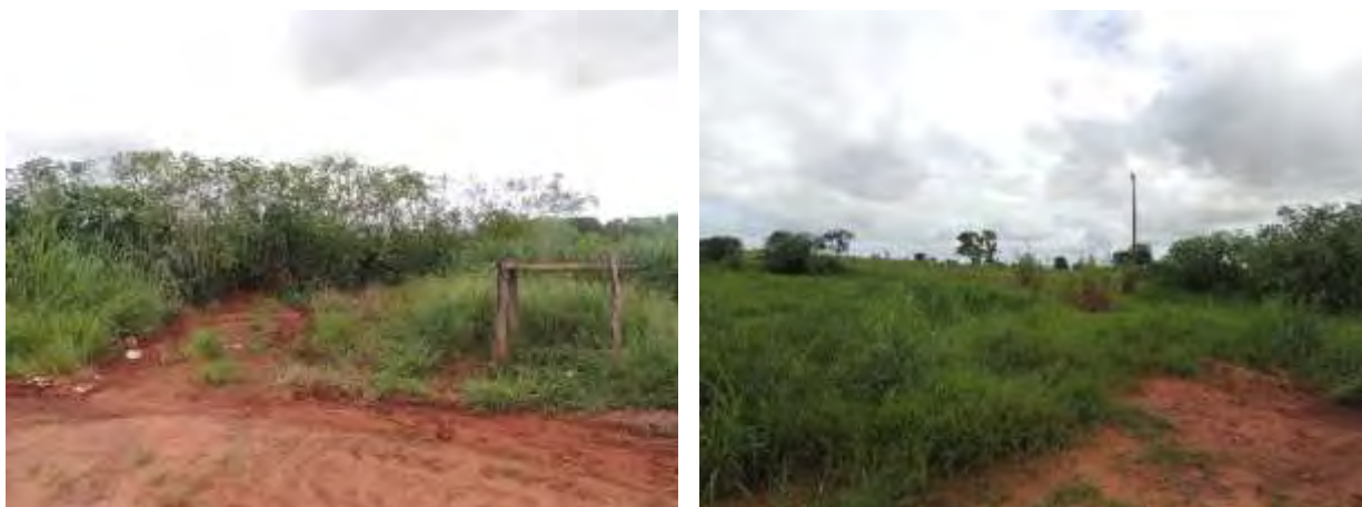
Figura 6: Vista geral da área prevista da EEEB 004 Projetada, Bataguassu, MS.

A EEEB 004 Projetada, de acordo com o Sistema Interativo de Suporte ao Licenciamento Ambiental (SISLA) de MS, não se sobrepõe a nenhuma Unidade de Conservação ou suas Zonas de Amortecimento, nem a Terras Indígenas, Áreas de Perambulação, Quilombolas e Assentamentos Rurais.