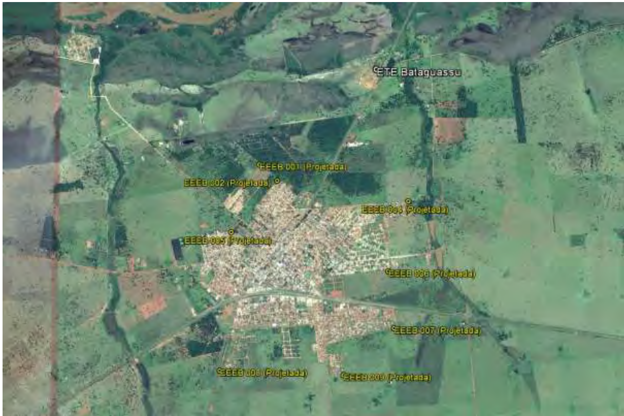
Figura 1: Localização das Unidades Operacionais existentes e projetadas na cidade de Bataguassu, MS.

A cidade de Bataguassu possui uma Estação de Tratamento de Esgotos (ETE) em operação e nove Estações Elevatórias de Esgoto Bruto (EEEB) projetadas (Figura 1).