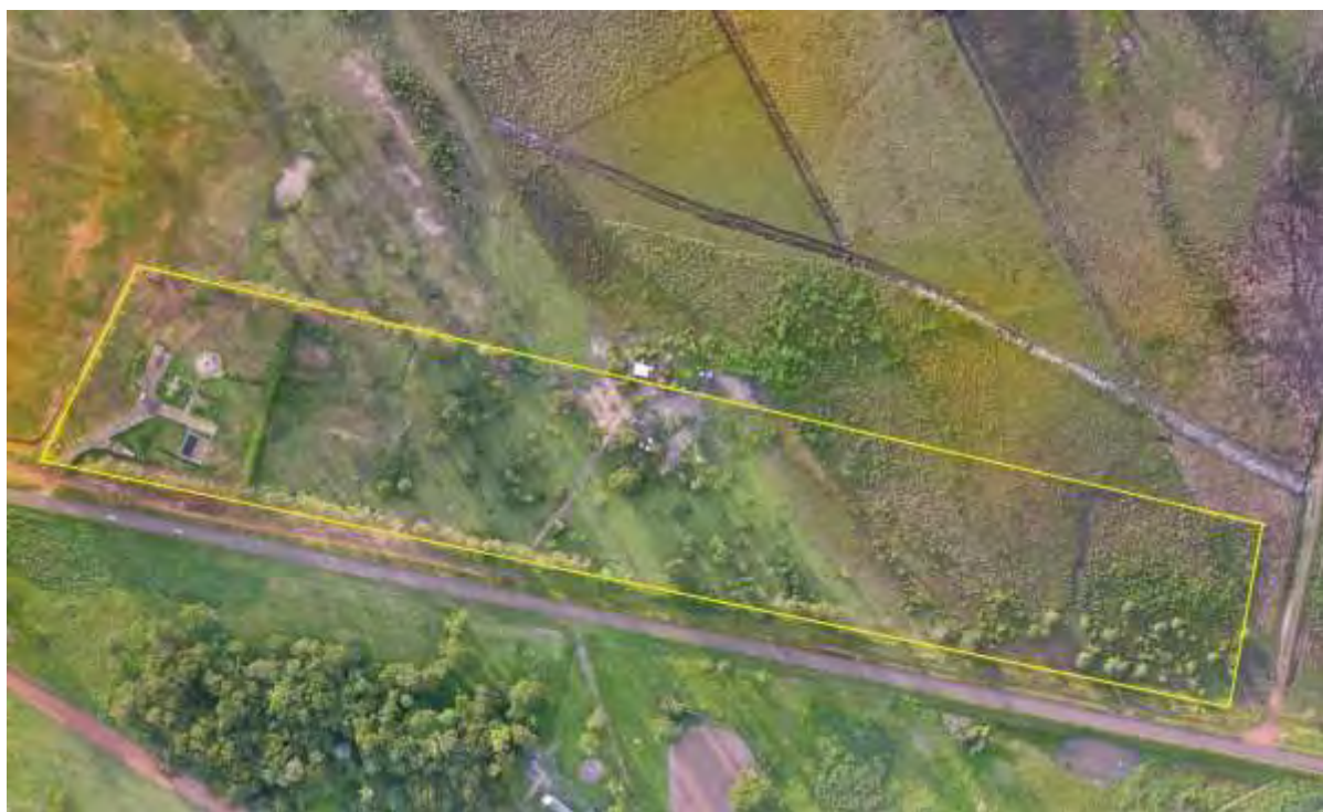
Figura 2: Vista aérea da ETE Bataguassu, Bataguassu, MS.