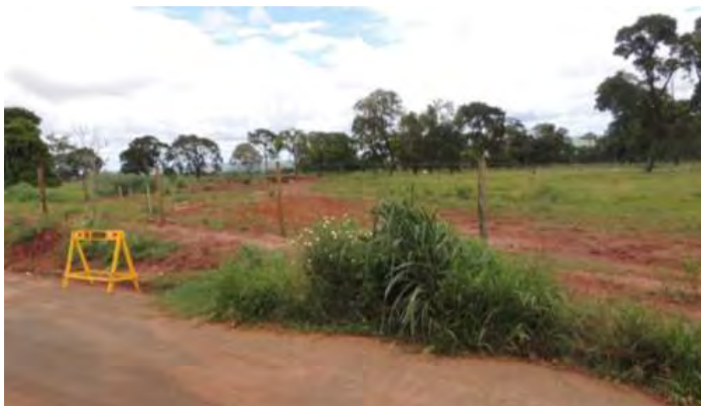
Figura 8: Solo exposto na área da EEEB 005 Projetada, Bataguassu, MS.

Foi identificado início de processo erosivo na área selecionada para implantação da EEEB 005 Projetada, onde pequenas porções do terreno apresentam solo exposto (Figura 8).