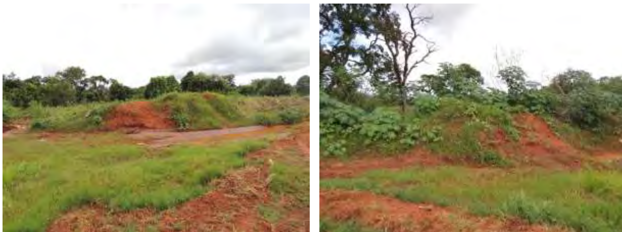
Figura 5: Vista geral da área prevista da EEEB 002 Projetada, Bataguassu, MS.

A EEEB 002 Projetada será localizada na Rua Sete s/n, coordenadas geográficas UTM (22 K) 352.723 E / 7.599.223 S, terá como função recalcar o esgoto afluente para a ETE Bataguassu. A área é recoberta por gramíneas e vegetação arbustiva (Figura 5). Não possui informação sobre extravasor.