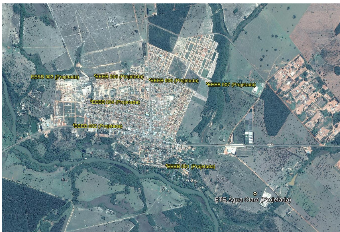
Figura 1: Localização das Unidades Operacionais existentes e projetadas na cidade de Água Clara, MS.

A cidade de Água Clara não possui Sistema de Esgotamento Sanitário (SES), porém possui locais selecionados para a implantação de uma Estação de Tratamento de Esgotos (ETE) e oito Estações Elevatórias de Esgoto Bruto (EEEB) projetadas (Figura 1).