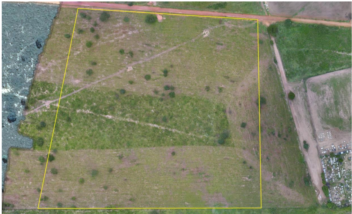
Figura 2: Vista da área pretendida para a ETE Água Clara Projetada, Água Clara, MS.

A ETE Água Clara Projetada será implantada nas coordenadas geográficas UTM (22 K) 305. 914 E / 7.737.235 S, distante 820 m do corpo receptor. A área é recoberta por gramíneas de pastagem e algumas árvores nativas esparsas (Figuras 2 e 3).