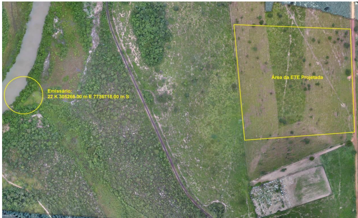
Figura 3: Vista da área pretendida para a ETE Água Clara Projetada e entorno, Água Clara, MS.

A ETE Água Clara Projetada, de acordo com o Sistema Interativo de Suporte ao Licenciamento Ambiental (SISLA) de MS, não se sobrepõe a nenhuma Unidade de Conservação, Terras Indígenas, Áreas de Perambulação, Quilombolas e Assentamentos Rurais (Figura 4).