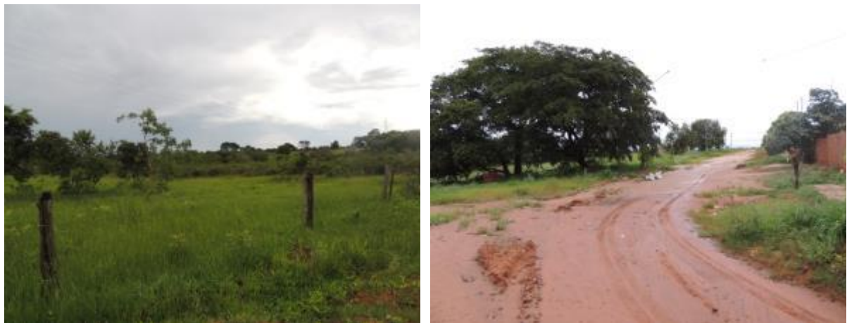
Figura 6: Área prevista para implantação da EEEB 003 Projetada, Água Clara, MS.

A EEEB 003 Projetada, elevatória com função de recalque do esgoto bruto para a EEEB 001 Projetada, será implantada na esquina da Rua Projetada 01 com a Rua A, coordenadas geográficas UTM (22 K) 302.403 E / 7.739.274 S (Figura 6).