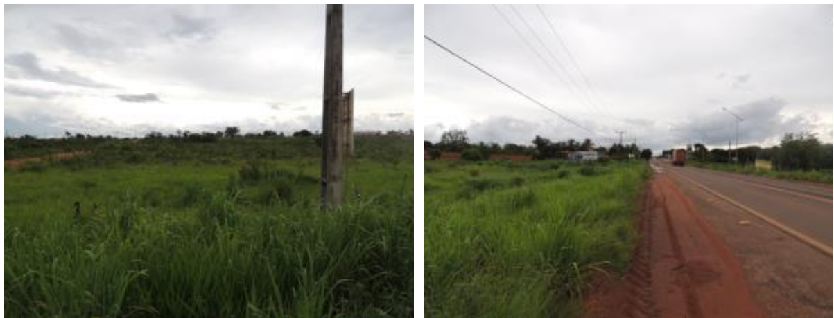
Figura 5: Área prevista para implantação da EEEB 002 Projetada, Água Clara, MS.

A EEEB 002 Projetada, elevatória com função de recalque do esgoto bruto para a EEEB 001 Projetada, será implantada na Avenida Júlio Maia s/n (Rodovia BR-262), coordenadas geográficas UTM (22 K) 302.709 E / 7.738.403 S (Figura 5).