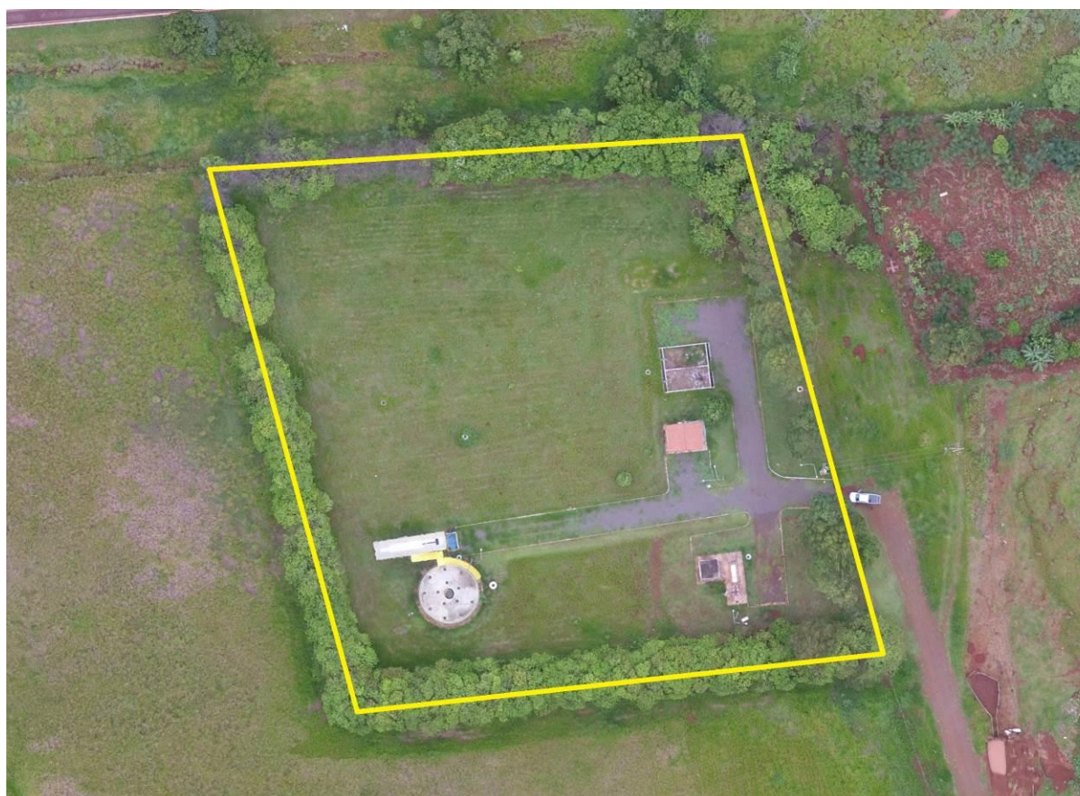
Figura 2: Vista aérea da ETE Terenos, Terenos, MS.

A ETE Terenos está localizada na zona urbana de Terenos, no prolongamento da Rua Dom Aquino, s/n, coordenadas geográficas UTM (21K) 722.286 E / 7.738.880 S, distante aproximadamente 100 m do corpo receptor. Encontra-se totalmente cercada, com poucas árvores em seu interior e com cortina arbórea no entorno (Figuras 2 e 3).