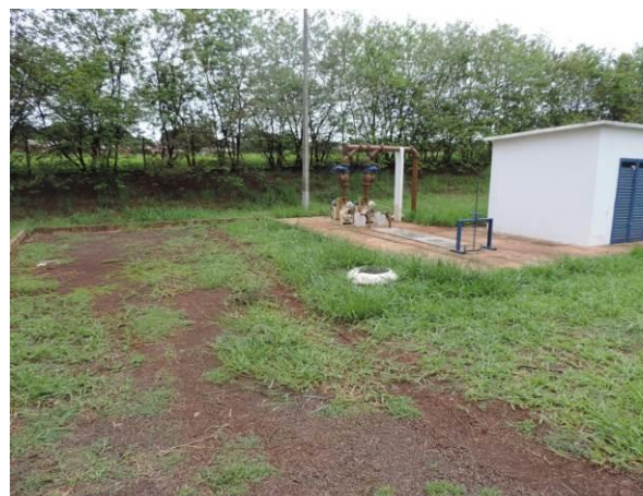
Figura 6: Vista geral da EEEB Terenos, Terenos, MS.

A EEEB Terenos, de acordo com o Sistema Interativo de Suporte ao Licenciamento Ambiental (SISLA) de MS, não se sobrepõe a nenhuma Unidade de Conservação ou Zonas de Amortecimento, nem a Terras Indígenas, Áreas de Perambulação, Quilombolas e Assentamentos Rurais.