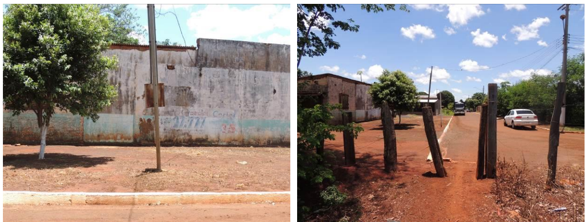
Figura 9: Área prevista para implantação da EEEB 003 Projetada, Terenos, MS.

A EEEB 003 Projetada, elevatória com função de recalque do esgoto bruto para a ETE Terenos, será implantada na zona urbana de Terenos, na Rua A, s/n, coordenadas geográficas UTM (21 K) 722.891 E/ 7.736.975 S (Figura 9).