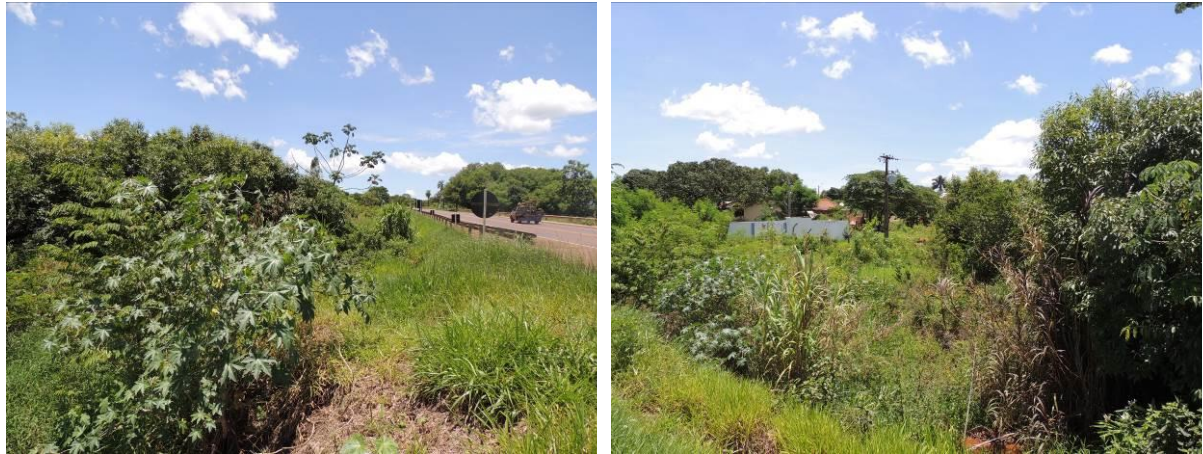
Figura 7: Área prevista para implantação da EEEB 001 Projetada, Terenos, MS.

A EEEB 001 Projetada, de acordo com o Sistema Interativo de Suporte ao Licenciamento Ambiental (SISLA) de MS, não se sobrepõe a nenhuma Unidade de Conservação ou Zonas de Amortecimento, nem a Terras Indígenas, Áreas de Perambulação, Quilombolas e Assentamentos Rurais.