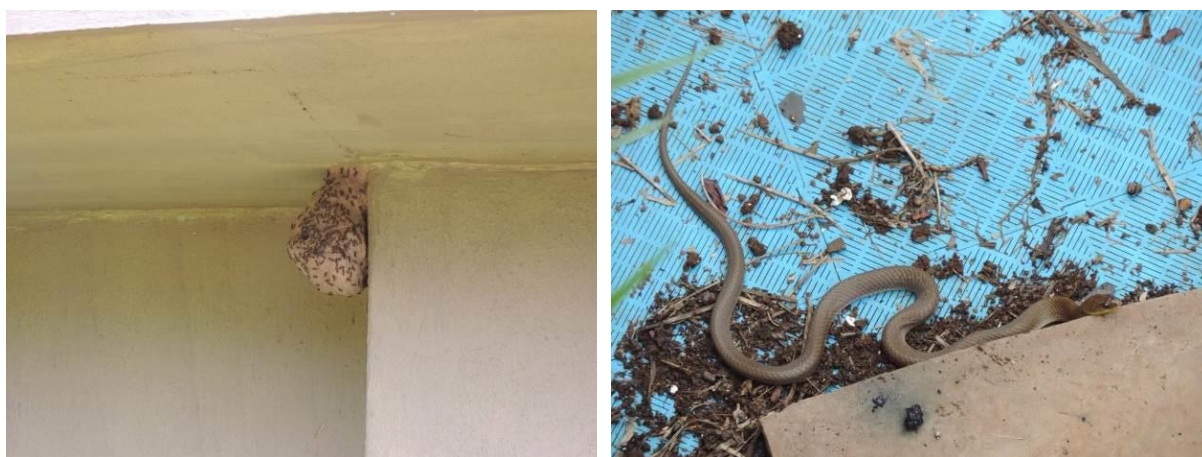
Figura 5: Presença de insetos e serpente no interior da ETE Terenos, Terenos, MS.

Os resíduos sólidos retidos no gradeamento, juntamente com o lodo desidratado no leito de secagem, são enviados para área de disposição final de resíduos sólidos (lixão) de Terenos.