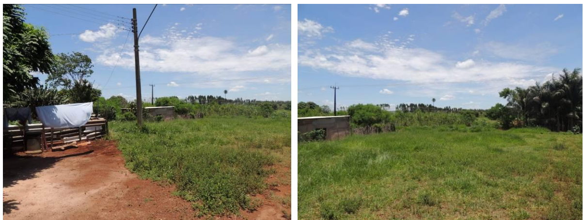
Figura 8: Área prevista para implantação da EEEB 002 Projetada, Terenos, MS.

A EEEB 002 Projetada será implantada na zona urbana de Terenos, na Rua 04, coordenadas geográficas UTM (21 K) 723.723 E/ 7.738.861 S (Figura 8).