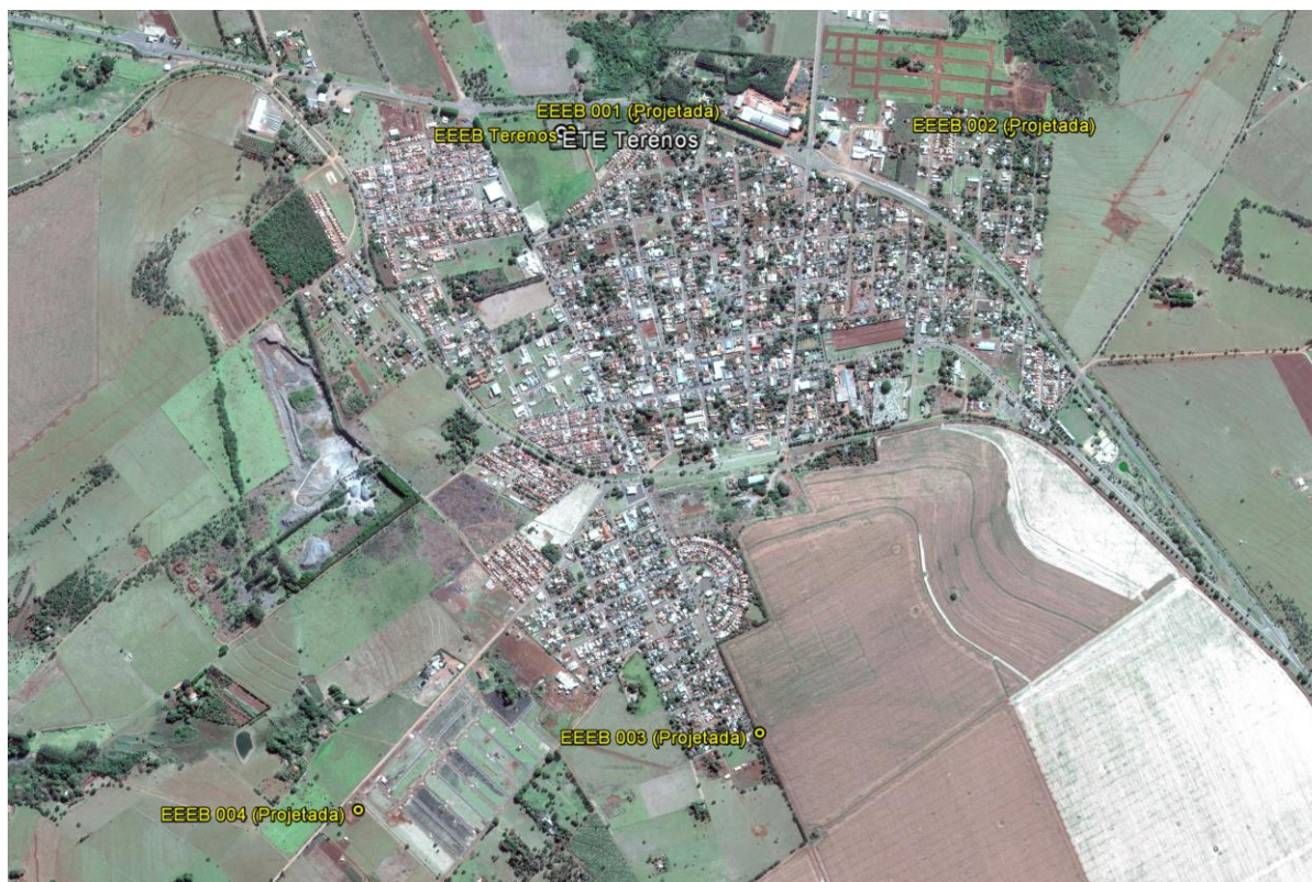
Figura 1: Localização das Unidades Operacionais existentes e projetadas na cidade de Terenos, MS.

A cidade de Terenos possui uma Estação de Tratamento de Esgoto (ETE) e uma Estação Elevatória de Esgoto Bruto (EEEB) em operação. Possui, ainda, áreas selecionadas para a implantação de quatro Estações Elevatórias de Esgoto Bruto (EEEB) projetadas (Figura 1).