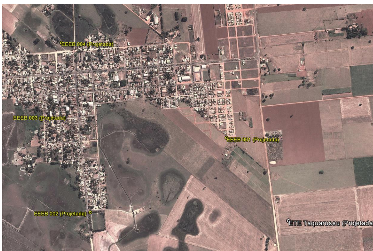
Figura 1: Localização das Unidades Operacionais existentes e projetadas na cidade de Taquarussu, MS.

A cidade de Taquarussu não possui Sistema de Esgotamento Sanitário (SES), porém possui locais selecionados para implantação de uma Estação de Tratamento de Esgoto (ETE) e quatro Estações Elevatórias de Esgoto Bruto (EEEB) projetadas (Figura 1 Erro! Fonte de referência não encontrada.).