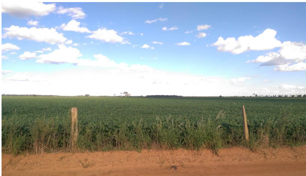
Figura 2: Vista geral da área pretendida para a ETE Taquarussu Projetada, Taquarussu, MS.

A ETE Taquarussu Projetada estará localizada na zona rural de Taquarussu nas coordenadas geográficas UTM (22K) 259.310 E / 7.510.347 S, distante 1.600 m do corpo receptor. A área encontra-se recoberta por lavoura (Figuras 2 e 3).