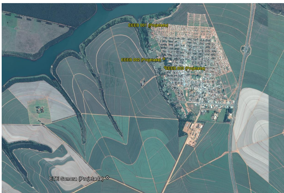
Figura 1: Localização das Unidades Operacionais existentes e projetadas na cidade de Sonora, MS.

A cidade de Sonora não possui Sistema de Esgotamentos Sanitário (SES), porém possui áreas selecionadas para a implantação de uma Estação de Tratamento de Esgoto (ETE) e três Estações Elevatórias de Esgoto Bruto (EEEB) projetadas (Figura 1).