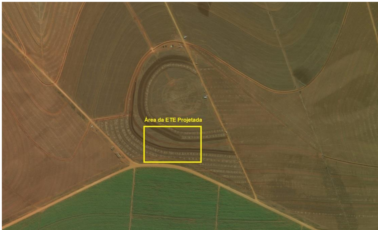
Figura 2: Vista aérea da área da ETE Projetada, Sonora, MS.

A ETE Sonora Projetada estará localizada na zona urbana de Sonora, coordenadas geográficas UTM (21K) 736.878 E / 8.054.422 S. A área é recoberta, atualmente, por plantação de soja (Figura 2).