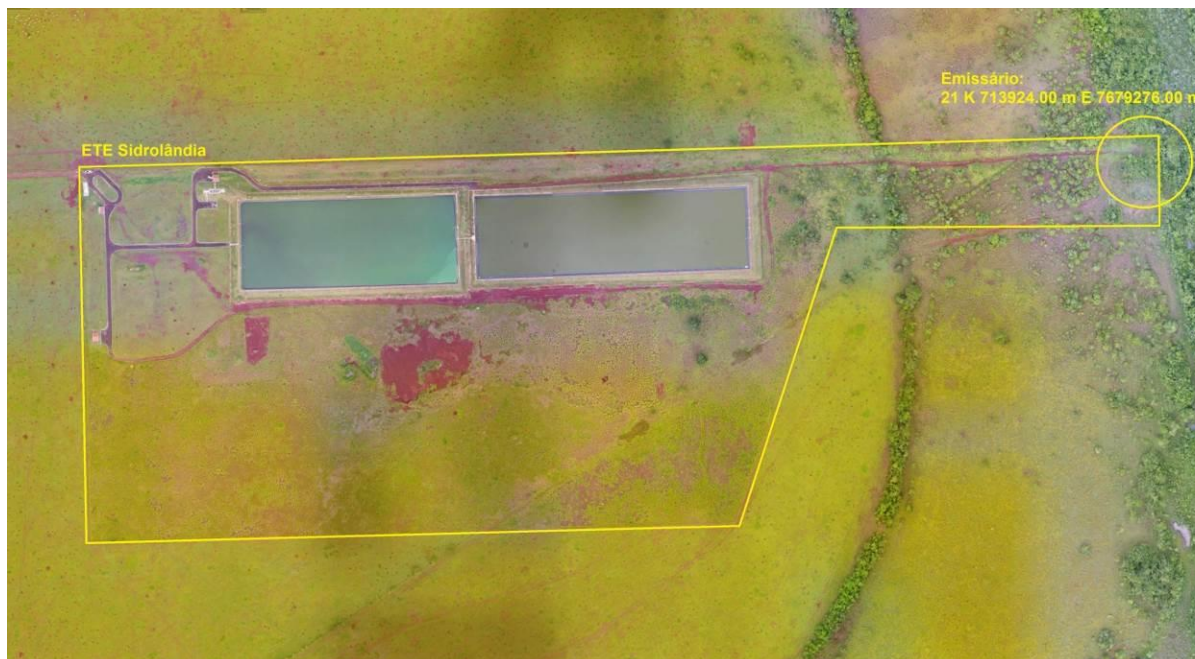
Figura 3: Vista aérea da ETE Sidrolândia e entorno, Sidrolândia, MS.

A ETE Sidrolândia, de acordo com o Sistema Interativo de Suporte ao Licenciamento Ambiental (SISLA) de MS, não se sobrepõe a nenhuma Unidade de Conservação ou