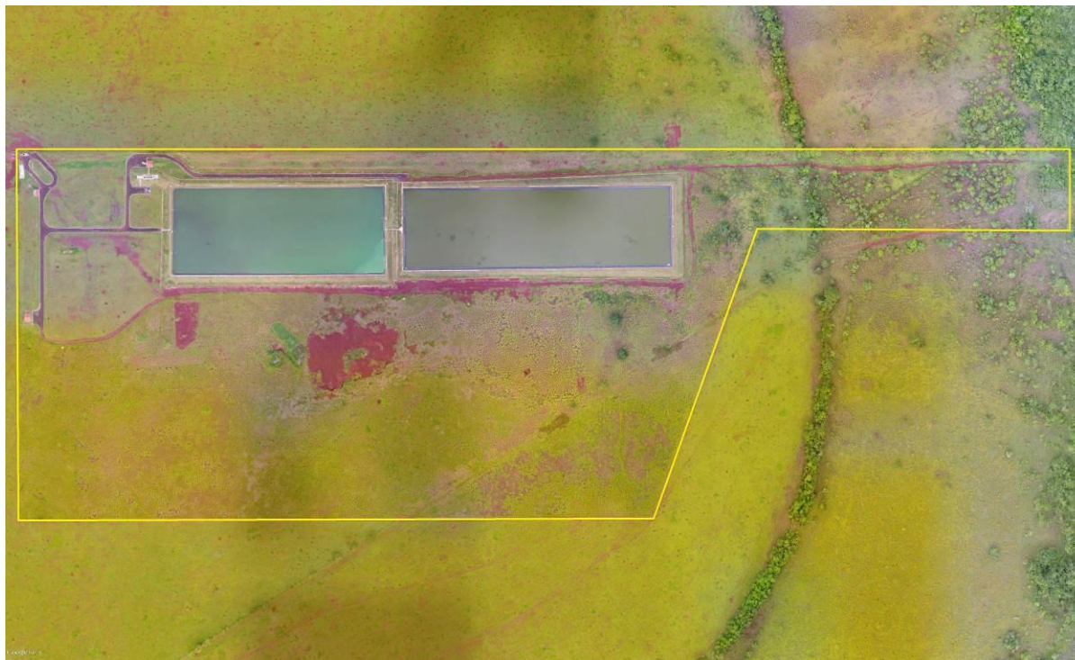
Figura 2: Vista aérea da ETE Sidrolândia, Sidrolândia, MS.

Encontra-se totalmente cercada, sem vegetação em seu interior e sem cortina arbórea no entorno (Figuras 2 e 3).