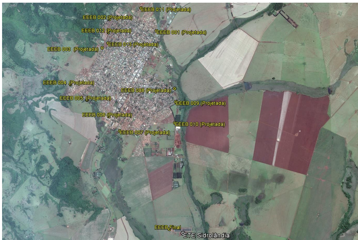
Figura 1: Localização das Unidades Operacionais existentes e projetadas na cidade de Sidrolândia, MS.

A cidade de Sidrolândia possui uma Estação de Tratamento de Esgoto (ETE) e uma Estação Elevatória de Esgoto Bruto (EEEB), todas em operação. Possui, ainda, áreas selecionadas para a implantação de 13 Estações Elevatórias de Esgoto Bruto (EEEB) projetadas (Figura 1).