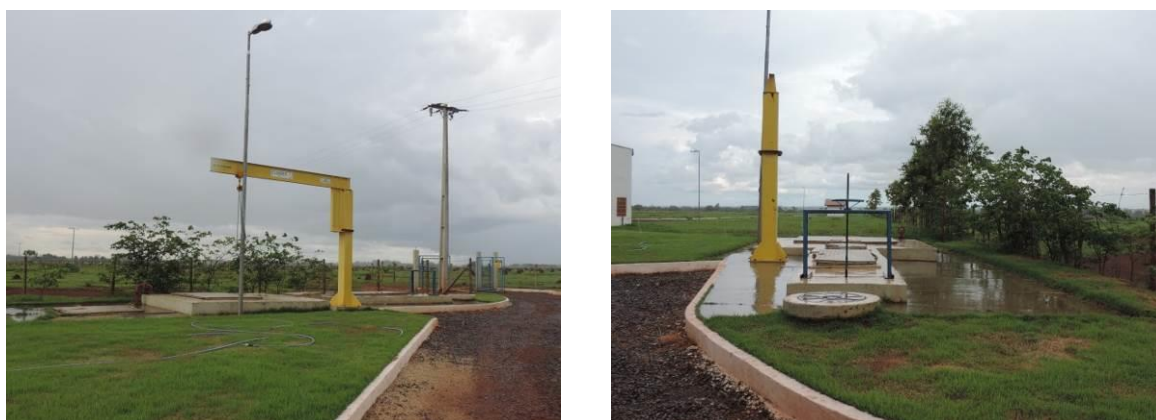
Figura 5: Vista geral da EEEB Final, Sidrolândia, MS.

A EEEB Final, elevatória subterrânea, localiza-se no interior da área da ETE Sidrolândia, nas coordenadas (21 K) 713.212 E / 7.679.212 S, com função de recalque do esgoto bruto para o sistema de tratamento da ETE Sidrolândia. Possui extravasor (Figura 5).