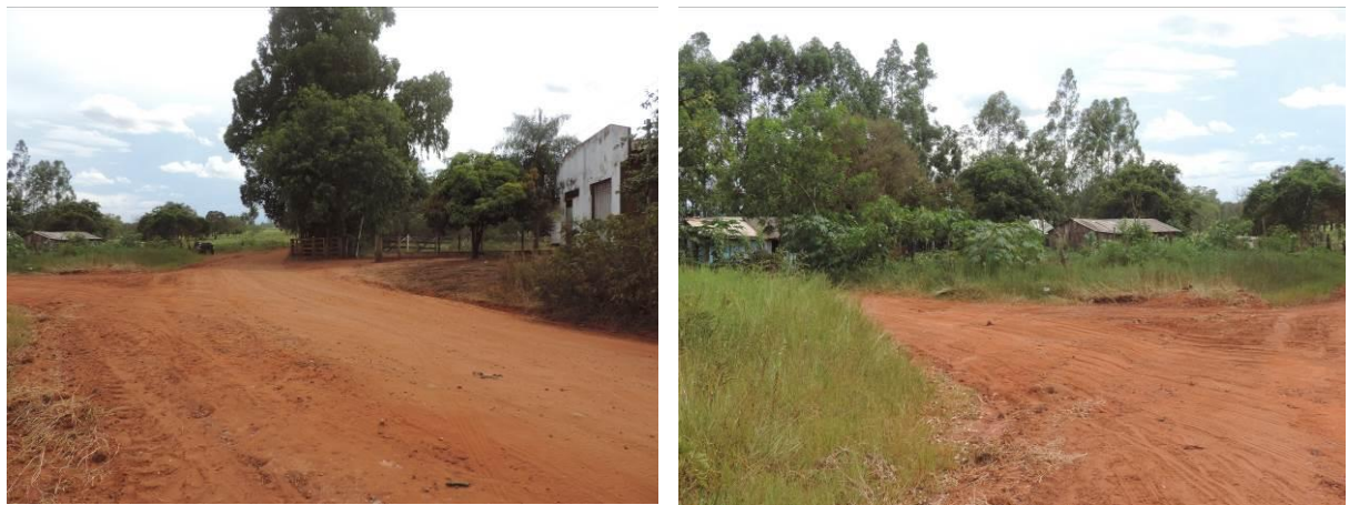
Figura 6: Área prevista para implantação da EEEB 003 Projetada, Sete Quedas, MS.

A EEEB 003 Projetada, elevatória com função de recalque do esgoto bruto para a ETE Sete Quedas Projetada, será implantada próximo ao encontro da Avenida Internacional com a Rua Antônio Rocha da Costa, coordenadas geográficas UTM (21 K) 698.158 E / 7.346.038 S (Figura 6).