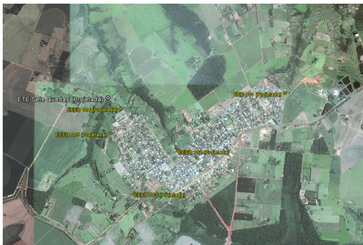
Figura 1: Localização das Unidades Operacionais existentes e projetadas na cidade de Sete Quedas, MS.

A cidade de Sete Quedas não possui Sistema de Esgotamento Sanitário (SES), porém possui áreas selecionadas para a implantação de uma Estação de Tratamento de Esgoto (ETE) e cinco Estações Elevatórias de Esgoto Bruto (EEEB) projetadas (Figura 1).