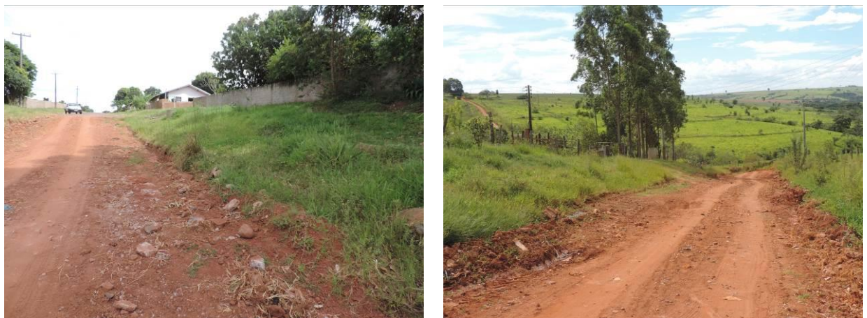
Figura 7: Área prevista para implantação da EEEB 004 Projetada, Sete Quedas, MS.

A EEEB 004 Projetada, elevatória com função de recalque do esgoto bruto para a ETE Sete Quedas Projetada, será implantada na Rua Sete de Setembro, na saída norte da cidade, coordenadas geográficas UTM (21 K) 697.851 E / 7.347.736 S (Figura 7).