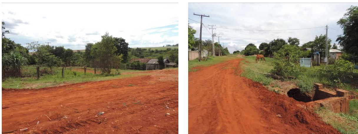
Figura 8: Área prevista para implantação da EEEB 005 Projetada, Sete Quedas, MS.

A EEEB 005 Projetada, elevatória com função de recalque do esgoto bruto para a EET Sete Quedas Projetada, será implantada na esquina da Rua Afonso Pena com a Travessa José Palácio, coordenadas geográficas UTM (21 K) 697.623 E / 7.347.280 S (Figura 8).