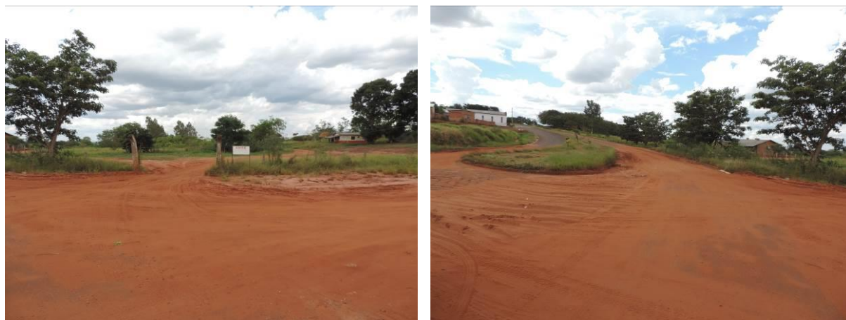
Figura 4: Área prevista para implantação da EEEB 001 Projetada, Sete Quedas, MS.

A EEEB 001 Projetada, elevatória com função de recalque do esgoto bruto para a EEEB 002 Projetada, será implantada na Avenida Dom Pedro I, coordenadas geográficas UTM (21 K) 700.949 E / 7.347.977 S (Figura 4).