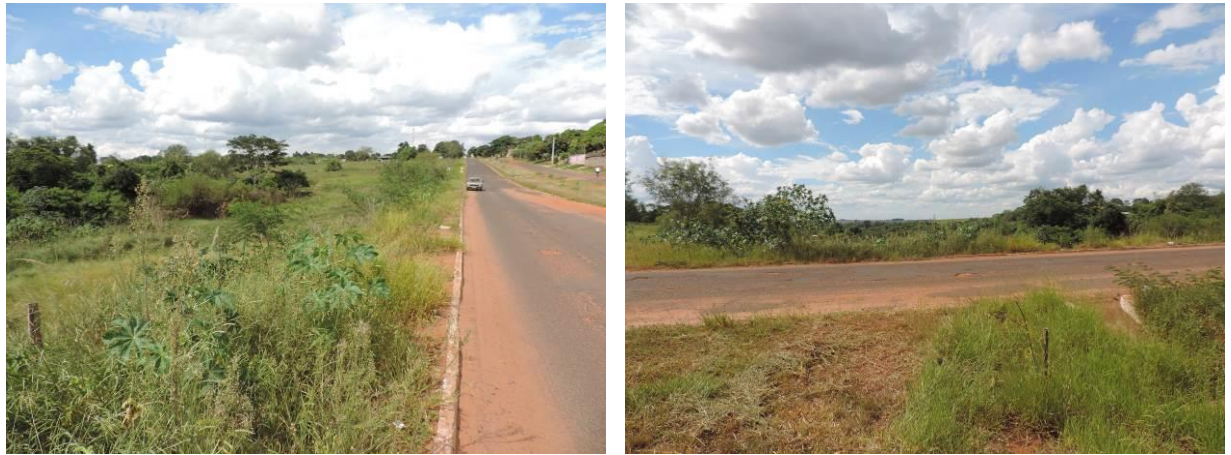
Figura 5: Área prevista para implantação da EEEB 002 Projetada, Sete Quedas, MS.

A EEEB 002 Projetada, de acordo com o Sistema Interativo de Suporte ao Licenciamento Ambiental (SISLA) de MS, não se sobrepõe a Terras Indígenas, Áreas de Perambulação, Quilombolas e Assentamentos Rurais, porém se sobrepõe à Área de Proteção Ambiental Intermunicipal da Bacia do Rio Iguatemi.