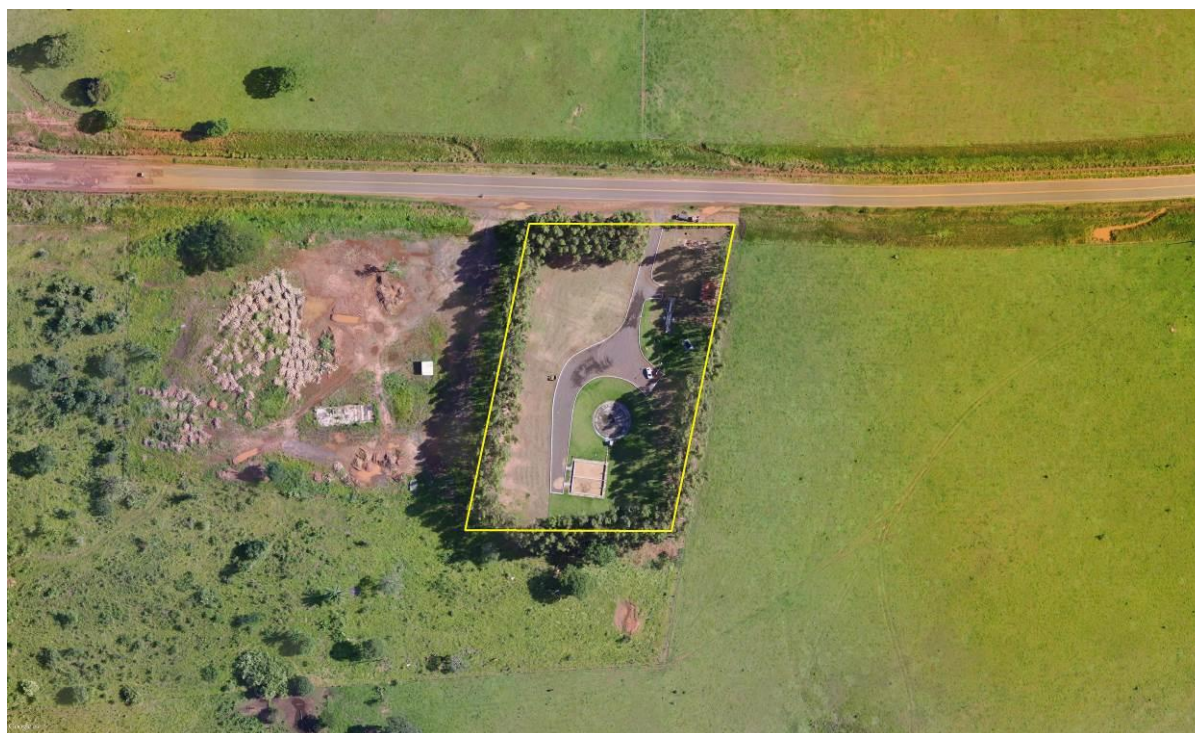
Figura 2: Vista aérea da ETE Santa Rita do Pardo, Santa Rita do Pardo, MS.

A ETE Santa Rita do Pardo está localizada na Rodovia MS 040, coordenadas geográficas UTM (22 K) 308.397 E / 7.643.724 S, distante 550 m do corpo receptor. Encontra-se totalmente cercada, com cortina arbórea completa em seu entorno e portão de grade com tranca (Figuras 2 e 3).