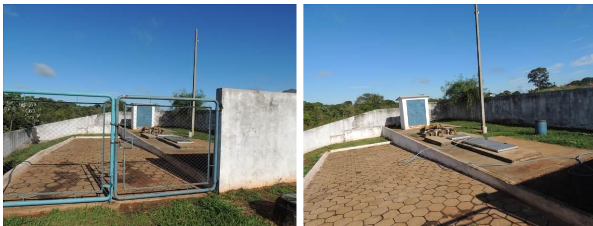
Figura 5: Localização da EEEB 001, Santa Rita do Pardo, MS.

A EEEB 001 localiza-se na área urbana de Santa Rita do Pardo, no final da Rua Pedro Celestino, coordenadas geográficas UTM (22 K) 309.720 E / 7.642.912 S, com função de recalcar os efluentes coletados no Subsistema 2 até o Subsistema 1. Encontra-se totalmente cercada por muros e portão de grade com tranca (Figura 5). Não possui informações sobre extravasor.