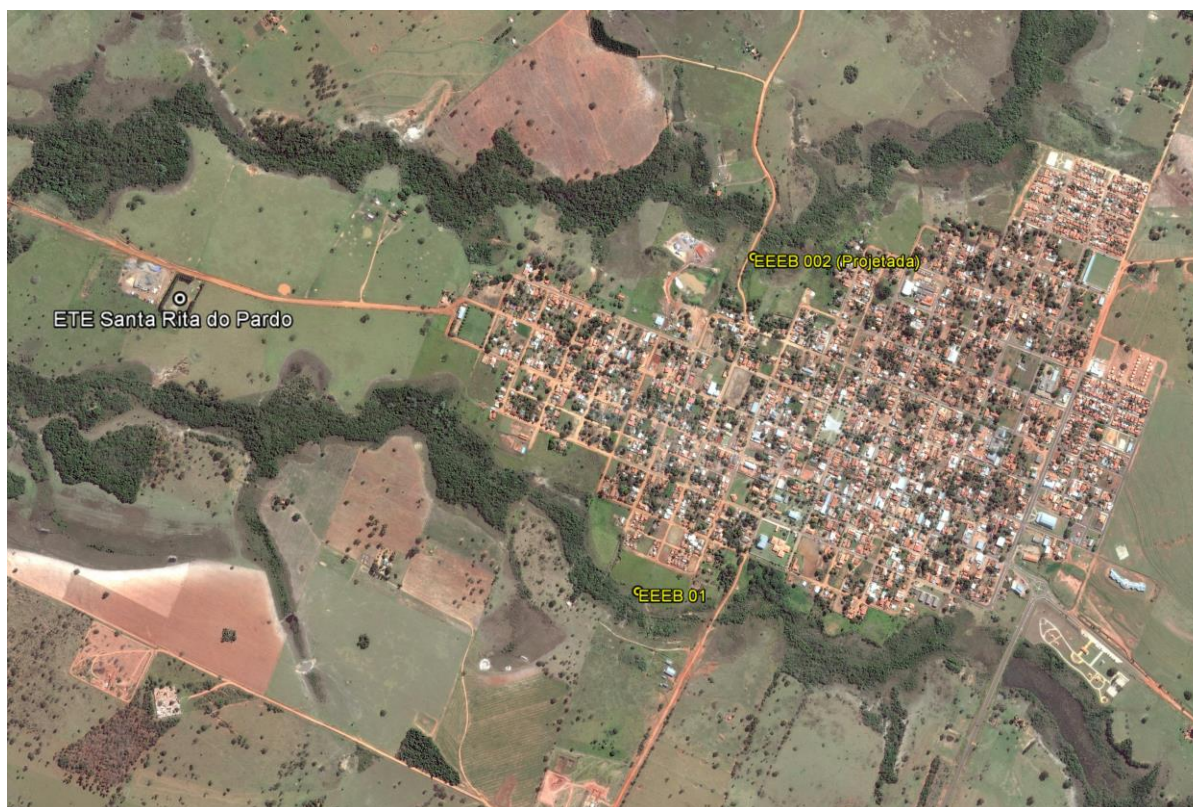
Figura 1: Localização das Unidades Operacionais existentes e projetadas na cidade de Santa Rita do Pardo, MS.

A cidade de Santa Rita do Pardo possui uma Estação de Tratamento de Esgotos (ETE) e uma Estação Elevatória de Esgoto Bruto (EEEB) em operação. Possui ainda uma área selecionada para a implantação de uma Estação Elevatória de Esgoto Bruto (EEEB) projetada (Figura 1).