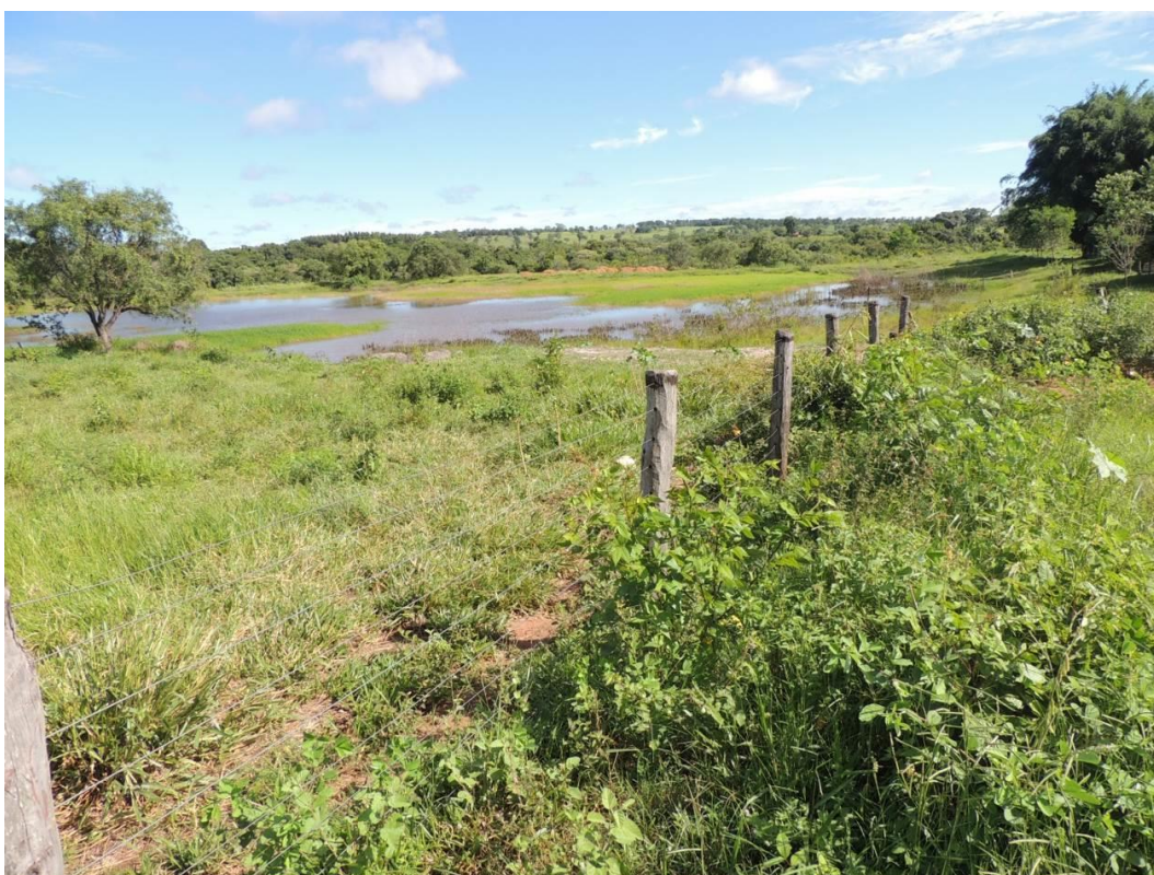
Figura 7: Área prevista para implantação da EEEB 002 Projetada, Santa Rita do Pardo, MS.

A EEEB 002 Projetada será implantada na zona urbana de Santa Rita do Pardo, na Rua Pedro Celestino, coordenadas geográficas UTM (22 K) 310.042 E / 7.643.862 S (Figura 7). Não possui informações sobre extravasor.