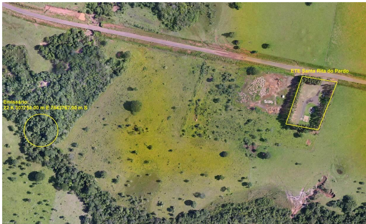
Figura 3: Vista aérea da ETE Santa Rita do Pardo e entorno, Santa Rita do Pardo, MS.

A ETE Santa Rita do Pardo, de acordo com o Sistema Interativo de Suporte ao Licenciamento Ambiental (SISLA) de MS, não se sobrepõe a nenhuma Unidade de Conservação ou Zonas de Amortecimento, nem a Terras Indígenas, Áreas de Perambulação, Quilombolas e Assentamentos Rurais (Figura 4).