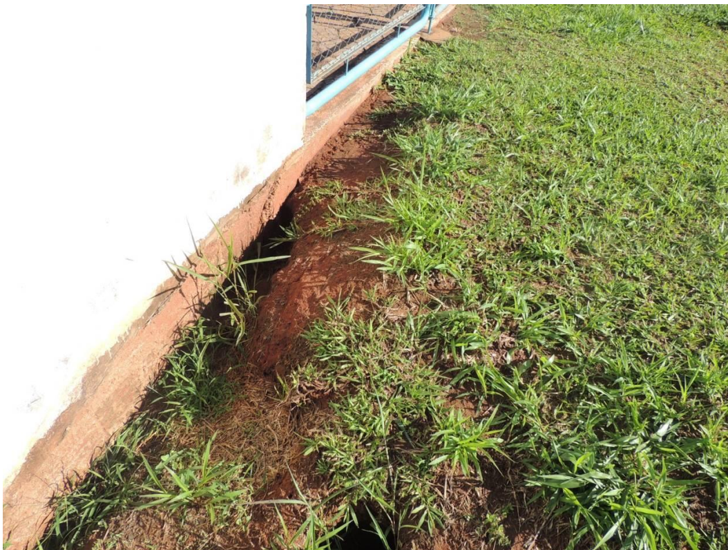
Figura 6: Início de processo erosivo junto ao muro externo da EEEB.

Foi identificado como passivo ambiental início de processo erosivo junto ao muro na parte externa da EEEB (Figura 6).