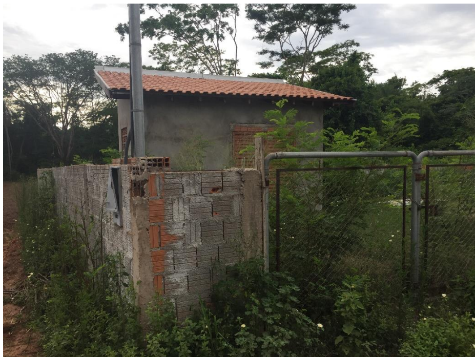
Figura 4: Vista geral da área da EEEB 002 Projetada, Rio Negro, MS.