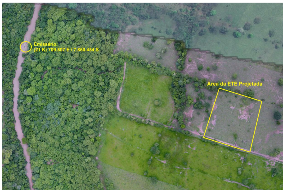
Figura 2: Vista aérea da ETE Rio Negro Projetada e entorno, Rio Negro, MS.

A ETE Rio Negro Projetada está localizada na zona rural de Rio Negro nas coordenadas geográficas UTM (21 K) 709.990 E / 7.850.283 S, distante 500 m do corpo receptor. A área é recoberta por gramíneas de pastagem (Figura 2).