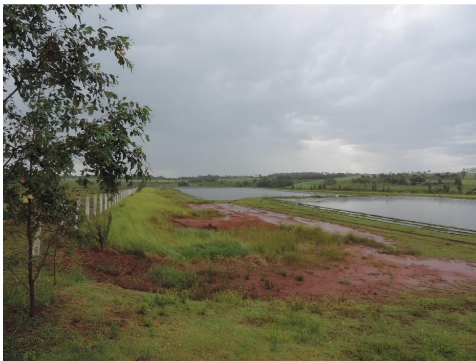
Figura 4: Solo exposto dentro da área da ETE Paranhos.

Não foram identificados passivos ambientais decorrentes de vazamentos e acondicionamento de resíduos sólidos. Entretanto, foram identificadas porções do terreno apresentando solo exposto próximo às lagoas, o que sem manutenção pode afetar a eficiência de tratamento das mesmas, com o carreamento de partículas sólidas para o seu interior (Figura 4). Consta que o efluente está sendo lançado com padrões acima dos limites permitidos, contribuindo para a queda da qualidade da água do corpo receptor.