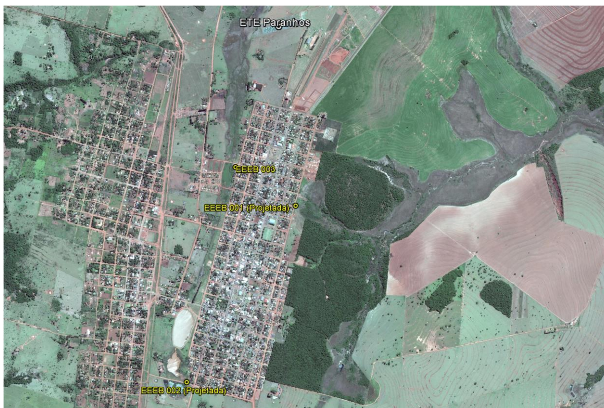
Figura 1: Localização das Unidades Operacionais existentes e projetadas na cidade de Paranhos, MS.

A cidade de Paranhos possui uma Estação de Tratamento de Esgotos (ETE) e uma Estação Elevatória de Esgoto Bruto (EEEB), ambas em operação. Possui, ainda, áreas selecionadas para a implantação de duas Estações Elevatórias de Esgoto Bruto (EEEB) projetadas (Figura 1).