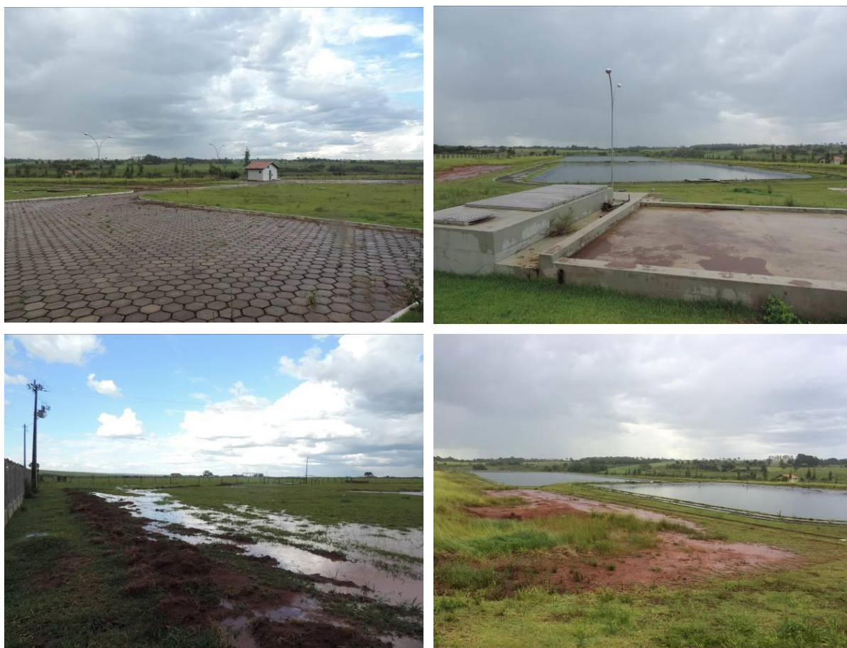
Figura 2: Vista geral da ETE Paranhos, Paranhos, MS.

A ETE Paranhos localiza-se na área urbana do município de Paranhos, com acesso pela Rodovia Estadual MS-295, nas coordenadas geográficas UTM (21 K) 660.217 E / 7.359.197 S, distante 160 m do corpo receptor. Atualmente encontra-se totalmente cercada com cercas rurais de arame liso e alambrado. A ETE contém poucas árvores esparsas em seu interior, mas não apresenta cortina arbórea (Figuras 2 e 3).