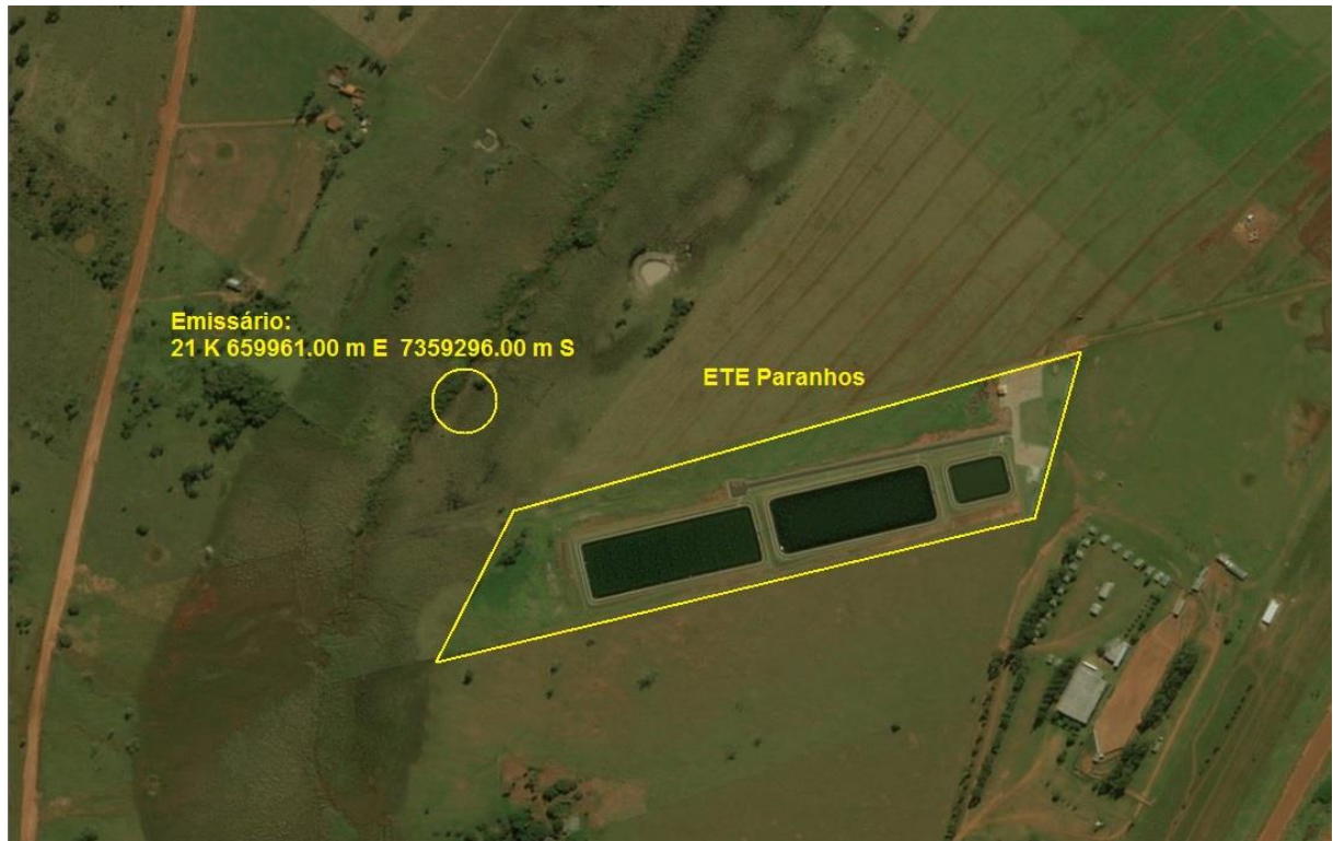
Figura 3: Vista aérea da ETE Paranhos e entorno, Paranhos, MS.

A ETE Paranhos, de acordo com o Sistema Interativo de Suporte ao Licenciamento Ambiental (SISLA) de MS, se sobrepõe à Área de Proteção Ambiental Intermunicipal da Bacia do Rio Iguatemi, mas não se sobrepõe a nenhuma Zona de Amortecimento, nem a Terras Indígenas, Áreas de Perambulação, Quilombolas e Assentamentos Rurais (Figura 3).