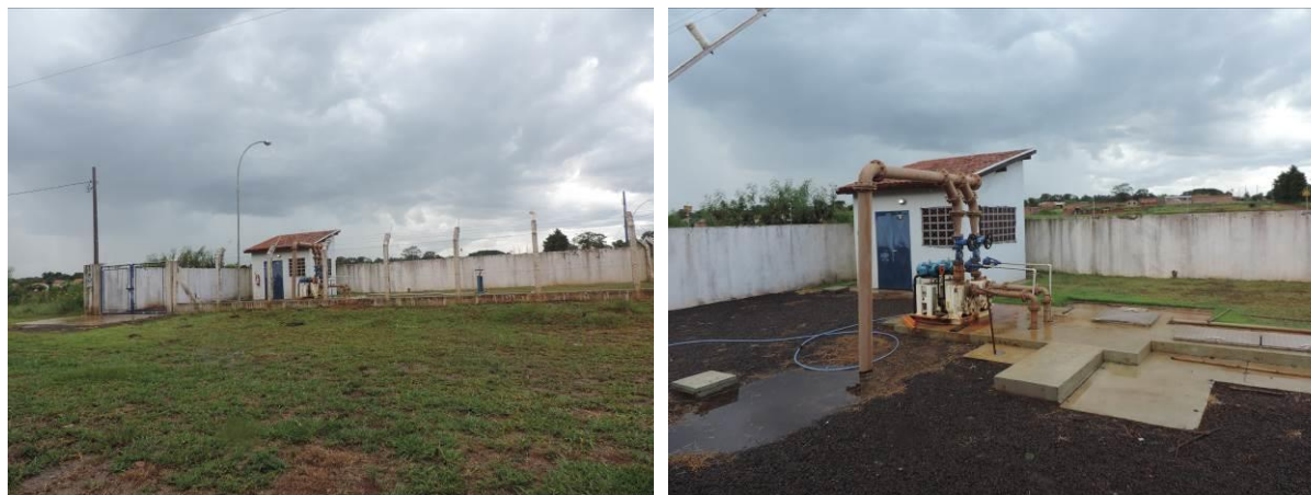
Figura 5: Vista geral da EEEB 003, Paranhos, MS.

A EEE 003, de acordo com o Sistema Interativo de Suporte ao Licenciamento Ambiental (SISLA) de MS, se sobrepõe a Área de Proteção Ambiental Intermunicipal da Bacia do Rio Iguatemi, mas não se sobrepõe a Terras Indígenas, Áreas de Perambulação, Quilombolas e Assentamentos Rurais.