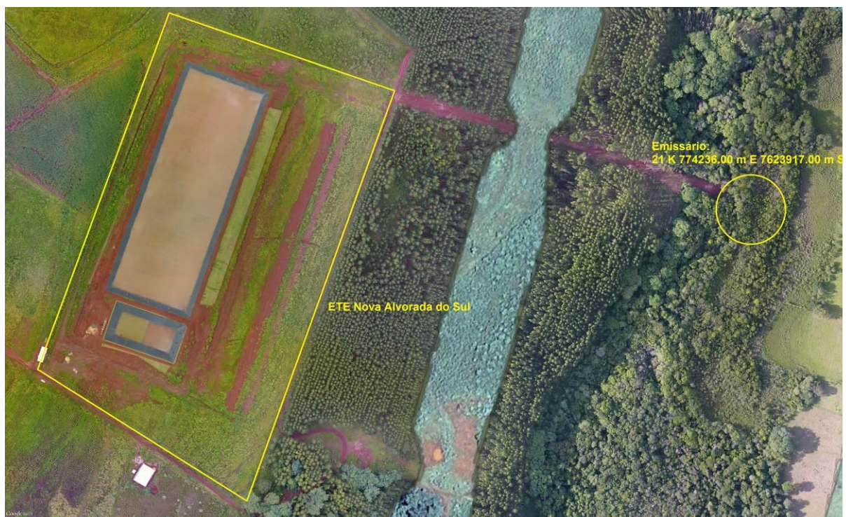
Figura 3: Vista aérea da ETE Nova Alvorada do Sul em implantação e entorno, Nova Alvorada do Sul, MS.