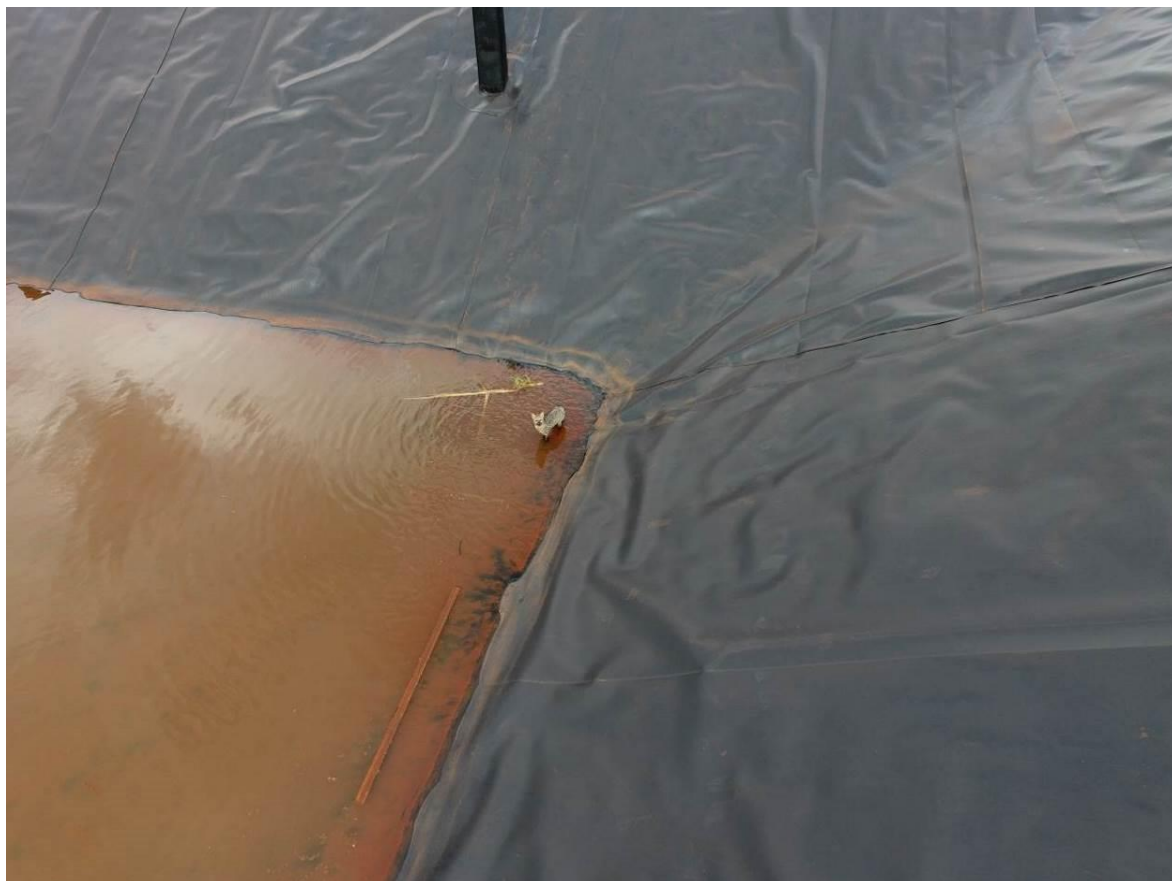
Figura 5: Presença de animal silvestre (lobinho) no interior da ETE Nova Alvorada do Sul em implantação, Nova Alvorada do Sul, MS.

Não há reclamações da população do entorno, bem como não se nota a presença de insetos e vetores.