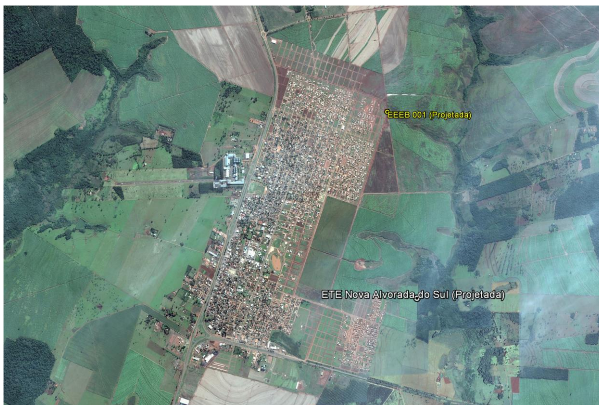
Figura 1: Localização das Unidades Operacionais existentes e projetadas na cidade de Nova Alvorada do Sul, MS.

A cidade de Nova Alvorada do Sul possui uma Estação de Tratamento de Esgoto (ETE) em implantação. Possui, ainda, área selecionada para a implantação de uma Estação Elevatória de Esgoto Bruto (EEEB) projetada (Figura 1).