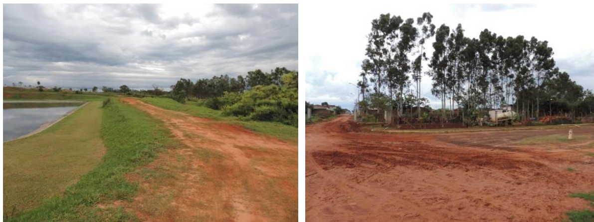
Figura 6: Solo exposto dentro da ETE Ipê, Naviraí, MS.

de vazamentos, tendo em vista que duas das quatro lagoas de tratamento são revestidas por argila. Também foram observadas vias internas em más condições com solo exposto, assim como em grande parte do terreno (Figura 6).