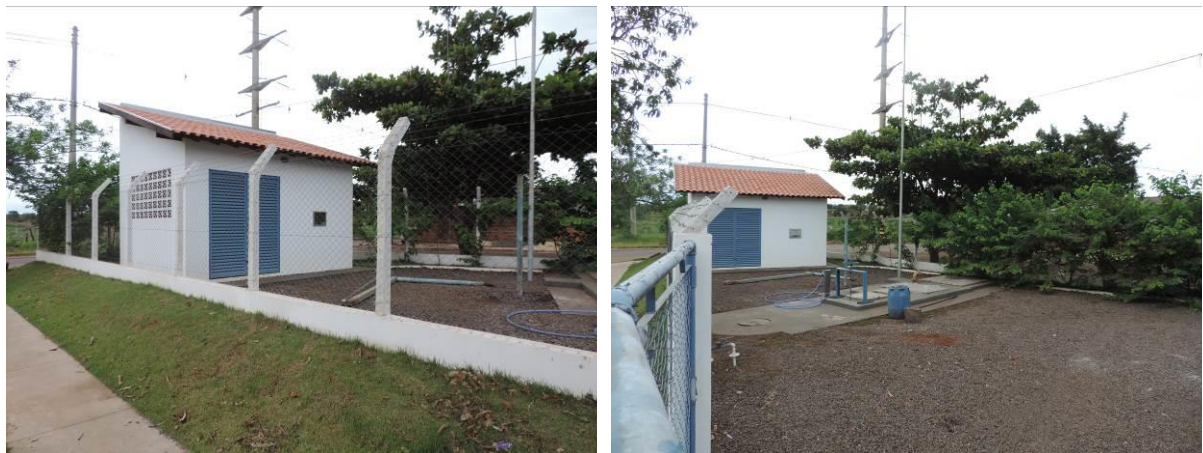
Figura 8: Vista geral da EEEB 003, Naviraí, MS.

A EEEB 003 localiza-se no cruzamento da Avenida Pantanal com a Rua dos Operários, com coordenadas geográficas UTM (21 K) 786.042 E / 7.445.525 S, tendo como função recalcar os esgotos coletados no Subsistema 3 e encaminhar para PV localizado na Avenida Nova Andradina, esquina com a Rua Loudes. Completamente cercada e com portão com trancas, apresentando cerca viva parcialmente no entorno da estação. Não há informações sobre extravasor (Figura 8).