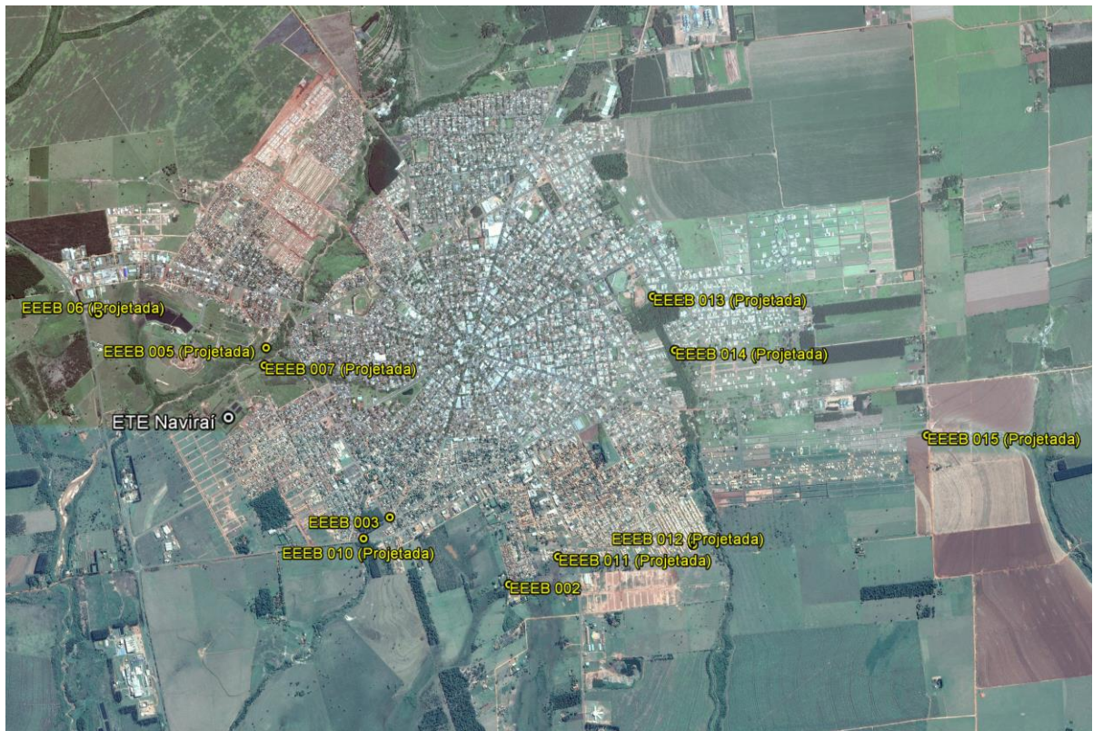
Figura 1: Localização das Unidades Operacionais existentes e projetadas na cidade de Naviraí, MS.

A cidade de Naviraí possui uma Estação de Tratamento de Esgoto (ETE) e duas Estações Elevatórias de Esgoto Bruto (EEEB), todas em operação. Possui, ainda, uma Estação Elevatória de Esgoto Bruto (EEEB) em implantação (Figura 1).