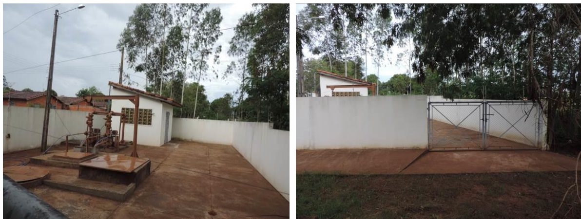
Figura 7: Vista geral da EEEB 002, Naviraí, MS.

A EEEB 002 localiza-se na zona urbana de Naviraí, próximo ao cruzamento das Ruas Guilherme B. Diniz e João Guedes, coordenadas geográficas UTM (21 K) 787.006 E / 7.444.965 S, tendo como função recalcar os esgotos coletados nos Bairros do Subsistema 2 para o Subsistema 1. Encontra-se fechada com trancas, cercada por muro de concreto, sem cortina arbórea nem vegetação em seu interior. Não há informações sobre extravasor (Figura 7).