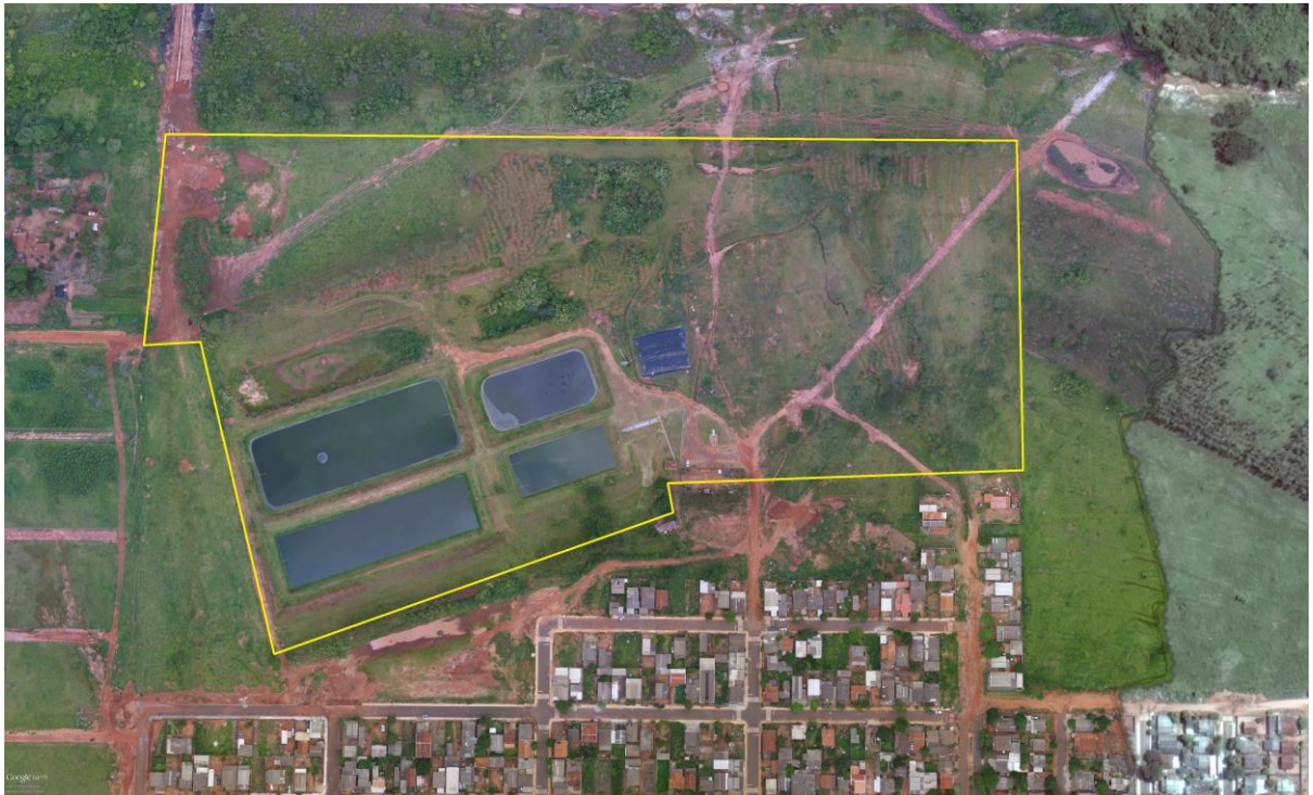
Figura 2: Vista aérea da ETE Ipê, Naviraí, MS.

poucas árvores em seu interior e cortina arbórea em parte do seu entorno (Figuras 2 e 3).