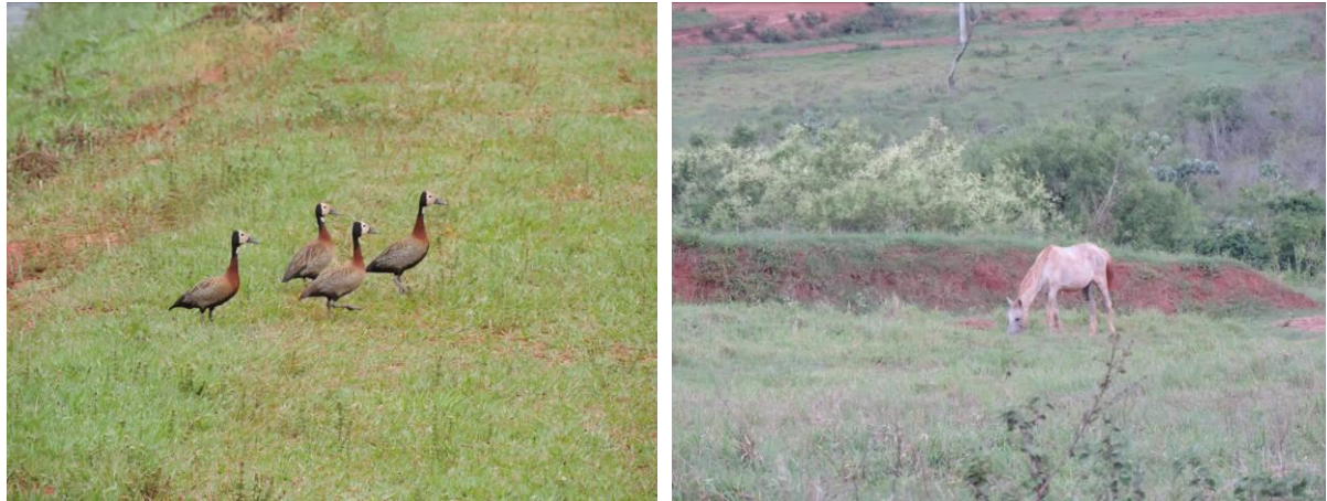
Figura 5: Animais silvestres e domésticos no interior da área da ETE Ipê, Naviraí, MS.

Os resíduos sólidos retidos no gradeamento são armazenados em BAGs (1m 3 ) e posteriormente enviados para o aterro sanitário de Naviraí.