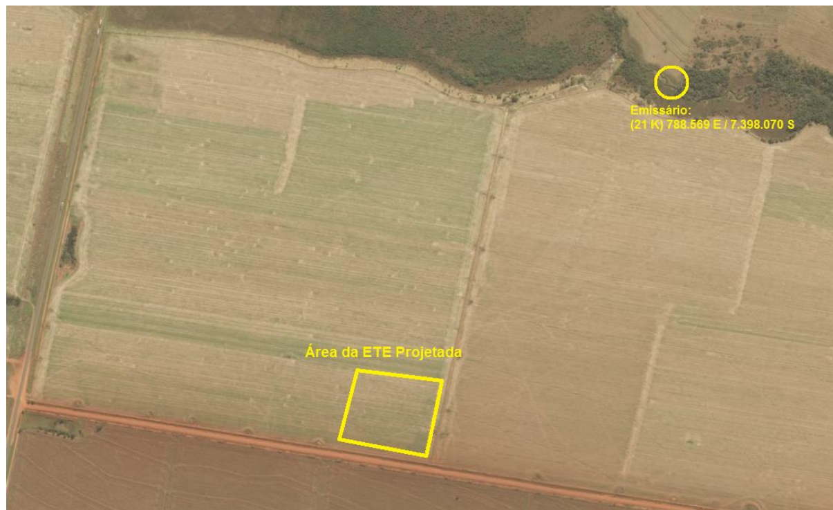
Figura 2: Vista da área pretendida para a ETE Itaquiraiá Projetada e entorno, Itaquiraiá, MS.

A ETE Itaquiraiá Projetada estará localizada nas coordenadas geográficas UTM (21 K) 788.445 E / 7.397.925 S, distante cerca de 170 m do corpo receptor. A área é recoberta por gramíneas de pastagem (Figura 2).