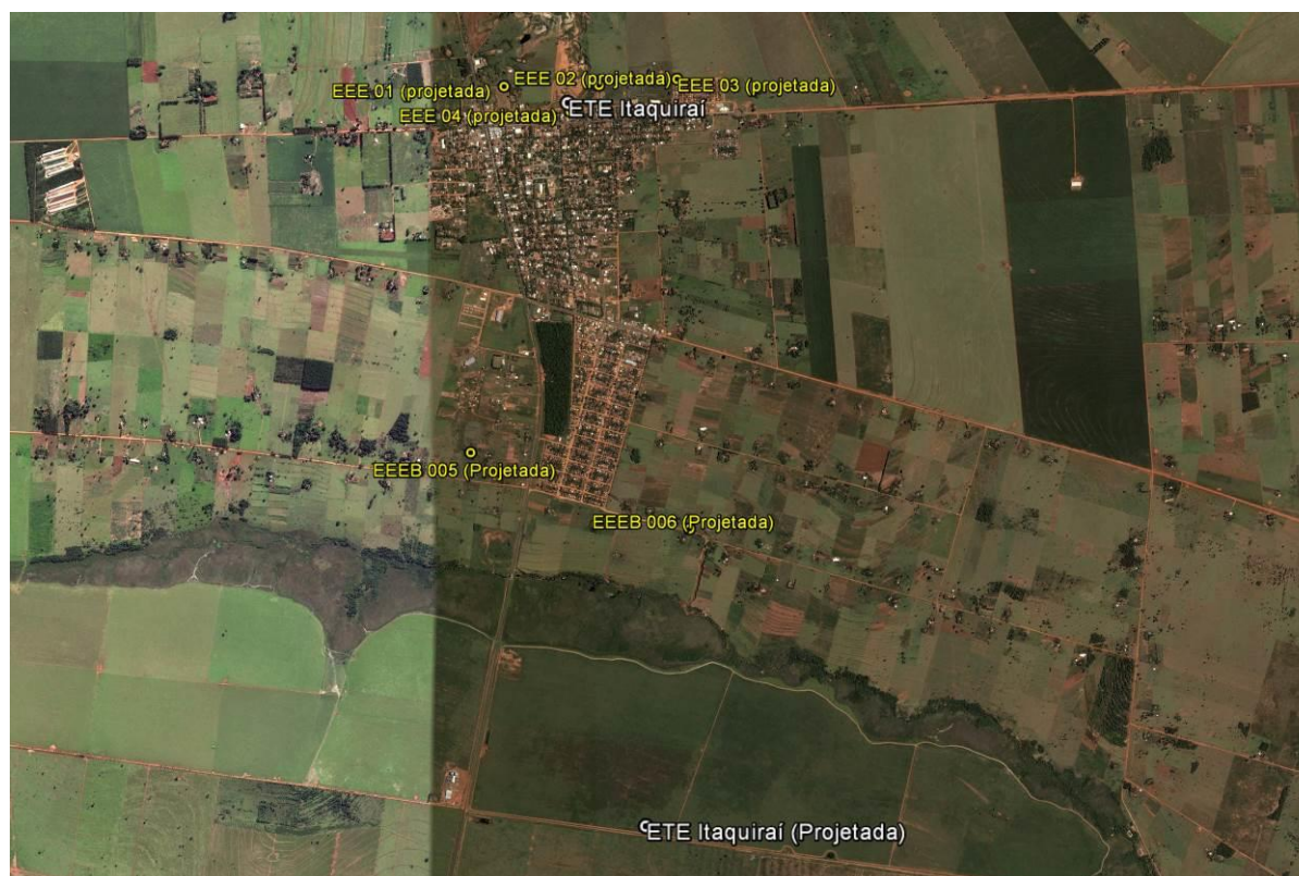
Figura 1: Localização das Unidades Operacionais existentes e projetadas na cidade de Itaquiraí, MS.

A cidade de Itaquiraí não possui Sistema de Esgotamento Sanitário (SES), porém possui locais selecionados para a implantação de uma Estação de Tratamento de Esgotos (ETE) e de seis Estações Elevatórias de Esgoto Bruto (EEEB) projetadas (Figura 1).