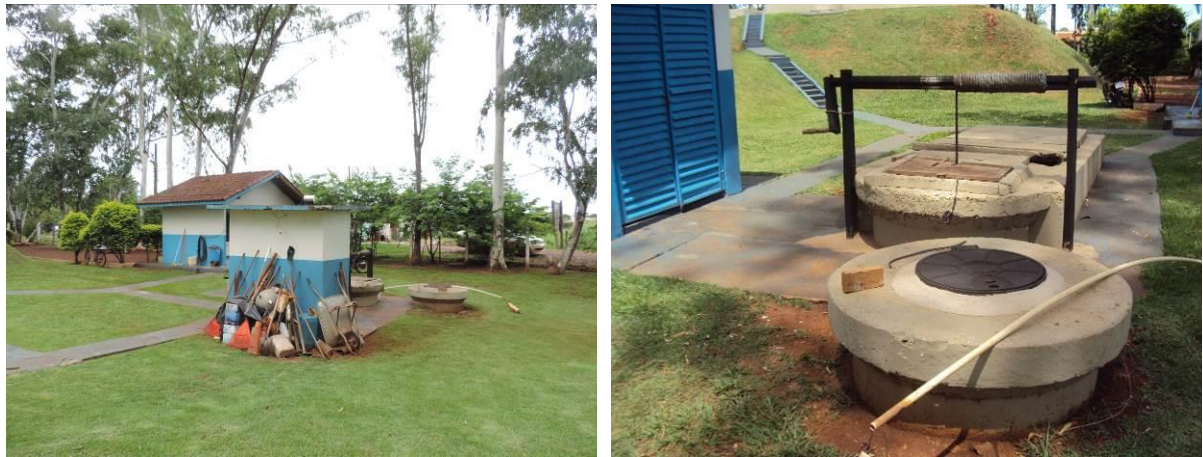
Figura 6: Vista geral da EEBB Pátio ETE, Itaporã, MS

A EEBB Pátio ETE, de acordo com o Sistema Interativo de Suporte ao Licenciamento Ambiental (SISLA) de MS, não se sobrepõe a nenhuma Unidade de Conservação ou Zonas de Amortecimento, nem a Terras Indígenas, Áreas de Perambulação, Quilombolas e Assentamentos Rurais.