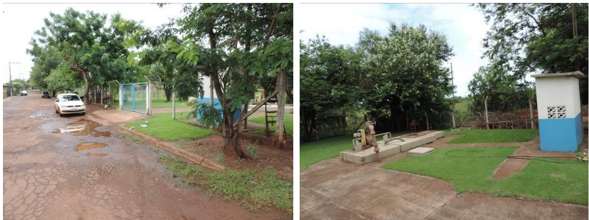
Figura 5: Vista geral da EEEB 007, Itaporã, MS.

A EEEB 007 localiza-se na zona urbana de Itaporã na Rua Frei Saturnino, coordenadas geográficas UTM (21 K) 727.211 E / 7.557.073 S, com a função de recalcar esgoto bruto até a ETE Itaporã. Encontra-se totalmente cercada por alambrado, com portão e trancas. A área esta recoberta por gramíneas e apresenta cortina arbórea cobrindo parcialmente o perímetro da estação (Figura 5). Não possui informação sobre extravasor.