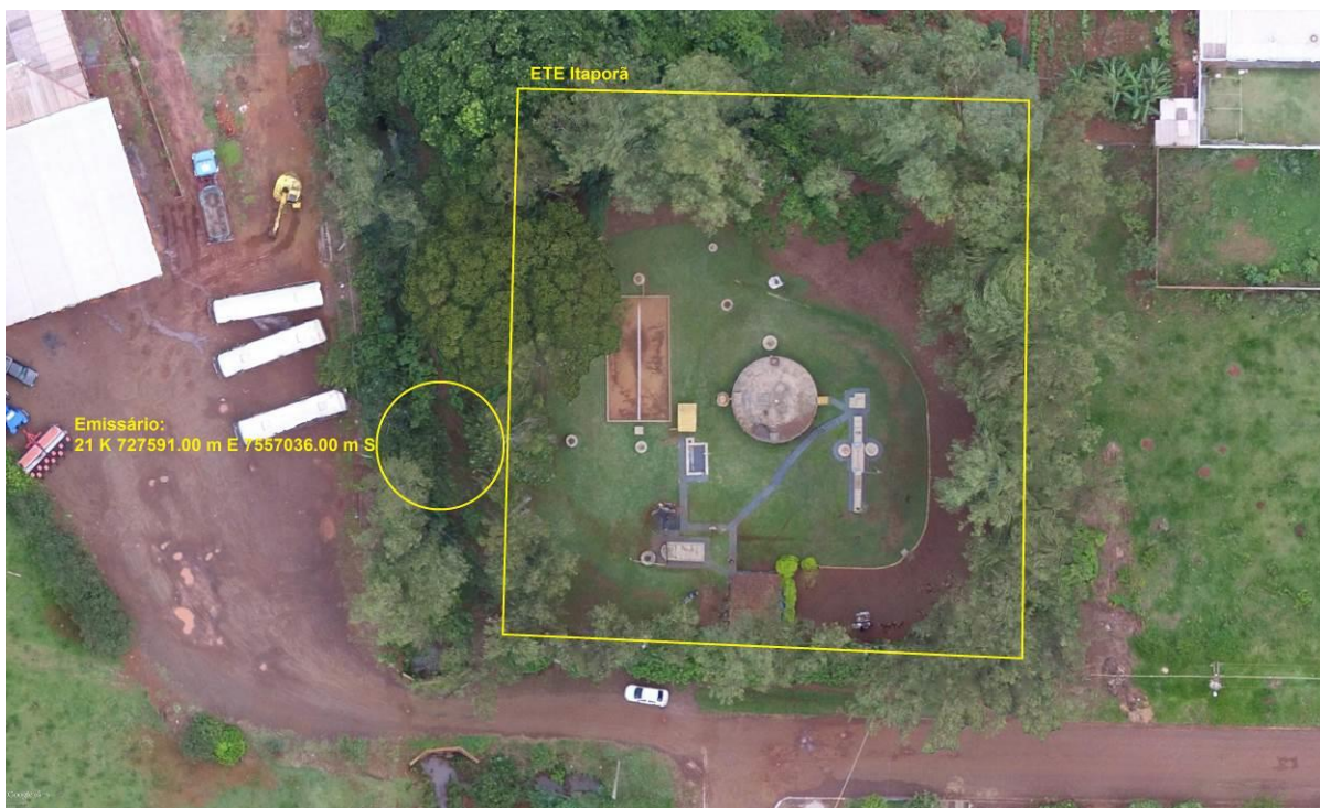
Figura 3: Vista aérea da ETE Itaporã e entorno, Itaporã, MS.

A ETE Itaporã, de acordo com o Sistema Interativo de Suporte ao Licenciamento Ambiental (SISLA) de MS, não se sobrepõe a nenhuma Unidade de Conservação ou