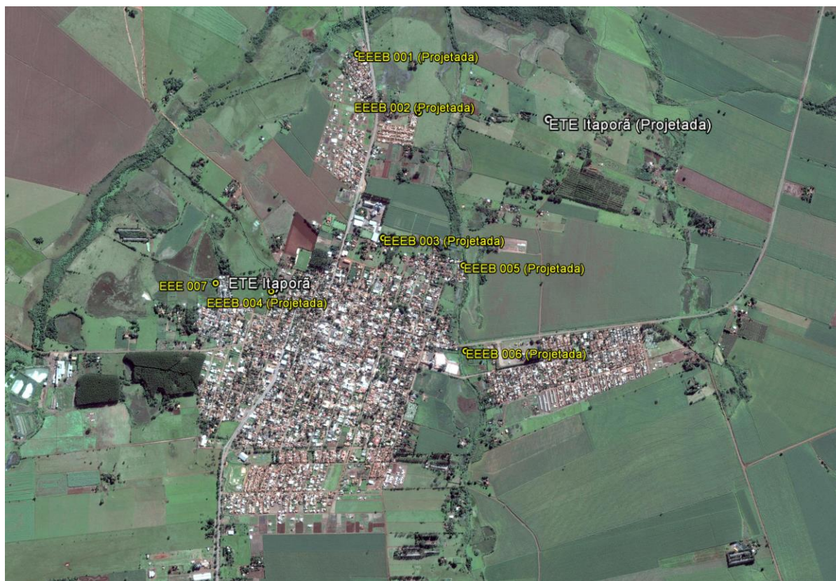
Figura 1: Localização das Unidades Operacionais existentes e projetadas na cidade de Itaporã, MS.

A cidade de Itaporã possui uma Estação de Tratamento de Esgotos (ETE) e duas Estações Elevatórias de Esgotos Bruto (EEEB) em operação. Possui ainda uma área selecionada para implantação de uma ETE Projetada (Figura 1).