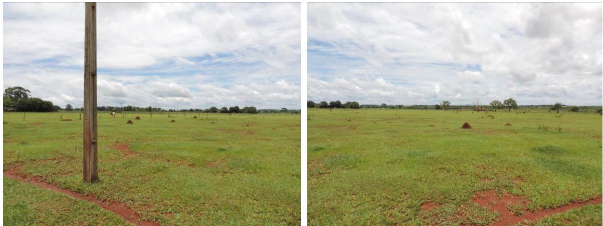
Figura 7: Vista da área e geral da área pretendida para a ETE Itaporã Projetada, Itaporã, MS.

A ETE Itaporã Projetada, de acordo com o Sistema Interativo de Suporte ao Licenciamento Ambiental (SISLA) de MS, não se sobrepõe a nenhuma Unidade de Conservação ou Zonas de Amortecimento, nem a Terras Indígenas, Áreas de Perambulação, Quilombolas e Assentamentos Rurais (Figura 8).