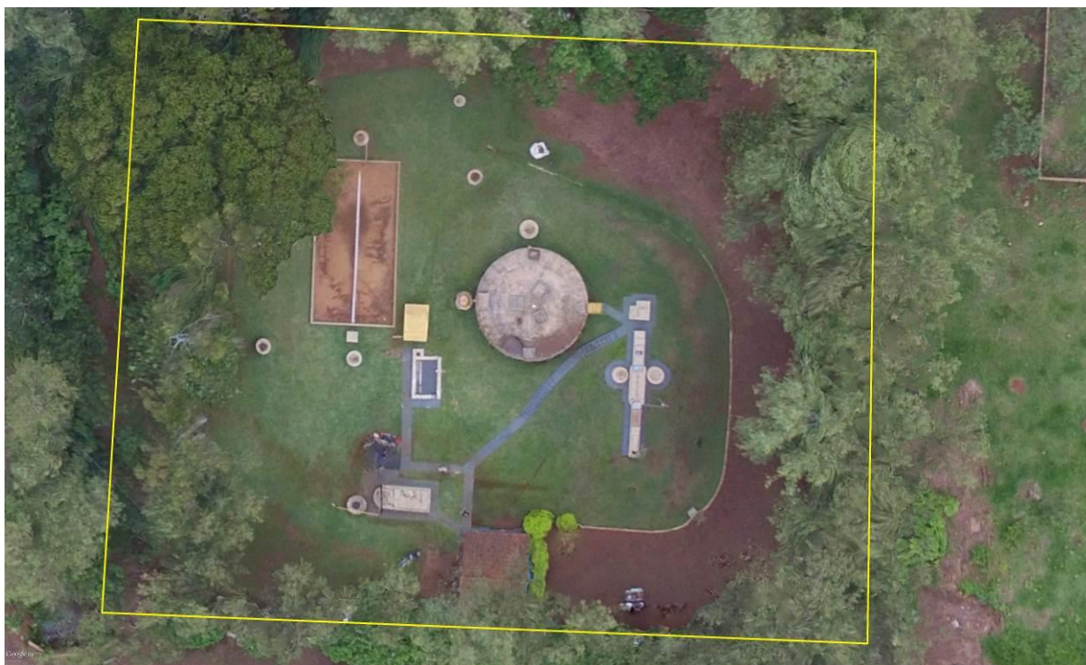
Figura 2: Vista aérea da ETE Itaporã, Itaporã, MS.