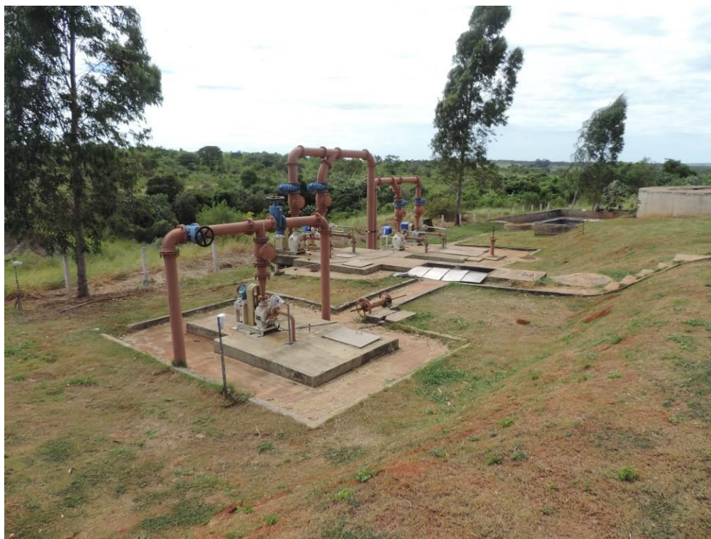
Figura 6: Vista geral da EEB 004, Iguatemi, MS.

A EEB 004, de acordo com o Sistema Interativo de Suporte ao Licenciamento Ambiental (SISLA) de MS, se sobrepõe à Área de Proteção Ambiental Intermunicipal da Bacia do Rio Iguatemi, mas não se sobrepõe a Terras Indígenas, Áreas de Perambulação, Quilombolas e Assentamentos Rurais.