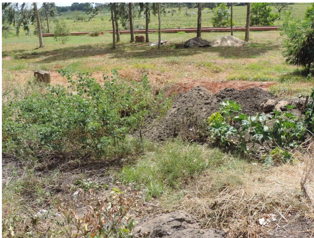
Figura 7: Resíduos sólidos resultantes do gradeamento na EEEB 004 são enterrados na área da ETE Iguatemi, Iguatemi, MS.