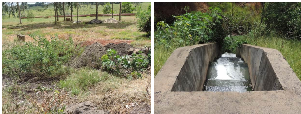
Figura 5: Resíduos sólidos enterrados na área da ETE Iguatemi e emissário no Córrego Sacarón, Iguatemi, MS.

Não foram identificados passivos ambientais decorrentes de vazamentos e erosão. Entretanto, os resíduos sólidos gerados estão sendo enterrados na própria área da ETE, causando impactos no solo e, possivelmente, nas águas subterrâneas. Relatórios apontam que o efluente tratado contribui para a queda da qualidade da água do corpo receptor por estar com seus parâmetros acima dos limites permitidos (Figura 5).