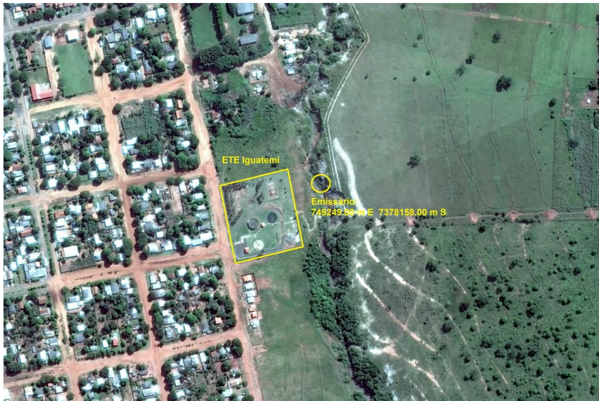
Figura 3: Vista aérea da ETE Iguatemi e entorno, Iguatemi, MS.

A ETE Iguatemi, de acordo com o Sistema Interativo de Suporte ao Licenciamento Ambiental (SISLA) de MS, se sobrepõe à Área de Proteção Ambiental Intermunicipal da Bacia do Rio Iguatemi, mas não se sobrepõe a Terras Indígenas, Áreas de Perambulação, Quilombolas e Assentamentos Rurais (Figura 4).