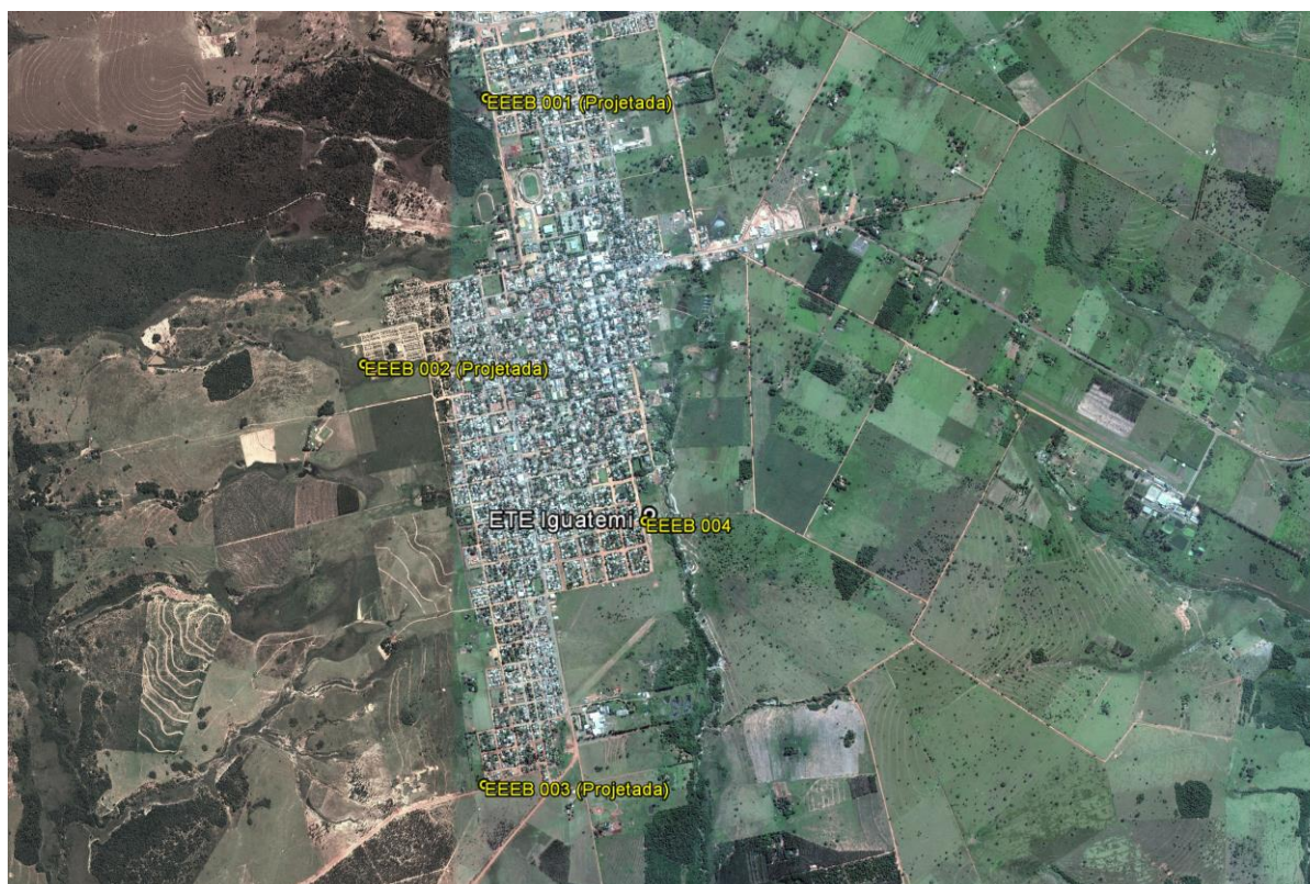
Figura 1: Localização das Unidades Operacionais existentes e projetadas na cidade de Iguatemi, MS.

A cidade de Iguatemi possui uma Estação de Tratamento de Esgotos (ETE) e uma Estação Elevatória de Esgoto Bruto (EEEB), ambas em operação. Possui, ainda, áreas selecionadas para a implantação de três Estações Elevatórias de Esgoto Bruto (EEEB) projetadas (Figura 1).