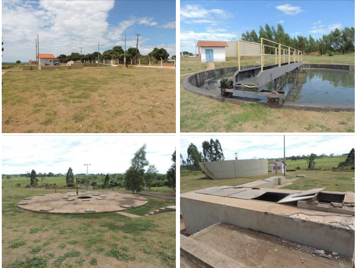
Figura 2: Vista geral da ETE Iguatemi, Iguatemi, MS.

7.378.118 S, distante 40 m do corpo receptor. Atualmente encontra-se totalmente cercada com cercas rurais de arame liso. A ETE contém algumas árvores esparsas em seu interior, mas não apresenta cortina arbórea (Figuras 2 e 3).