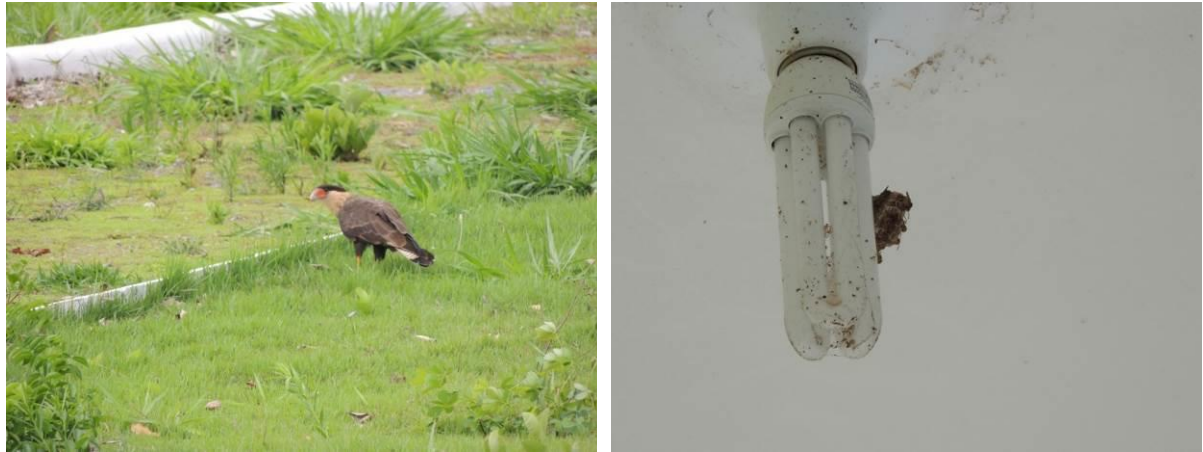
Figura 5: Registro de animais silvestres (gavião carcará - Caracara plancus ) e abelhas na ETE Guia Lopes da Laguna.

Não há geração de resíduos sólidos e lodo, pois a ETE não está em operação.