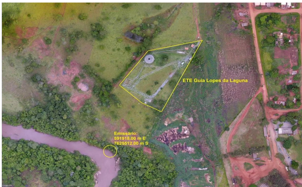
Figura 3: Vista aérea da ETE Guia Lopes da Laguna e entorno, Guia Lopes da Laguna, MS.