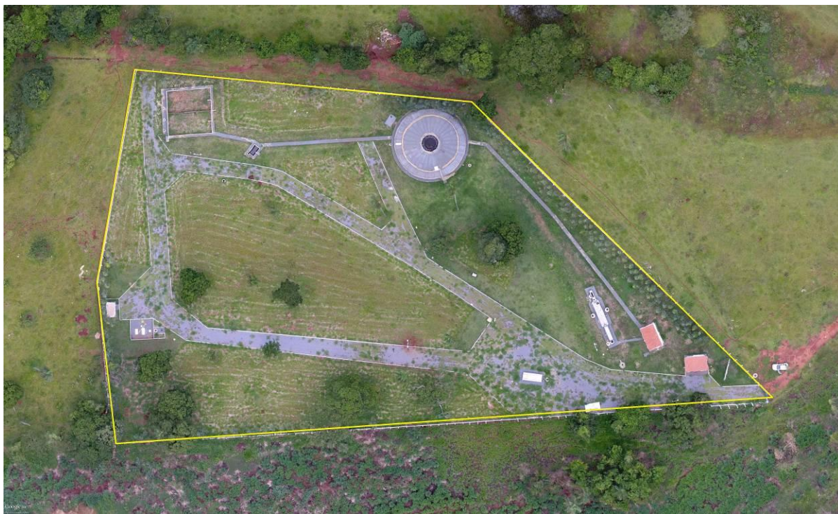
Figura 2: Vista aérea da ETE Guia Lopes da Laguna, Guia Lopes da Laguna, MS.

E / 7.625.699 S, distante 120 m do corpo receptor. Encontra-se totalmente cercada, com árvores esparsas em seu interior e com cortina arbórea parcial no entorno (Figuras 2 e 3). Não possui informação sobre extravasor.