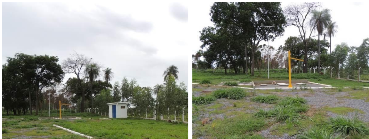
Figura 6: Vista geral da EEEB Final, Guia Lopes da Laguna, MS.

A EEEB Final, de acordo com o Sistema Interativo de Suporte ao Licenciamento Ambiental (SISLA) de MS, não se sobrepõe a nenhuma Unidade de Conservação ou Zonas de Amortecimento, nem a Terras Indígenas, Áreas de Perambulação, Quilombolas e Assentamentos Rurais.