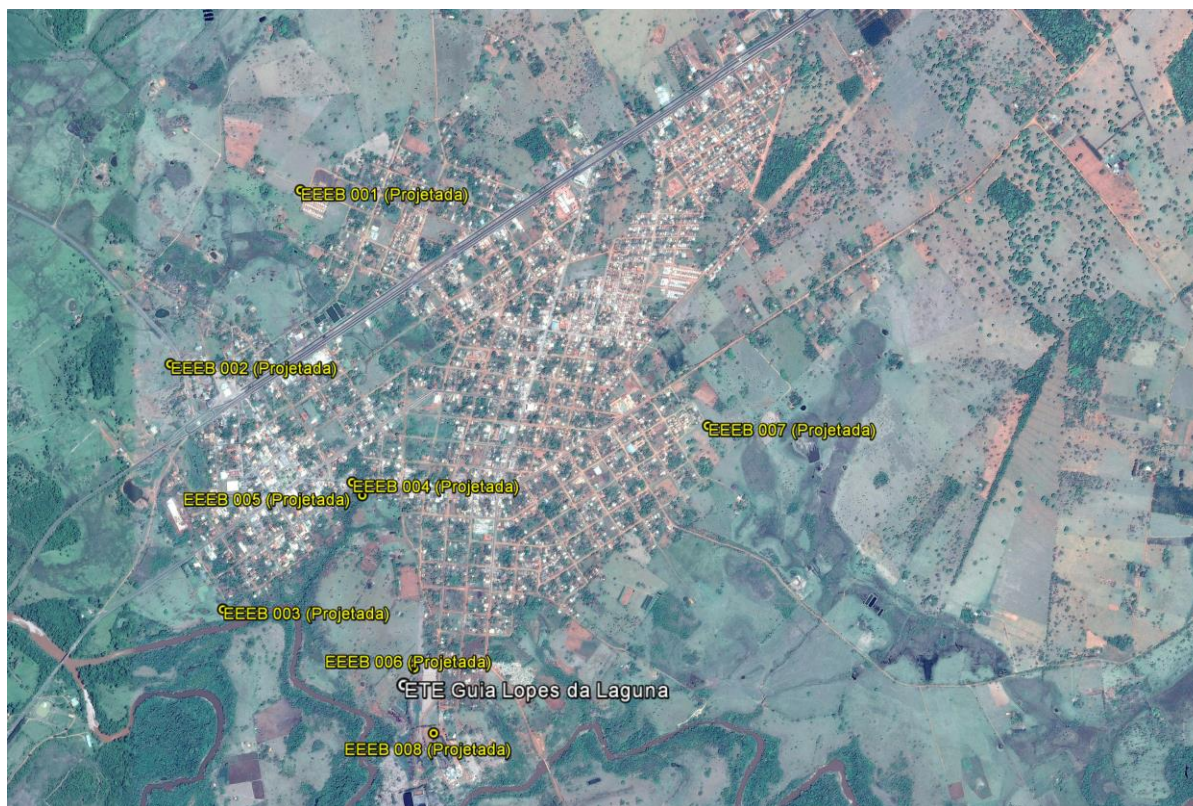
Figura 1: Localização das Unidades Operacionais existentes e projetadas na cidade de Guia Lopes da Laguna, MS.

A cidade de Guia Lopes da Laguna possui uma Estação de Tratamento de Esgotos (ETE) e uma Estação Elevatória de Esgoto Bruto (EEEB) implantadas, mas não em operação. Possui, ainda, áreas selecionadas para a implantação de oito Estações Elevatórias de Esgoto Bruto (EEEB) projetadas (Figura 1)