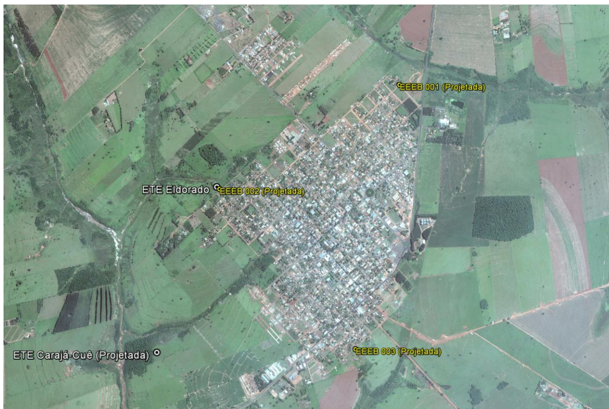
Figura 1: Localização das Unidades Operacionais existentes e projetadas na cidade de Eldorado, MS.

A cidade de Eldorado possui uma Estação de Tratamento de Esgoto (ETE) em operação. Possui, ainda, áreas selecionadas para a implantação de uma Estação de Tratamento de Esgoto (ETE) e três Estações Elevatórias de Esgoto Bruto (EEEB) projetadas (Figura 1).