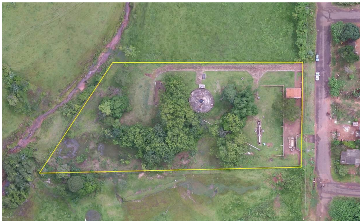
Figura 2: Vista aérea da ETE Eldorado, Eldorado, MS.

A ETE Eldorado está localizada na zona urbana de Eldorado na Rua Adolfo Amaral, coordenadas geográficas UTM (21K) 775.598 E / 7.367.382 S, distante 90 m do corpo receptor. Encontra-se totalmente cercada com alambrado e cercas com arame liso, com árvores em seu interior e sem cortina arbórea no entorno (Figuras 2 Erro! Fonte de referência não encontrada. e 3).