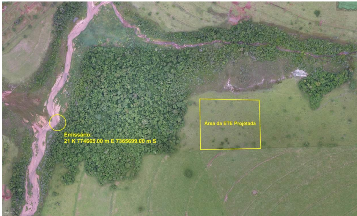
Figura 6: Vista da área pretendida para a ETE Carajá-Cuê Projetada, Eldorado, MS.

A área é recoberta por gramíneas de pastagem e contém algumas árvores esparsas (Figura 6).