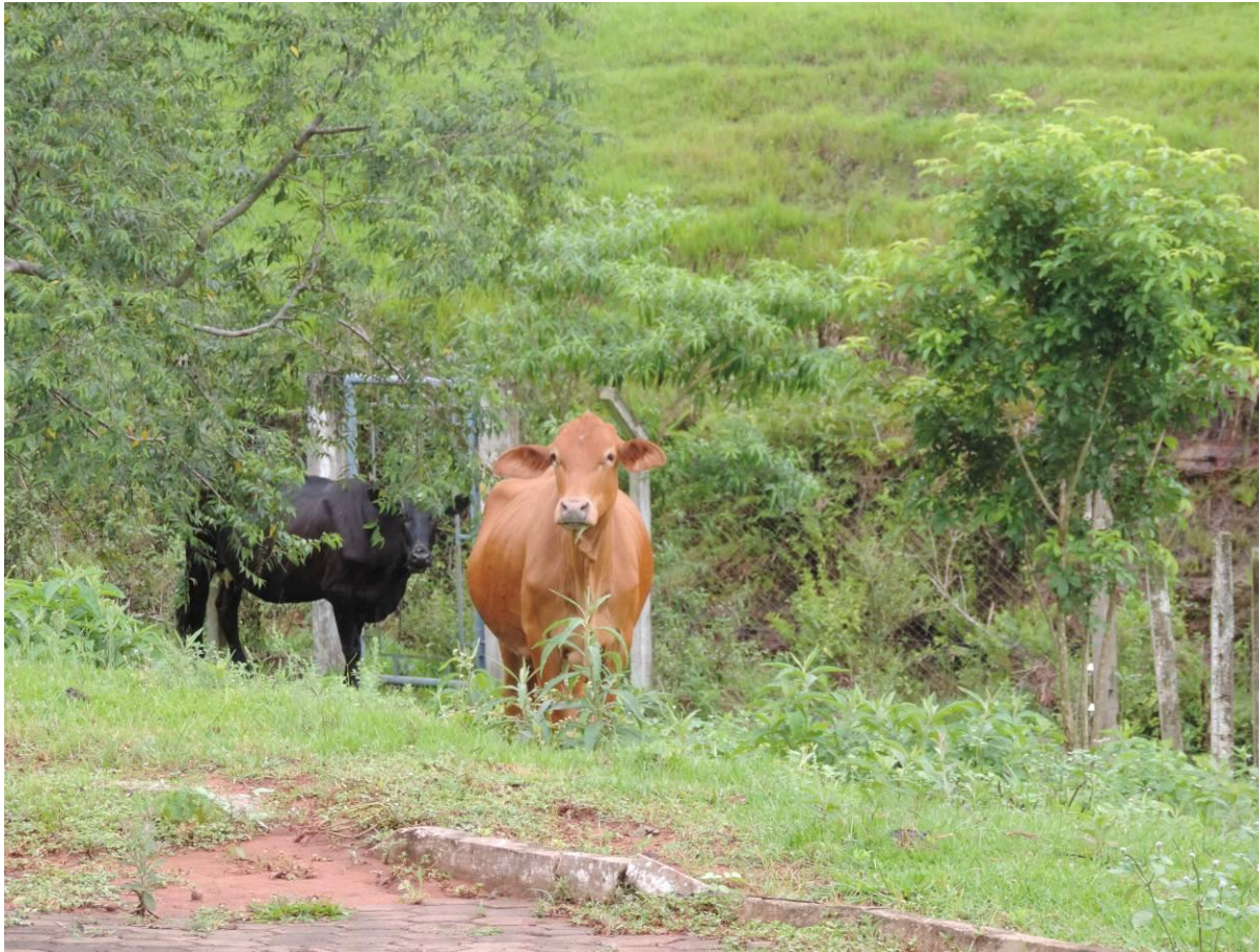
Figura 5: Presença de bovinos no interior da ETE Eldorado, Eldorado, MS.