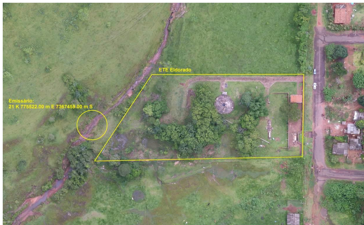
Figura 3: Vista aérea da ETE Eldorado e entorno, Eldorado, MS.

A ETE Eldorado, de acordo com o Sistema Interativo de Suporte ao Licenciamento Ambiental (SISLA) de MS, não se sobrepõe a nenhuma Unidade de Conservação ou Zonas de Amortecimento, nem a Terras Indígenas, Áreas de Perambulação, Quilombolas e Assentamentos Rurais (Figura 4).