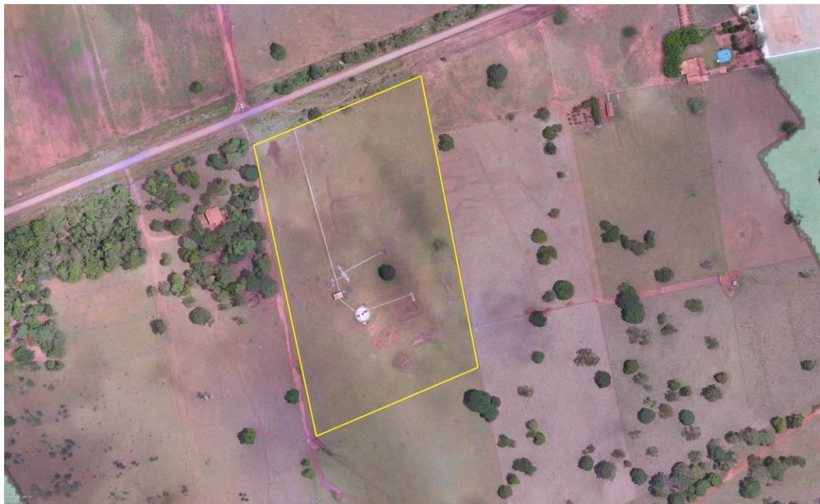
Figura 2: Vista aérea da ETE Dois Irmãos do Buriti, Dois Irmãos do Buriti, MS.

UTM (21 K) 684.168 E / 7.713.351 S, distante 1.900 m do corpo receptor. Encontra-se totalmente cercada, com poucas árvores em seu interior e sem cortina arbórea no entorno (Figuras 2 e 3).