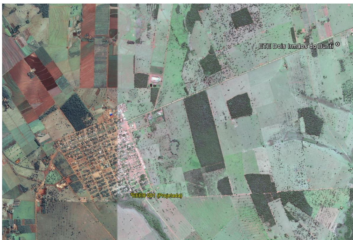
Figura 1: Localização das Unidades Operacionais existentes e projetadas na cidade de Dois Irmãos do Buriti, MS.

A cidade de Dois Irmãos do Buriti possui uma Estação de Tratamento de Esgotos (ETE) implantada, mas que ainda não entrou em operação. Possui, ainda, área selecionada para a implantação de uma Estação Elevatória de Esgoto Bruto (EEEB) projetada (Figura 1).