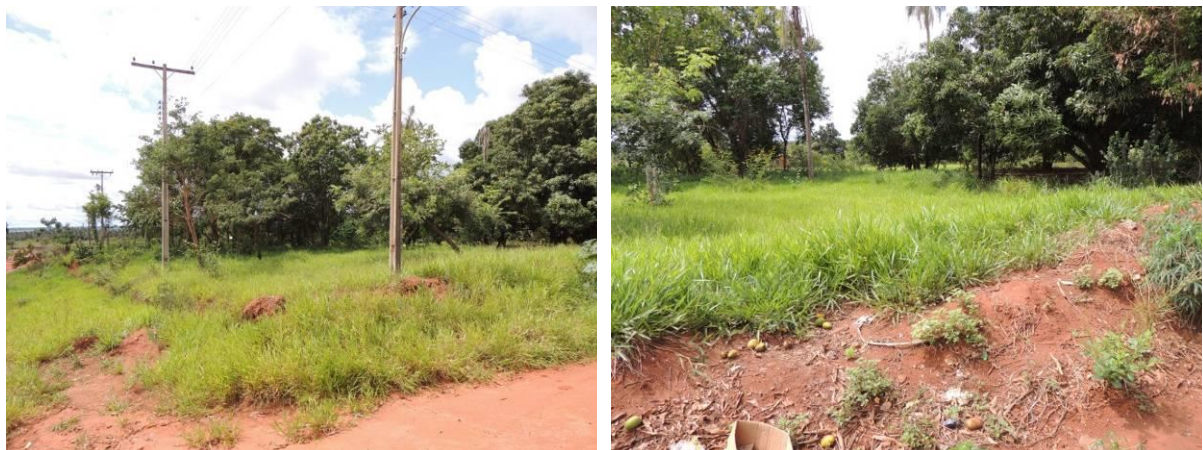
Figura 6: Área prevista para implantação da EEEB 001 Projetada, Dois Irmãos do Buriti, MS.

A EEEB 001 Projetada, elevatória que terá função de recalque do esgoto bruto para a ETE Dois Irmãos do Buriti, localiza-se na Rua Rondonópolis com a Rua Gerônima Teixeira Ramos, coordenadas geográficas UTM (21 K) 680.015 E / 7.710.432 S. A área encontra-se aberta, sem cercamento (Figura 6). Não possui informações sobre extravasor.