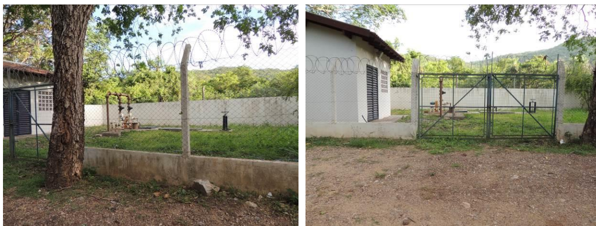
Figura 18: Vista geral da EEEB 011, Corumbá, MS.

A EEEB 011 localiza-se na rua Barão do Melgaço com rua Minas Gerais, coordenadas geográficas UTM (21 K) 433.440 E / 7.896.846 S, completamente cercada por muros, cercas e grades com portão e trancas, tendo como função transpor área de contribuição (Figura 18). Não possui extravasor.