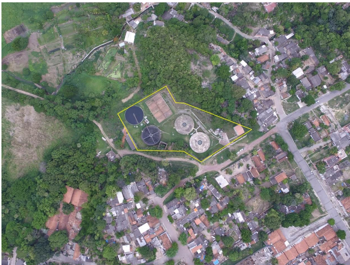
Figura 2: Vista aérea da ETE Olaria, Corumbá, MS.

m do corpo receptor. Encontra-se totalmente cercada, com poucas árvores em seu interior e sem cortina arbórea no entorno (Figura 2).