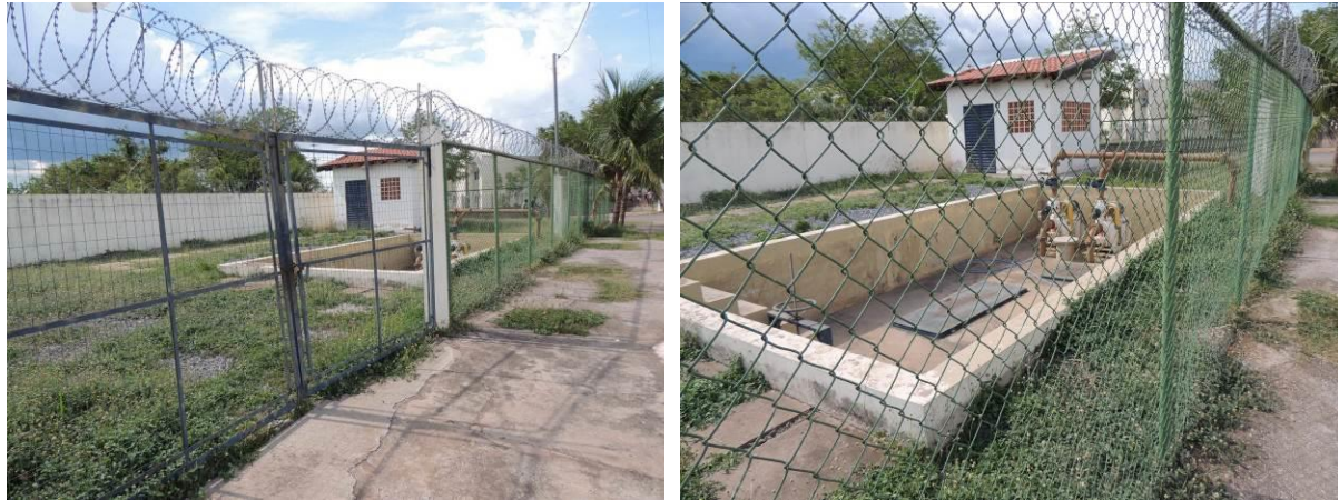
Figura 11: Vista geral da EEEB 004, Corumbá, MS.

A EEEB 004, de acordo com o Sistema Interativo de Suporte ao Licenciamento Ambiental (SISLA) de MS, não se sobrepõe a nenhuma Unidade de Conservação ou Zonas de Amortecimento, nem a Terras Indígenas, Áreas de Perambulação, Quilombolas e Assentamentos Rurais.