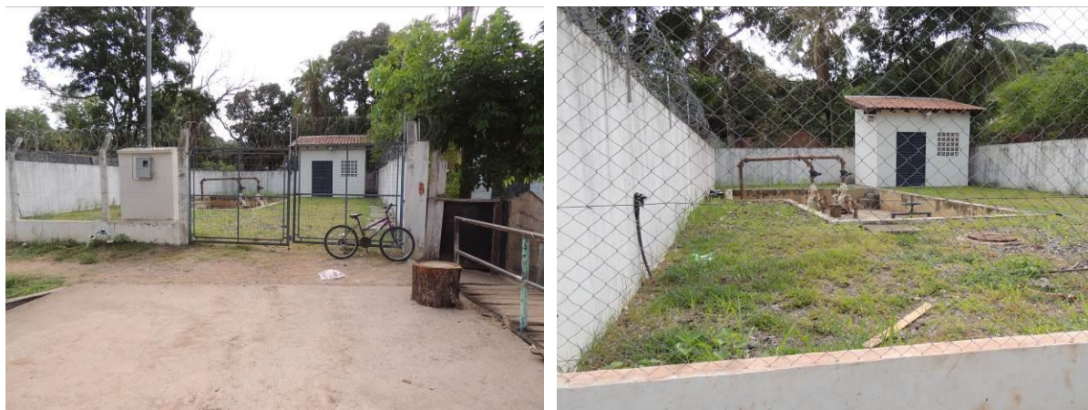
Figura 19: Vista geral da EEBE 012 ou Dom Pedro II, Corumbá, MS.

A EEBE 012, de acordo com o Sistema Interativo de Suporte ao Licenciamento Ambiental (SISLA) de MS, não se sobrepõe a nenhuma Unidade de Conservação ou Zonas de Amortecimento, nem a Terras Indígenas, Áreas de Perambulação, Quilombolas e Assentamentos Rurais.