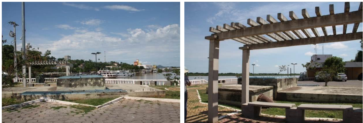
Figura 8: Vista geral da EEEB 001, Corumbá, MS.

A EEEB 001, elevatória subterrânea com função de recalque do esgoto bruto para a ETE Olaria, localiza-se na zona urbana de Corumbá na Rua Manoel Cavassa, Porto Geral, coordenadas geográficas UTM (21 K) 431.376 E / 7.899.527 S. Encontra-se fechada com trancas, porém sem cercamento (Figura 8). Possui extravasor que tem saída no Rio Paraguai.