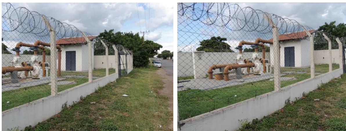
Figura 20: Vista geral da EEEB 013, Corumbá, MS.

A EEEB 013 localiza-se na rua Gonçalves Dias com a rua Firmo de Matos, coordenadas geográficas UTM (21 K) 431.123 E / 7.897.467 S, completamente cercada por muros, cercas e grades com portão e trancas, tendo como função a transposição de bacia (Figura 20). Possui extravasor.