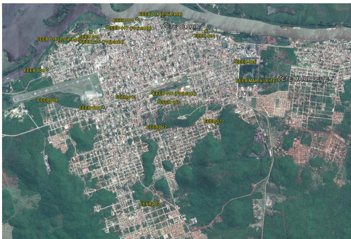
Figura 1: Localização das Unidades Operacionais existentes e projetadas na cidade de Corumbá, MS.

A cidade de Corumbá possui duas Estações de Tratamento de Esgotos (ETE) e 13 Estações Elevatórias de Esgoto Bruto (EEEB), todas em operação. Possui, ainda, áreas selecionadas para a implantação de cinco Estações Elevatórias de Esgoto Bruto (EEEB) projetadas (Figura 1 Erro! Fonte de referência não encontrada.).