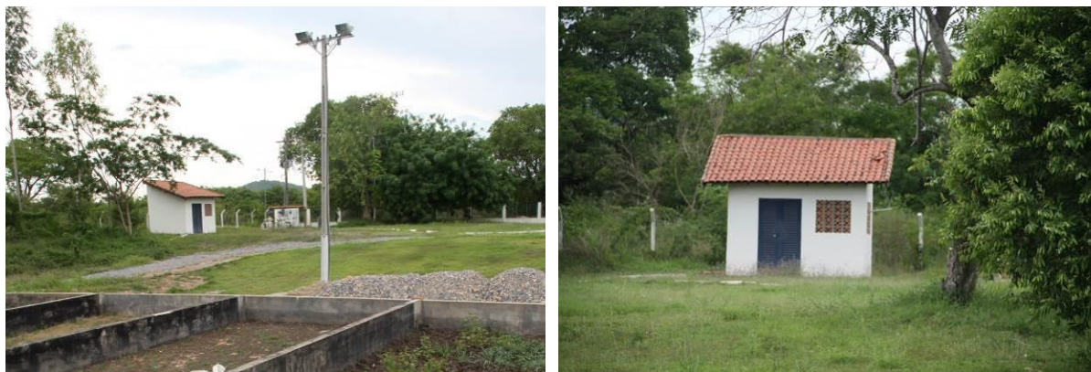
Figura 9: Vista geral da EEEB 002, Corumbá, MS.

A EEEB 002, de acordo com o Sistema Interativo de Suporte ao Licenciamento Ambiental (SISLA) de MS, não se sobrepõe a nenhuma Unidade de Conservação ou Zonas de Amortecimento, nem a Terras Indígenas, Áreas de Perambulação, Quilombolas e Assentamentos Rurais.