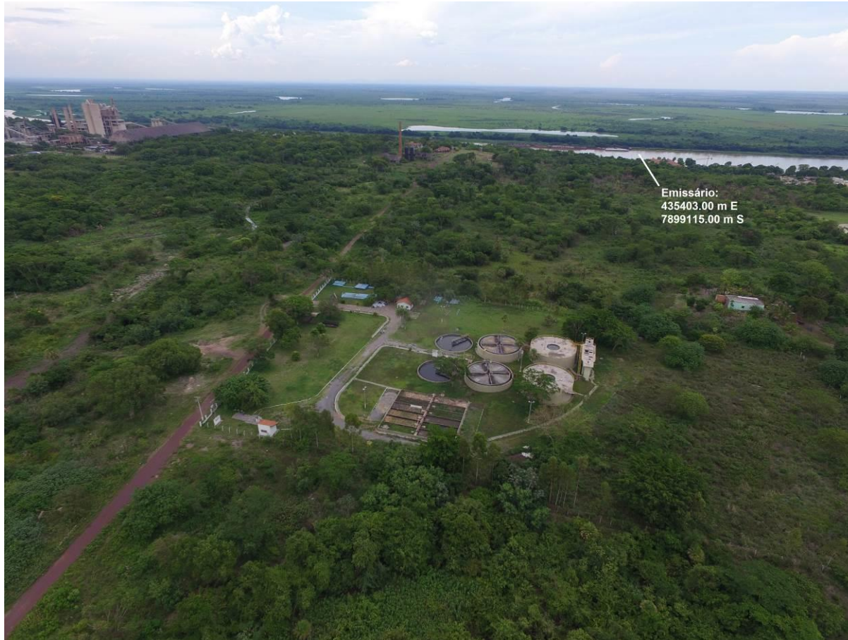
Figura 6: Vista aérea da ETE Maria Leite e entorno, Corumbá, MS.

A ETE Maria Leite, de acordo com o Sistema Interativo de Suporte ao Licenciamento Ambiental (SISLA) de MS, não se sobrepõe a nenhuma Unidade de Conservação ou Zonas de Amortecimento, nem a Terras Indígenas, Áreas de Perambulação, Quilombolas e Assentamentos Rurais (Figura 7).