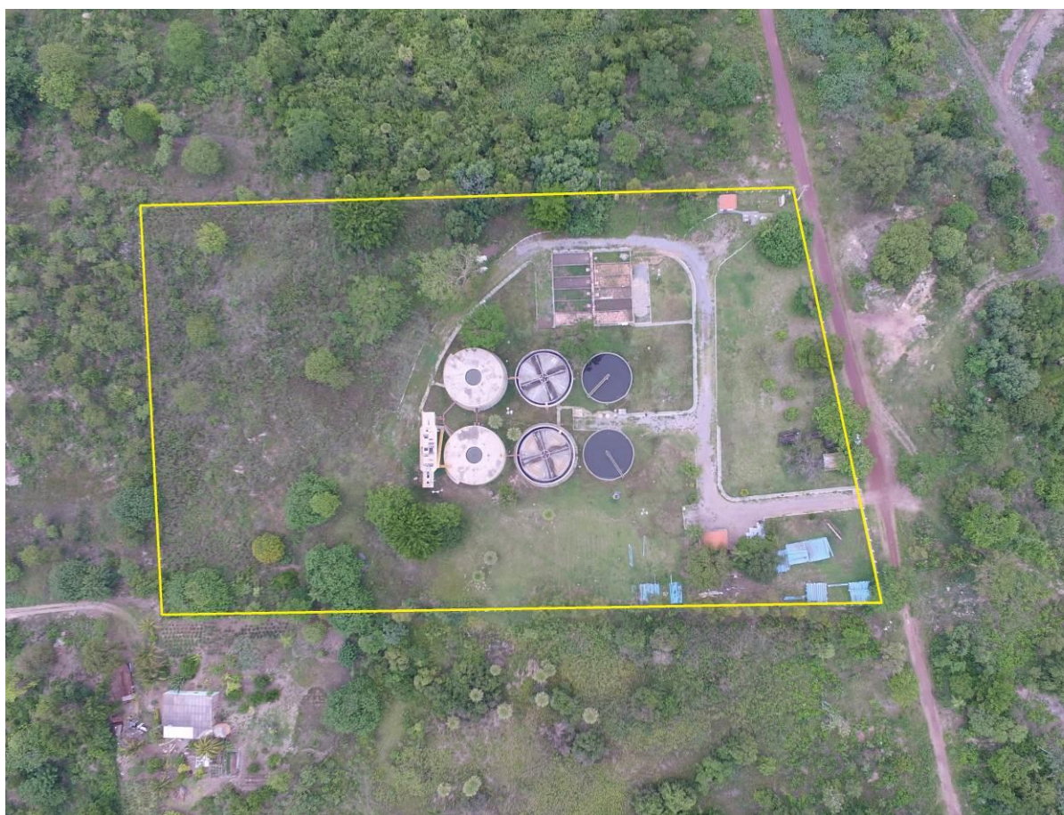
Figura 5: Acima: Vista aérea da ETE Maria Leite, Corumbá, MS.

A ETE Maria Leite está localizada na zona urbana de Corumbá na Av. Orcírio Miranda dos Santos, coordenadas geográficas UTM (21K) 435.145 E / 7.898.027 S, distante 1.000 m do corpo receptor. Encontra-se totalmente cercada, com poucas árvores em seu interior e sem cortina arbórea no entorno (Figuras 5 e 6).