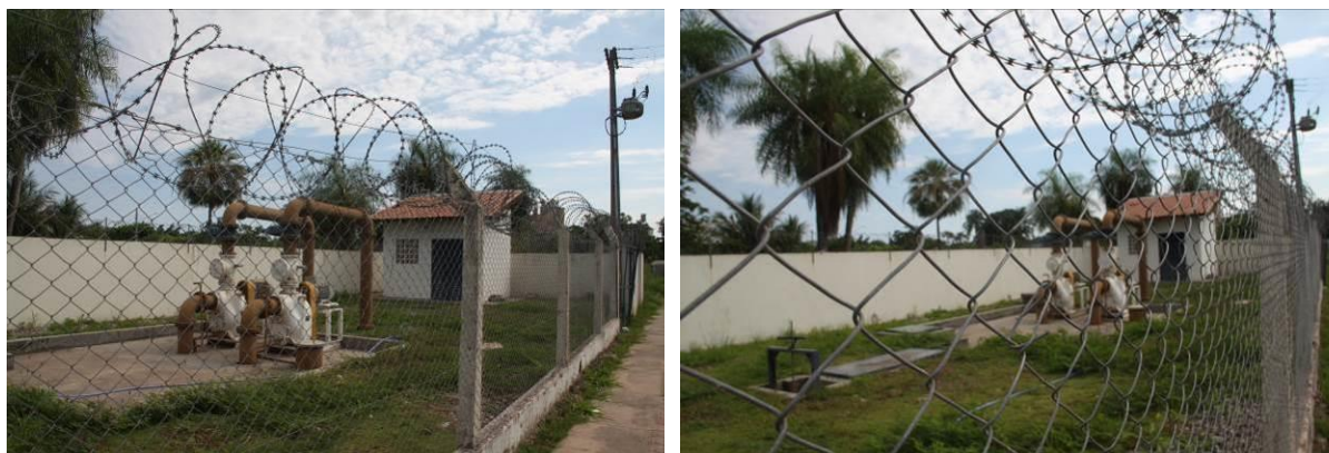
Figura 12: Vista geral da EEEB 005 ou General Dutra, Corumbá, MS.

A EEEB 005 localiza-se na rua General Dutra com rua Santo Antônio, coordenadas geográficas UTM (21 K) 433.947 E / 7.898.457 S, completamente cercada por muros, cercas e grades com portão e trancas, sendo terminal para a ETE Maria Leite (Figura Erro! Fonte de referência não encontrada.12). Não possui informação sobre extravasor.