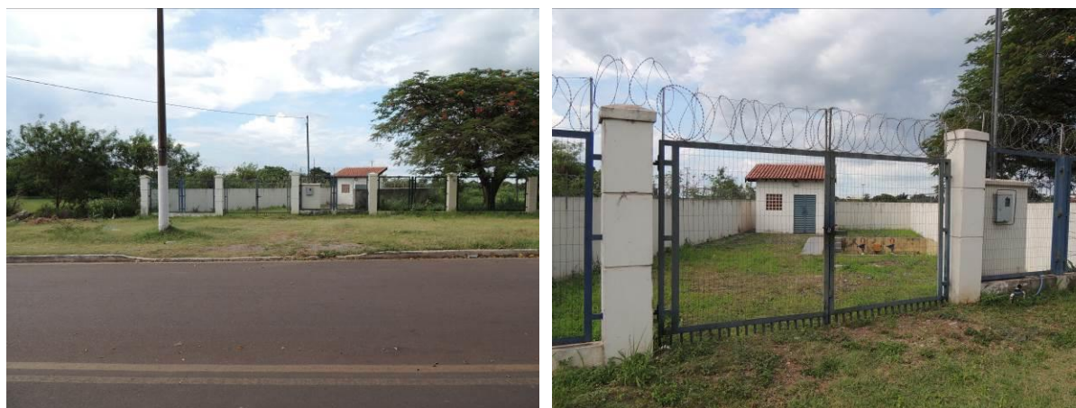
Figura 14: Vista geral da EEEB 007, Corumbá, MS.

A EEEB 007 localiza-se na rua Duque de Caxias, coordenadas geográficas UTM (21 K) 431.959 E / 7.897.403 S, completamente cercada por muros, cercas e grades com portão e trancas, tendo como função a transposição de bacia (Figura 14). Não possui informação sobre extravasor.