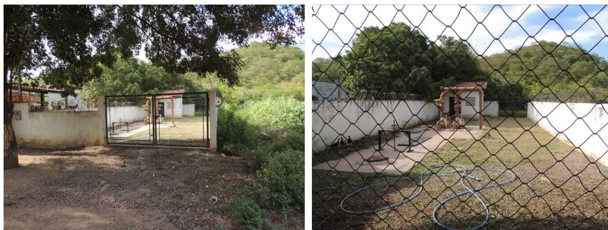
Figura 10: Vista geral da EEEB 003, Corumbá, MS.

A EEEB 003 localiza-se na rua Vinte e Um de Setembro com a rua Ceará, coordenadas geográficas UTM (21 K) 431.765 E / 7.894.701 S, completamente cercada por muros, cercas e portão com trancas, tendo como função transposição de bacia (Figura 10). Possui extravasor.