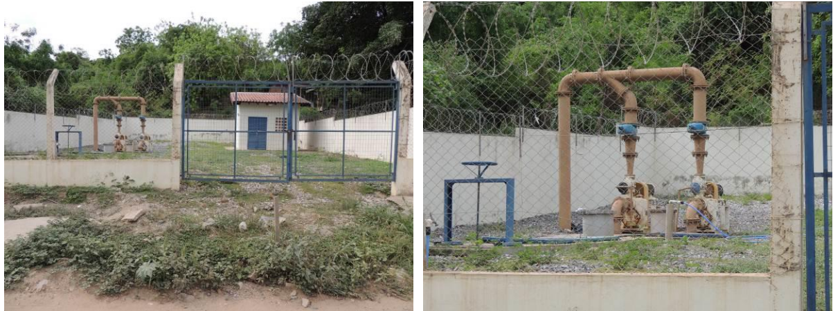
Figura 17: Vista geral da EEEB 010 ou Areeiro, Corumbá, MS.

A EEEB 010, de acordo com o Sistema Interativo de Suporte ao Licenciamento Ambiental (SISLA) de MS, não se sobrepõe a nenhuma Unidade de Conservação ou Zonas de Amortecimento, nem a Terras Indígenas, Áreas de Perambulação, Quilombolas e Assentamentos Rurais.