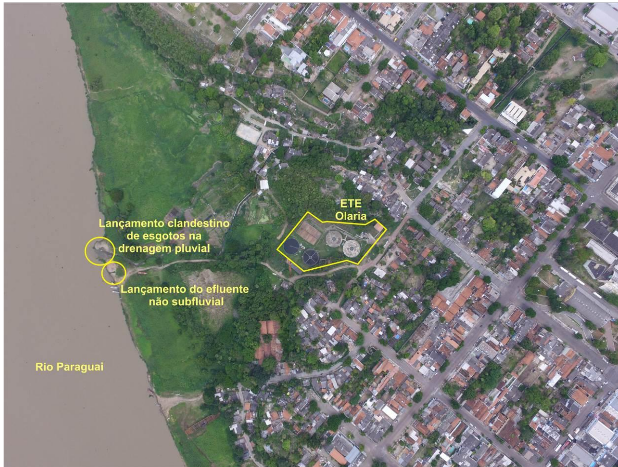
Figura 3: Vista aérea da ETE Olaria e entorno.

A ETE Olaria, de acordo com o Sistema Interativo de Suporte ao Licenciamento Ambiental (SISLA) de MS, não se sobrepõe a nenhuma Unidade de Conservação ou Zonas de Amortecimento, nem a Terras Indígenas, Áreas de Perambulação, Quilombolas e Assentamentos Rurais (Figura 4).