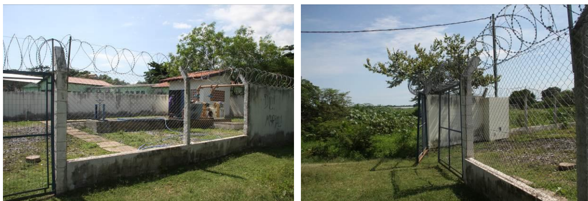
Figura 16: Vista geral da EEEB 009 ou Cacimba, Corumbá, MS.

A EEEB 009 localiza-se na alameda do Tamengo, coordenadas geográficas UTM (21 K) 430.159 E / 7.899.191 S, completamente cercada por muros e portão com trancas, tendo como função a transposição de bacia (Figura 16). Possui extravasor com saída no Rio Paraguai.