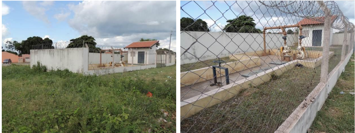
Figura 13: Vista geral da EEEB 006, Corumbá, MS.

A EEEB 006, de acordo com o Sistema Interativo de Suporte ao Licenciamento Ambiental (SISLA) de MS, não se sobrepõe a nenhuma Unidade de Conservação ou Zonas de Amortecimento, nem a Terras Indígenas, Áreas de Perambulação, Quilombolas e Assentamentos Rurais.