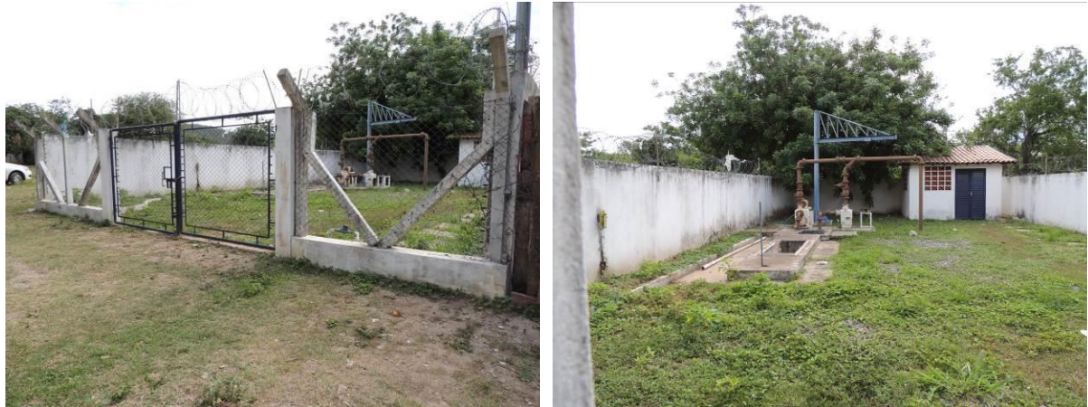
Figura 15: Vista geral da EEEB 008, Corumbá, MS.

A EEEB 008, de acordo com o Sistema Interativo de Suporte ao Licenciamento Ambiental (SISLA) de MS, não se sobrepõe a nenhuma Unidade de Conservação ou Zonas de Amortecimento, nem a Terras Indígenas, Áreas de Perambulação, Quilombolas e Assentamentos Rurais.