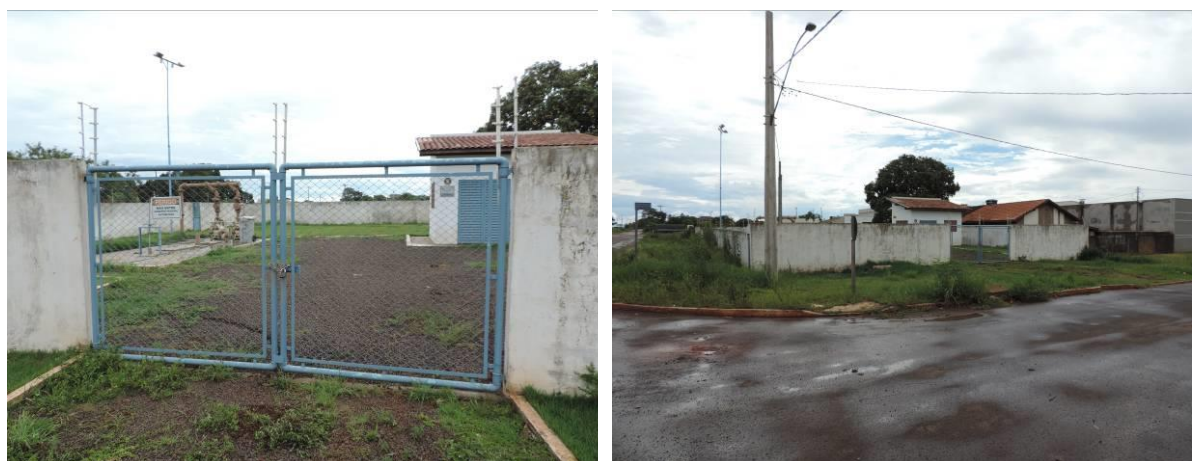
Figura 6: Vista geral da EEEB 002, Caarapó, MS.

A EEEB 002 localiza-se na Rua Arcenio Cardoso esquina com a Rua Sergipe, coordenadas geográficas UTM (21 K) 724.597 E / 7.494.497 S, tendo como função recalcar o esgoto afluyente para rede que segue por gravidade até a ETE Caarapó. Encontra-se completamente cercada por alambrado e portão com trancas para veículos (Figura 6). Possui extravasor.