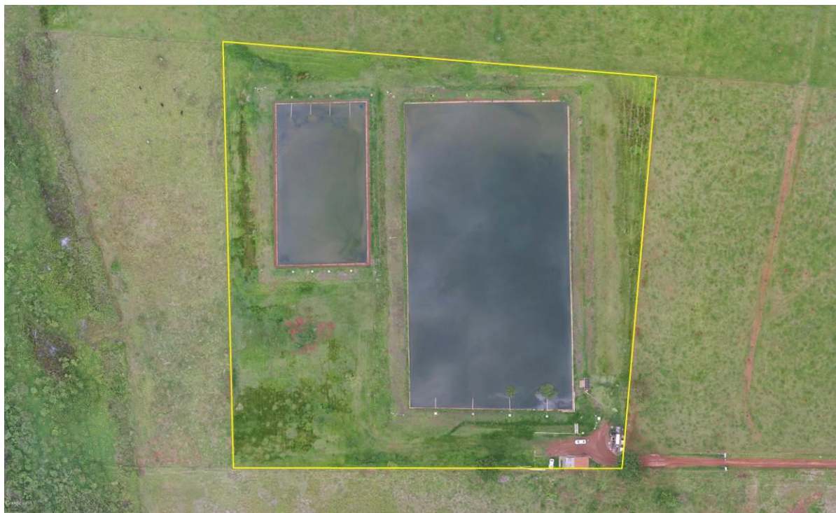
Figura 2: Vista aérea da ETE Caarapó, Caarapó, MS.

Maranhão, coordenadas geográficas UTM (21 K) 722.474 E / 7.498.144 S, distante 97 m do corpo receptor. Encontra-se cercada com arame liso, com portão de grade e tranca para veículos e pedestres. Não apresenta cortina arbórea (Figuras 2 e 3).