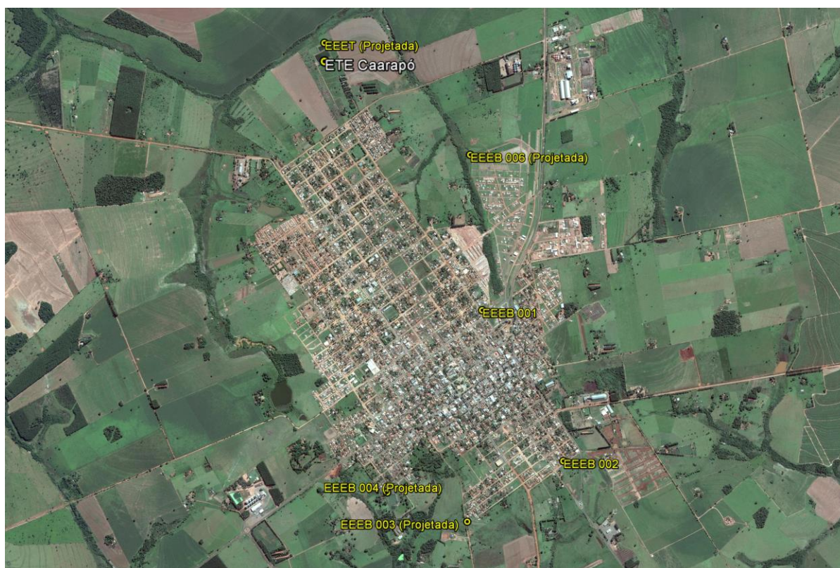
Figura 1: Localização das Unidades Operacionais existentes e projetadas na cidade de Caarapó, MS.

A cidade de Caarapó possui uma Estação de Tratamento de Esgotos (ETE) e duas Estações Elevatórias de Esgoto Bruto (EEEB), todas em operação. Possui, ainda, áreas selecionadas para a implantação de três Estações Elevatórias de Esgoto Bruto (EEEB) projetadas (Figura 1).