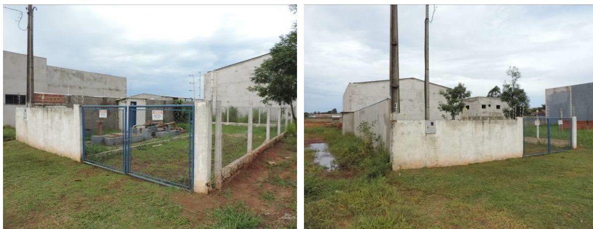
Figura 5: Vista geral da EEEB 001, Caarapó, MS.

A EEEB 001 localiza-se na Rua Doutor Coutinho, na quadra entre as ruas Mato Grosso e Manoel Ferreira de Araújo, coordenadas geográficas UTM (21 K) 723.879 E / 7.495.868 S, tendo como função recalcar o esgoto afluente para rede que segue por gravidade até a Estação de Tratamento de Esgotos (ETE) Caarapó. Encontra-se completamente cercada por alambrado e portão com trancas para veículos (Figura 5). Possui extravasor.