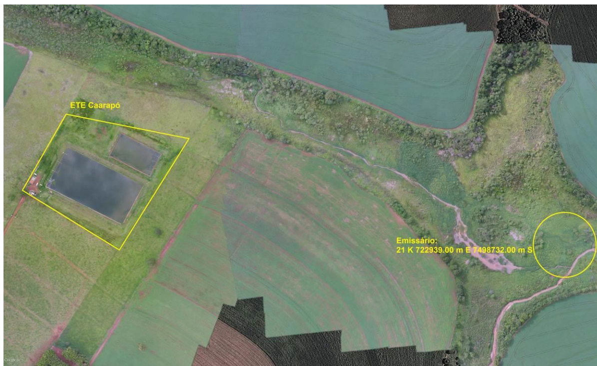
Figura 3: Vista aérea da ETE Caarapó e entorno, Caarapó, MS.