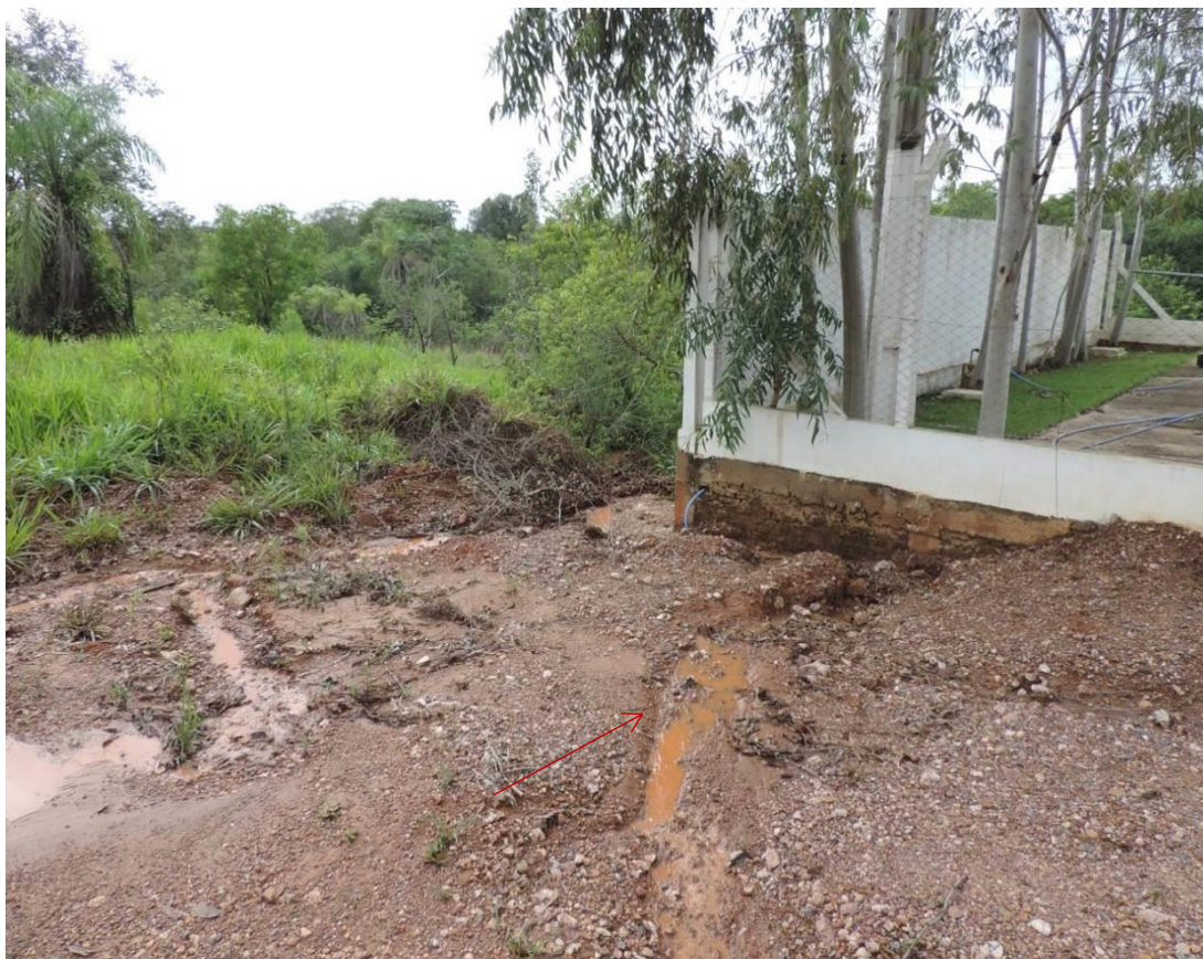
Figura 9: Processo erosivo instalado junto ao muro da EEEB Tarumã I, Bonito, MS.

Não foram identificados passivos ambientais decorrentes de vazamentos e de acondicionamento de resíduos sólidos na área da EEEB, porém há erosão na parte externa da EEEB Tarumã I (Figura 9).