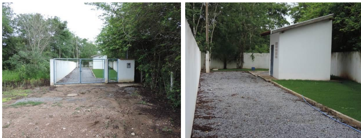
Figura 7: Vista geral da EEEB Portal do Rio Formoso, Bonito, MS.

A EEEB Portal do Rio Formoso localiza-se na Rua Nabileque, S/N, loteamento Portal do Rio Formoso, coordenadas geográficas UTM (21 K) 555.562 E / 7.662.984 S, com a função de bombear o esgoto bruto coletado no loteamento para a ETE. Encontra-se completamente cercada por muros e portão com trancas para veículos e pedestres (Figura 7). Não possui informação sobre extravasor.