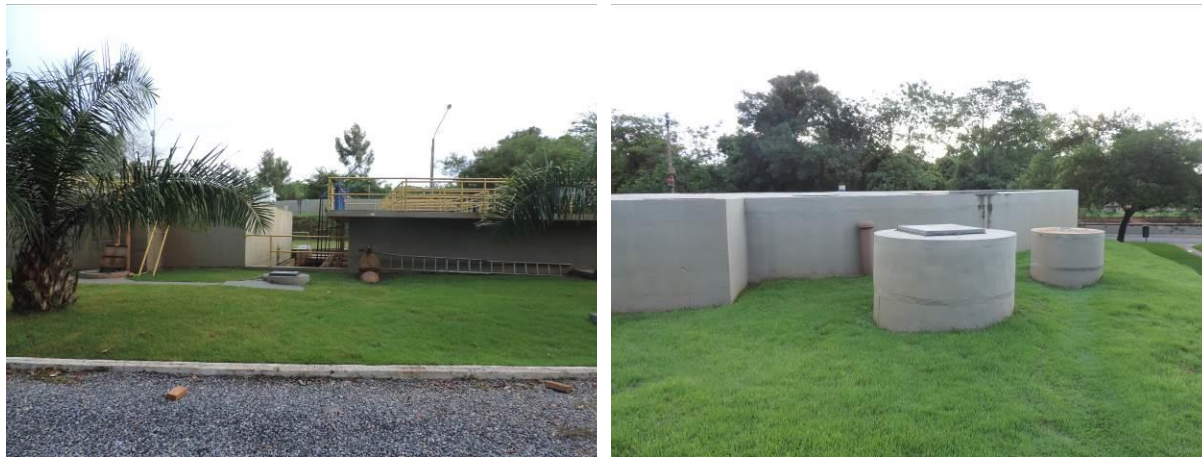
Figura 11: Vista geral da EERL da ETE Bonito, Bonito, MS.

A EERL da ETE Bonito localiza-se pátio da ETE Bonito, coordenadas geográficas UTM (21 K) 555.600 E / 7.663.886 S, com função de bombear o lodo descartado do RALF para os leitos de secagem. Encontra-se completamente cercada por muros, cercas e grades com portão e trancas (Figura 11). Não possui informação sobre extravasor.