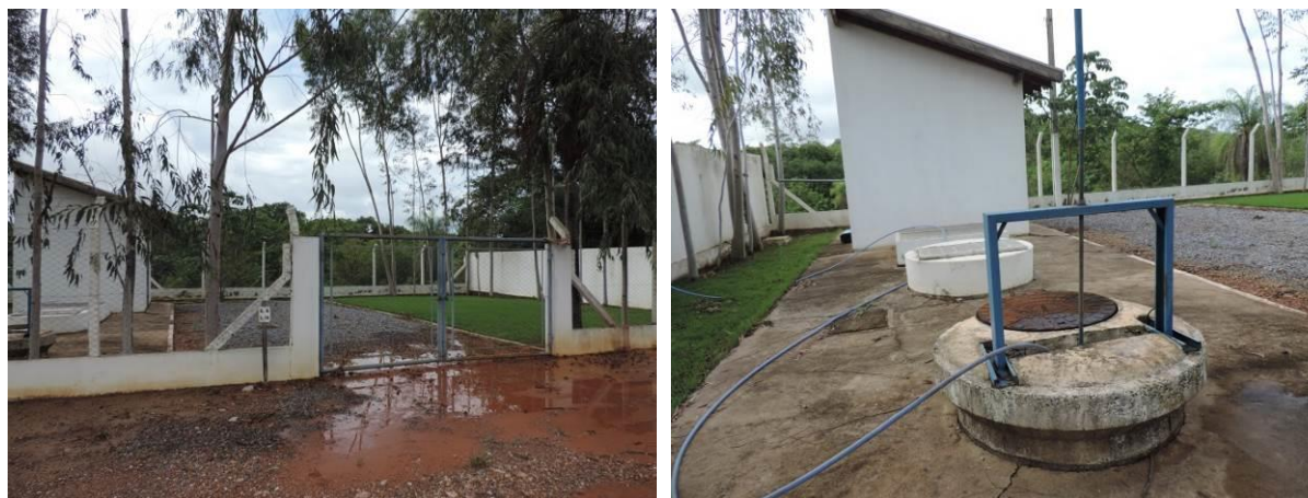
Figura 8: Vista geral da EEEB Tarumã I, Bonito, MS.

A EEEB Tarumã I, de acordo com o Sistema Interativo de Suporte ao Licenciamento Ambiental (SISLA) de MS, não se sobrepõe a nenhuma Unidade de Conservação ou Zonas de Amortecimento, nem a Terras Indígenas, Áreas de Perambulação, Quilombolas e Assentamentos Rurais.