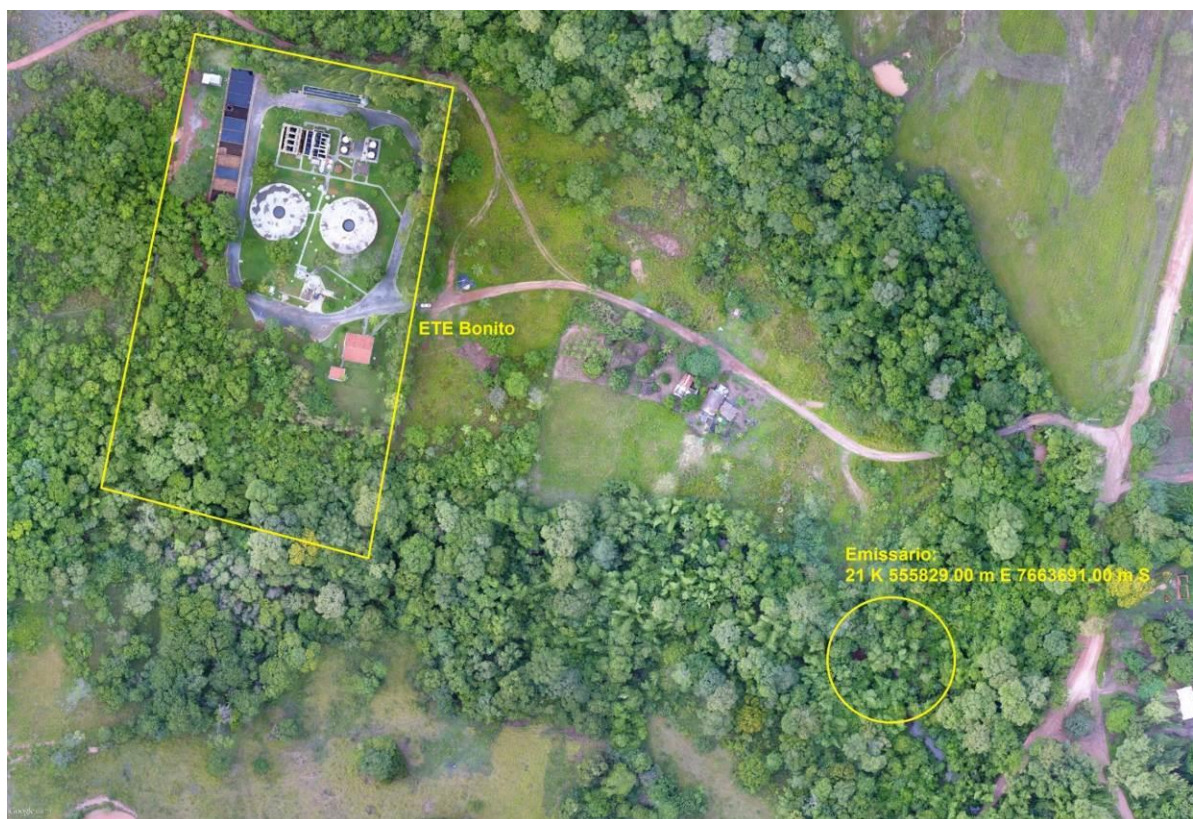
Figura 3: Vista aérea da ETE Bonito e entorno, Bonito, MS.

A ETE Bonito, de acordo com o Sistema Interativo de Suporte ao Licenciamento Ambiental (SISLA) de MS, não se sobrepõe a nenhuma Unidade de Conservação ou Zonas de Amortecimento, nem a Terras Indígenas, Áreas de Perambulação, Quilombolas e Assentamentos Rurais (Figura 4).