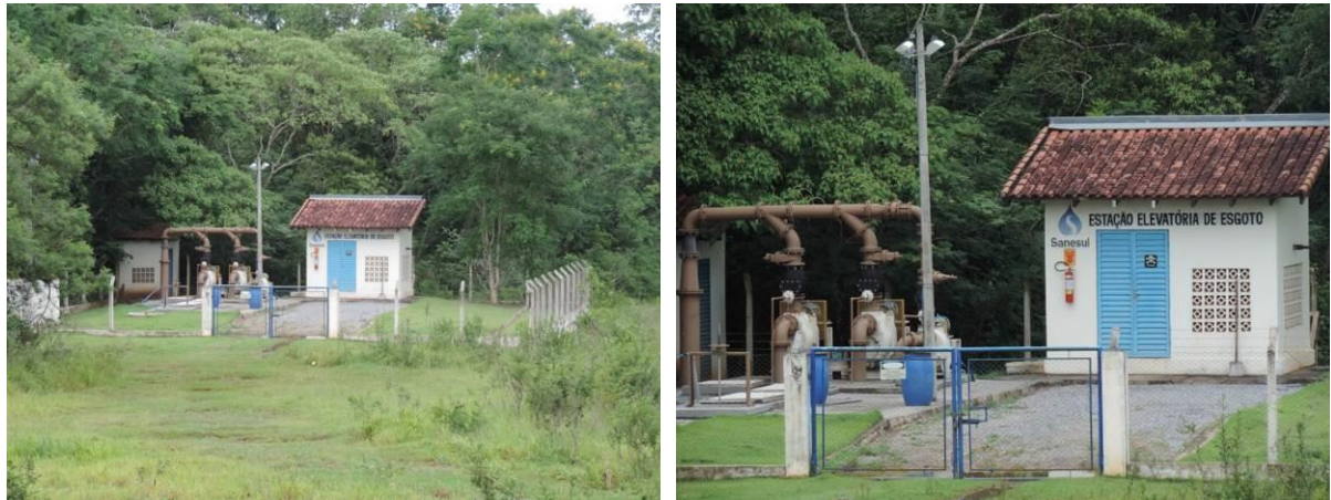
Figura 6: Vista geral da EEEB Final, Bonito, MS.

A EEEB Final, de acordo com o Sistema Interativo de Suporte ao Licenciamento Ambiental (SISLA) de MS, não se sobrepõe a nenhuma Unidade de Conservação ou Zonas de Amortecimento, nem a Terras Indígenas, Áreas de Perambulação, Quilombolas e Assentamentos Rurais.