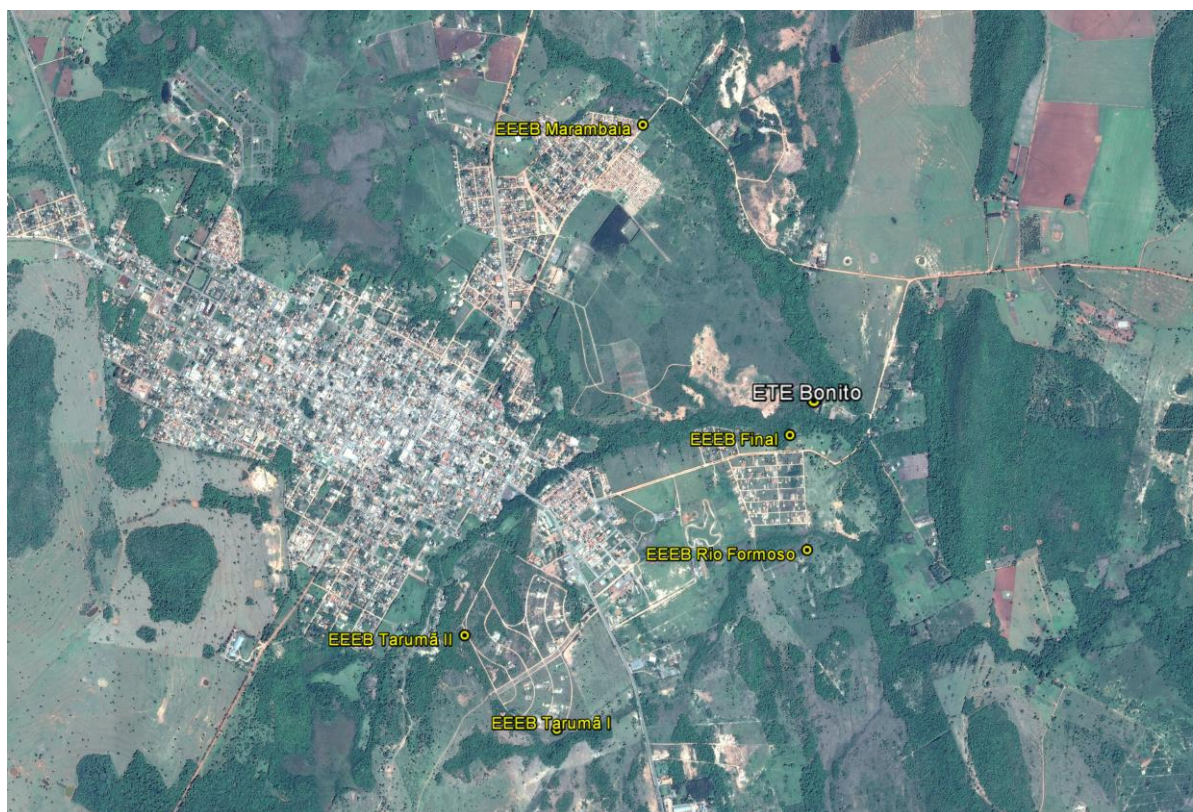
Figura 1: Localização das Unidades Operacionais existentes e projetadas na cidade de Bonito, MS.

A cidade de Bonito possui uma Estação de Tratamento de Esgotos (ETE) e cinco Estações Elevatórias de Esgoto Bruto (EEEB), todas em operação. Não possui Unidades Operacionais projetadas (Figura 1).