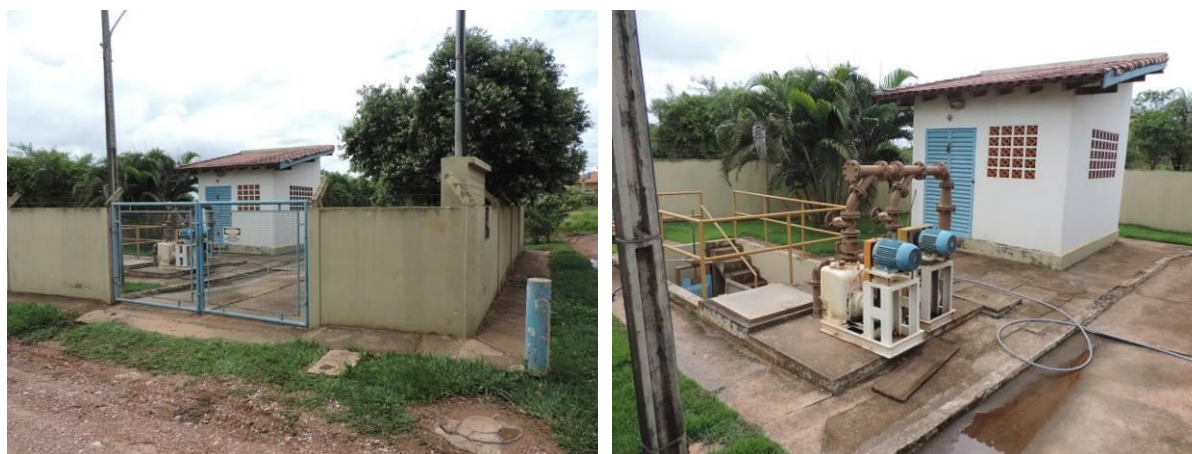
Figura 5: Vista geral da EEEB Marambaia, Bonito, MS.

A EEEB Marambaia localiza-se na zona urbana de Bonito na Rua Cândido Luiz Braga esquina com a Rua Zanuncio Alves, Bairro Marambaia (Che Roga Mi), coordenadas geográficas UTM (21 K) 554.584 E / 7.665.522 S com a função de bombeamento do esgoto bruto. Encontra-se totalmente cercada com muros e grades, apresenta árvores ornamentais em seu interior (Figura 5). Não possui informação sobre extravasor.