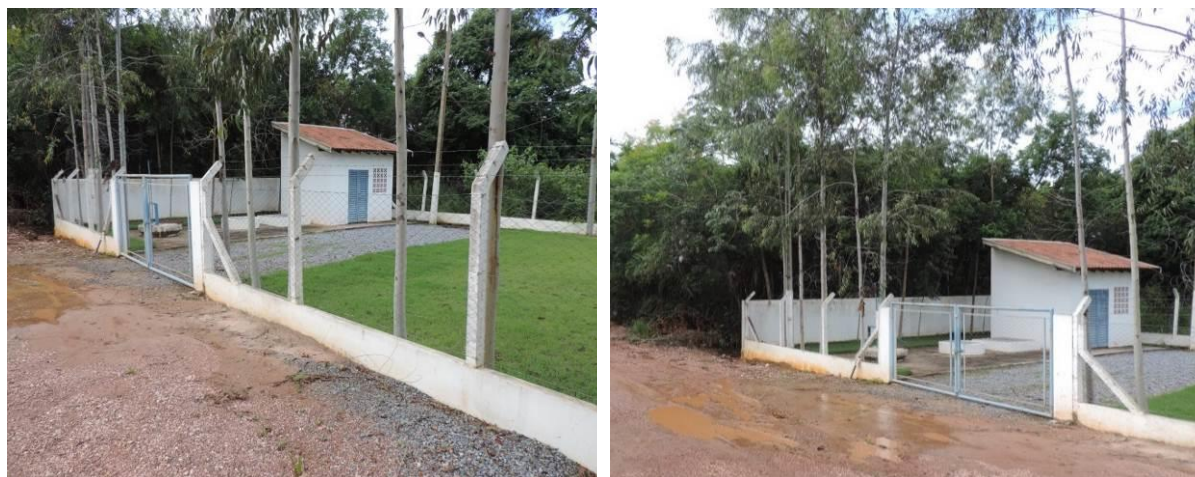
Figura 10: Vista geral da EEEB Tarumã II, Bonito, MS.

A EEEB Tarumã II, de acordo com o Sistema Interativo de Suporte ao Licenciamento Ambiental (SISLA) de MS, não se sobrepõe a nenhuma Unidade de Conservação ou Zonas de Amortecimento, nem a Terras Indígenas, Áreas de Perambulação, Quilombolas e Assentamentos Rurais.