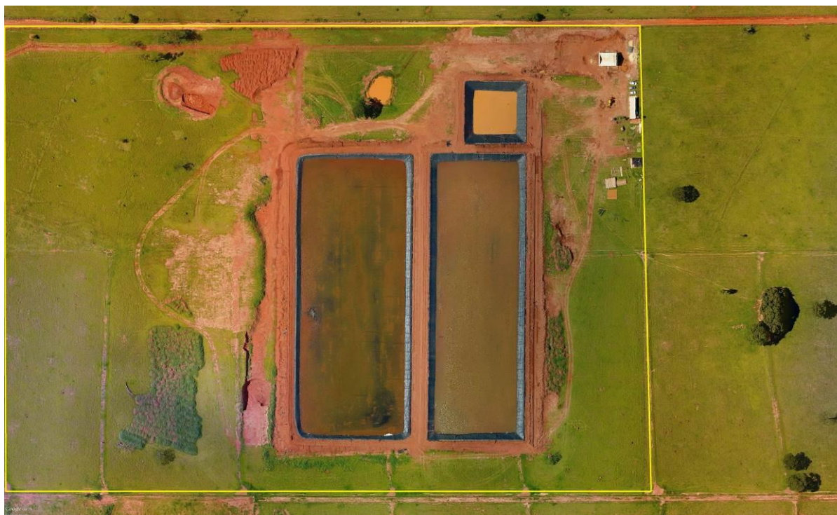
Figura 2: Vista aérea da ETE Batayporã em implantação, Batayporã, MS.

A ETE Batayporã em implantação está localizada na zona rural do município a oeste do perímetro urbano, no Sítio São Mateus, a cerca de 500 metros do corpo receptor, nas coordenadas geográficas UTM (22K) 264.207 E / 7.530.995 S (Figuras 2 e 3).