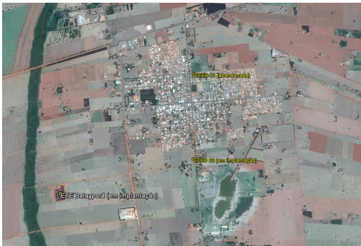
Figura 1: Localização das Unidades Operacionais existentes e projetadas na cidade de Batayporã, MS.

A cidade de Batayporã possui uma Estação de Tratamento de Esgoto (ETE) e uma Estação Elevatória de Esgoto Bruto (EEEB), ambas em implantação. Possui, ainda, uma Estação Elevatória de Esgoto Bruto (EEEB) implantada, mas não em operação (Figura 1). Não possui Unidades Operacionais projetadas.