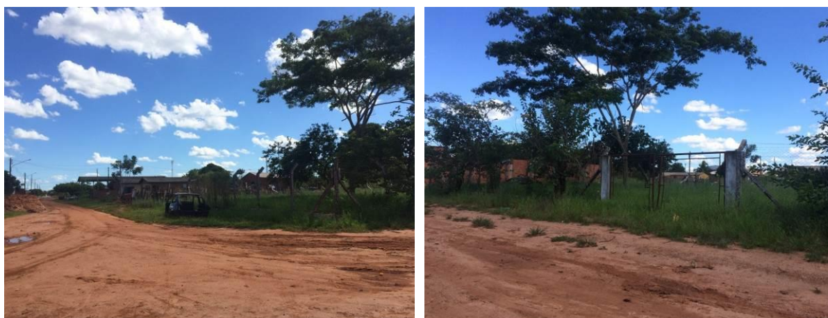
Figura 5: Vista geral da EEEB 001, Batayporã, MS.

A EEEB 001, de acordo com o Sistema Interativo de Suporte ao Licenciamento Ambiental (SISLA) de MS, não se sobrepõe a nenhuma Unidade de Conservação ou Zonas de Amortecimento, nem a Terras Indígenas, Áreas de Perambulação, Quilombolas e Assentamentos Rurais.