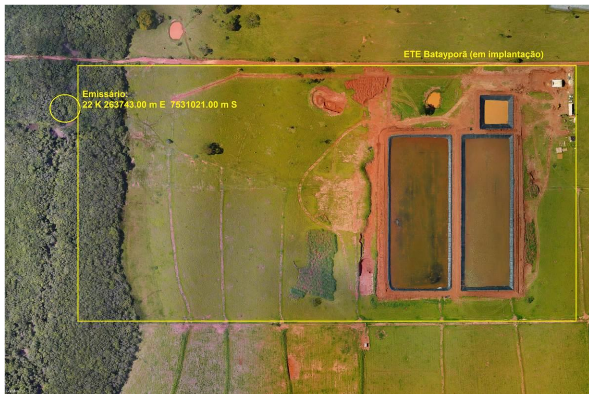
Figura 3: Vista aérea da ETE Batayporã em implantação e entorno, Batayporã, MS.

A ETE Batayporã em implantação, de acordo com o Sistema Interativo de Suporte ao Licenciamento Ambiental (SISLA) de MS, não se sobrepõe a nenhuma Unidade de Conservação ou Zonas de Amortecimento, nem a Terras Indígenas, Áreas de Perambulação, Quilombolas e Assentamentos Rurais (Figura 4 Erro! Fonte de referência não encontrada. ).