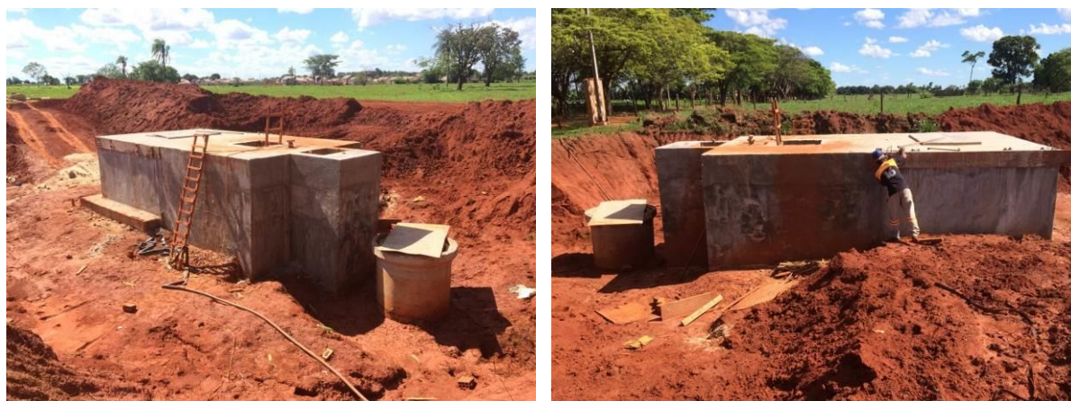
Figura 6: Vista geral da EEEB 002 em implantação, Batayporã, MS.