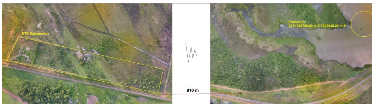
Figura 3: Vista aérea da ETE Bataguassu e entorno, Bataguassu, MS.

A ETE Bataguassu, de acordo com o Sistema Interativo de Suporte ao Licenciamento Ambiental (SISLA) de MS, não se sobrepõe a nenhuma Unidade de Conservação ou Zonas de Amortecimento, nem a Terras Indígenas, Áreas de Perambulação, Quilombolas e Assentamentos Rurais (Figura 4).