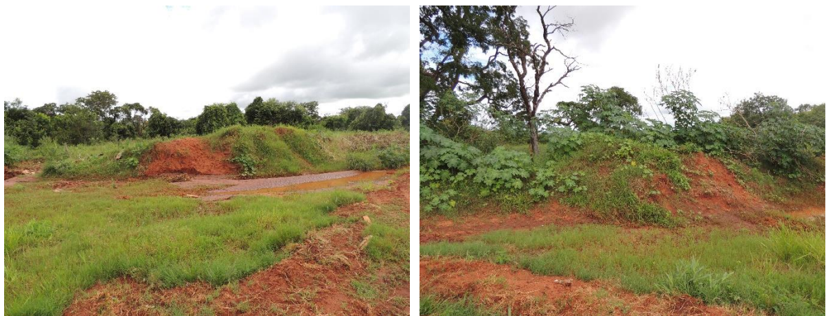
Figura 5: Vista geral da área prevista da EEEB 002 Projetada, Bataguassu, MS.

A EEEB 002 Projetada será localizada na Rua Sete s/n, coordenadas geográficas UTM (22 K) 352.723 E / 7.599.223 S, terá como função recalcar o esgoto afluyente para a ETE Bataguassu. A área é recoberta por gramíneas e vegetação arbustiva (Figura 5). Não possui informação sobre extravasor.