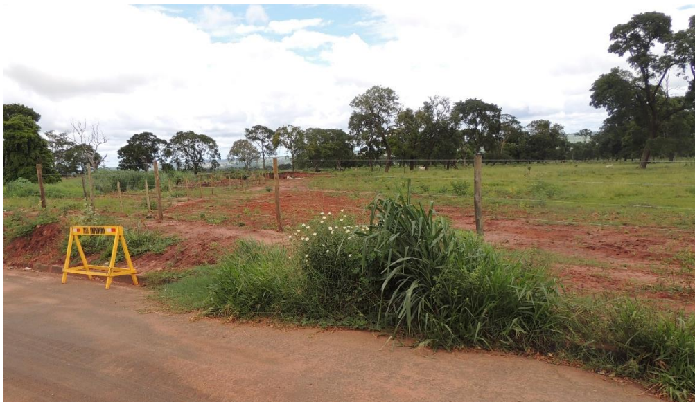
Figura 8: Solo exposto na área da EEEB 005 Projetada, Bataguassu, MS.

Foi identificado início de processo erosivo na área selecionada para implantação da EEEB 005 Projetada, onde pequenas porções do terreno apresentam solo exposto (Figura 8).