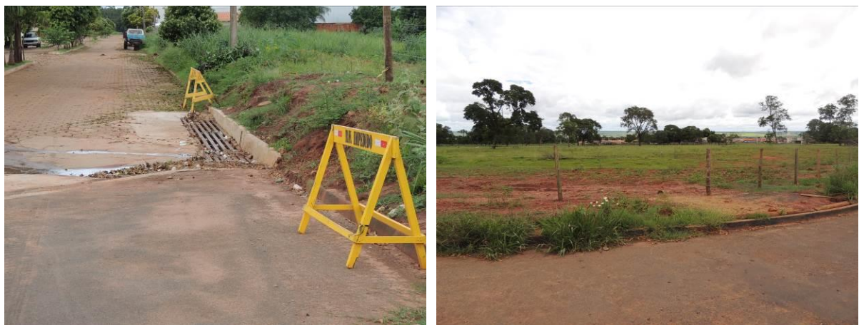
Figura 7: Vista geral da área prevista para a EEEB 005 Projetada, Bataguassu, MS.

A EEEB 005 Projetada será localizada na esquina da Rua Copacabana com a Av. Camboriú, coordenadas geográficas UTM (22 K) 352.005 E / 7.598.439 S, terá como função recalcar o esgoto bruto até a ETE Bataguassu. A área é recoberta por gramíneas (Figura 7). Não possui informação sobre extravasor.