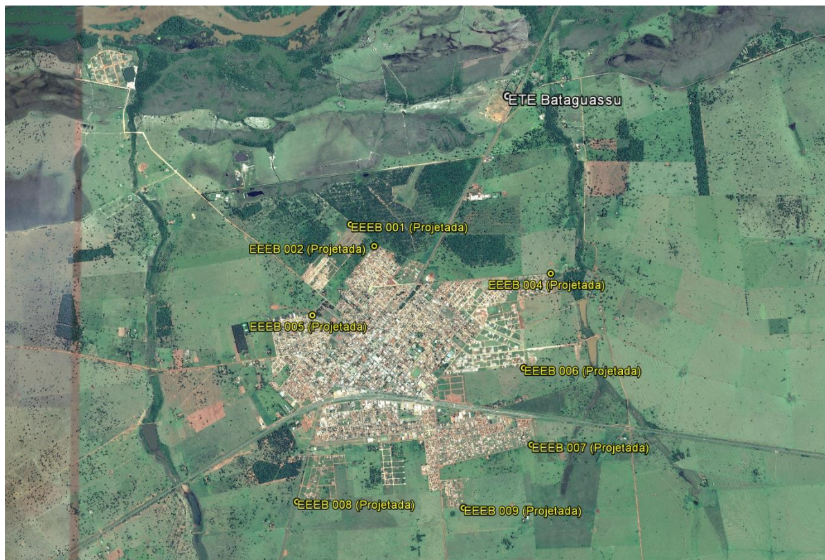
Figura 1: Localização das Unidades Operacionais existentes e projetadas na cidade de Bataguassu, MS.

A cidade de Bataguassu possui uma Estação de Tratamento de Esgotos (ETE) em operação e nove Estações Elevatórias de Esgoto Bruto (EEEB) projetadas (Figura 1).