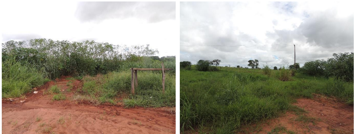
Figura 6: Vista geral da área prevista da EEEB 004 Projetada, Bataguassu, MS.

A EEEB 004 Projetada será localizada nas coordenadas geográficas UTM (22 K) 354.759 E / 7.598.929 S, terá como função recalcar o esgoto bruto até a ETE Bataguassu (Figura 6). Não possui informação sobre extravasor.