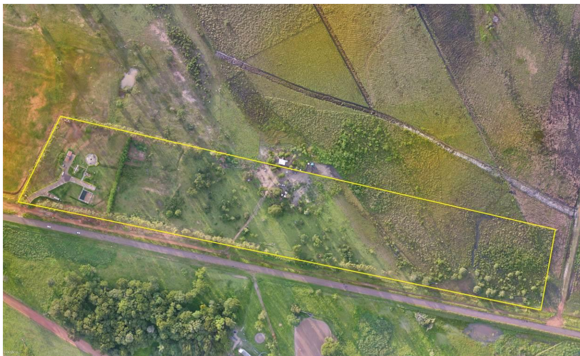
Figura 2: Vista aérea da ETE Bataguassu, Bataguassu, MS.

pedestres. Apresenta árvores esparsas em seu interior e cortina arbórea (Figuras 2 e 3).