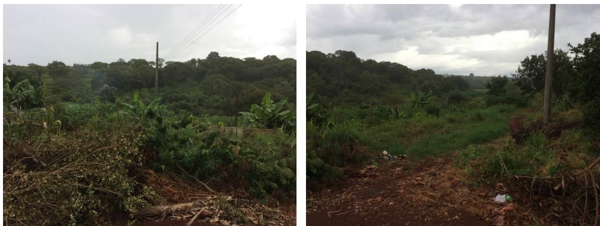
Figura 6: Área prevista para implantação da EEEB 003 Projetada, Aral Moreira, MS.

A EEEB 003 Projetada, elevatória com função de recalque do esgoto bruto para a ETE Aral Moreira, será implantada na Rua Ataliba dos Santos, coordenadas geográficas UTM (21 K) 640.865 E / 7.462.504 S (Figura 6).