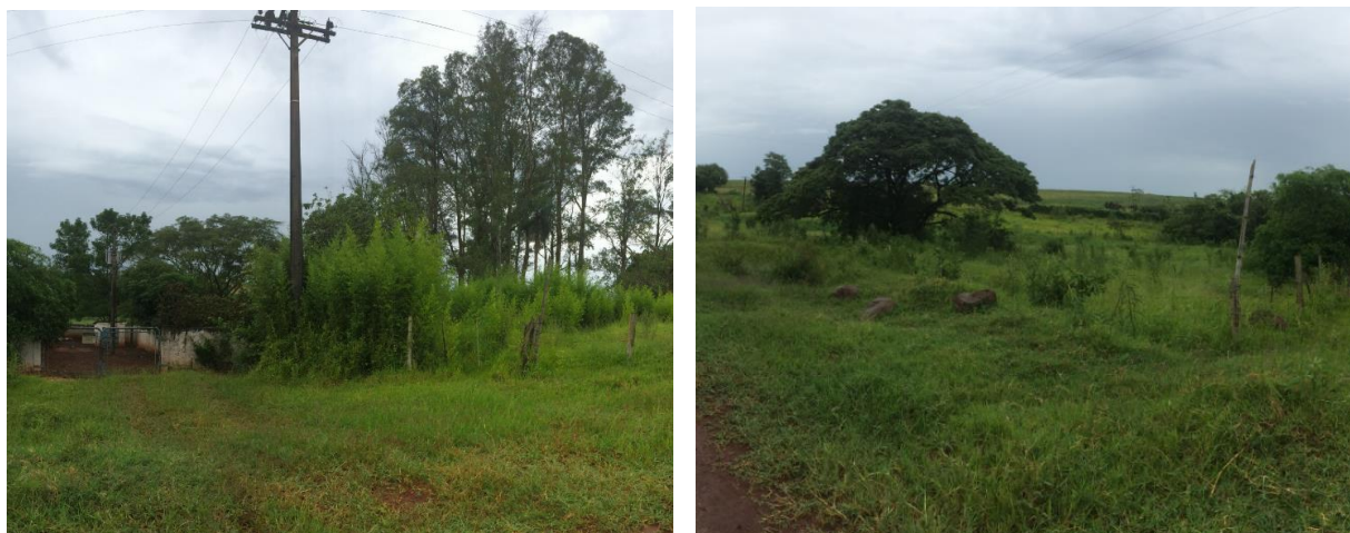
Figura 5: Área prevista para implantação da EEEB 002 Projetada, Aral Moreira, MS.

A EEEB 002 Projetada, elevatória com função de recalque do esgoto bruto para a ETE Aral Moreira, será implantada no prolongamento da Rua Treze de Maio, coordenadas geográficas UTM (21 K) 639.943 E / 7.461.910 S (Figura 5).