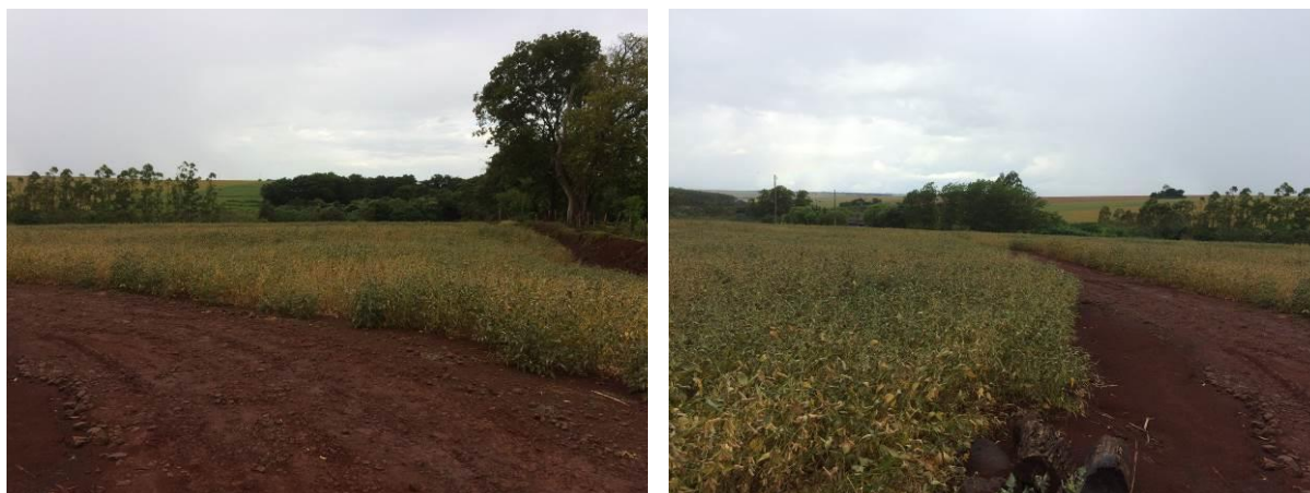
Figura 4: Área prevista para implantação da EEEB 001 Projetada, Aral Moreira, MS.

A EEEB 001 Projetada, elevatória com função de recalque do esgoto bruto para a ETE Aral Moreira, será implantada no prolongamento da Rua Manoel Alves de Oliveira, S/N, coordenadas geográficas UTM (21 K) 641.632 E / 7.460.539 S (Figura 4).