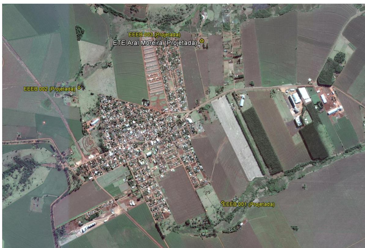
Figura 1: Localização das Unidades Operacionais existentes e projetadas na cidade de Aral Moreira, MS.

A cidade de Aral Moreira possui uma Estação de Tratamento de Esgotos (ETE) em implantação e três Estações Elevatórias de Esgoto Bruto (EEEB) projetadas (Erro! Fonte de referência não encontrada.).