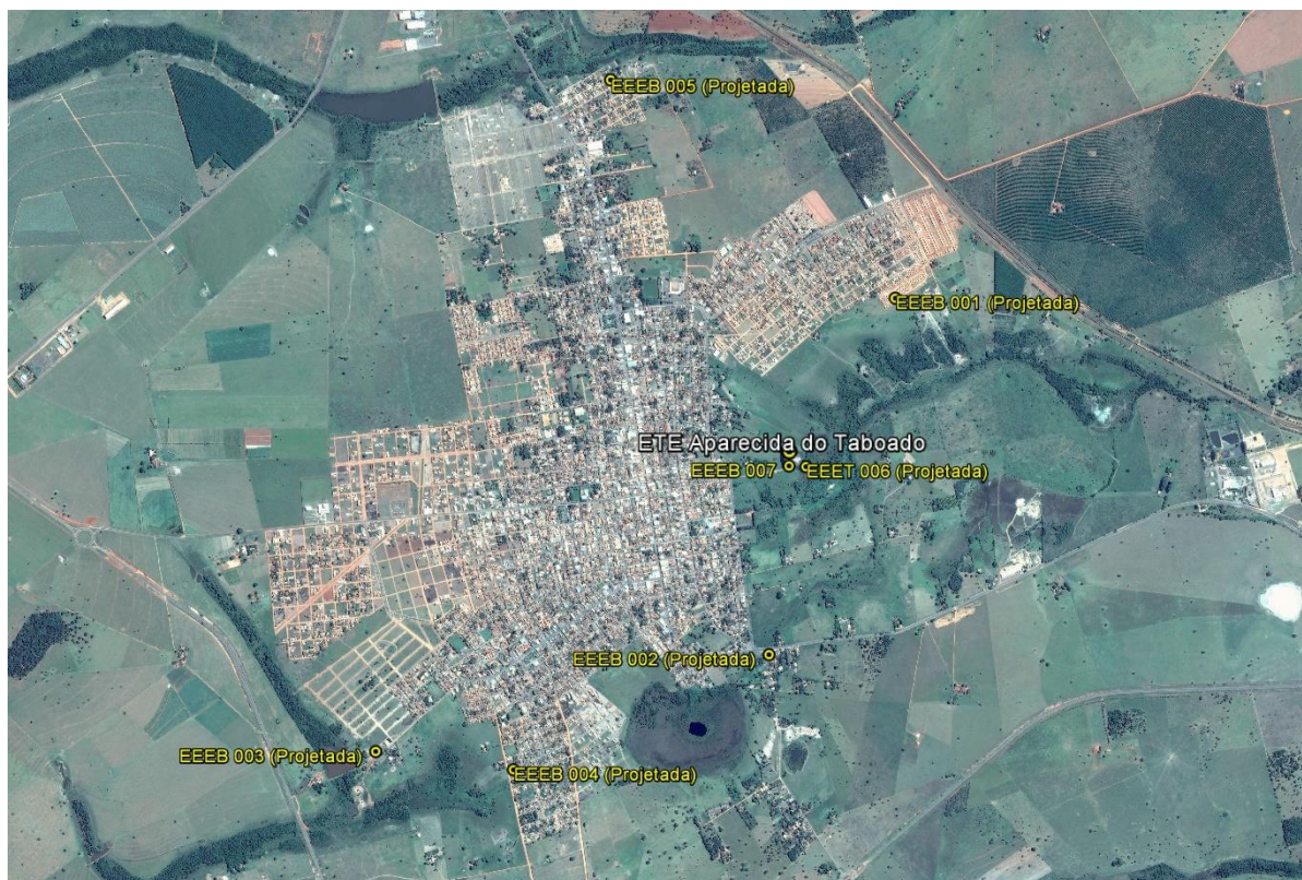
Figura 1: Localização das Unidades Operacionais existentes e projetadas na cidade de Aparecida do Taboado, MS.

A cidade de Aparecida do Taboado possui uma Estação de Tratamento de Esgotos (ETE) e uma Estação Elevatória de Esgoto Bruto (EEEB), ambas em operação. Possui, ainda, áreas selecionadas para a implantação de cinco Estações Elevatórias de Esgoto Bruto (EEEB) projetadas (Figura 1 Erro! Fonte de referência não encontrada.).