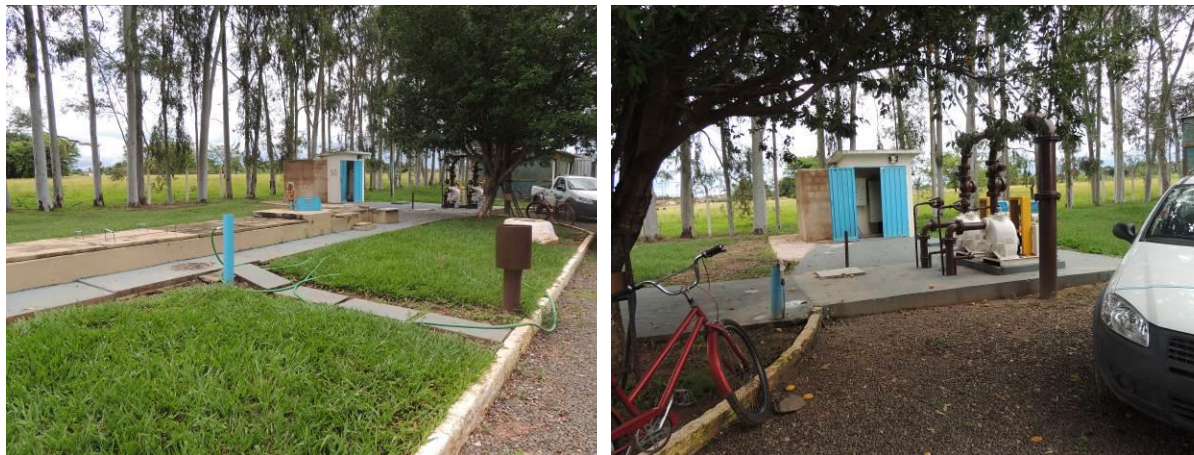
Figura 5: Vista geral da EEEB 007, Aparecida do Taboado, MS.

A EEEB 007, de acordo com o Sistema Interativo de Suporte ao Licenciamento Ambiental (SISLA) de MS, não se sobrepõe a nenhuma Unidade de Conservação ou Zonas de Amortecimento, nem a Terras Indígenas, Áreas de Perambulação, Quilombolas e Assentamentos Rurais.