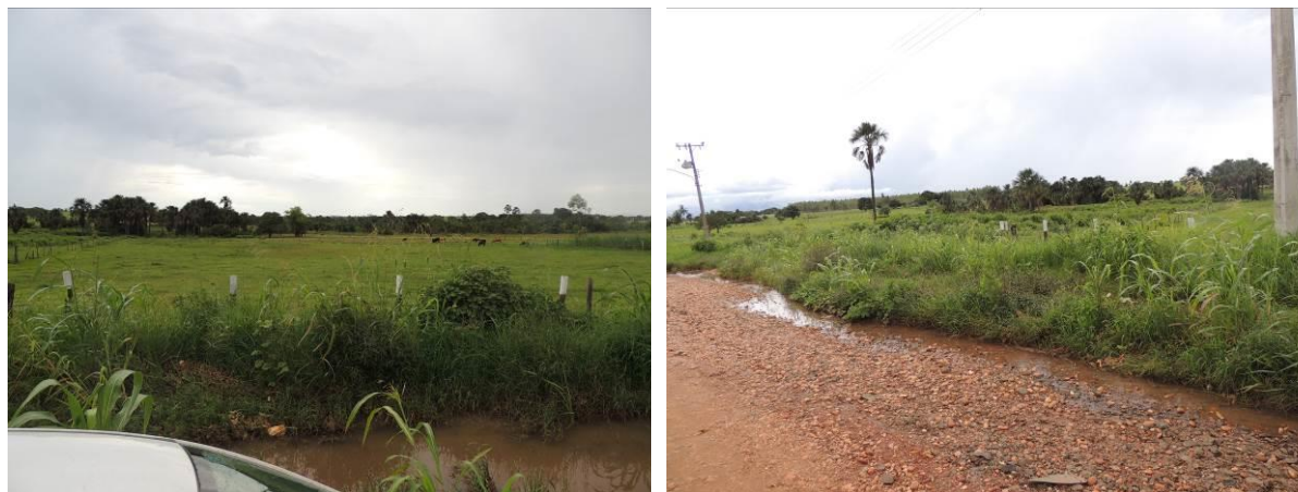
Figura 6: Área prevista para implantação da EEEB 001 Projetada, Aparecida do Taboado, MS.

A EEEB 001 Projetada será implantada na zona urbana de Aparecida do Taboado, na Alameda Orquídea, coordenadas geográficas UTM (22 K) 491.224 E / 7.780.170 S (Figura 7).