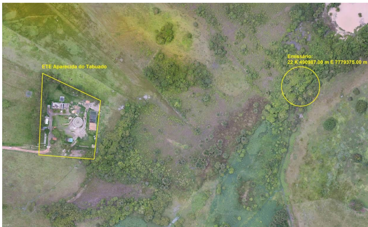
Figura 3: Vista aérea da ETE Aparecida do Taboado e entorno, Aparecida do Taboado, MS.

A ETE Aparecida do Taboado, de acordo com o Sistema Interativo de Suporte ao Licenciamento Ambiental (SISLA) de MS, não se sobrepõe a nenhuma Unidade de Conservação ou Zonas de Amortecimento, nem a Terras Indígenas, Áreas de Perambulação, Quilombolas e Assentamentos Rurais (Figura 4).