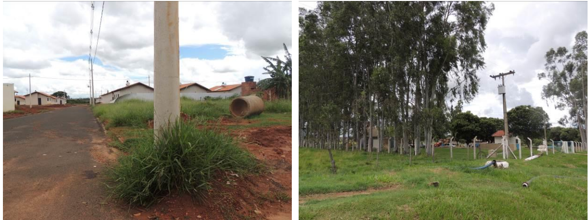
Figura 8: Área prevista para implantação da EEEB 003 Projetada, Aparecida do Taboado, MS.

A EEEB 003 Projetada, de acordo com o Sistema Interativo de Suporte ao Licenciamento Ambiental (SISLA) de MS, não se sobrepõe a nenhuma Unidade de Conservação ou Zonas de Amortecimento, nem a Terras Indígenas, Áreas de Perambulação, Quilombolas e Assentamentos Rurais.