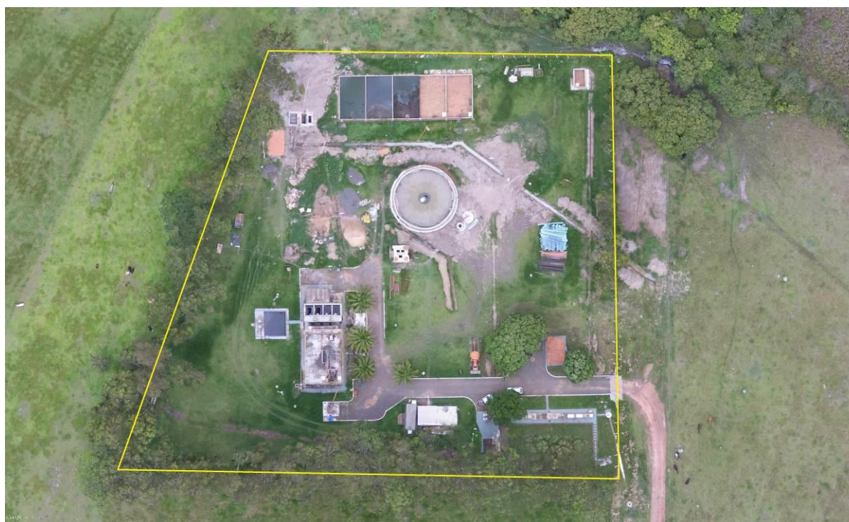
Figura 2: Vista aérea da ETE Aparecida do Taboado, Aparecida do Taboado, MS.

A ETE Aparecida do Taboado está localizada na zona urbana de Aparecida do Taboado, com acesso pela Avenida Pedro Pedrossian, coordenadas geográficas UTM (22 K) 490.589 E / 7.779.244 S, distante 300 m do corpo receptor. Encontra-se totalmente cercada com telas e portão com trancas para pedestres, com cortina arbórea (Figuras 2 e 3).