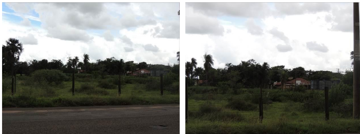
Figura 10: Área prevista para implantação da EEEB 005 Projetada, Aparecida do Taboado, MS.

A EEEB 005 Projetada será implantada na zona urbana de Aparecida do Taboado, na Rua Manoel R. de Castro, coordenadas geográficas UTM (22 K) 489.552 E / 7.781.528 S (Figura 9 Erro! Fonte de referência não encontrada.).