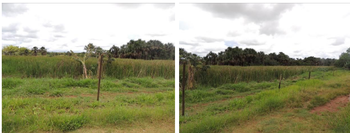
Figura 7: Área prevista para implantação da EEEB 002 Projetada, Aparecida do Taboado, MS.

A EEEB 002 Projetada será implantada na zona urbana de Aparecida do Taboado, na Avenida João Pedro Pedrossian, coordenadas geográficas UTM (22 K) 490.400 E / 7.778.164 S (Figura 8).