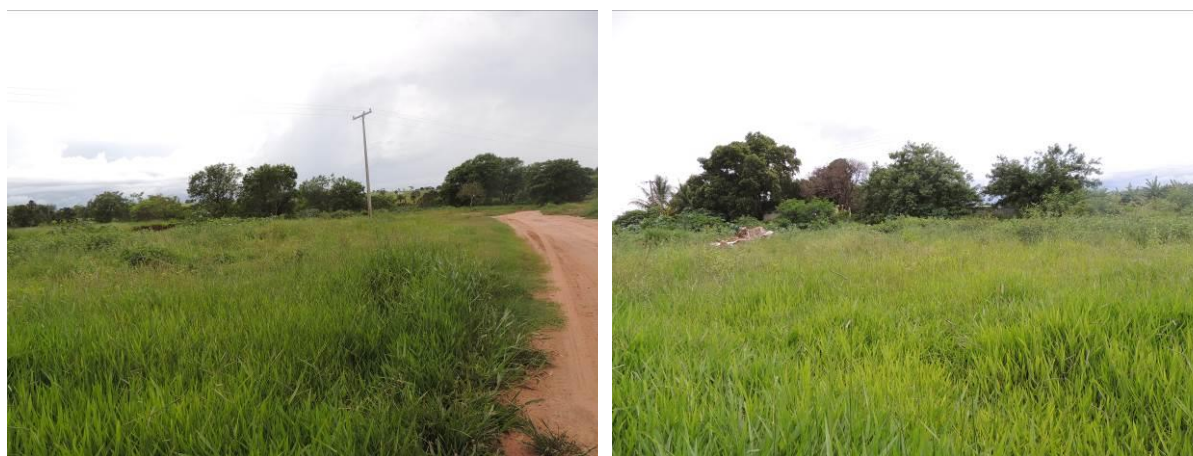
Figura 9: Área prevista para implantação da EEEB 004 Projetada, Aparecida do Taboado, MS.

A EEEB 004 Projetada será implantada na zona urbana de Aparecida do Taboado, na Rua Guanabara com a Avenida Campo Grande, coordenadas geográficas UTM (22 K) 488.954 E / 7.777.375 S (Figura 10).